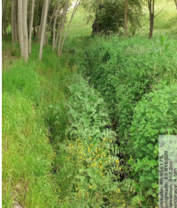
Int. 6.1.4 – Foto 9