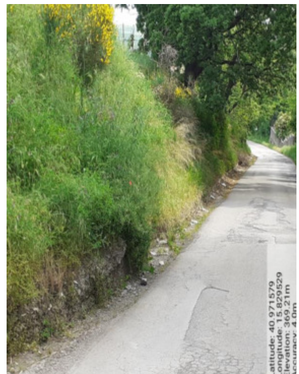
Int. 6.3.6 – Foto 12