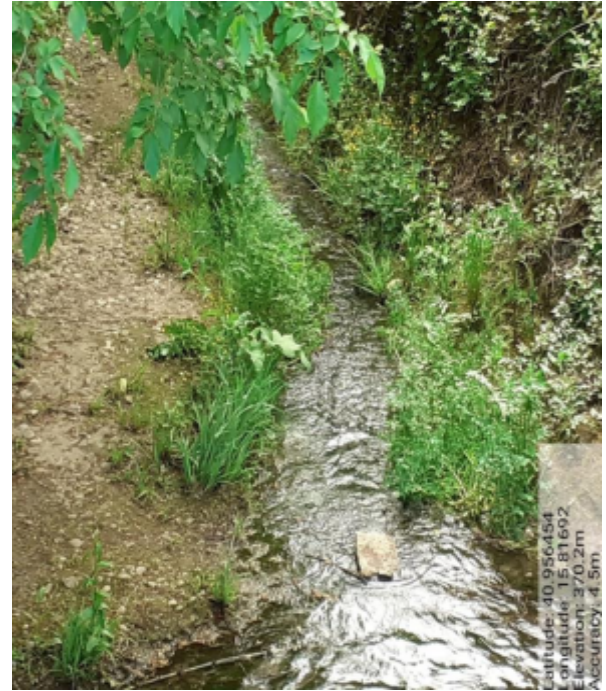
Int. 6.1.4 - Foto 10