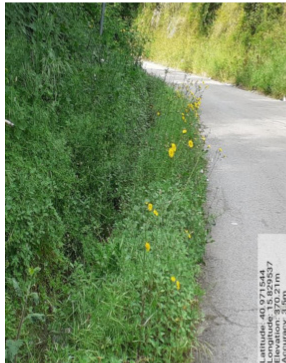
Int. 6.3.8 – Foto 11