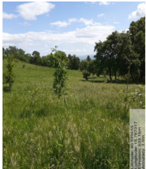
Int. 5.2.1 - Foto 8