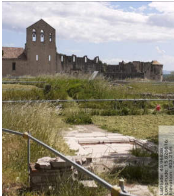
Int.1.1.2 – Foto 2

Latitude: 40.96836 Longitude: 15.826616 Elevation: 403.21m Accuracy: 5.0m