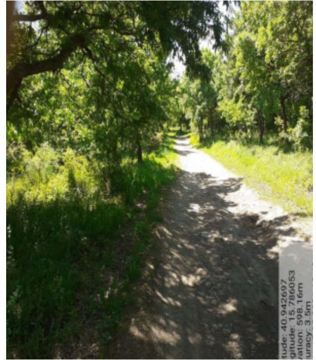
Int. 4.2.1 - Foto 6