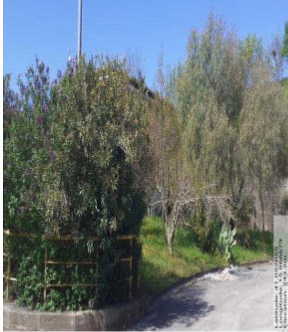
Int.2.1.2 - Foto 5