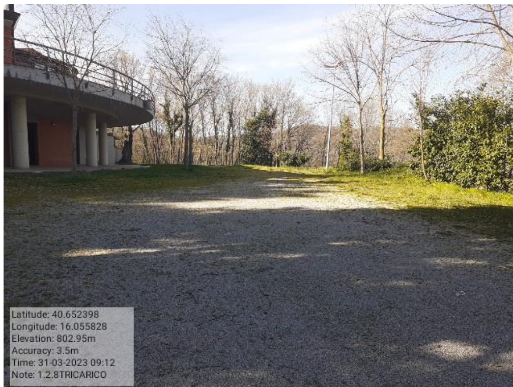
INTERVENTO 1.2.8 - TRICARICO Fg.50 Part.168 Loc.Fonti perimetro Santuario di Fonti Foto n. 13