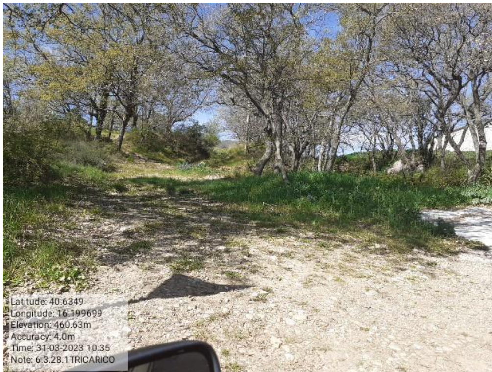
INTERVENTO 6.3.28.- TRICARICO TRATT TRICARICO GRASSANO 2° TRATTO SERRA DEL CEDRO PANTANA FG .56-57 Foto n. 68