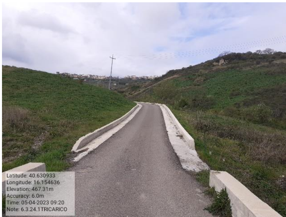
INTERVENTO 6.3.32- TRICARICO STRADA COMUNALE CACCIA NELLA NEBBIA FG.55-56-37-38-48-15