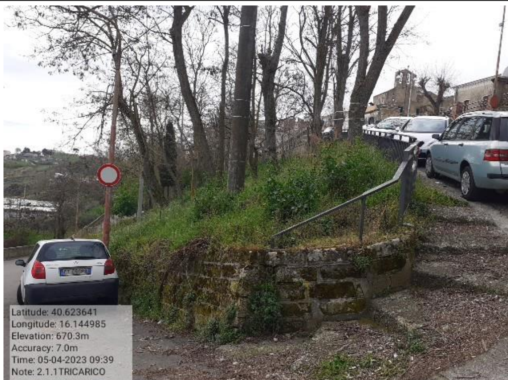
INTERVENTO 2.1.1 - TRICARICO