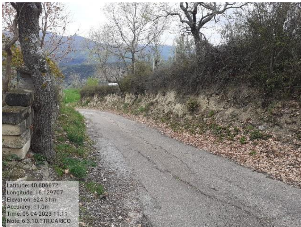
INTERVENTO 6.3.10.1- TRICARICO STRADA COMUNALE MALCANALE 7 FG. 64