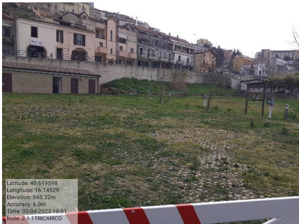
INTERVENTO -2.1.1 TRICARICO