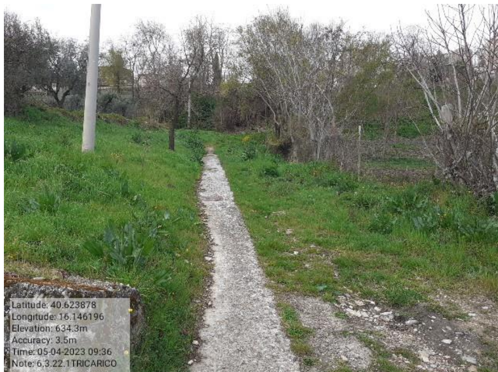
INTERVENTO 6.3.22.- TRICARICO Tricarico Fg61 Strada Comunale della Trinità VICINALE Foto n. 62