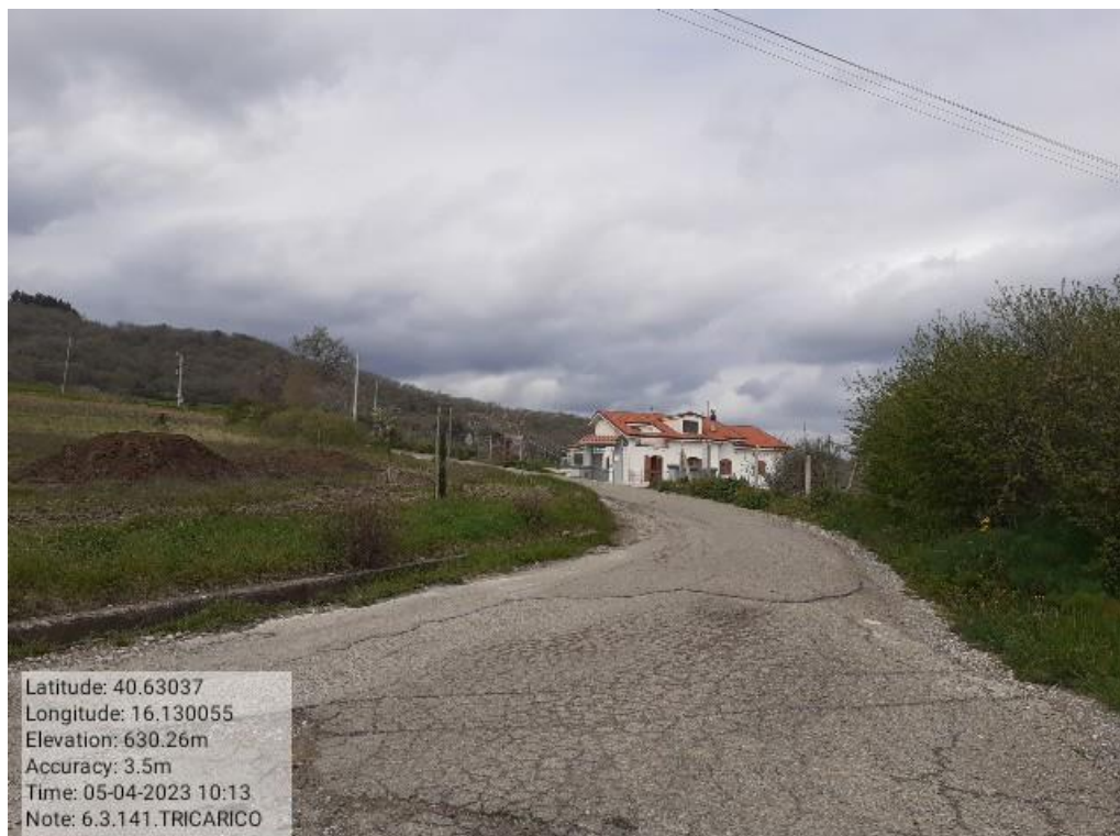
INTERVENTO 6.3.14.- TRICARICO STRADA COMUNALE SANT ANDREA 1 FG. 54/60 Foto n. 53