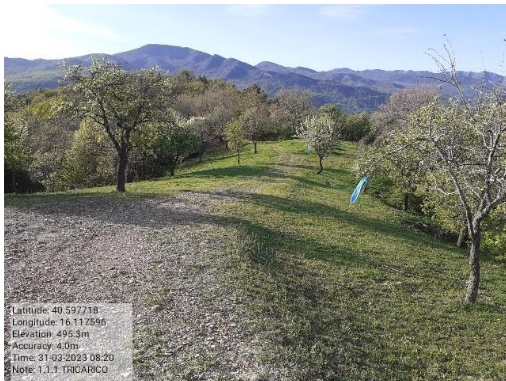
INTERVENTO 1.1.1 - TRICARICO Fg.77 part.22-24- 20-79-133-80 Loc. Mantenera Malcanale Mingo Lavecchia Foto n.1