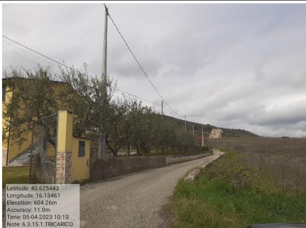
INTERVENTO 6.3.15 - TRICARICO STRADA COMUNALE SANT ANDREA 2 FG. 53/54 Foto n. 54