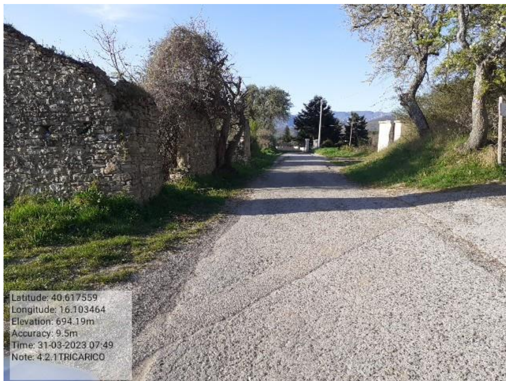
INTERVENTO 4.1.1 - TRICARICO STRADA DI ACCESSO ALLA FORESTA MANTENERAI fg 62 Foto n. 21