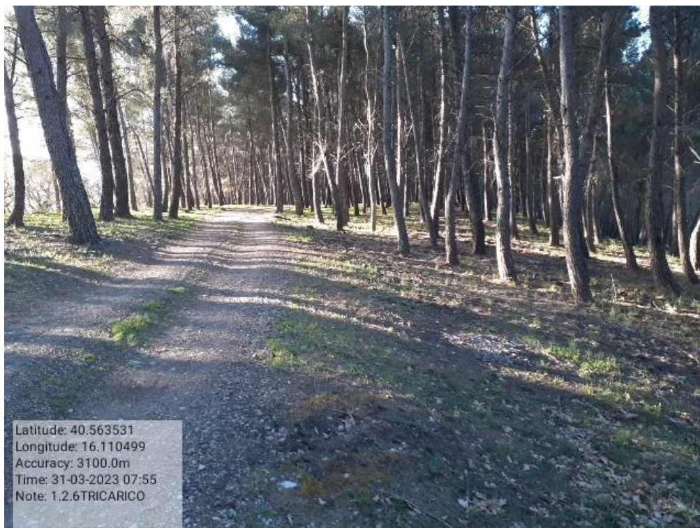
INTERVENTO 1.2.6 - TRICARICFg.62 Part.125-33- 141-272-271 Foresta Mantenera - Capanna Vedetta Foto n.11