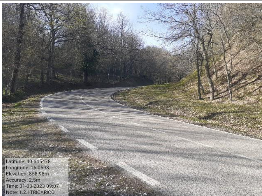
INTERVENTO1.2.1 - TRICARICO