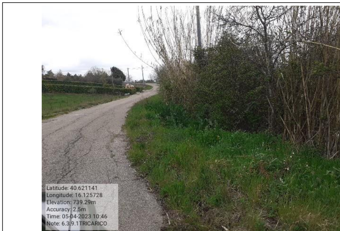
INTERVENTO 6.3.9.1 - TRICARICO STRADA COMUNALE SALUMICIFIO FG 59