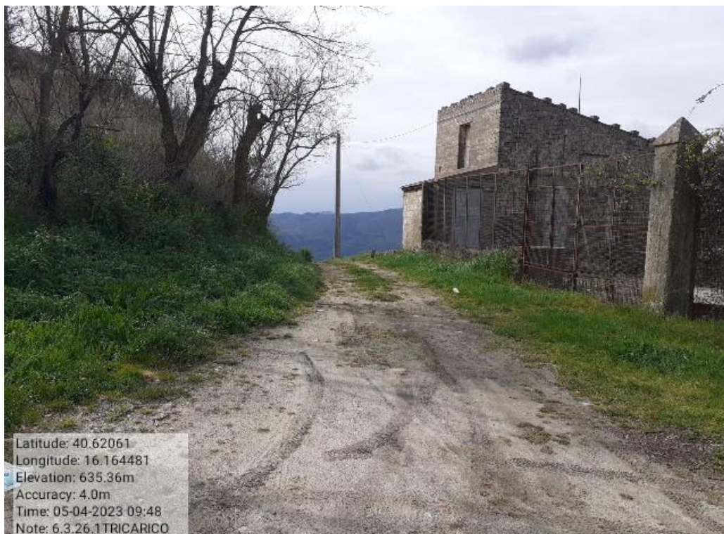
INTERVENTO 6.3.26.- TRICARICO EX COLLEGAMENTO BASENTANA FG.66-67