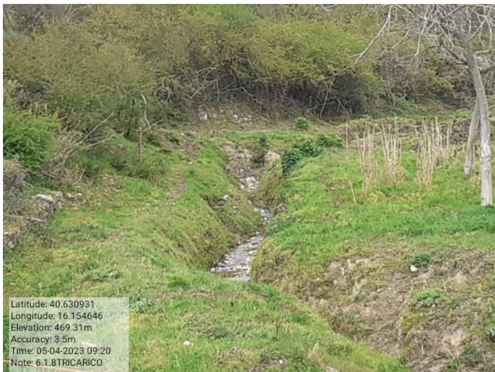
INTERVENTO 6.1.8- TRICARICO Fg. 61 PARTE ACQUA VALLONE CASTAGNONE (AFFLUENTE) Foto n. 37