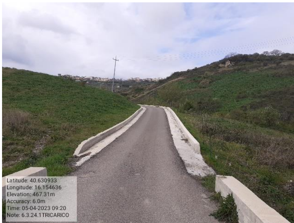
INTERVENTO 6.3.24.- TRICARICO STRADA COMUNALE CASTAGNONE FG.61-48-37 Foto n. 64