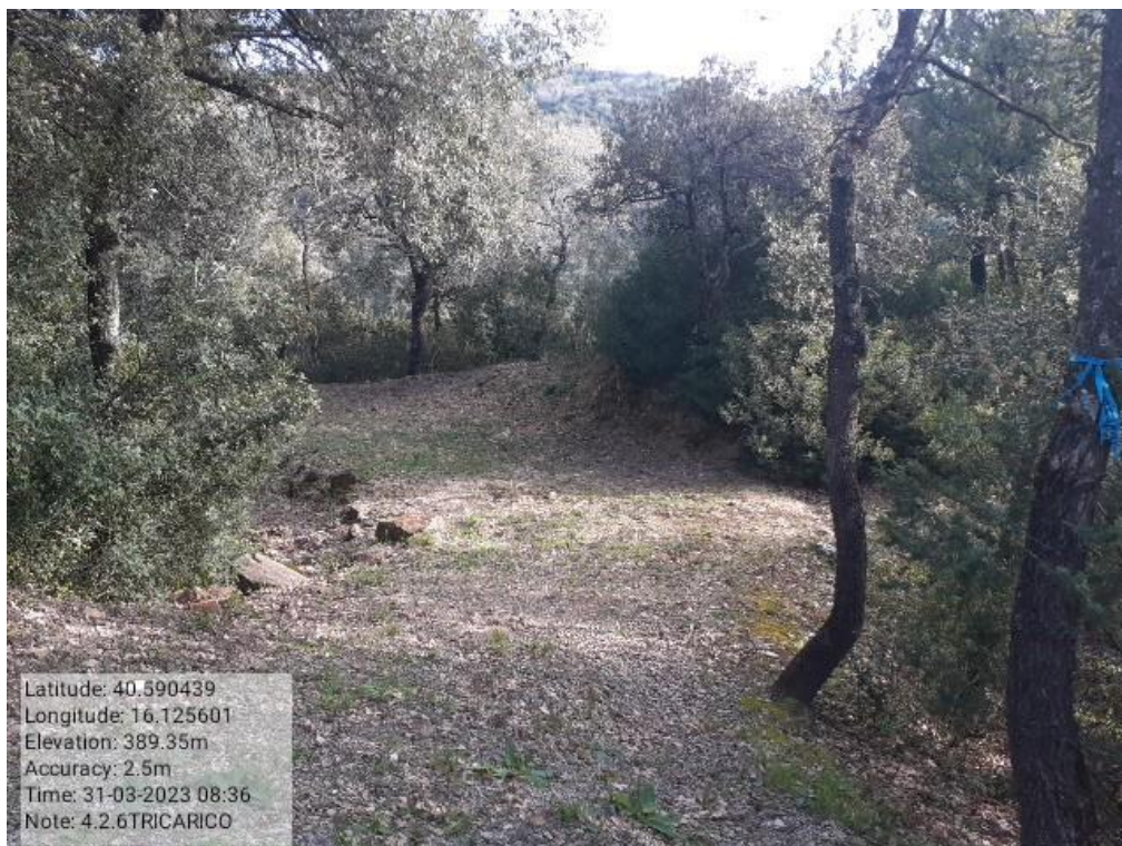
INTERVENTO 4.1.6 - TRICARICO Fg.77 Part. Strade - Pista di Collegamento For mantenera - Zona Malcanale Foto n. 25