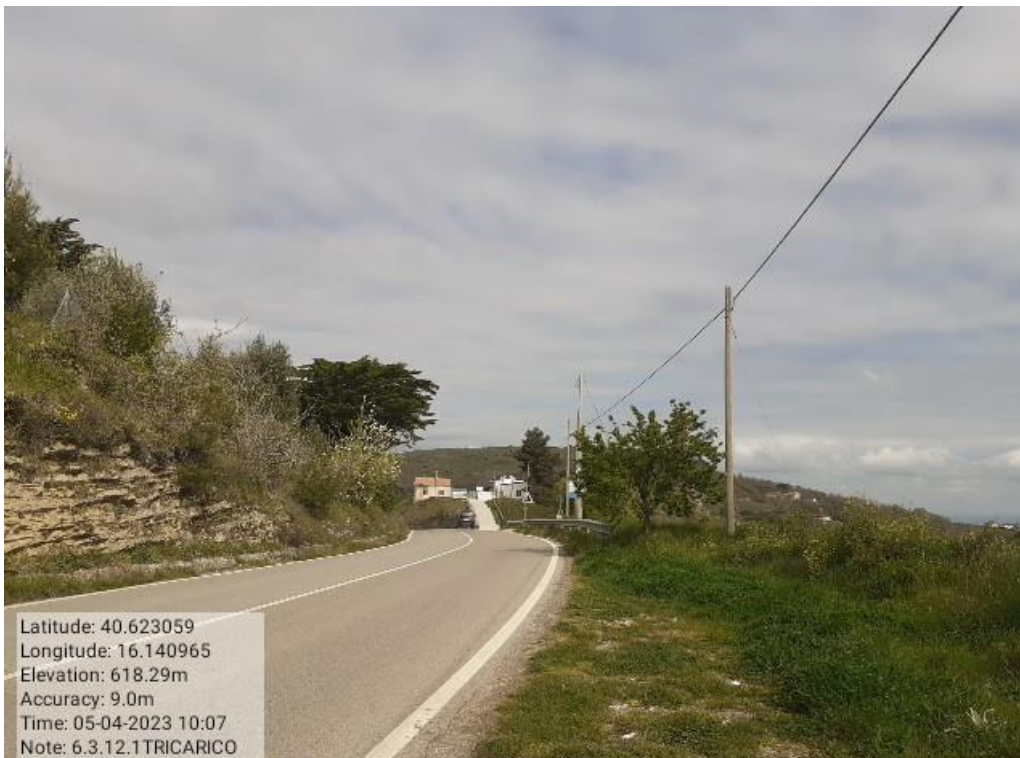
INTERVENTO 6.3.12.1- TRICARICO