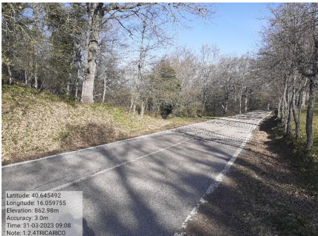
INTERVENTO 1.2.4- TRICARICO Part. Tricarico Fg.50 171 Loc.Trecancelli