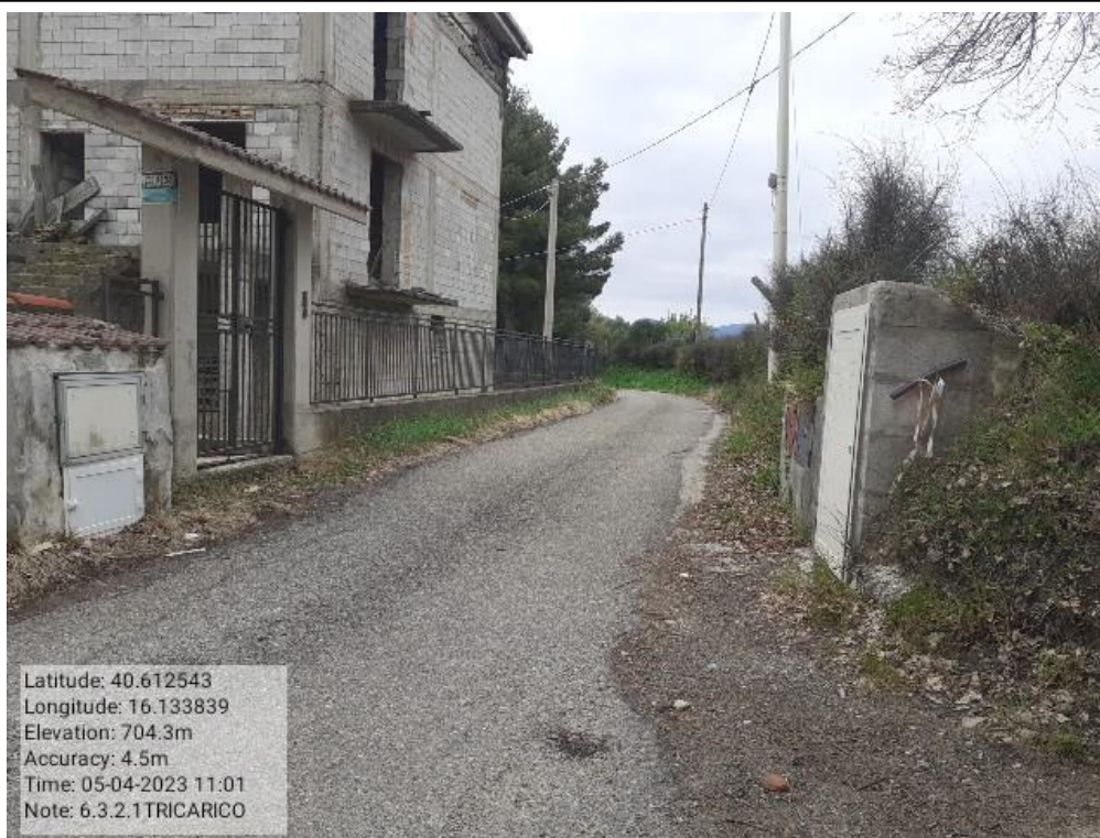
INTERVENTO 6.3.2.1 - TRICARICO STRADA COMUNALE MALCANALE 3 FG. 64