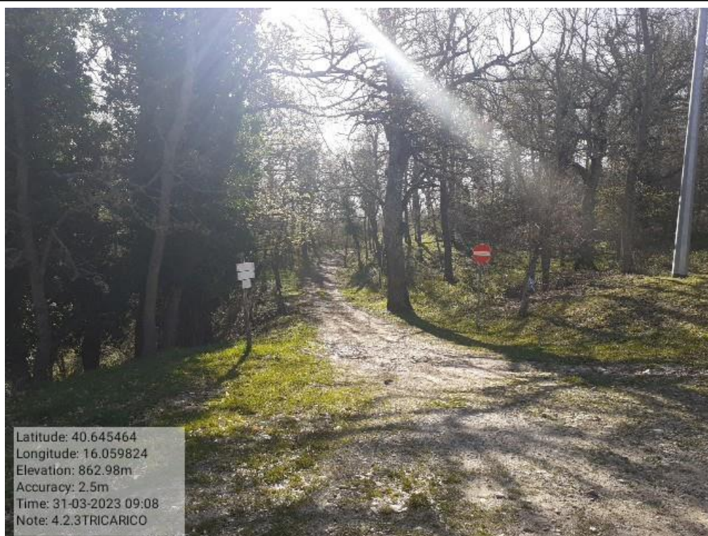
INTERVENTO 1.2.3 - TRICARICO Fg.42 Part.184 - Loc.Trecancelli - Fonti fascia perimetrale al Camping Don Girolamo Foto n. 8