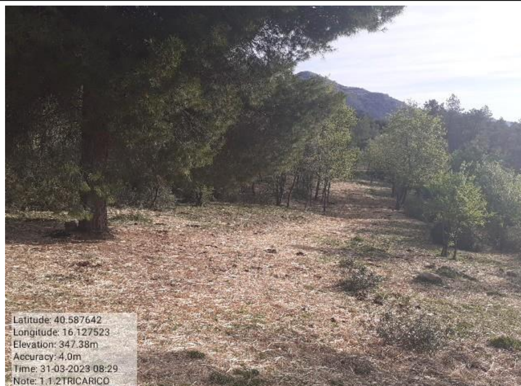
INTERVENTO 1.1.2 - TRICARICO Fg.77 part.32-33- 16-134 Loc Mantenera Malcanale Cugno del Vescovo Foto n. 2