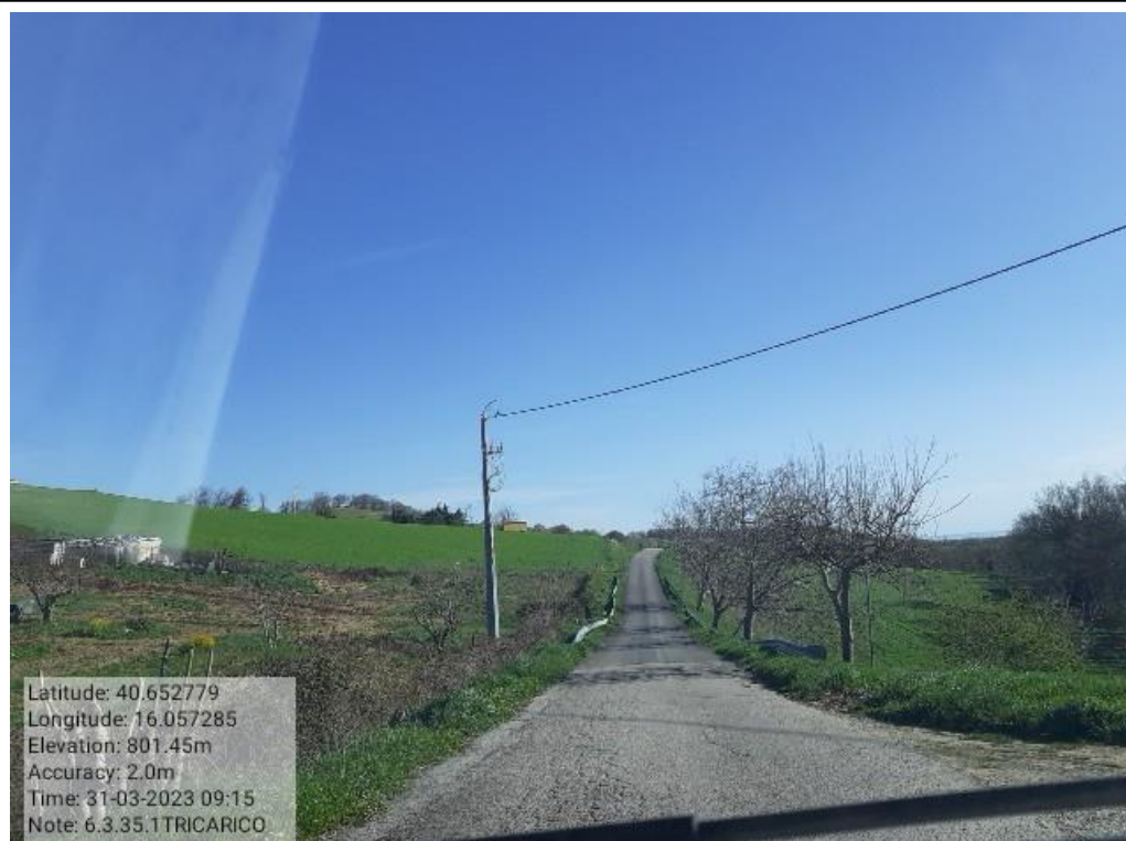
INTERVENTO 6.3.35 - TRICARICO STRADA COMUNALE TRIONTE FG19-19-20-31-32-42 Foto n.75