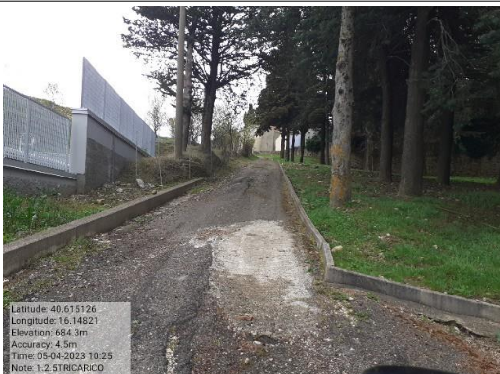
INTERVENTO 1.2.5 - TRICARICO