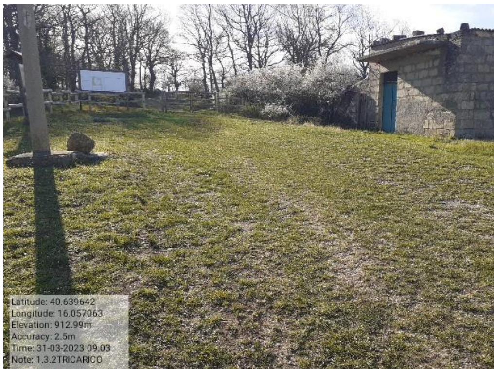
INTERVENTO 1.3.2 - TRICARICO