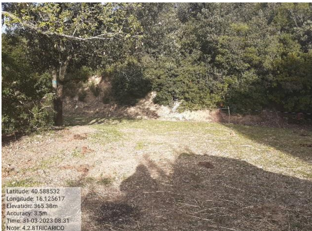
INTERVENTO 4.1.8 . - TRICARICO Fg.77 Strade Foresta mantenera Malcanale - Masseria Pinto Foto n. 27