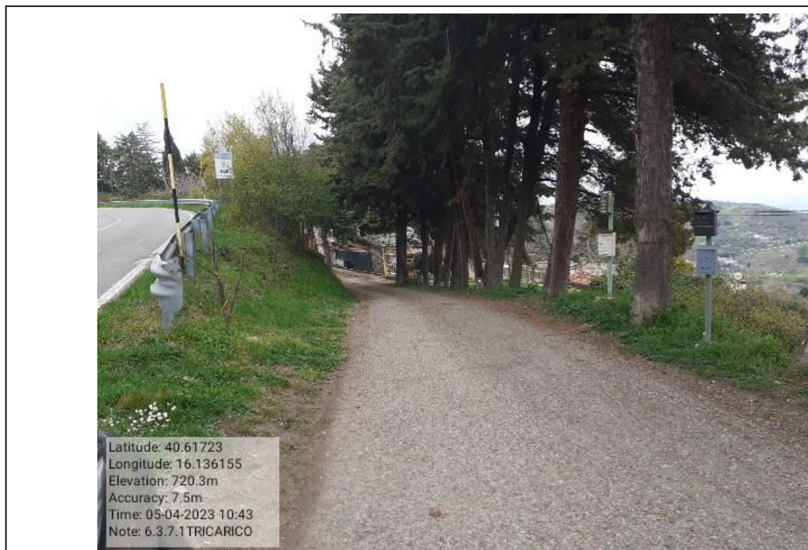
INTERVENTO 6.3.7.1 - TRICARICO STRADA COMUNALE SAN MARTINO FG. 60 Foto n.46