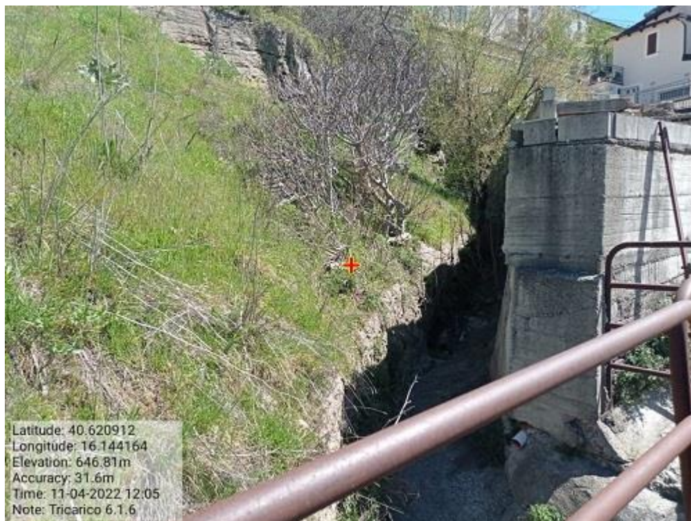
INTERVENTO 6.1.4bis - TRICARICO Fg.47 Part.Acque TORRENTE CACARONE affluente 33