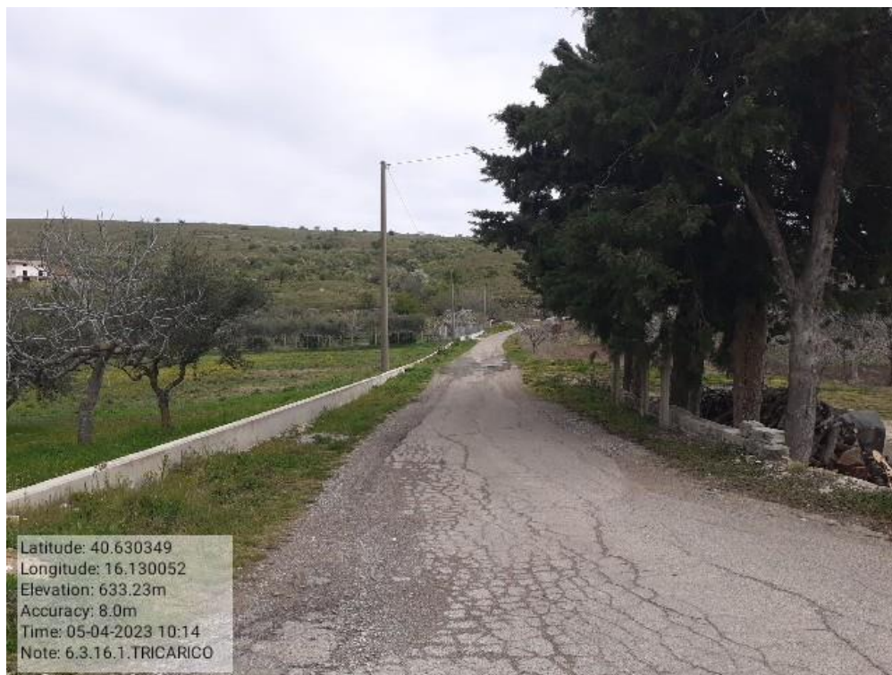
INTERVENTO 6.3.16.- TRICARICO STRADA COMUNALE SANT ANDREA MANCARRONE FG. 53/45 Foto n. 56