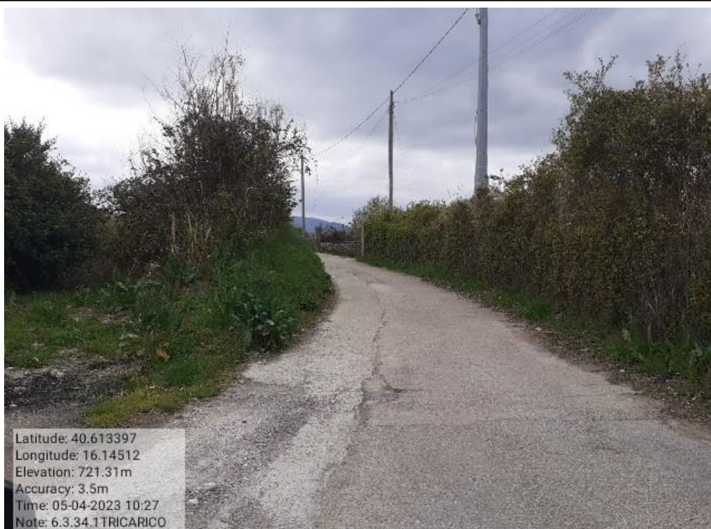
INTERVENTO 6.3.34- TRICARICO STRADA COMUNALE SAN VALENTINO FG.65-75-76 Foto n.73