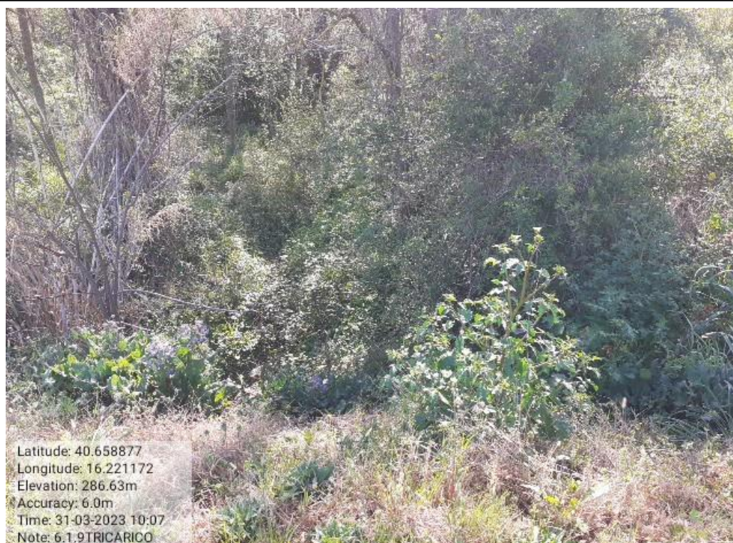
INTERVENTO 6.1.9 - TRICARICO Fg. 61 PARTE ACQUA TORRENTE BILIOSO AREA IN CORR. SP 7 Foto n.38