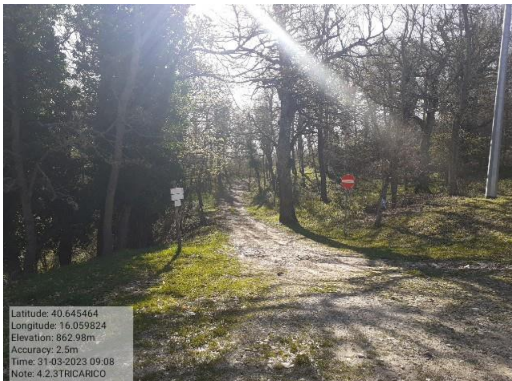
INTERVENTO 4.1.3 - TRICARICO PISTA FORESTALE SANTO JANNI FG.42 PART . 184 Foto n. 23