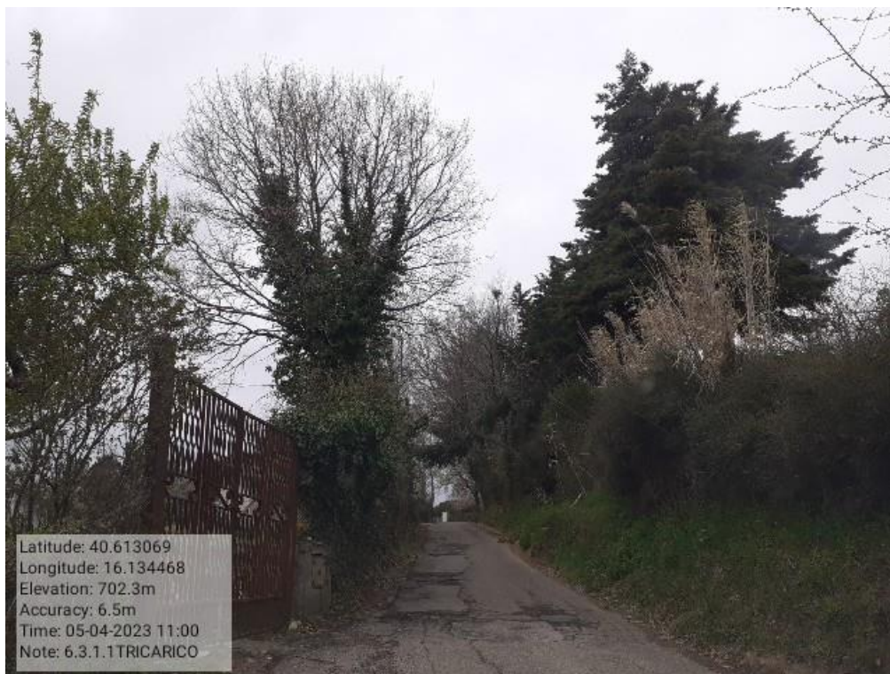
INTERVENTO 6.3.1.1.- TRICARICO STRADA COMUNALE MALCANALE 1 FG. 64