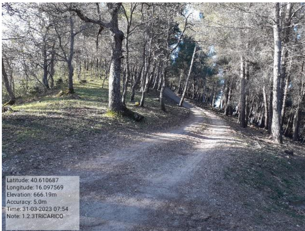
INTERVENTO 1.1.3- TRICARICO Fig.62 part.125- 139-70 Loc. Mantenera Malcanale - Capanna vendetta Foto n. 3