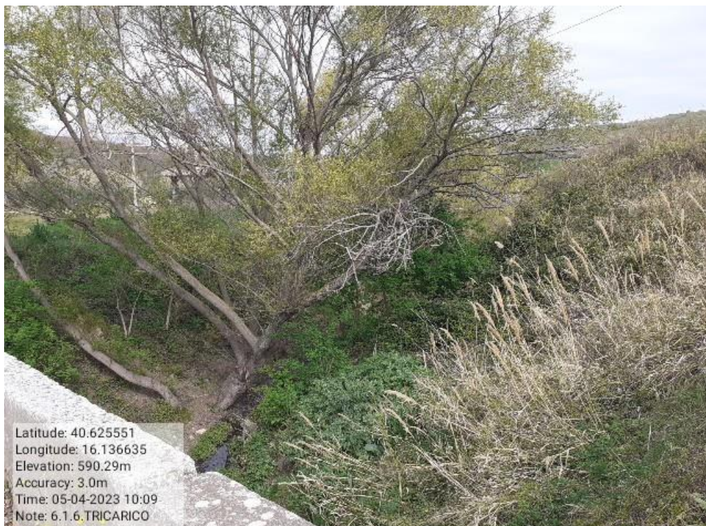
INTERVENTO 6.1.6- TRICARICO Fg.47 Part.Acque TORRENTE CACARONE (AFFLUENTE) Foto n. 35