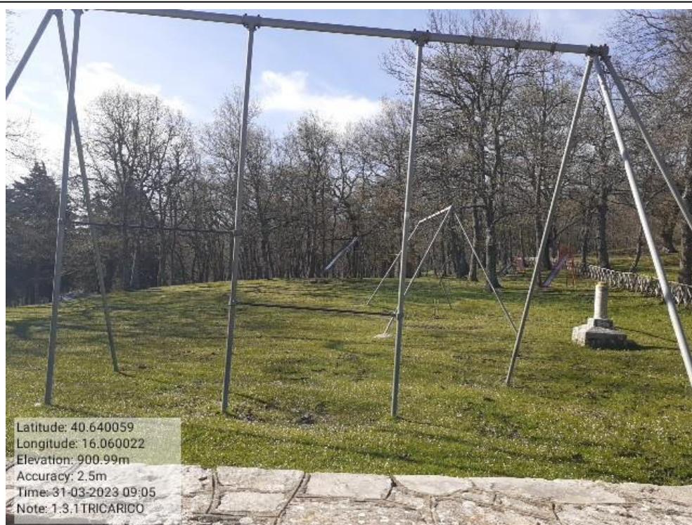
INTERVENTO 1.3.1 - TRICARICO Fg.50 part.171 Loc.Trecancelli area attrezzata Foto n. 14