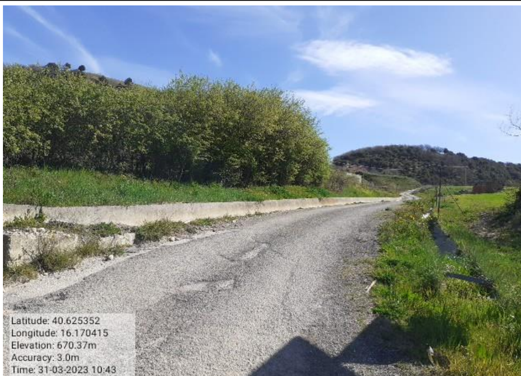
INT 6.3.11 - TRICARICO TRATTURO TRICARICO GRASSANO 1° TRATTO BIVIO TRICARICO CALLE FG.57 Foto n. 50