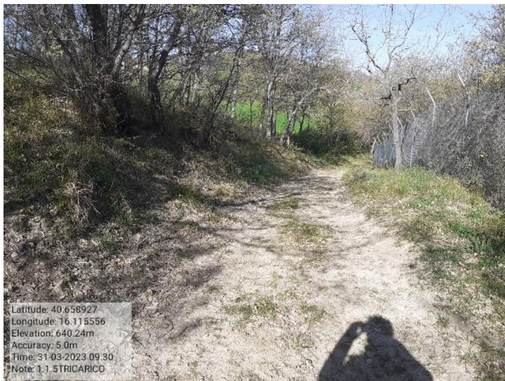
INTERVENTO1.1.5 - TRICARICO