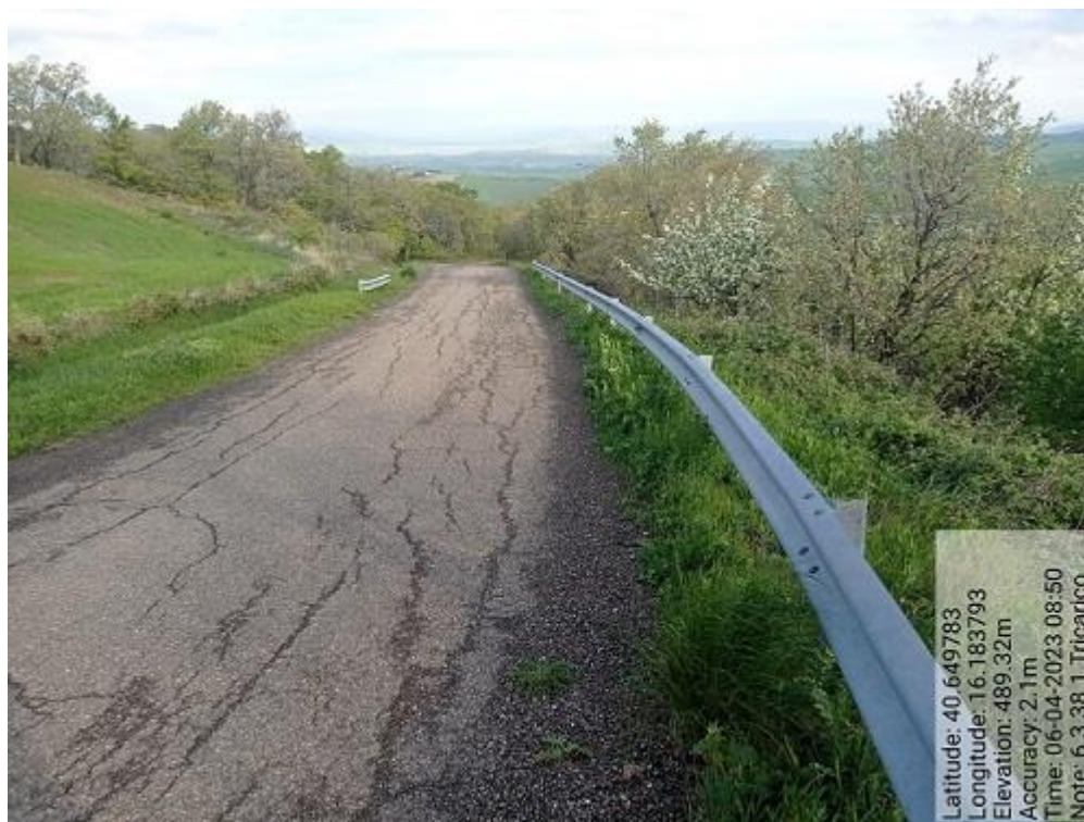
INTERVENTO 6.3.38 - TRICARICO Fg.38 Part.143 e Strade - Strada Comunale Pantano di Volpe Foto n.77