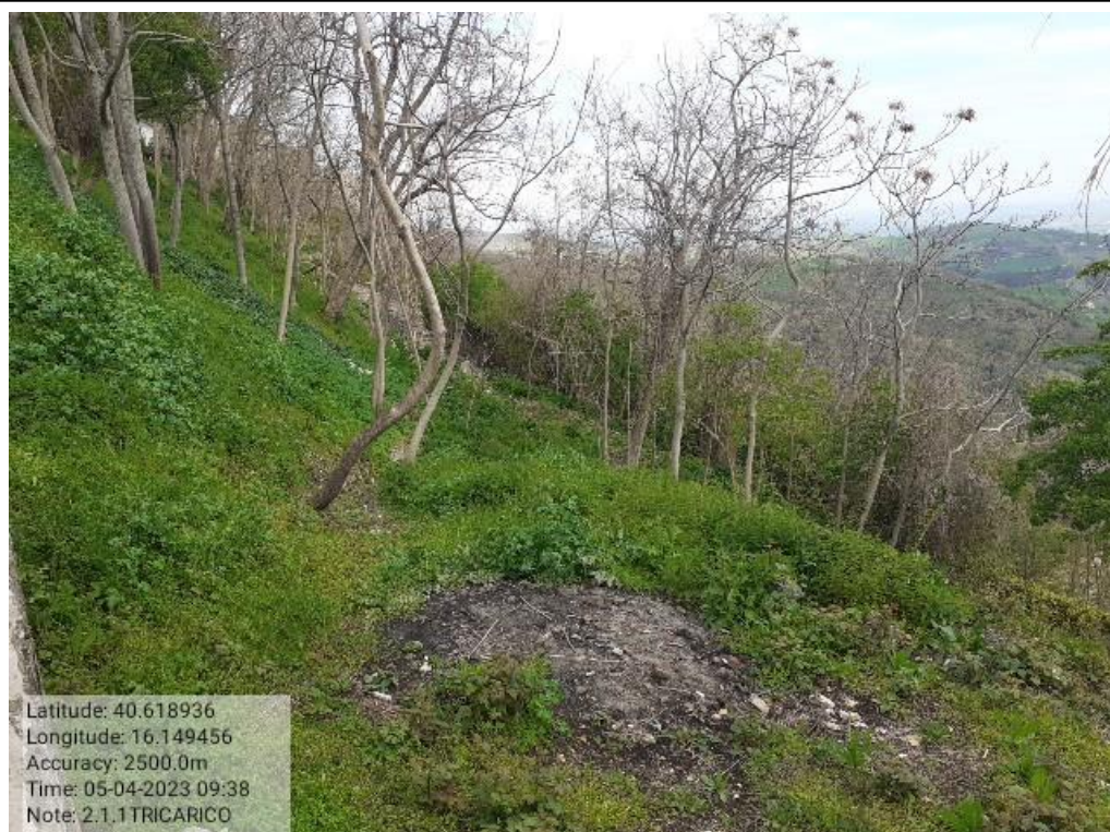
INTERVENTO 2.1.1 - TRICARICO