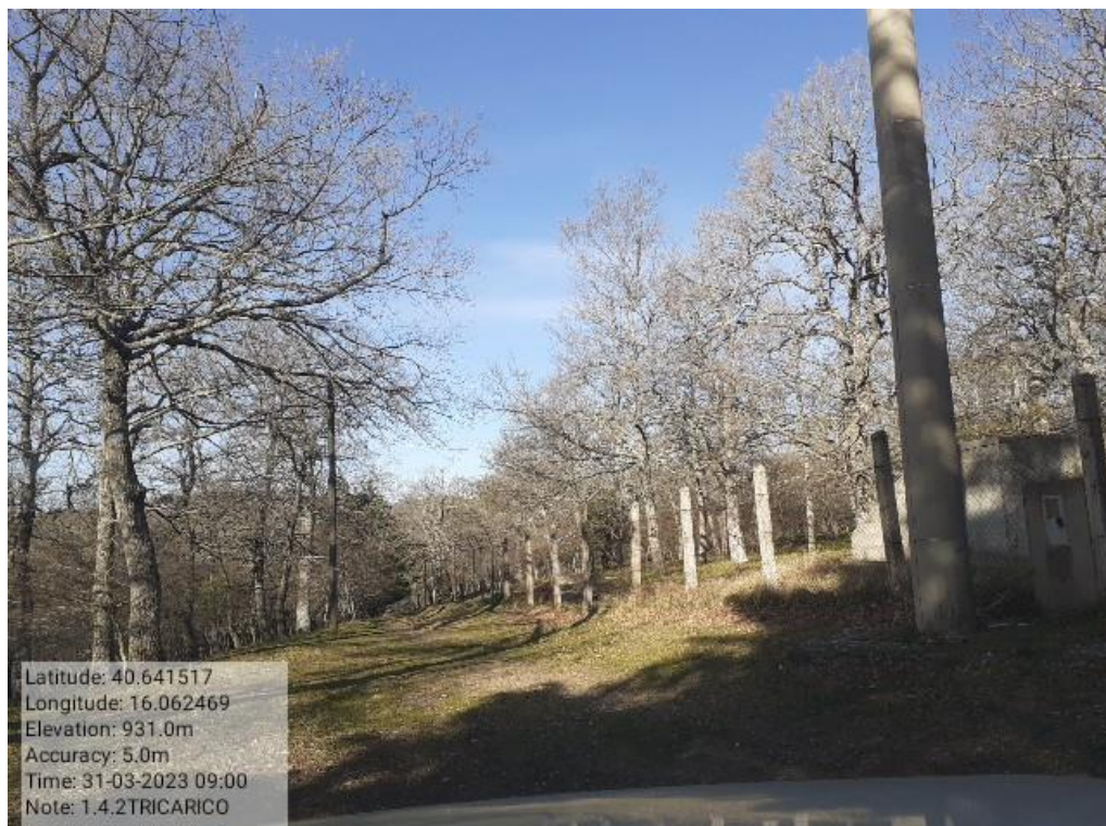
INTERVENTO 1.4.2 TRICARICO Fg.42 part.242 Loc.Trecancelli (strada interna trecancelli diramazione) Foto n.17