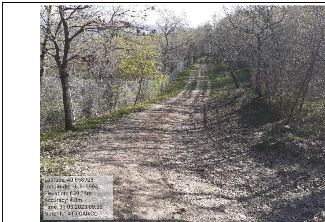
INTERVENTO 1.1.4. - TRICARICO Fig.11 part.1 Loc. Cugno della Pica Foto n. 4