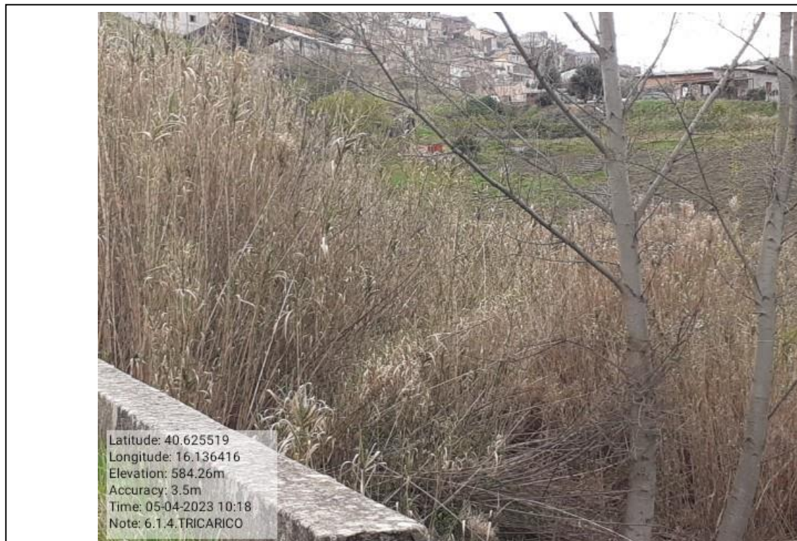
INTERVENTO 6.1.4- TRICARICO Fg.47 Part.Acque TORRENTE CACARONE TRATTO 3 Foto n.32