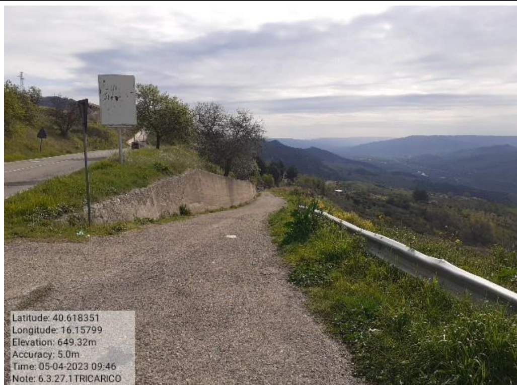
INTERVENTO 6.3.27 - TRICARICO STRADA CAPRINA FG.66