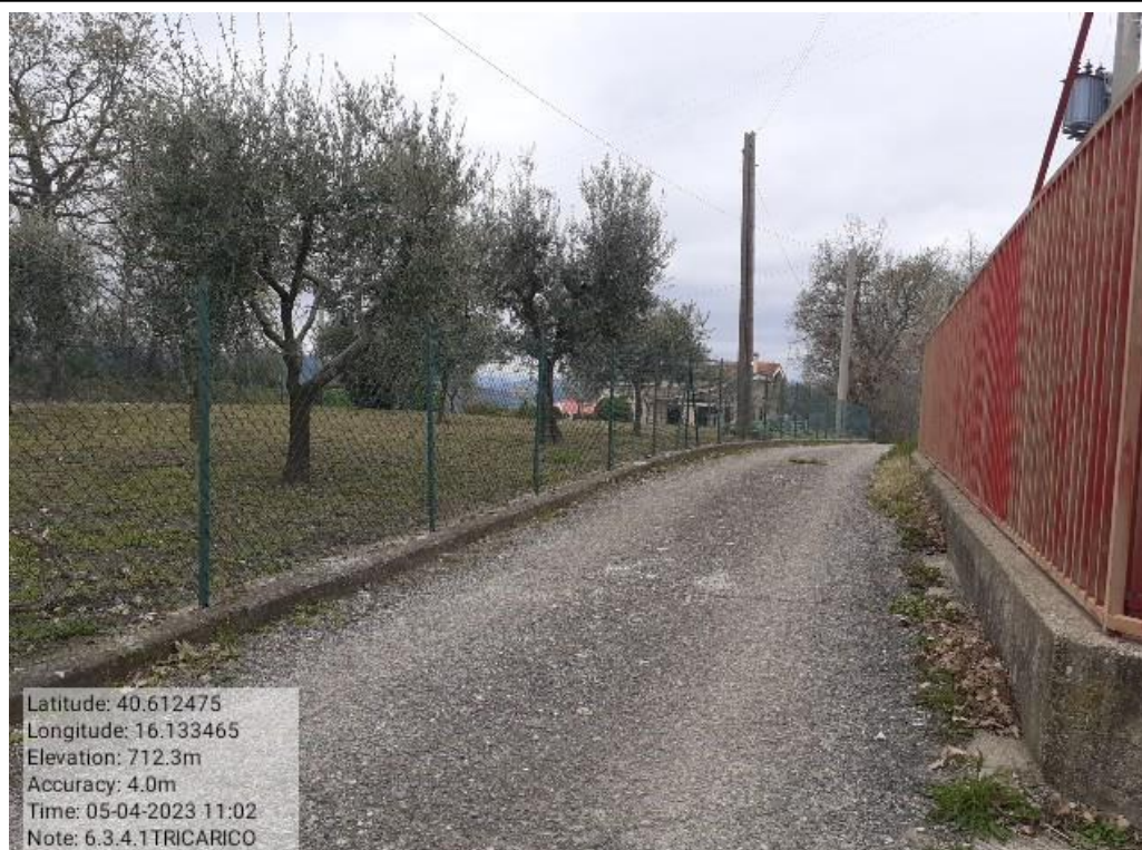
INTERVENTO 6.3.4.1 - TRICARICO STRADA COMUNALE MALCANALE FG. 64