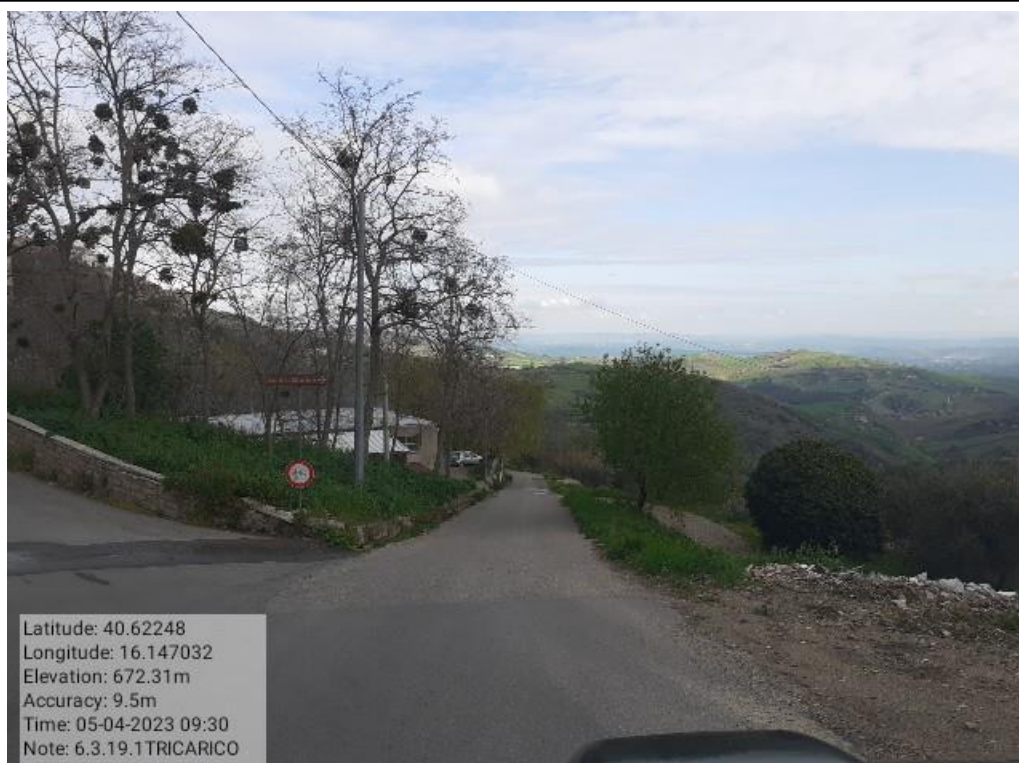
INTERVENTO 6.3.19 - TRICARICO STRADA COMUNALE SARACENA FG. 54/61 Foto n. 59