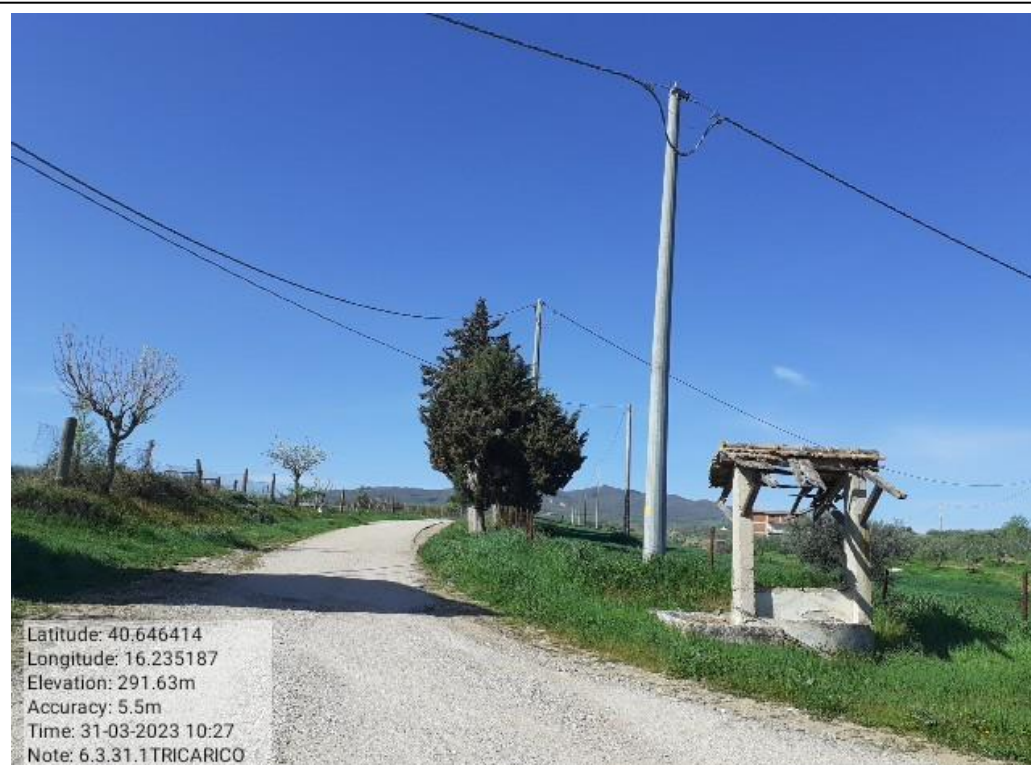
INTERVENTO 6.3.31 - TRICARICO STRADA COMUNALE PIANI SOTTANI FG41-26 Foto n. 71