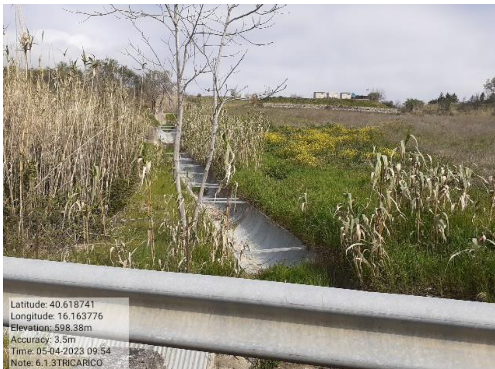
INTERVENTO 6.1.3 - TRICARICO Fg.66 part.97-574-39 CANALE PIANO DELLE GINESTRE Foto n. 31