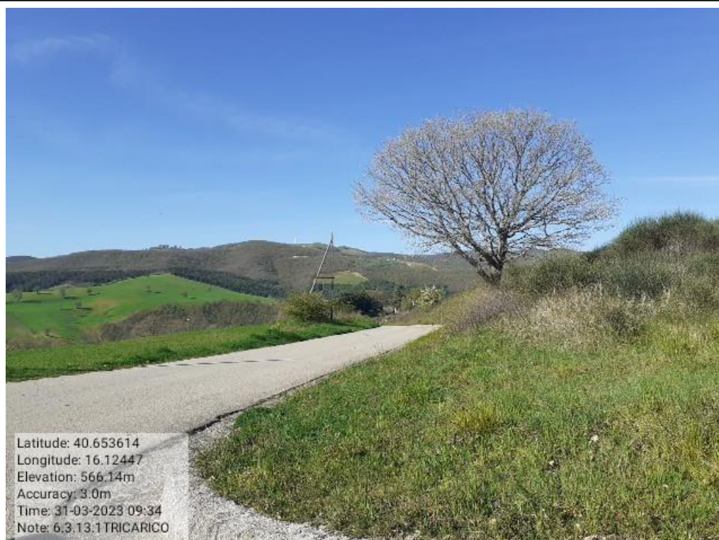
INTERVENTO 6.3.13 - TRICARICO Fg. 46-45-33-34-11-12-4 Strada Comunale Albanello-Cucno della Pica Foto n.