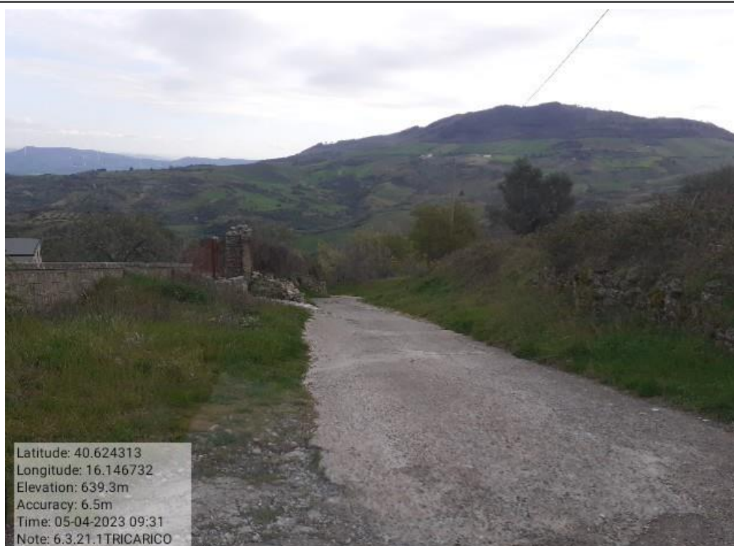
INTERVENTO 6.3.21 - TRICARICO Fg61 Strada Comunale della Trinità Foto n.61