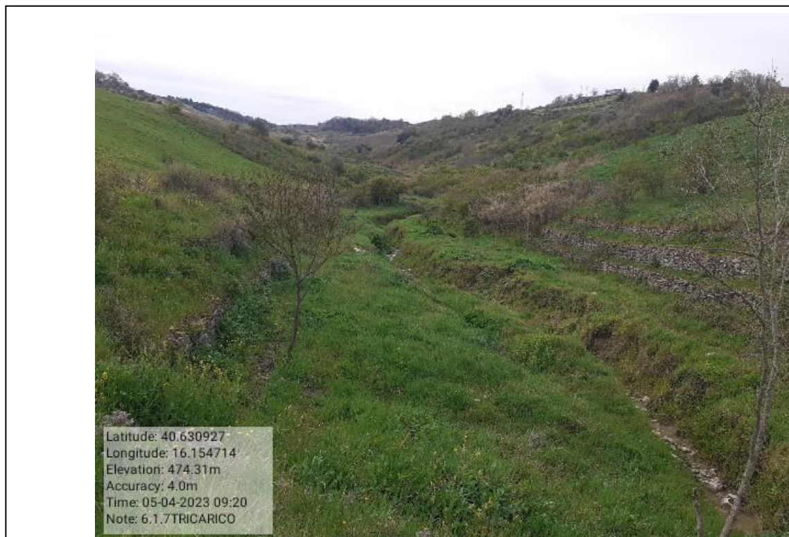
INTERVENTO 6.1.7 - TRICARICO Fg. 61 PARTE ACQUA VALLONE CASTAGNONE Foto n. 36