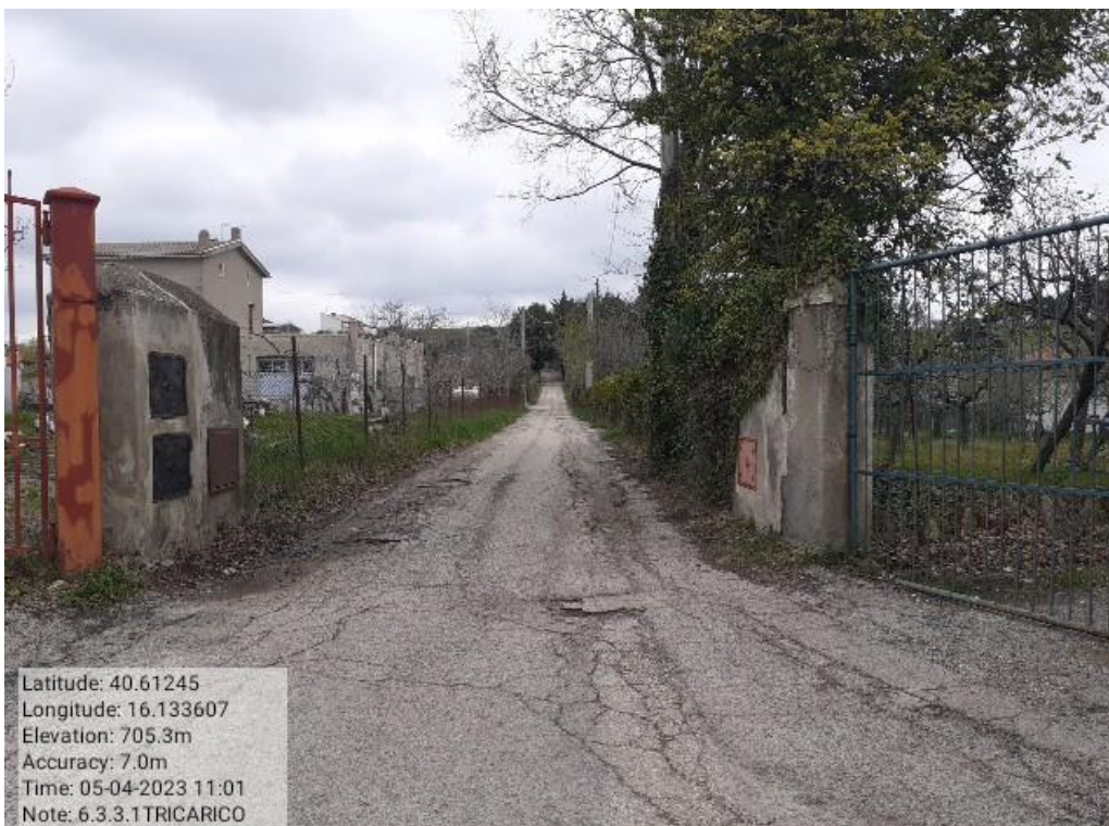
INTERVENTO 6.3.3.1- TRICARICO STRADA COMUNALE MALCANALE 2 FG. 64