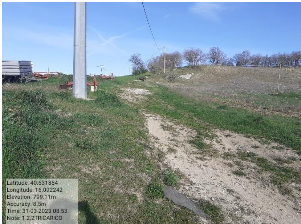
INTERVENTO 1.2.2 - TRICARICO F.g.42 part. 43 LOC. CARBONARA