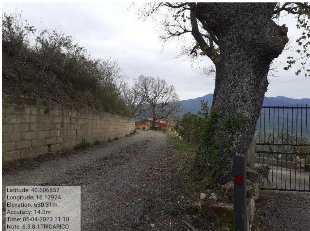
INTERVENTO 6.3.8.1.- TRICARICO STRADA COMUNALE MALCANALE 6 FG. 64