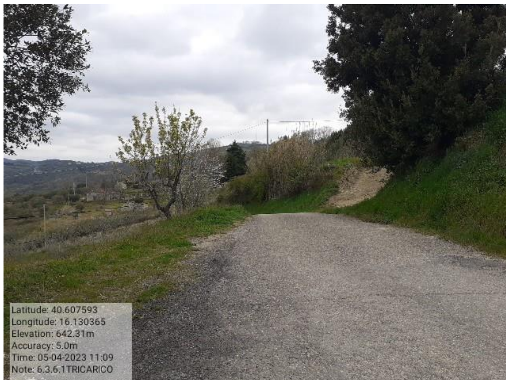
INTERVENTO 6.3.6.1- TRICARICO STRADA COMUNALE MALCANALE 5 FG. 64 Foto n. 45