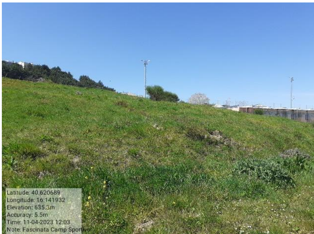
INTERVENTO 6.2.2.1 - TRICARICO FASCINATE CAMPO SPORTIVO NUOVO Foto n. 78