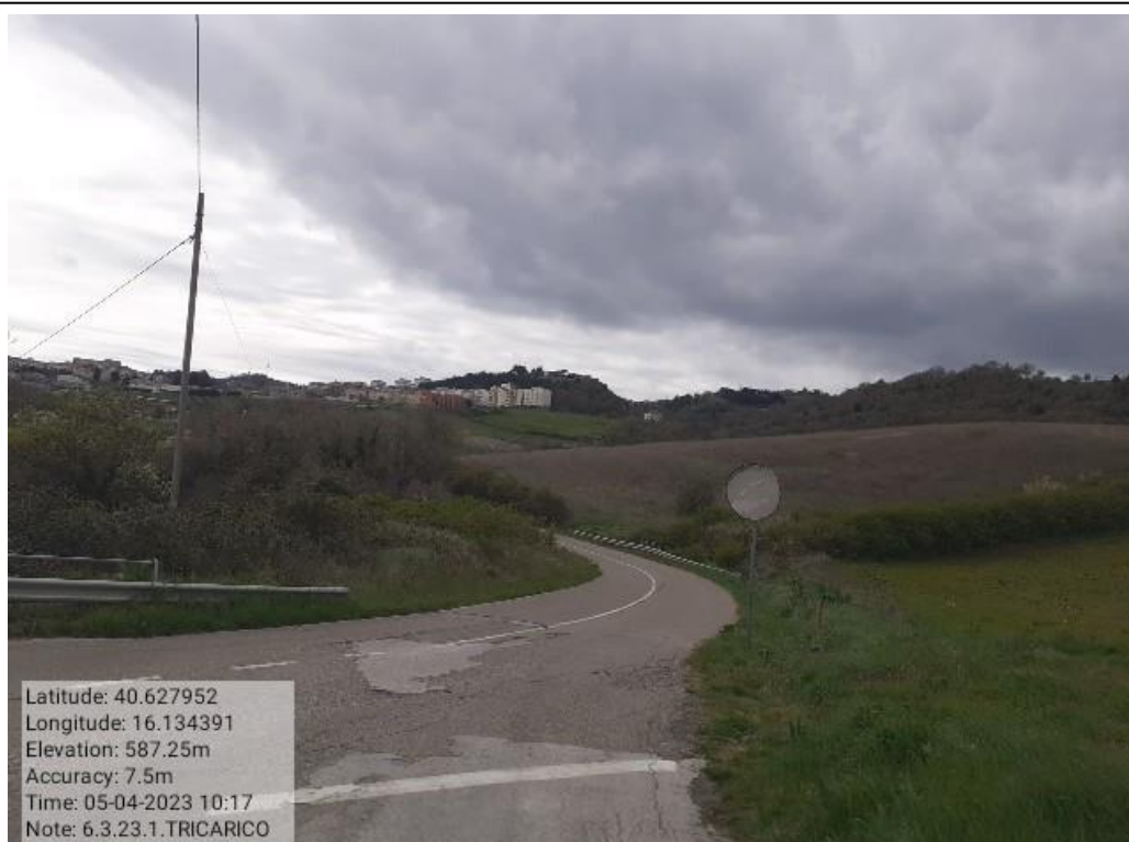
INTERVENTO 6.3.23 - TRICARICO STRADA PROVINCIALE BOCCANERA FG.46-47-35-36-21 1° TRATTO Foto n.63