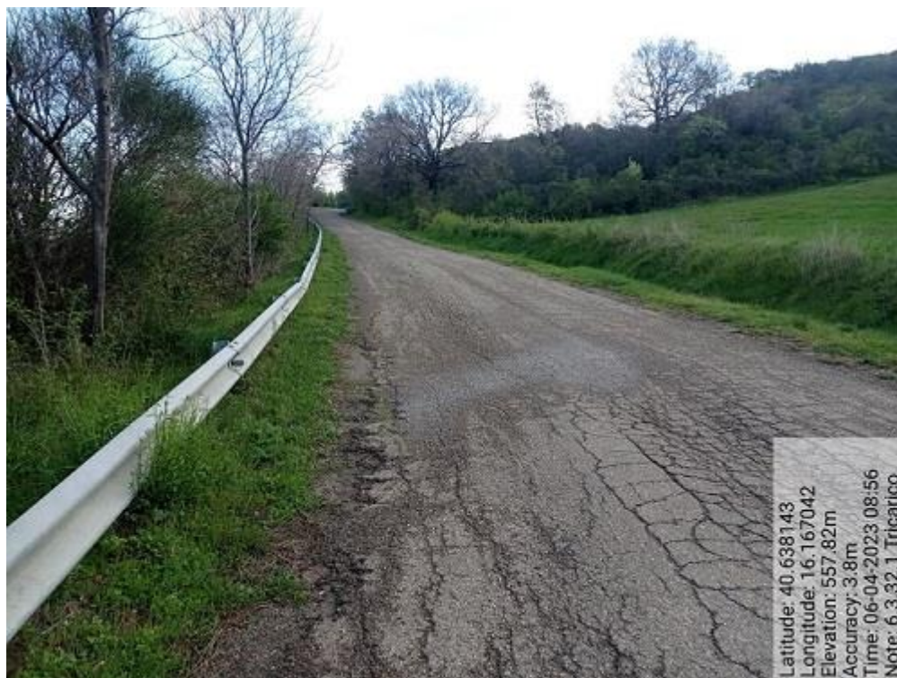
INTERVENTO 6.3.32 - TRICARICO Fg.38 Part.143 e Strade - Strada Comunale caccia nella nebbia Foto n.76