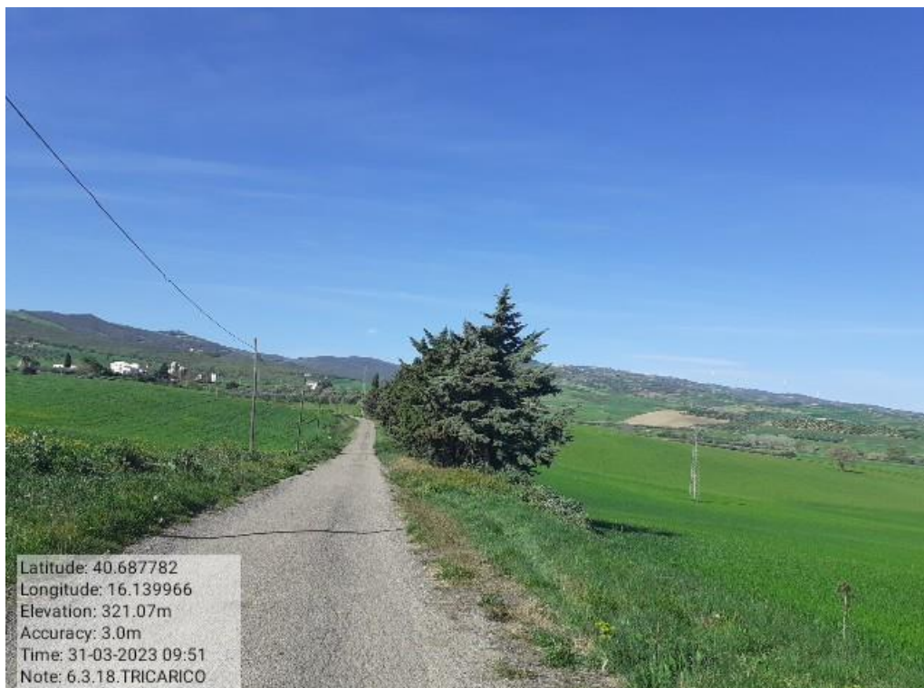
INTERVENTO 6.3.18.- TRICARICO STRADA COMUNALE FORTE ORLANDO FG.4