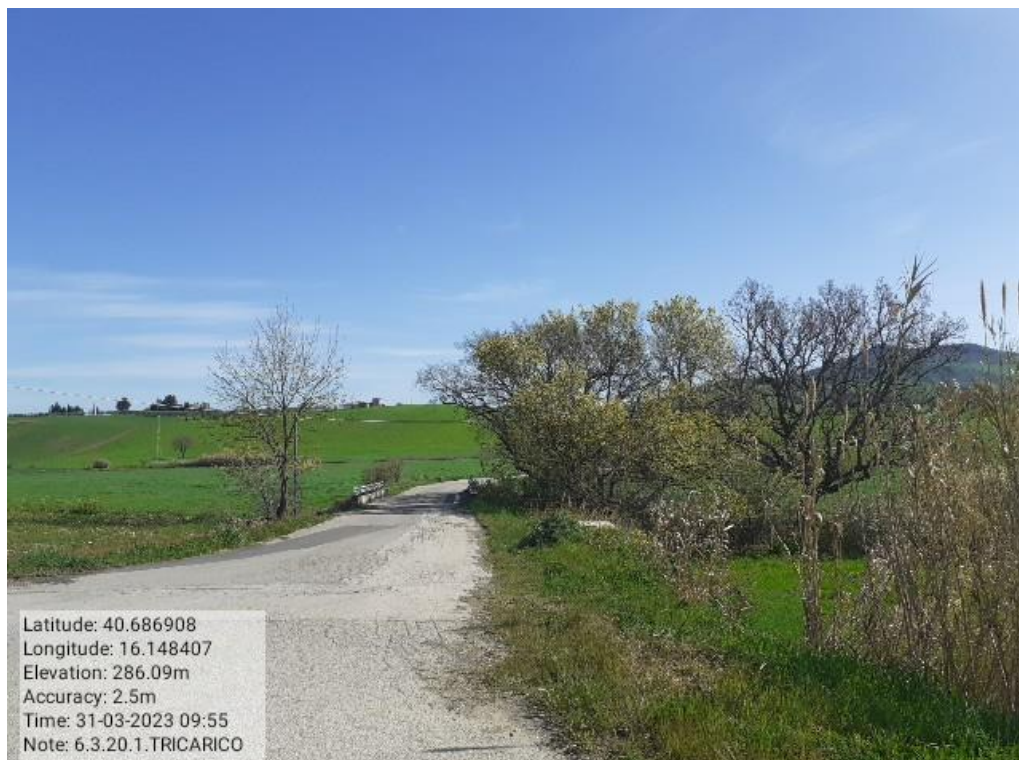
INTERVENTO 6.3.20.- TRICARICO T Fg 15-14-6-10 Strada Comunale Serramendola Bassa Foto n. 60