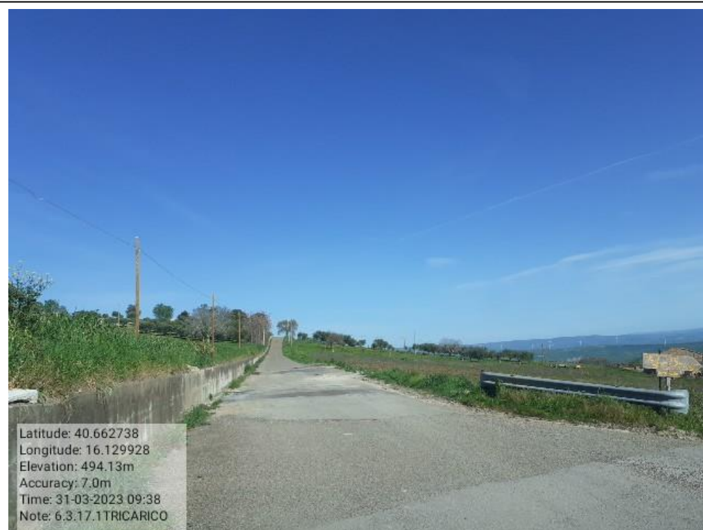
INTERVENTO 6.3.17 - TRICARICO STRADA COMUNALE SAN MARCO 2 FG.12 Foto n. 57