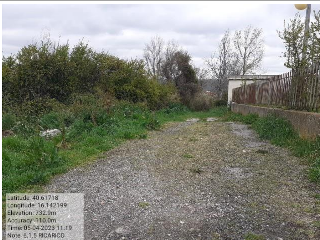
INTERVENTO 6.1.5 - TRICARICO Fg. 65 Part.Acque PRETURA FONTANA VECCHIA Foto n. 3 4