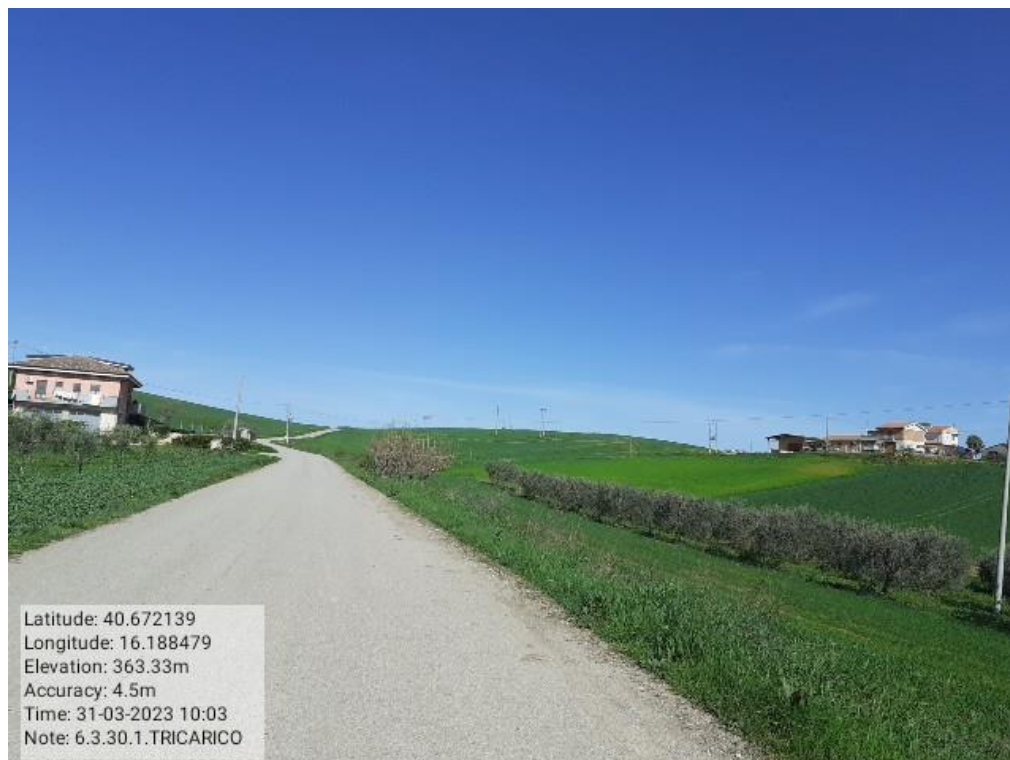
INTERVENTO 6.3.30.- TRICARICO STRADA COMUNALE SERRAMENTOLA ALTA FG5-8 Foto n. 70