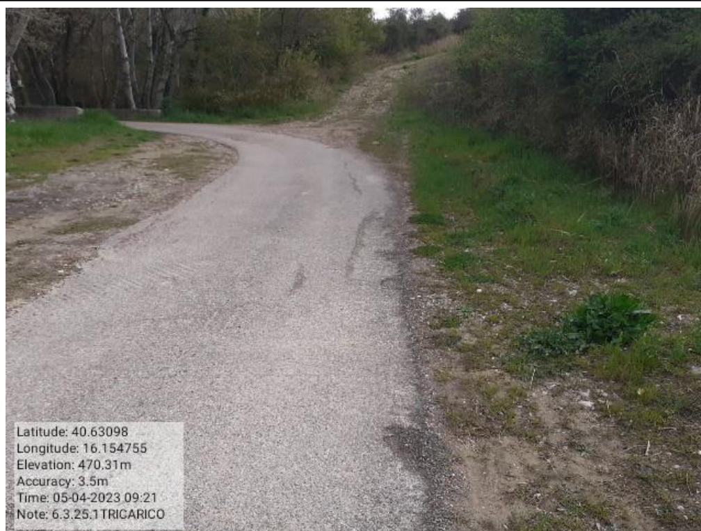
INTERVENTO 6.3.25 - TRICARICO STRADA COMUNALE CASTAGNONE 2 FG.61-48-37 Foto n. 65