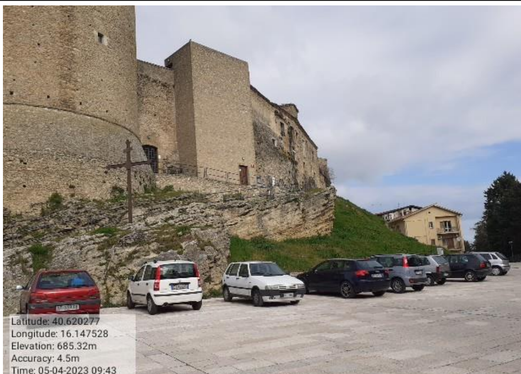
INTERVENTO 6.2.2.2 - TRICARICO FASCINATE SOTTO TORRE NORMANNA Foto n. 80