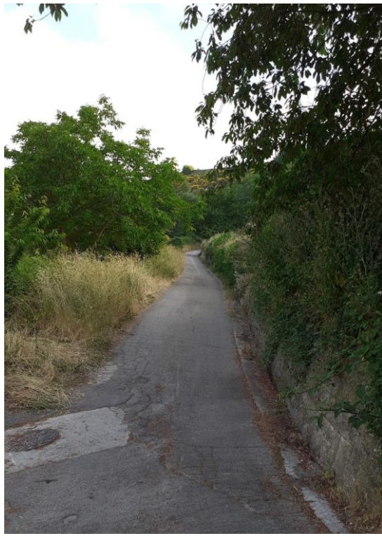
Int. 6.3.1.1-6.3.2.1(40.641971,15.540638) Foto 9