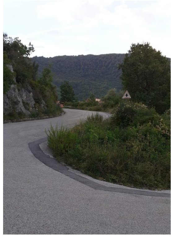
Int. 6.3.1.1-6.3.2.1(40.652648,15.518616) Foto 10