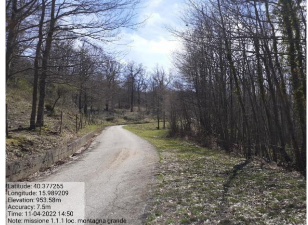
Missione 1.1.1 loc. Montagna Grande f. 55 p.lle 1-2-3-4