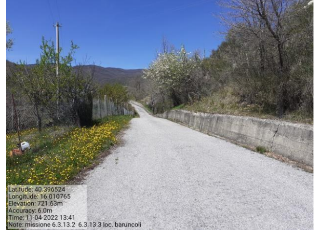
Missione 6.3.13.2 6.3.13.3 loc. Baruncoli f. 45