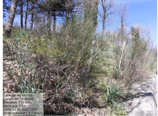
Missione 1.3.1 loc. bosco Sant'Elia f. 20 p.lla 56