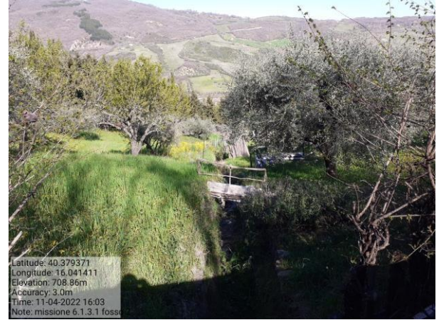
Missione 6.1.3.1 fosso 2 f. 75-97