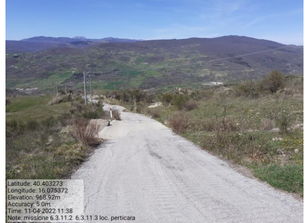
Missione 6.3.11.2 6.3.11.3 loc. Peticara f.38-39