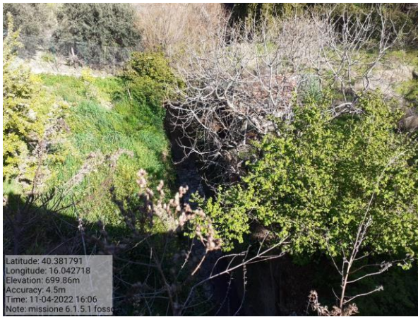
Missione 6.1.5.1 fosso 4 f. 75-76