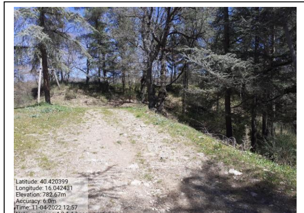
Missione 4.2.1.1 loc. bosco Sant'Elia f. 20 p.IIa 56