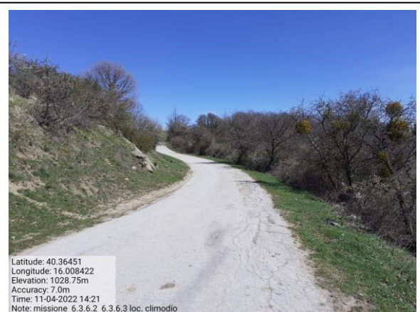
Missione 6.3.6.2 6.3.6.3 loc. Climodio f. 84-87-88-107