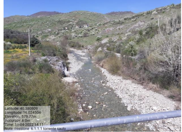
Missione 6.1.1.1 torrente Saulo f. 47-58