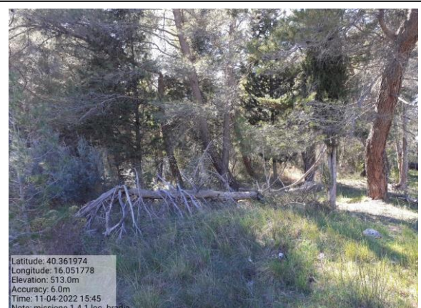
Missione 1.4.1 loc. Bradia f. 100