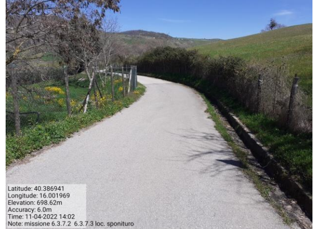
Missione 6.3.7.2 6.3.7.3 loc. Sponituro f. 57