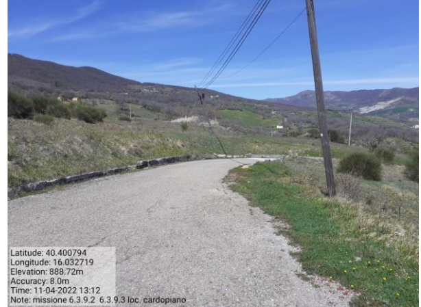
Missione 6.3.9.2 6.3.9.3 loc. Cardopiano f. 22-23-42