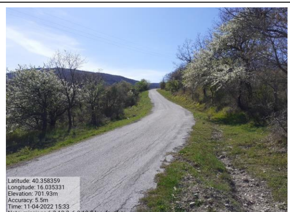
Missione 6.3.12.2 6.3.12.3 loc. Favaletto f. 106-107