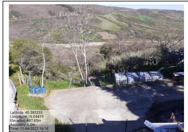
Missione 6.1.2.1 fosso 1 f. 64-65