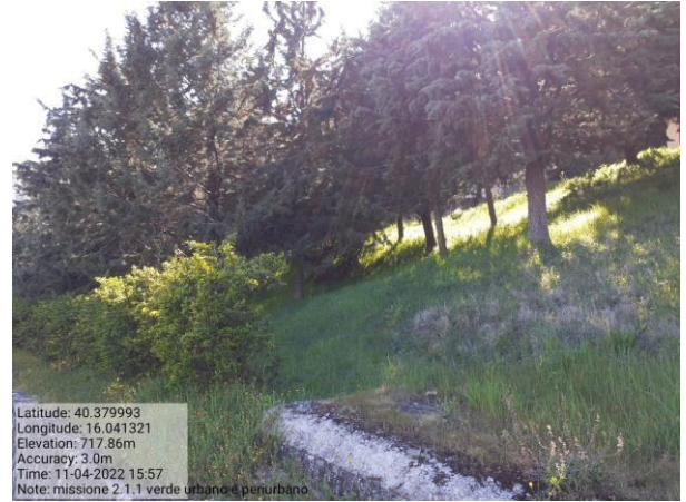
Missione 2.1.1 verde urbano e periurbano