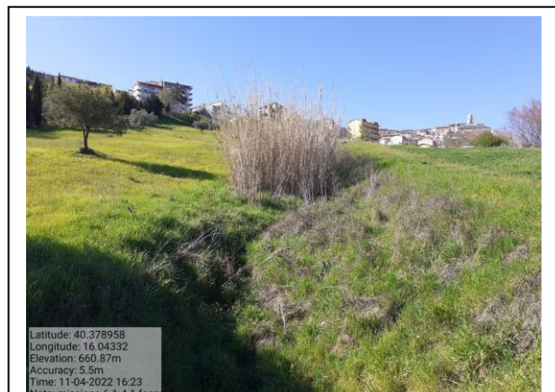
Missione 6.1.4.1 fosso 3 f. 76-97