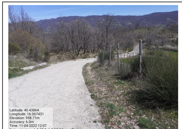
Missione 6.3.10.2 6.3.10.3 loc. Valloni f. 5-7