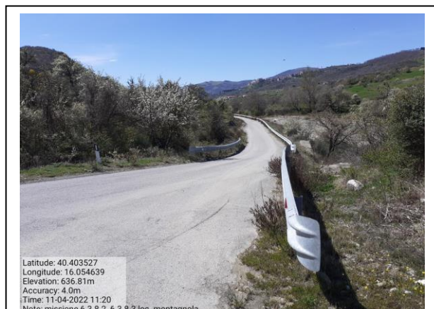
Missione 6.3.8.2 6.3.8.3 loc. Montagnola f. 39-40