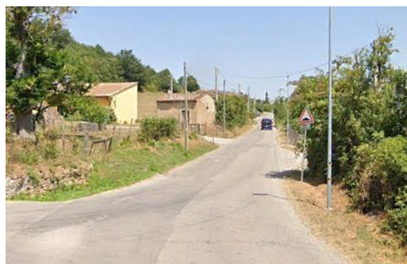
Int. 6.3.10.1+6.3.10.2- Strada Sciffra -Petrucco Foto n°2