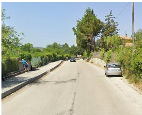
Int. 2.1.6 +2.2.6 – Pista perimetrale all'area turistica del lago Pantano Foto n° 1