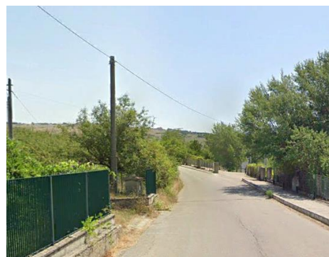
Int. 2.1.6+2.2.6 – Pista perimetrale all'area turistica del lago Pantano Foto n° 2