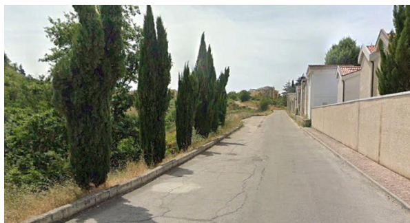
Int. 2.1.5 – Area cimitero Foto n° 1