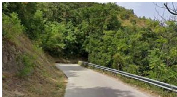
Int. 1.1.1 - 1° tratto fascia antincendio su SP Foto n° 2