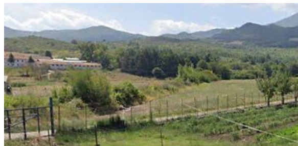
Int. 6.1.4- Fosso Fratta Vecchia Foto n°2