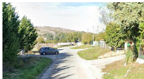
Int. 6.3.6.1+6.3.6.2 - Strada Pantano- mulino dei piedi Foto n°2