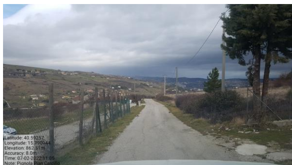
Int. 6.3.12.1+6.3.12.2 Strada Pian Cardillo- c. da Magnone Foto n°1