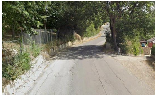
Int. . 6.3.4.1+6.3.4.2 - Strada comunale campo di Giorgio- Area artigianale- Ponte delle tavole Foto n°2