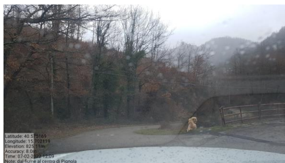
Int. 1.1.2 - 2° tratto fascia antincendio Foto n° 2