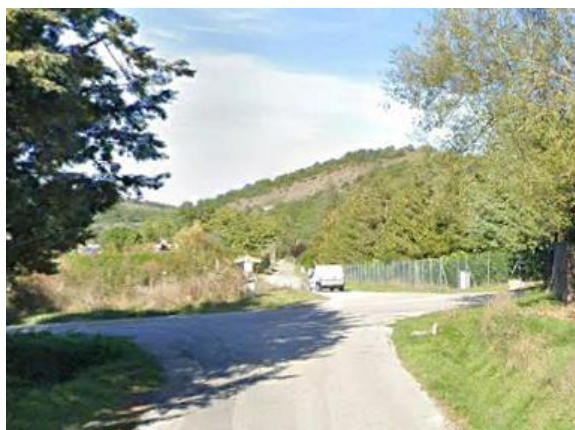
Int. 6.3.6.1+6.3.6.2 Strada Pantano- mulino dei piedi Foto n°1