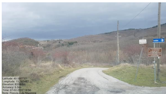
Int. 6.3.2.1+ 6.3.2.2 - Strada C. da Mangone Foto n°1