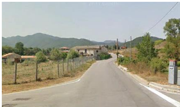
Int. 6.3.4.1+6.3.4.2 - Strada comunale campo di Giorgio- Area artigianale- Ponte delle tavole Foto n°1