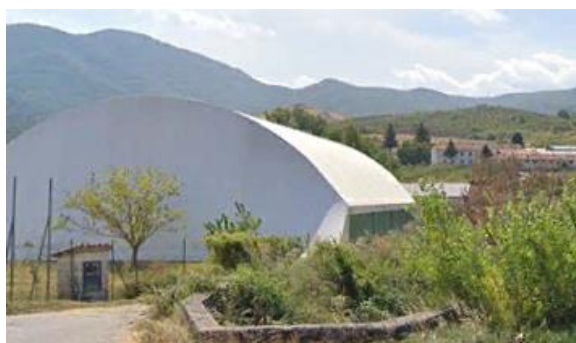
Int. 6.1.4- Fosso Fratta Vecchia Foto n°1