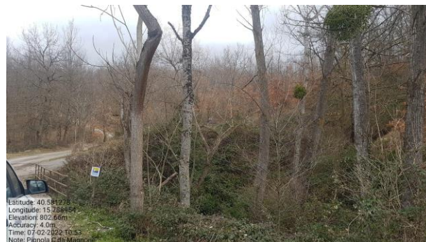
Int. 4.1.3- Attraversamento Strada C. da Magnone Foto n°2