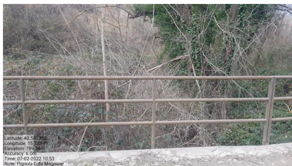
Int. 6.1.3- Attraversamento Strada C. da Magnone Foto n°1