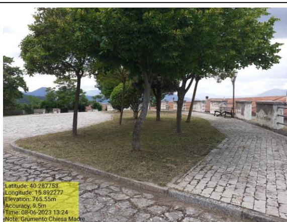
Missione 2.1.1 Manutenzione verde urbano - Foto 11 Missione 2.1.1 Manutenzione verde urbano - Foto 12