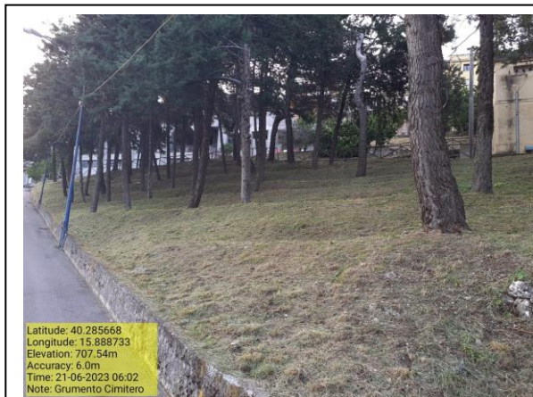
Missione 2.1.1 Manutenzione verde urbano - Foto 14

Latitude: 40.285668 Longitude: 15.888733 Elevation: 707.54m Accuracy: 6.0m Time: 21-06-2023 06:02 Note: Grumento Cimitero