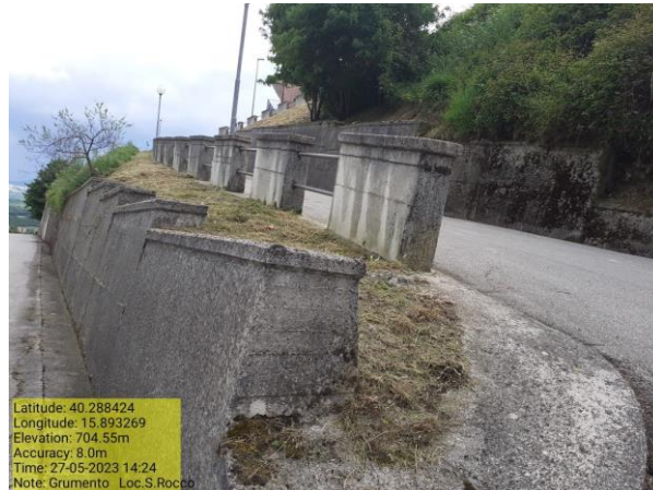
Missione 2.1.1 Manutenzione verde urbano - Foto 9 Missione 2.1.1 Manutenzione verde urbano - Foto 10