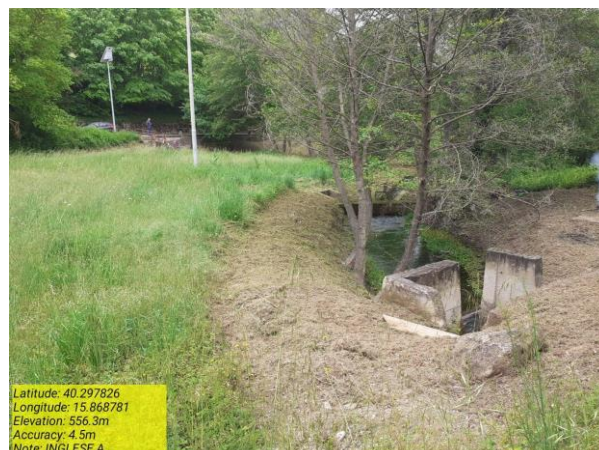
Missione 6.1.4.1 Manutenzione fontana dei salici - Foto 5 Missione 6.1.2.1 Manutenzione opera di presa - Foto 6