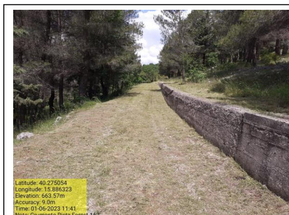
Missione 1.1.1 manutenzione pista - Foto 3