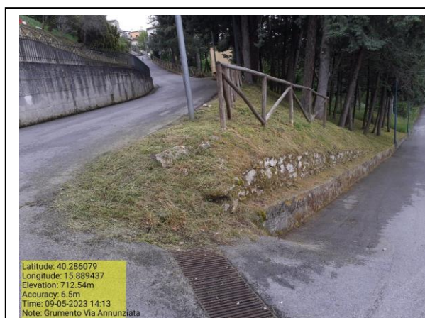
Missione 2.1.1 Manutenzione verde urbano – Foto 7 Missione 2.1.1 Manutenzione verde urbano – Foto 8