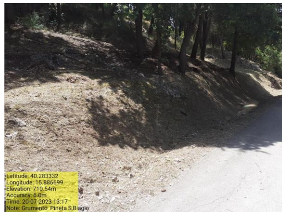
Missione 4.2.1 manutenzione fascia - Foto 1