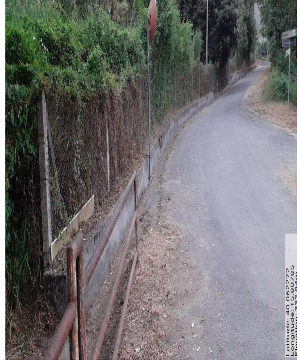
STRADA COMUNALE FRASSINE - Foto 1