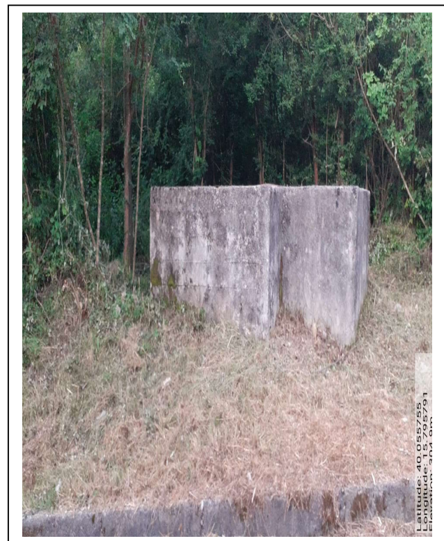
CAMERETTA CONSORTILE GIANMICHELE - Foto 1