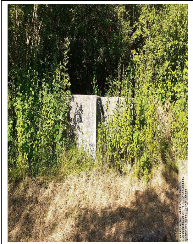
CAMERETTA CONSORTILE GIANMICHELE - Foto 1