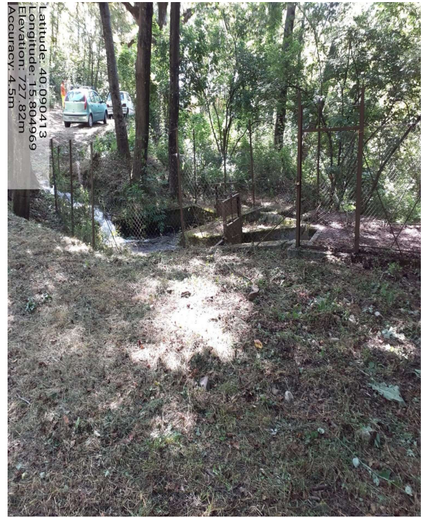
PRESA D'OPERA E DISTRIBUZIONE CONS.LE LAGO SIRINO - Foto 1