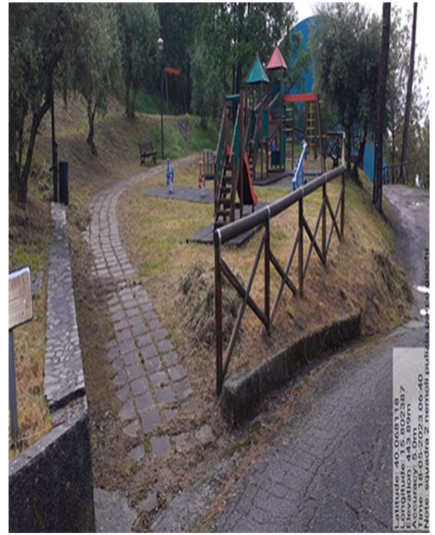
Verde urbano parco giochi - Foto 1