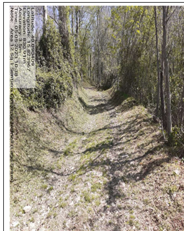
Sentiero forestale Casalino -Foto 1