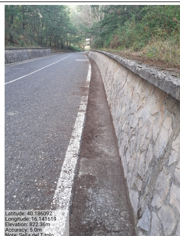
Int.6.3.28.2 – Sella del Titolo -Foto 4