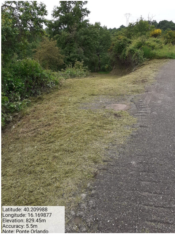
Int.6.3.22 – Ponte Orlando - Foto 1