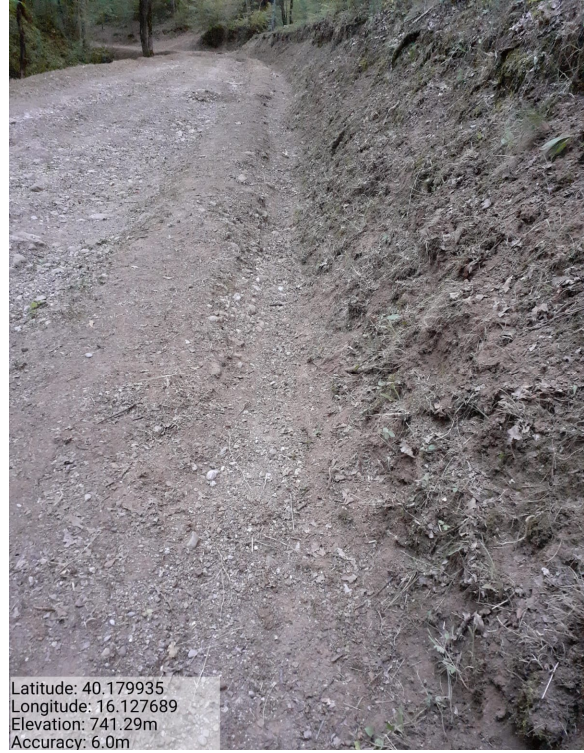
Int. 1.1.3 – Bosco Pellegrino - Foto 2