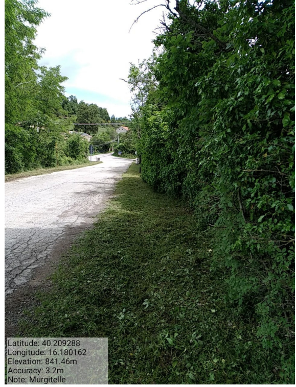
Int.6.3.4.1 - Murgitelle - Foto 2