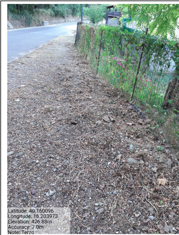
Int.6.3.12 - Terzo - Foto 1