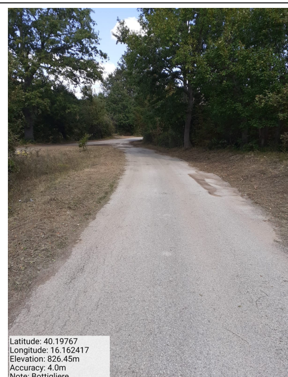
Int.6.3.14 - Bottigliere - Foto 2