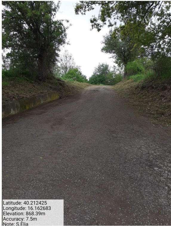
Int.6.3.15 - S. Elia - Foto 1