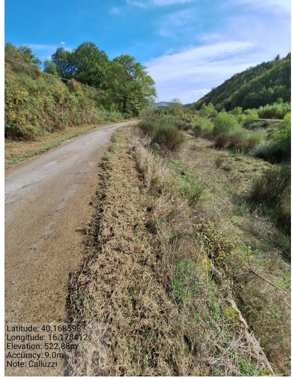
Int.6.3.34 - Calluzzi - Foto 2