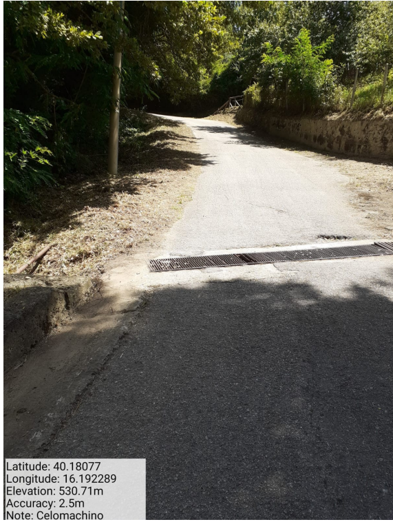
Int.6.3.6.1- Celomachino - Foto 1