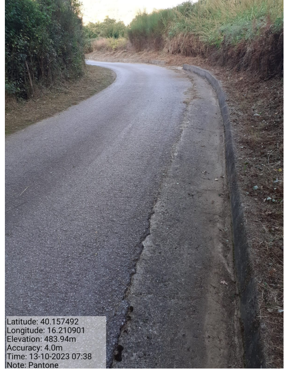
Int.6.3.10.1 - Pantone - Foto 2