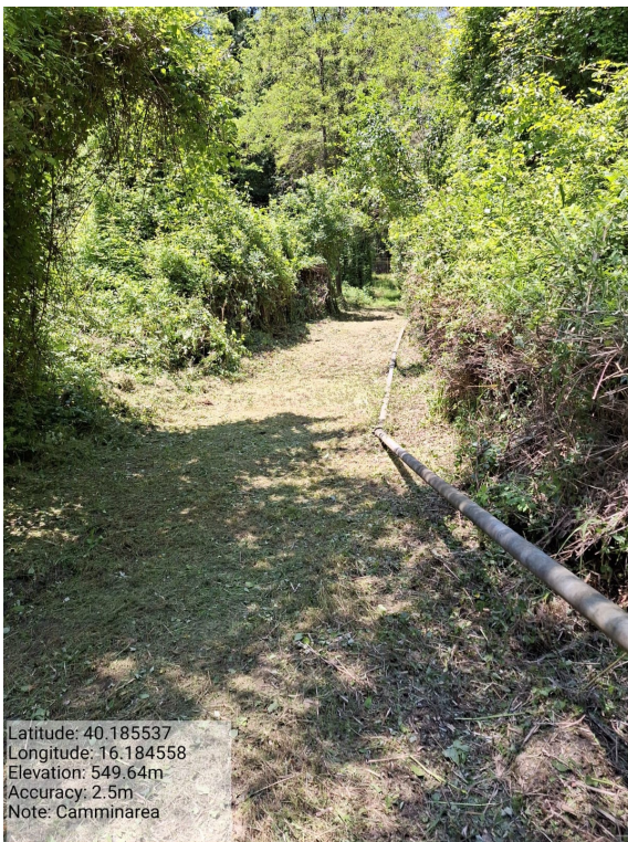
Int.6.3.25 - Camminarea - Foto 1