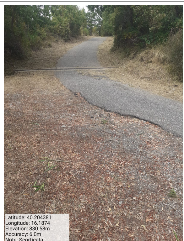
Int.6.3.17 - Scorticata - Foto 2