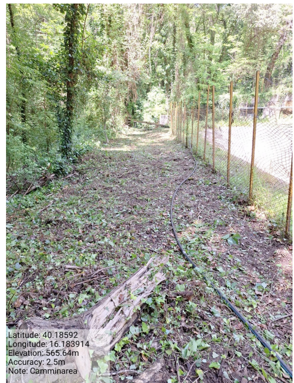
Int.6.3.25 - Camminarea - Foto 2