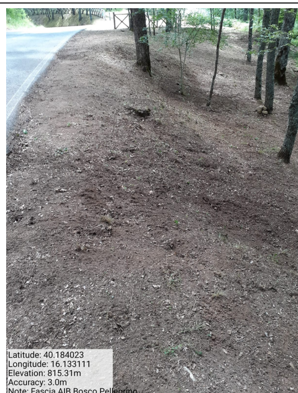
Int.1.1.1 - Bosco Pellegrino - Foto 4