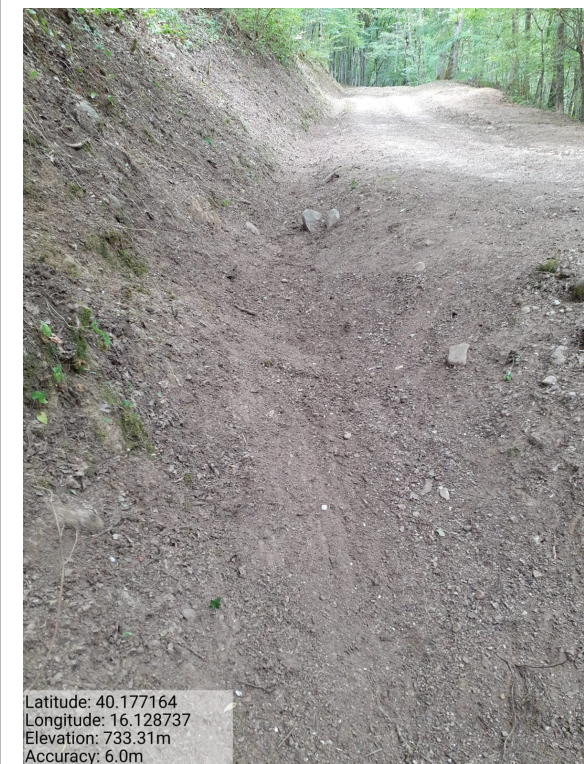
Int. 1.1.3 – Bosco Pellegrino - Foto 3