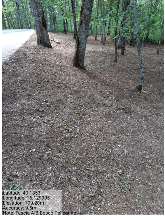
Int.1.1.1 - Bosco Pellegrino - Foto 2