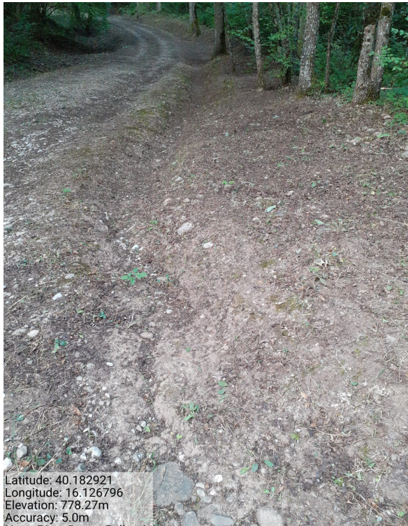
Int. 1.1.3 – Bosco Pellegrino - Foto 1