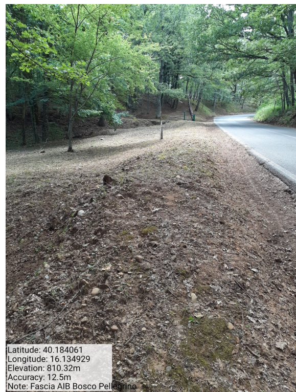
Int.1.1.1 - Bosco Pellegrino - Foto 3