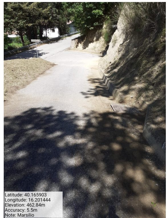
Int. 6.3.7.1 - Marsilio - Foto 2