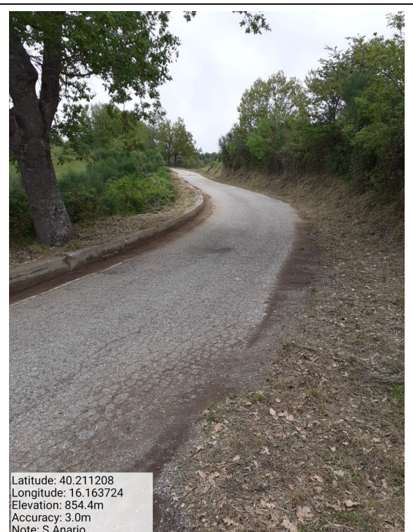
Int. 6.3.5.1- S. Anario - Foto 2