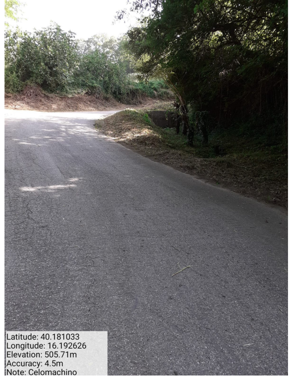
Int.6.3.6.1- Celomachino - Foto 2