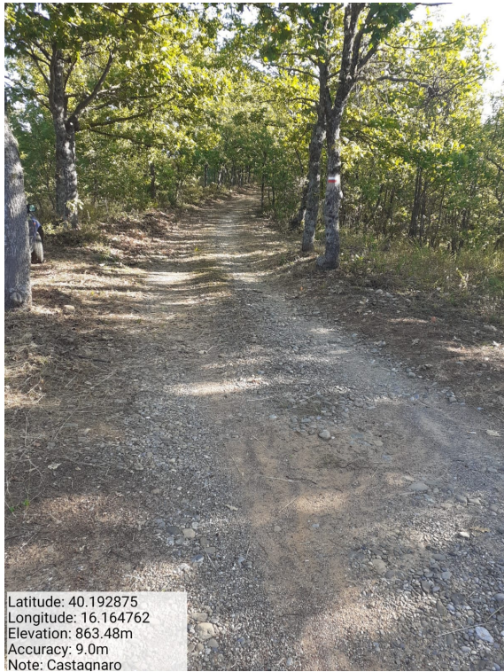
Int.6.3.13 - Castagnaro - Foto 1