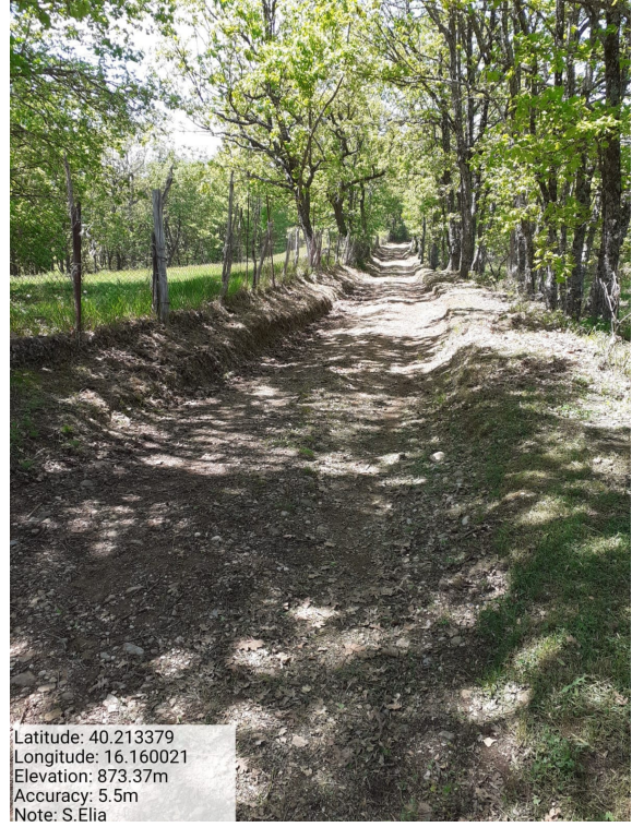
Int.6.3.15 - S. Elia - Foto 2