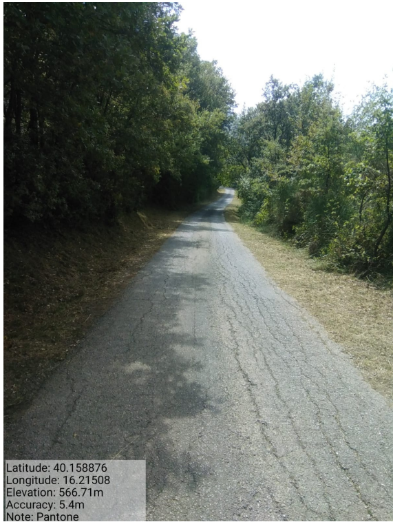
Int.6.3.10.1 - Pantone - Foto 1