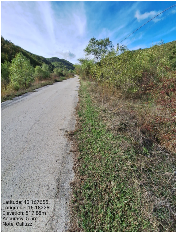
Int.6.3.34 - Calluzzi - Foto 1