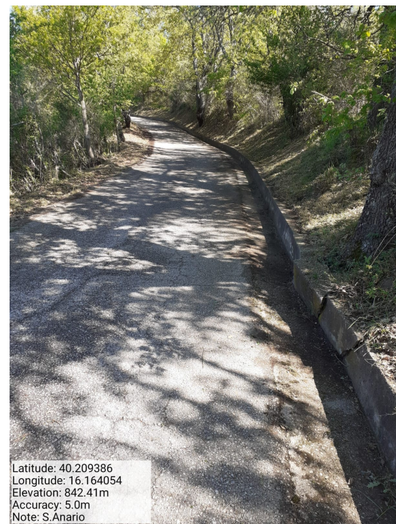
Int. 6.3.5.1 - S. Anario - Foto 1