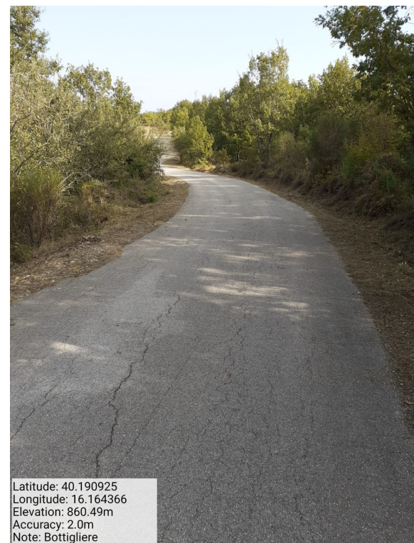
Int.6.3.14 - Bottigliere - Foto 1