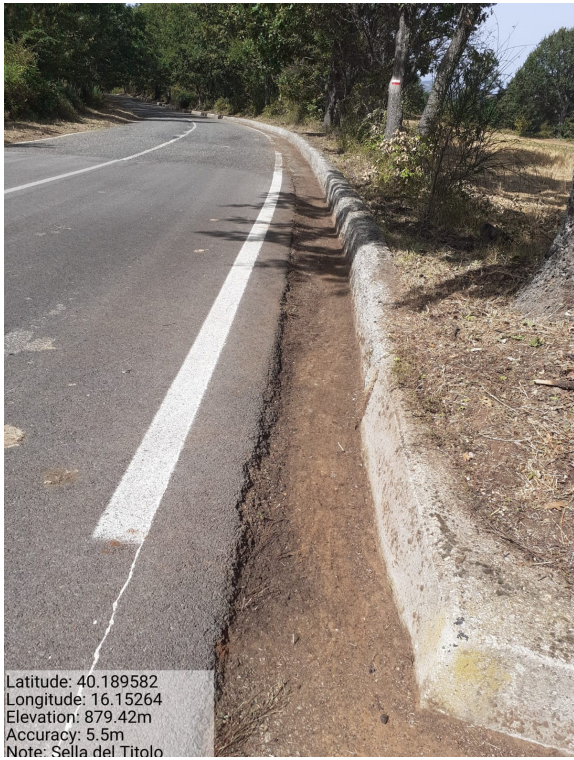
Int.6.3.28.2 – Sella del Titolo -Foto 1