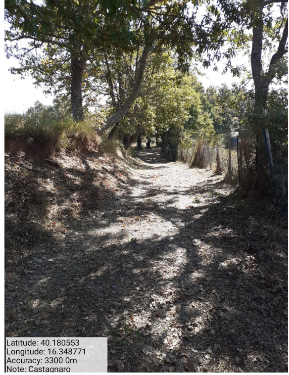
Int.6.3.13 - Castagnaro - Foto 2