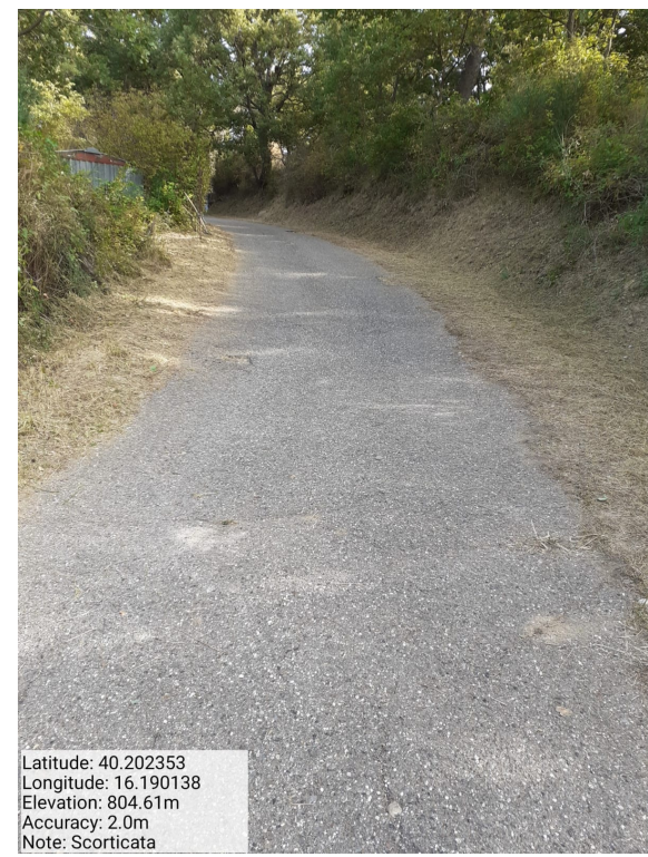
Int.6.3.17 - Scorticata - Foto 1