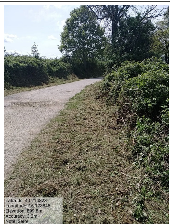
Int.6.3.23 - Serre - Foto 2