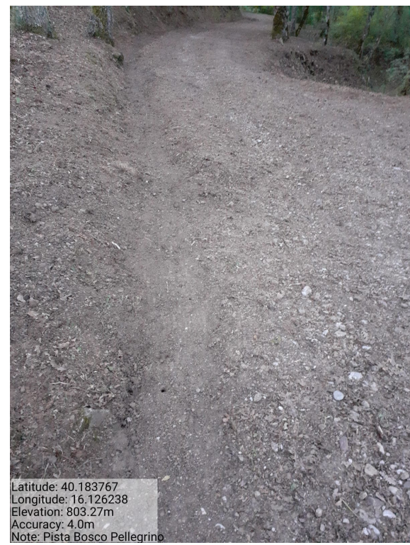
Int. 4.2.2 - Bosco Pellegrino - Foto 1