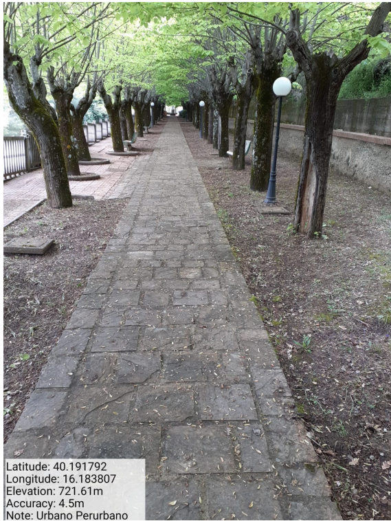
Int.2.1.1-Verde Urbano e Periurbano - Foto 1