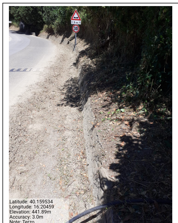
Int.6.3.12 - Terzo - Foto 2