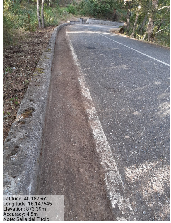
Int.6.3.28.2 – Sella del Titolo -Foto 2