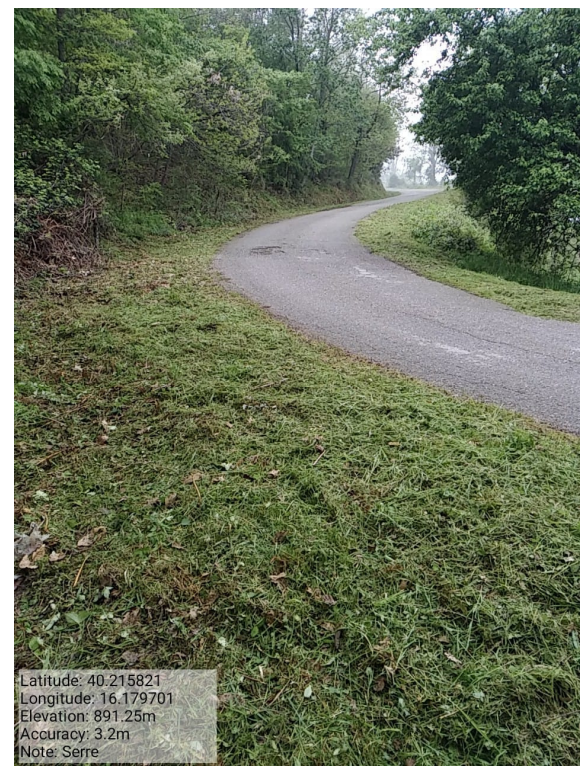
Int.6.3.23 - Serre - Foto 1