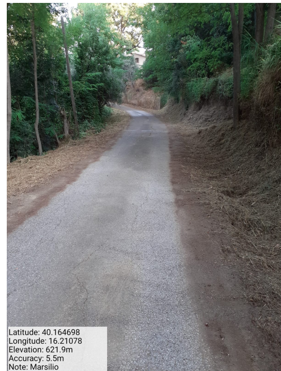
Int. 6.3.7.1 - Marsilio - Foto 1