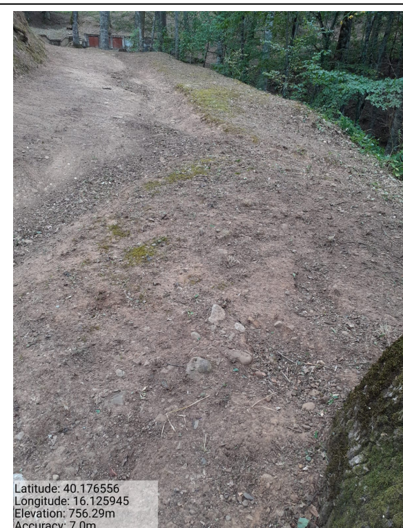
Int. 1.1.3 – Bosco Pellegrino - Foto 4