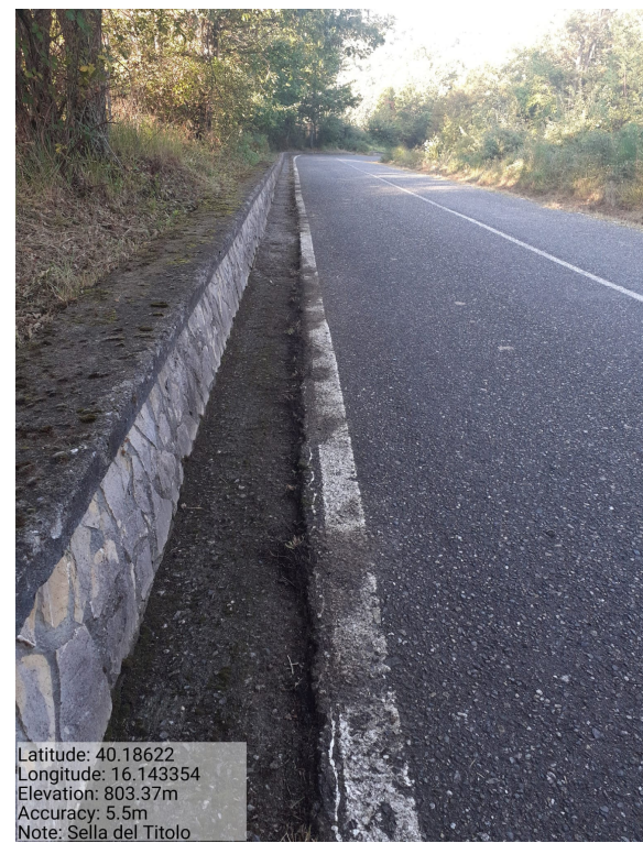
Int.6.3.28.2 – Sella del Titolo - Foto 3