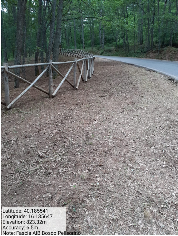
Int.1.1.1 - Bosco Pellegrino - Foto 1