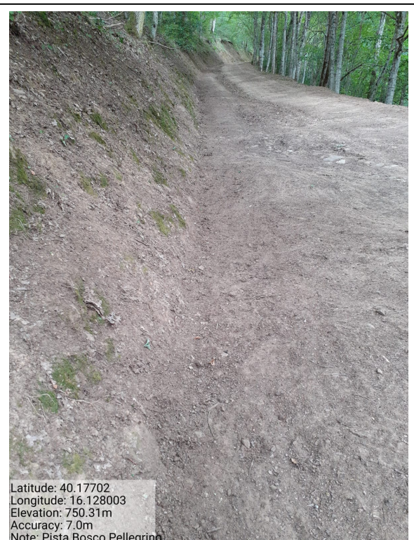
Int. 4.2.2 - Bosco Pellegrino - Foto 2