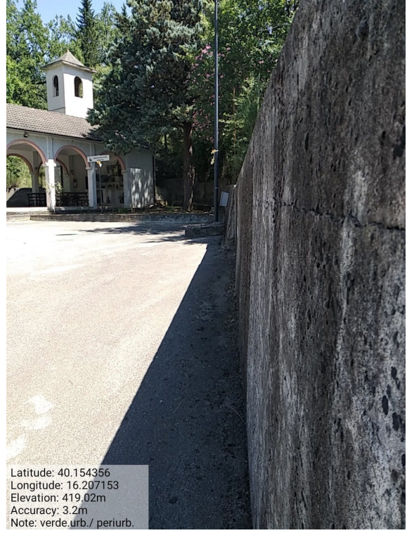
Int.2.1.1-Verde Urbano e Periurbano - Foto 2