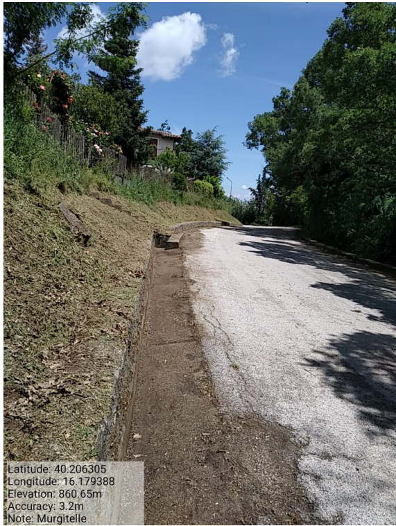
Int.6.3.4.1 - Murgitelle - Foto 1