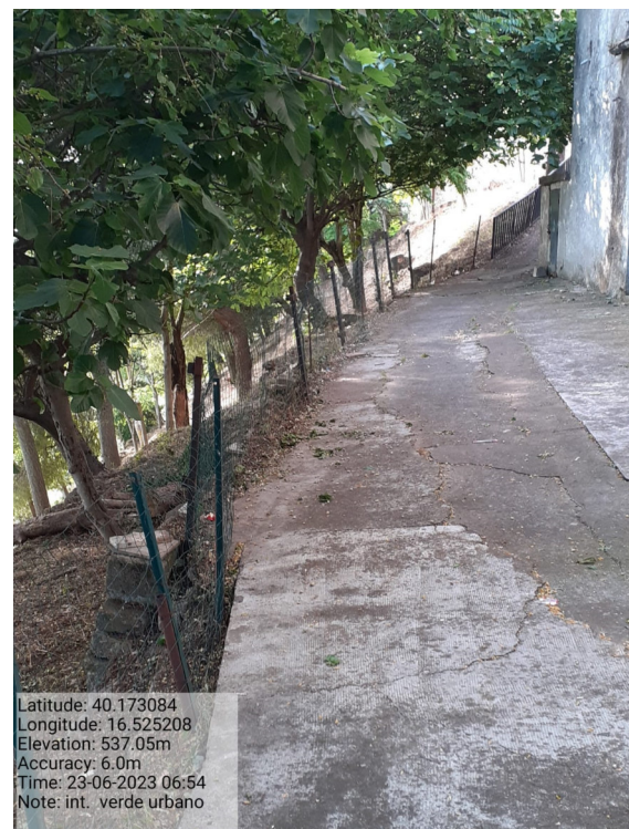
Int. 2 ROTONDELLA – Foto 3