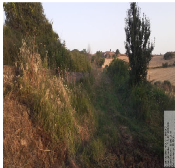
Int. 2.1.1 - Foto 11