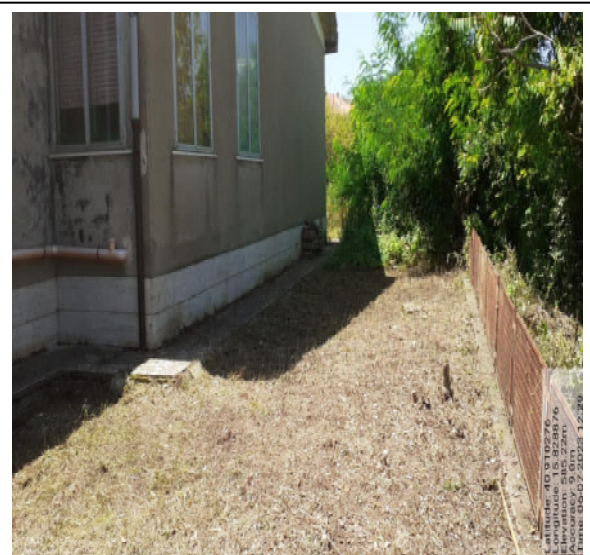
Int. 2.1.1 - Foto 8