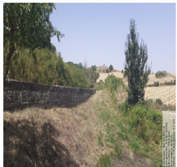
Int. 2.1.1 - Foto 12