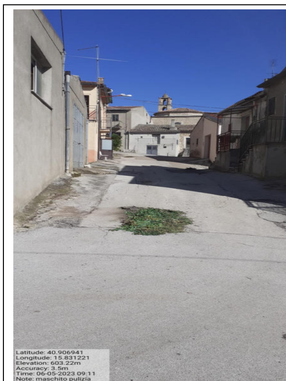
Int. 2.1.1 - Foto 4