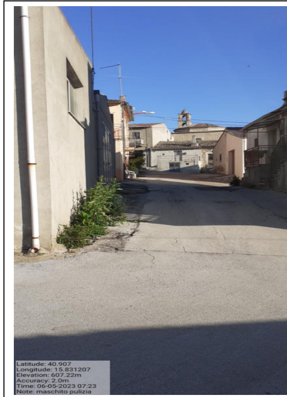
Int. 2.1.1 - Foto 3