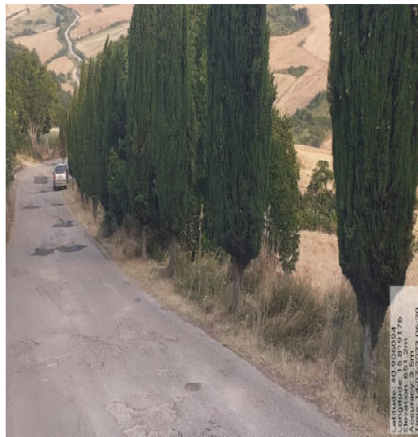
Int. 6.3.i.1/2 - Foto 9