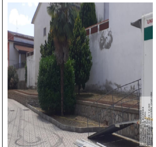
Int. 2.1.1 - Foto 6