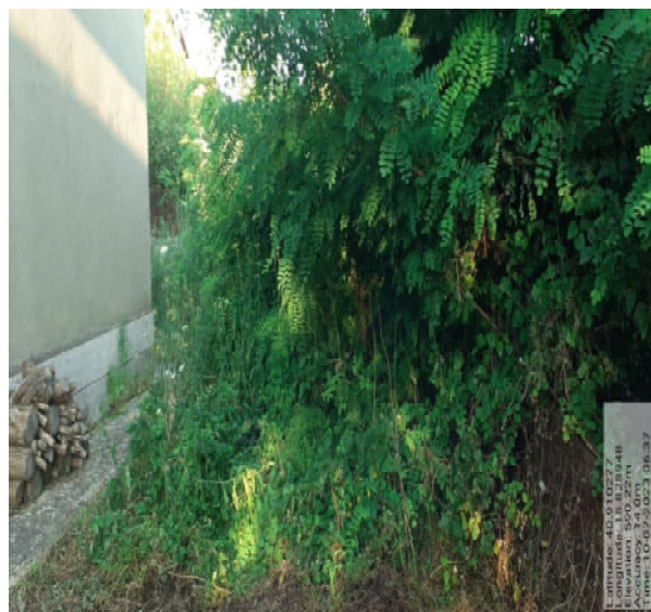
Int. 2.1.1 - Foto1