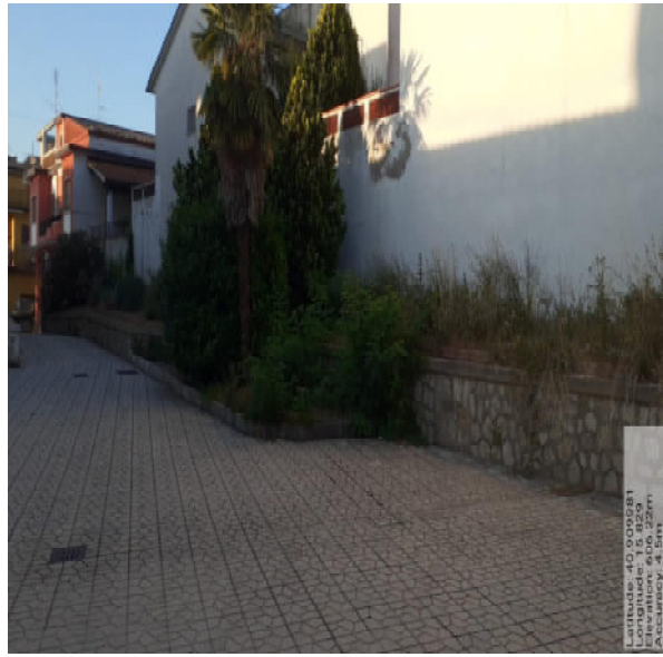
Int. 2.1.1 - Foto 5