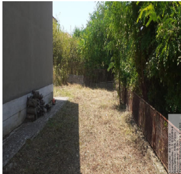
Int. 2.1.1 - Foto 2