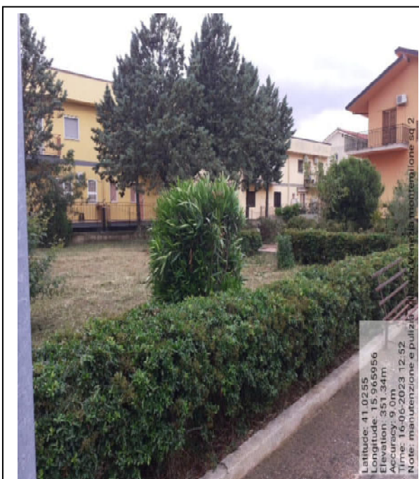
Int. 2.1.1 - Foto 8