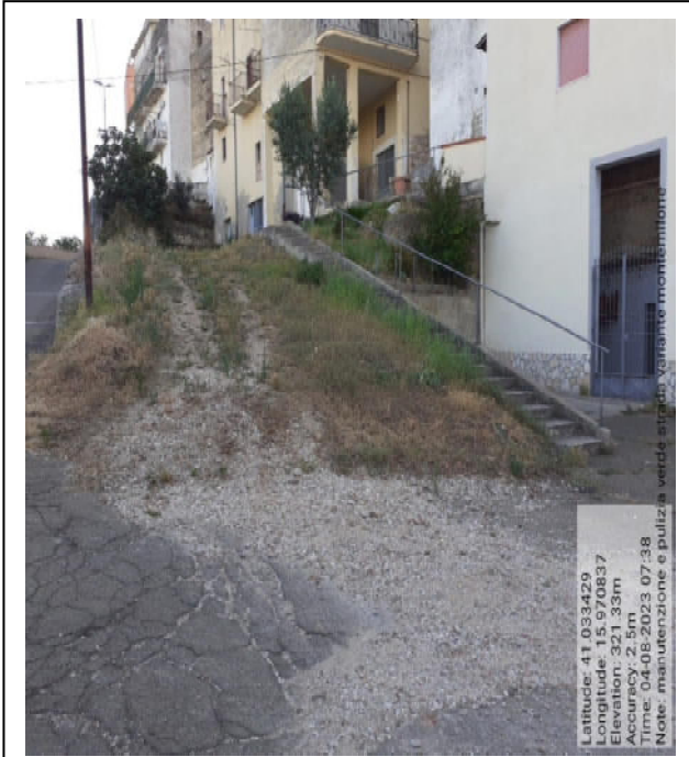
Int. 2.1.1 - Foto1