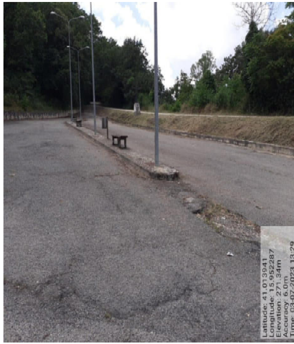
Int. 2.1.1 - Foto 6