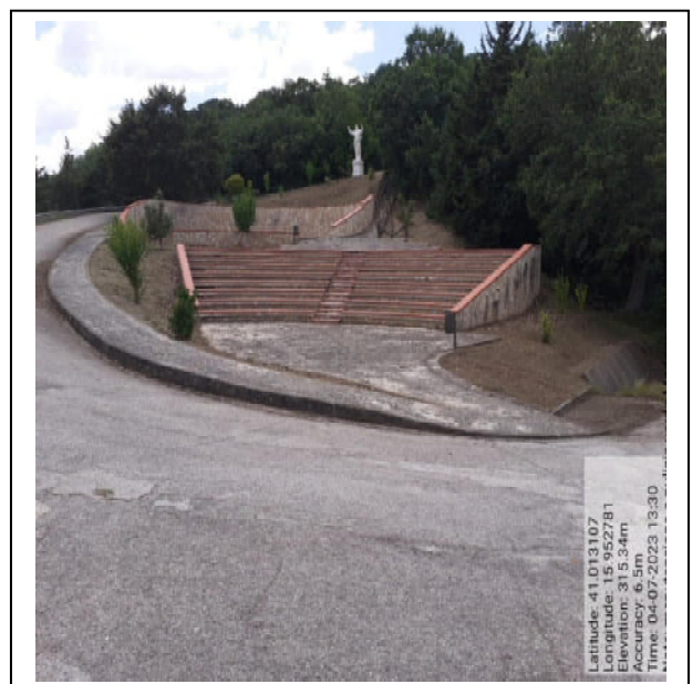
Int. 2.1.1 - Foto 4