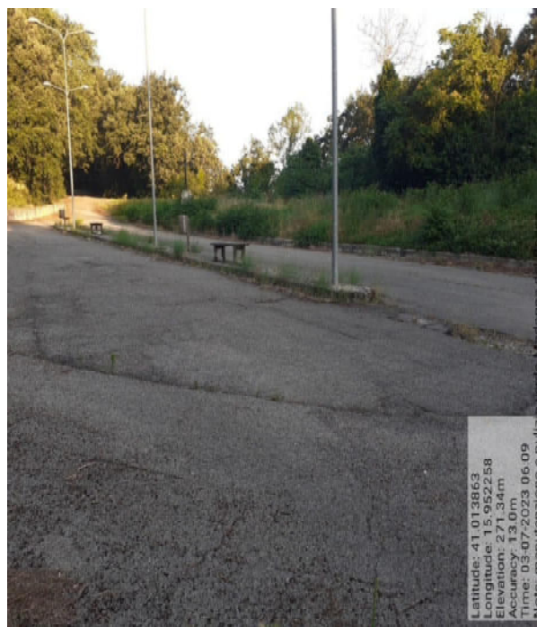
Int. 2.1.1 - Foto 5