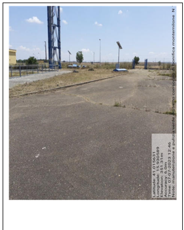
Int. 6.4.2- Foto 12