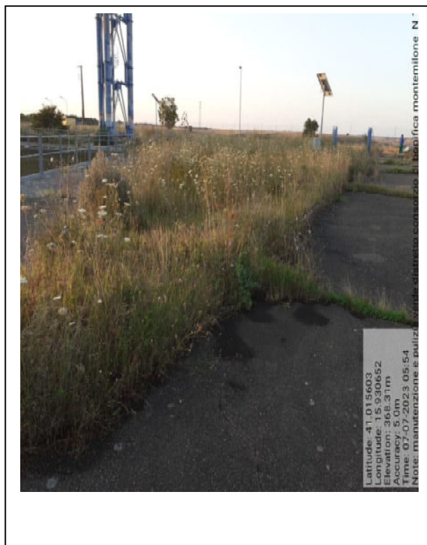
Int. 6.4.2 - Foto 11