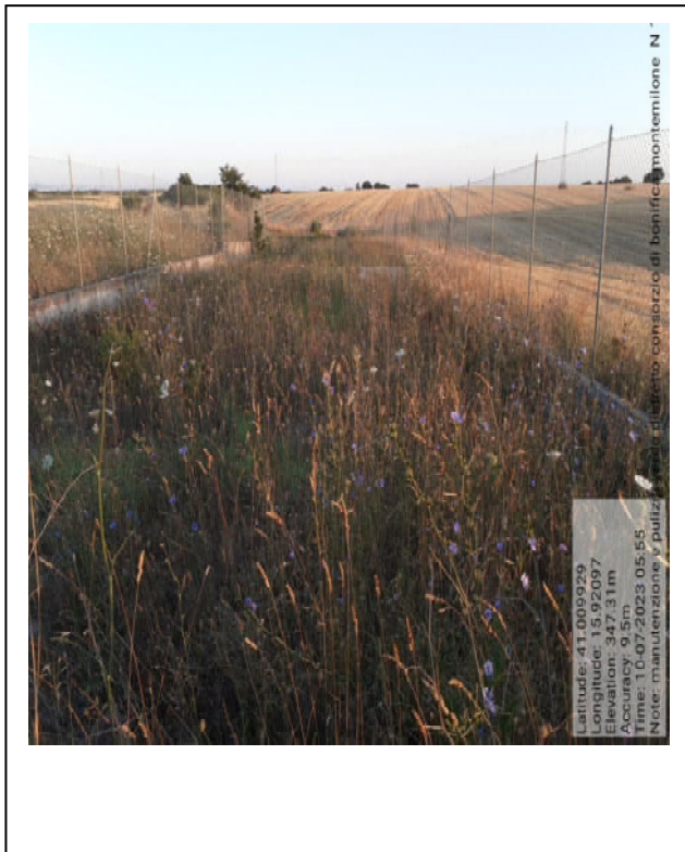
Int. 6.4.2 - Foto 9