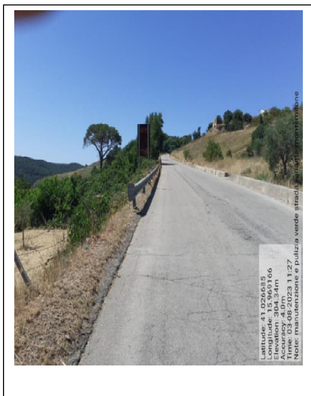
Int. 6.3.i.1/2 - Foto 16