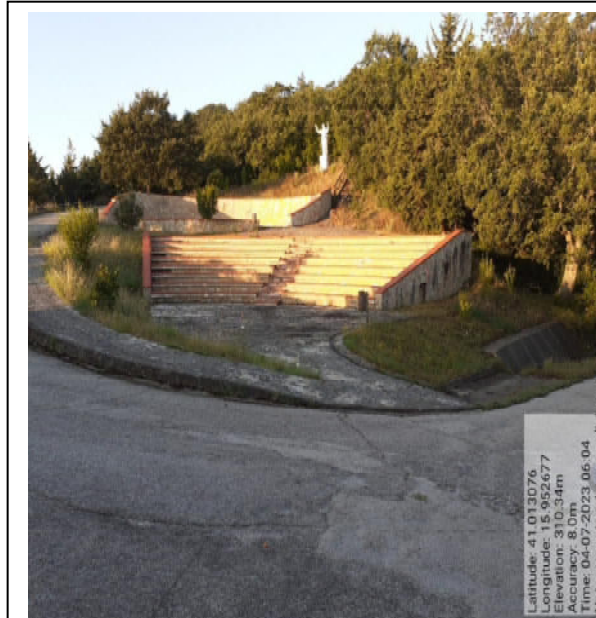
Int. 2.1.1 - Foto 3