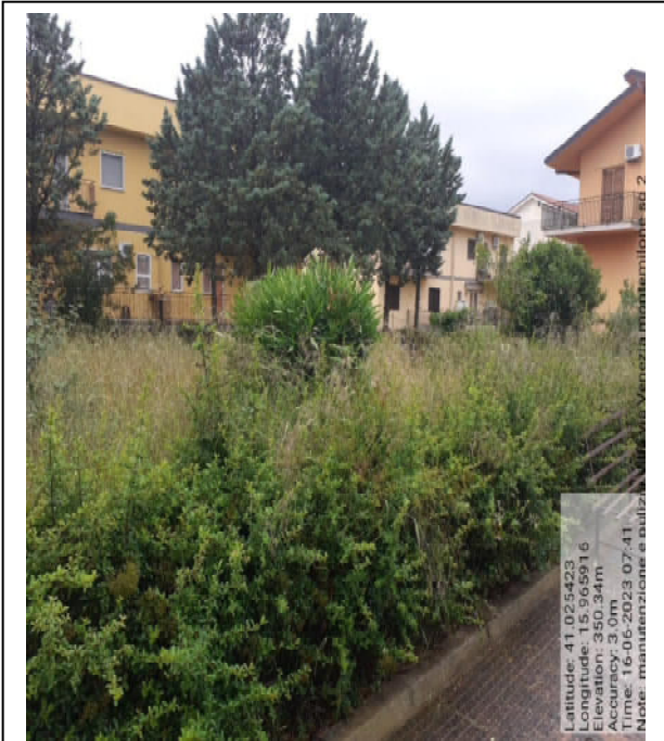
Int. 2.1.1 - Foto 7