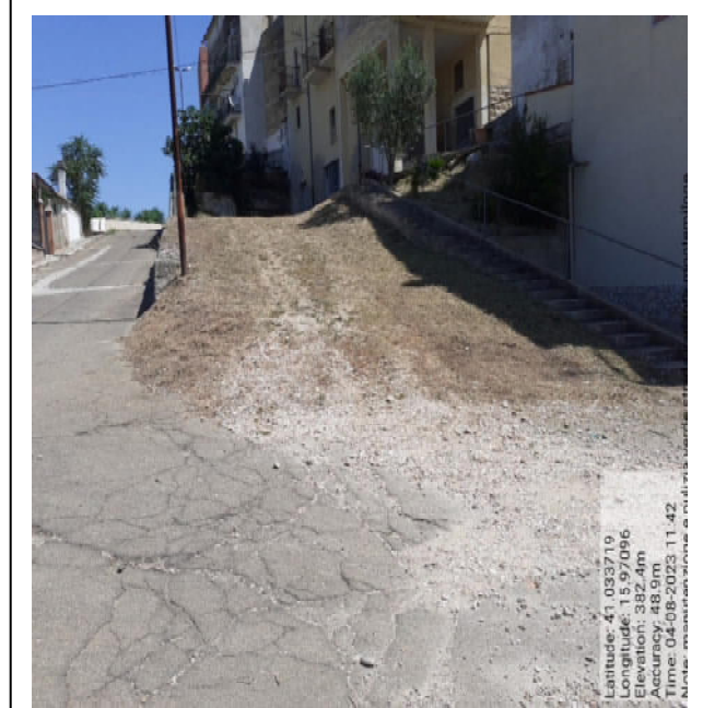
Int. 2.1.1 - Foto 2