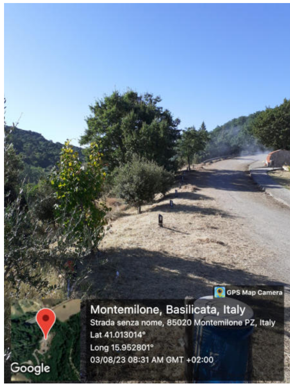
Int. 6.3.i.1/2 - Foto 14