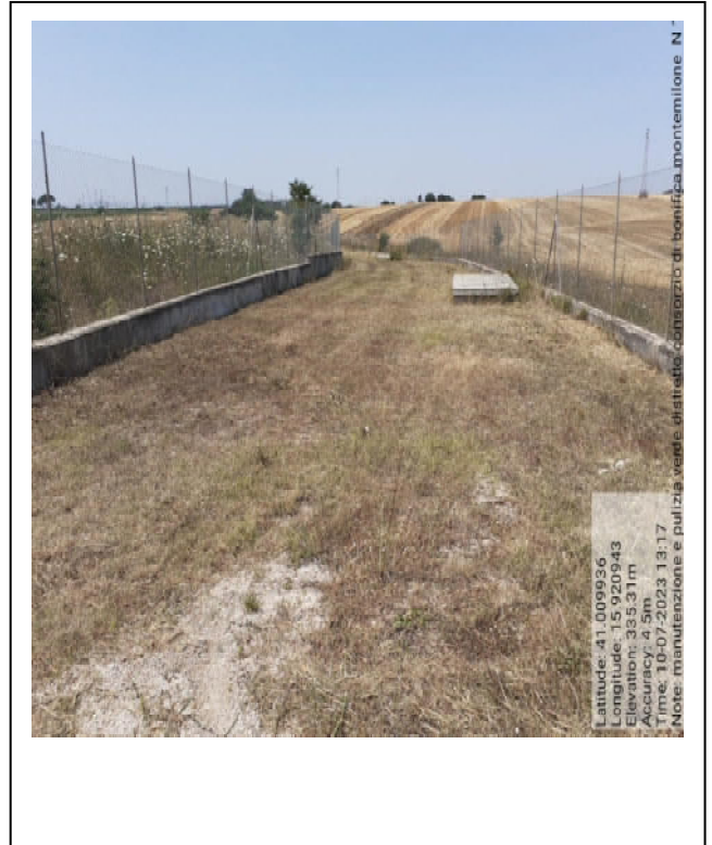
Int. 6.4.2 - Foto 10