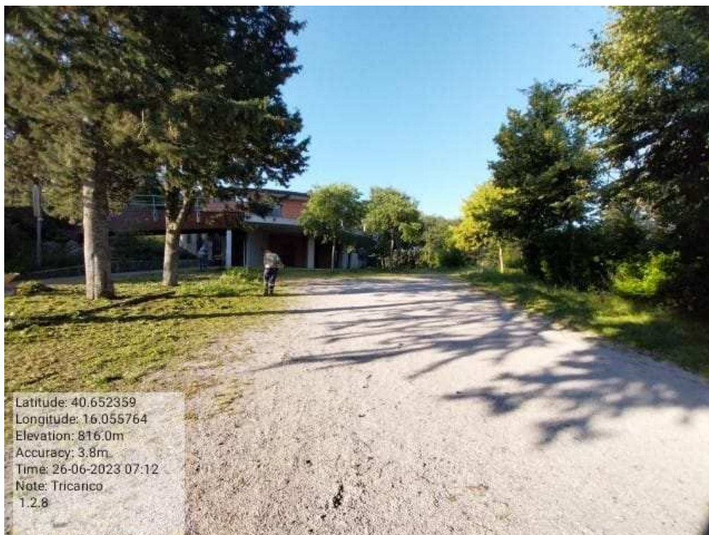
INTERVENTO 1.2.8 - TRICARICO Fg.50 Part.168 Loc.Fonti perimetro Santuario di Font DURANTE