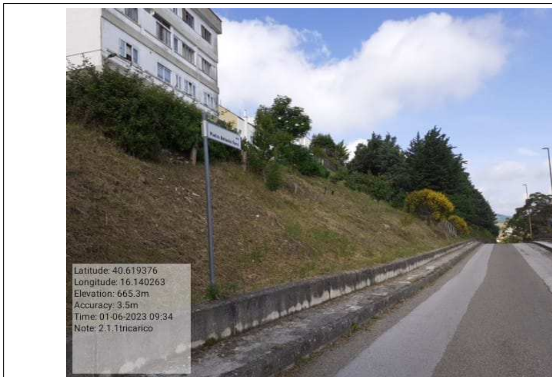
INTERVENTO 2.1.1 - TRICARICO VERDE URBANO VIA DON PANCRAZIO TOSCANO DOPO