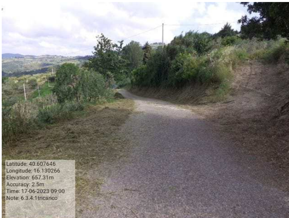
INTERVENTO 6.3.4..1 - TRICARICO STRADA COMUNALE MALCANALE 3 DOPO