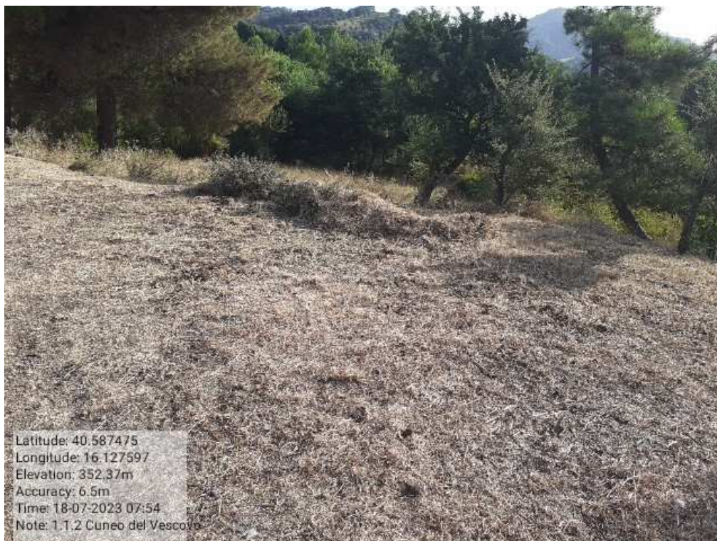
INTERVENTO 1.1.2 - TRICARICO Fig.77 part.32-33- 16-134 Loc Mantenera Malcanale Cugno del Vescovo