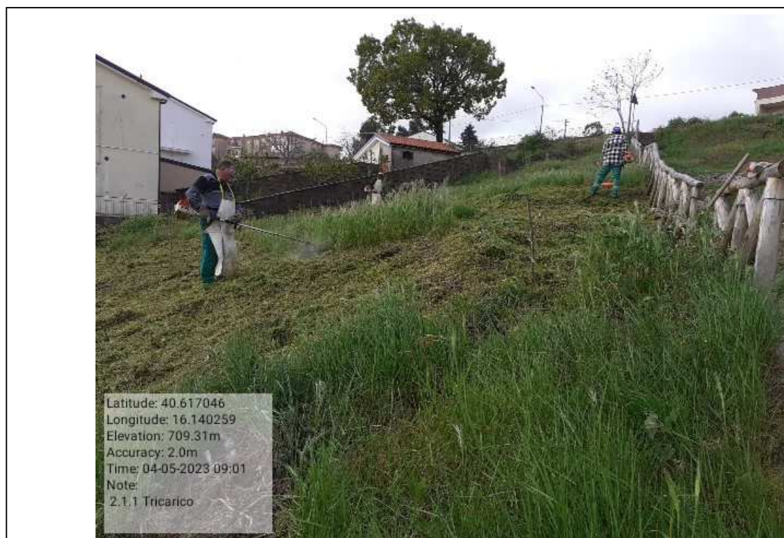
INTERVENTO 2.1.1 - TRICARICO VERDE URBANO DURANTE