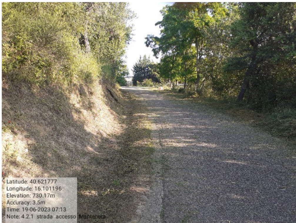
INTERVENTO 4.2.1 TRICARICO Fg 62 STRADA DI ACCESSO ALLA FORESTA MALCANALE DOPO