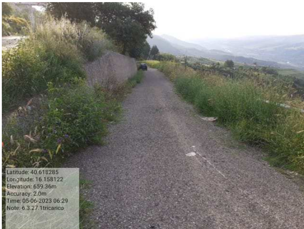
INTERVENTO 6.3.27 - TRICARICO STRADA CAPRINA FG.66 PRIMA