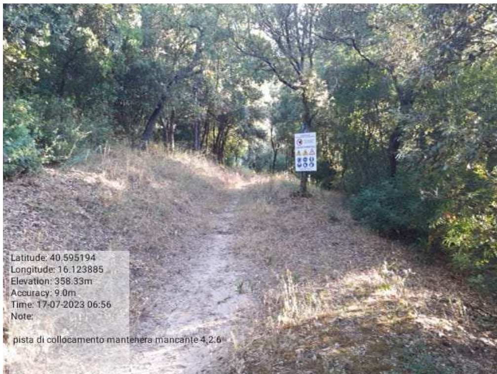
INTERVENTO 4.1.6 - TRICARICO Fg.77 Part. Strade - Pista di Collegamento For mantenera - Zona Malcanal PRIMA