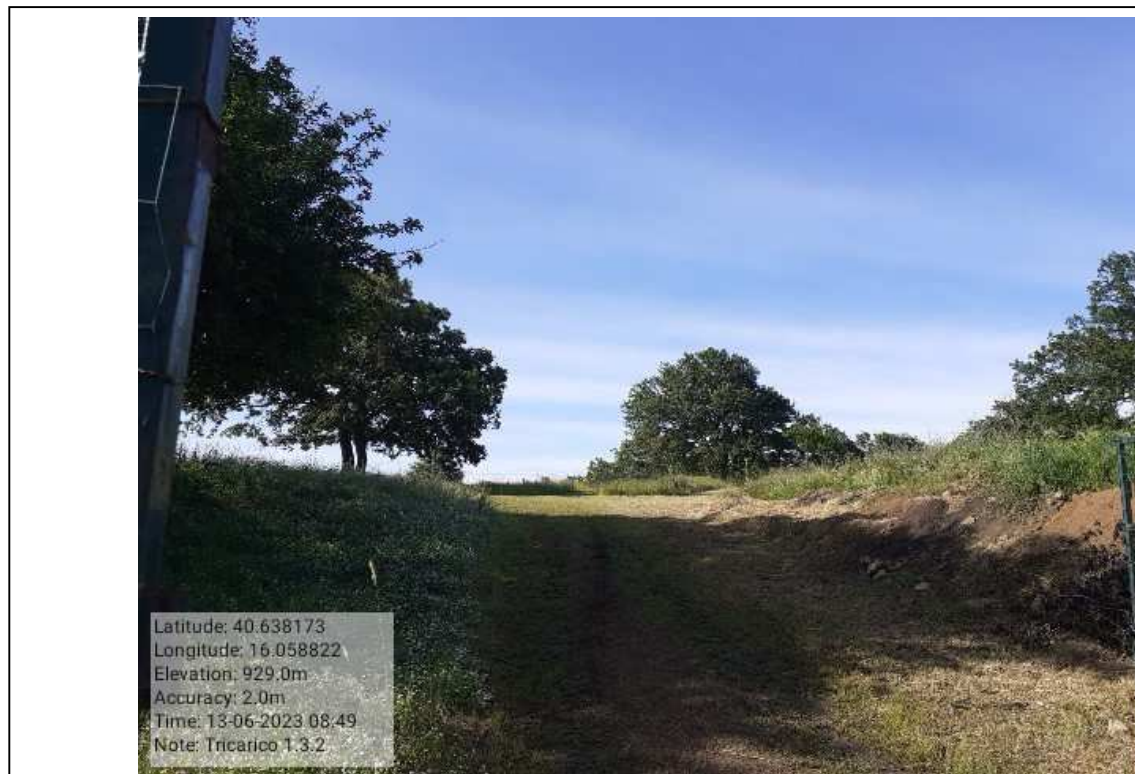
INTERVENTO 1.3.2 - TRICARICO Tricarico Fg.50 part.171 CIVITA PRIMA