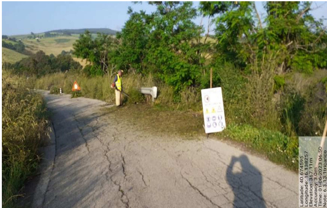
INTERVENTO 6.3.13 - TRICARICO Fg. 46-45-33-34-11-12-4 Strada Comunale Albanello-Cucno della Pic DURA