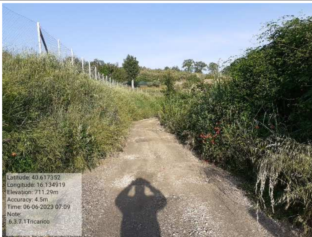
INTERVENTO 6.3.7.1 - TRICARICO