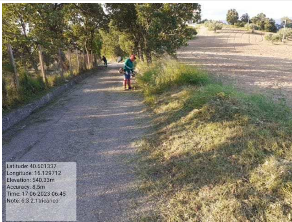
INTERVENTO 6.3.2.1.- TRICARICO STRADA COMUNALE MALCANALE 1 DURANTE