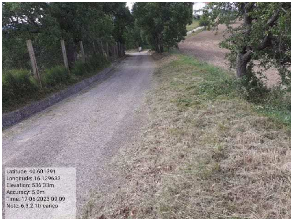
INTERVENTO 6.3.2.1.- TRICARICO STRADA COMUNALE MALCANALE 1 DOPO