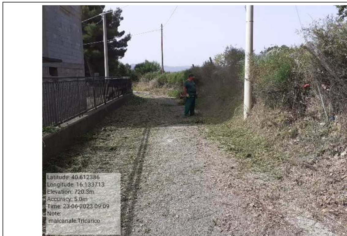
INTERVENTO 6.3.8.1.- TRICARICO STRADA COMUNALE MALCANALE 6 FG. 64 DURANTE