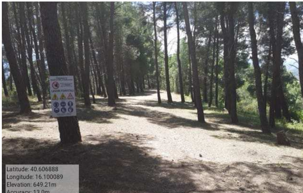
INTERVENTO 1.1.3- TRICARICO Fg.62 part.125- 139-70 Loc. Mantenera Malcanale - Capanna vendetta DOPO