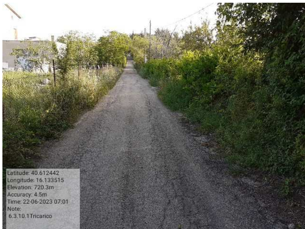
INTERVENTO 6.3.10.1- TRICARICO STRADA COMUNALE MALCANALE 7 FG. 64 PRIMA