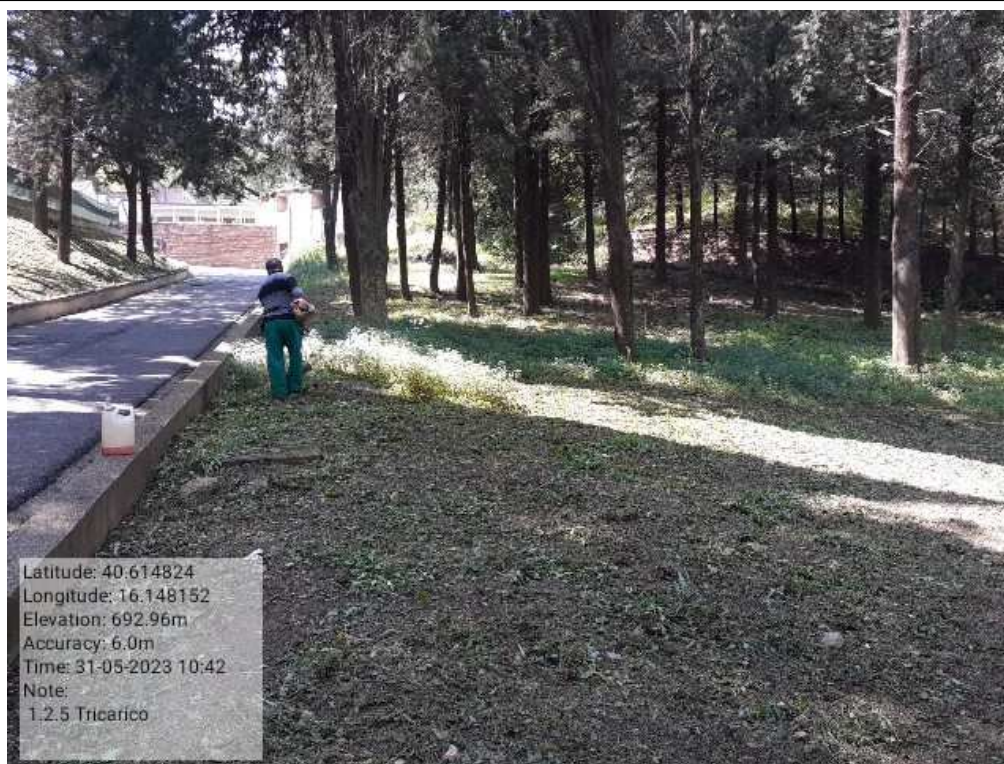
INTERVENTO 1.2.5 - TRICARICO