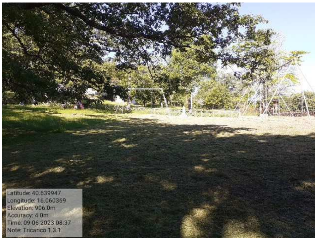
INTERVENTO 1.3.1 - TRICARICO Fg.50 part.171 Loc.Trecancelli area attrezzata DURANTE