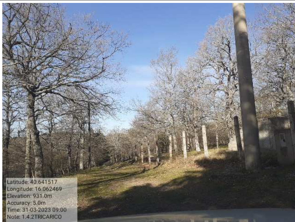
INTERVENTO 1.4.2 TRICARICO Fg.42 part.242 Loc.Trecancelli (strada interna trecancelli diramazione PRIMA