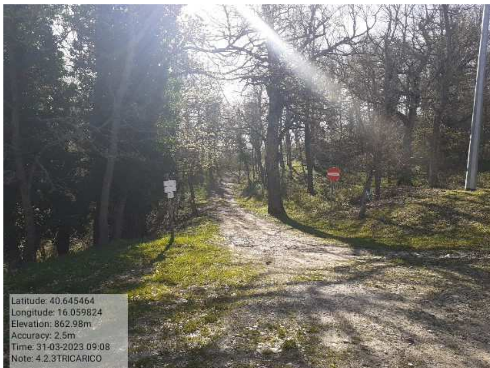
INTERVENTO1.2.3 - TRICARICO Fg.42 Part.184 - Loc.Trecancelli - Fonti fascia perimetrale al Camping Don Girola PRIMA