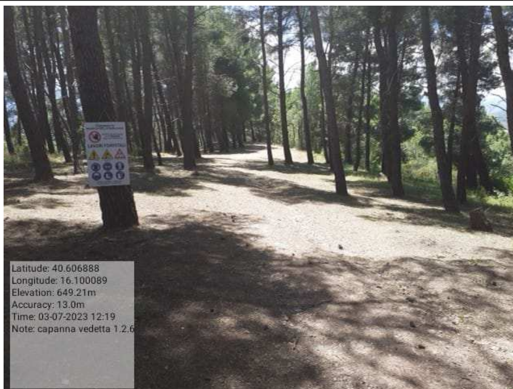
INTERVENTO 1.2.6 - TRICARICfg.62 Part.125-33- 141-272-271 Foresta Mantenera - Capanna Vedetta DURAN

Latitude: 40.606888 Longitude: 16.100089 Elevation: 649.21m Accuracy: 13.0m Time: 03-07-2023 12:19 Note: capanna vedetta 1.2.6