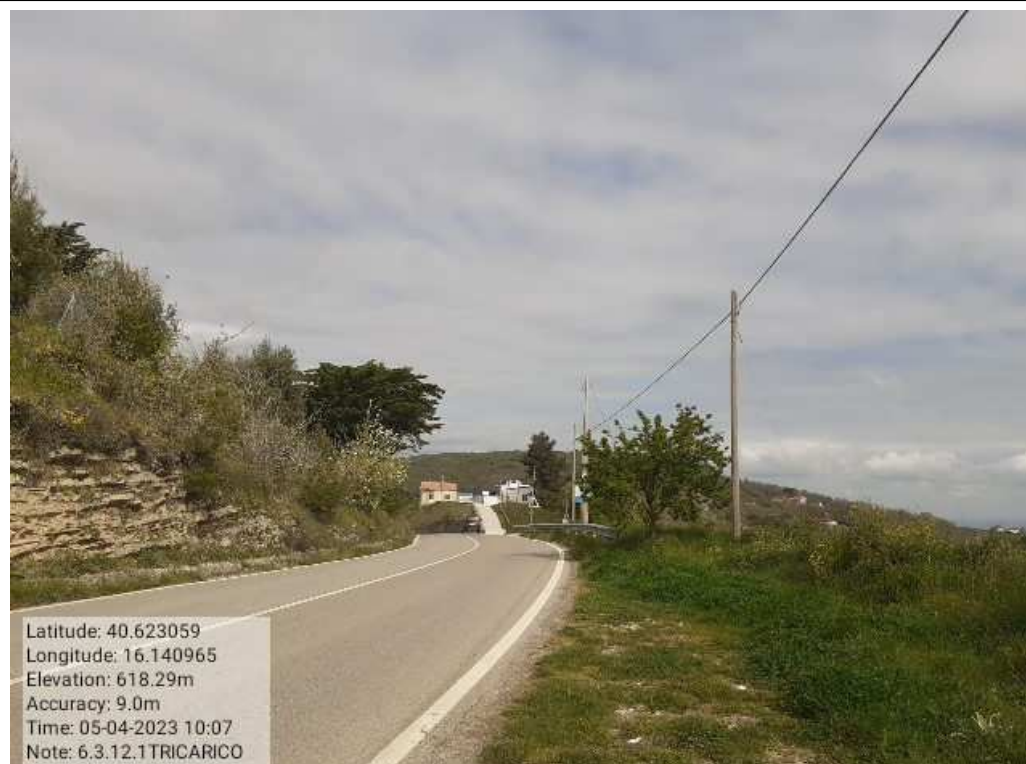
INTERVENTO 6.3.12.1- TRICARICO STRADA ROVINCIALE BOCCANERA FG6 PRIMA