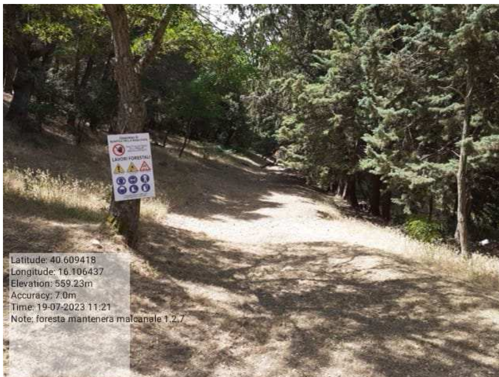
INTERVENTO 1.2.7 - TRICARICO Fg.62 Part.28-124- 24-122 Foresta Mantenera Malcanale DOPO