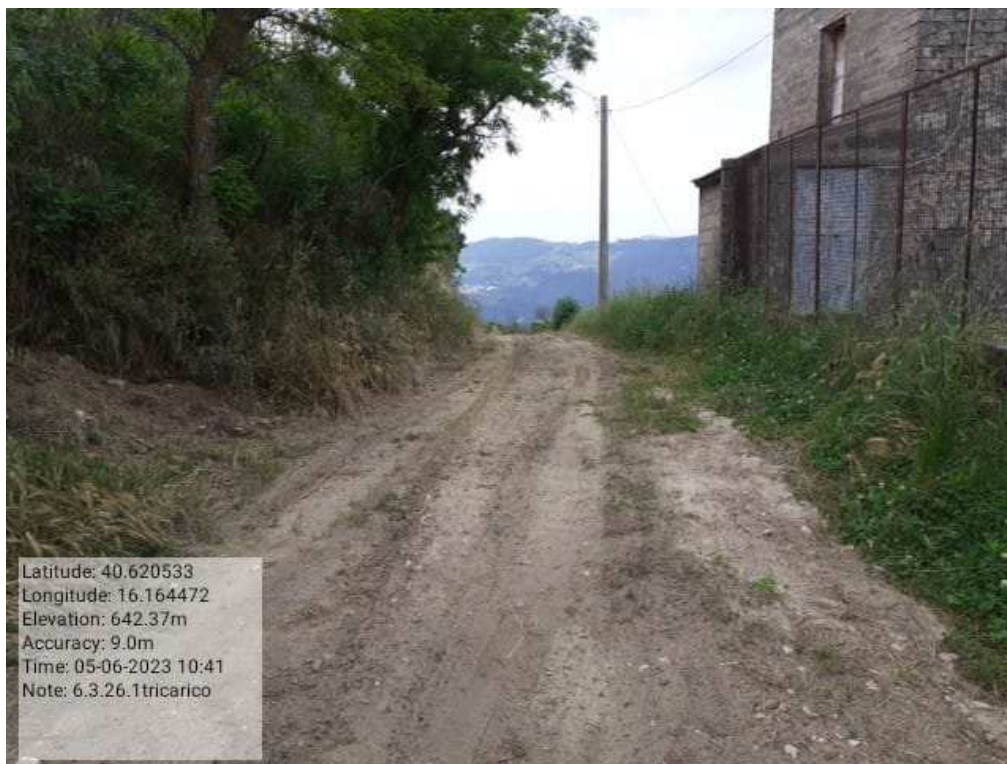
INTERVENTO 6.3.26.- TRICARICO EX COLLEGAMENTO BASENTANA FG.66-67 PRIMA