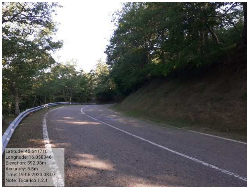
INTERVENTO1.2.1 - TRICARICO Fg.42 Part.184 Loc.Trecancelli- DOPO