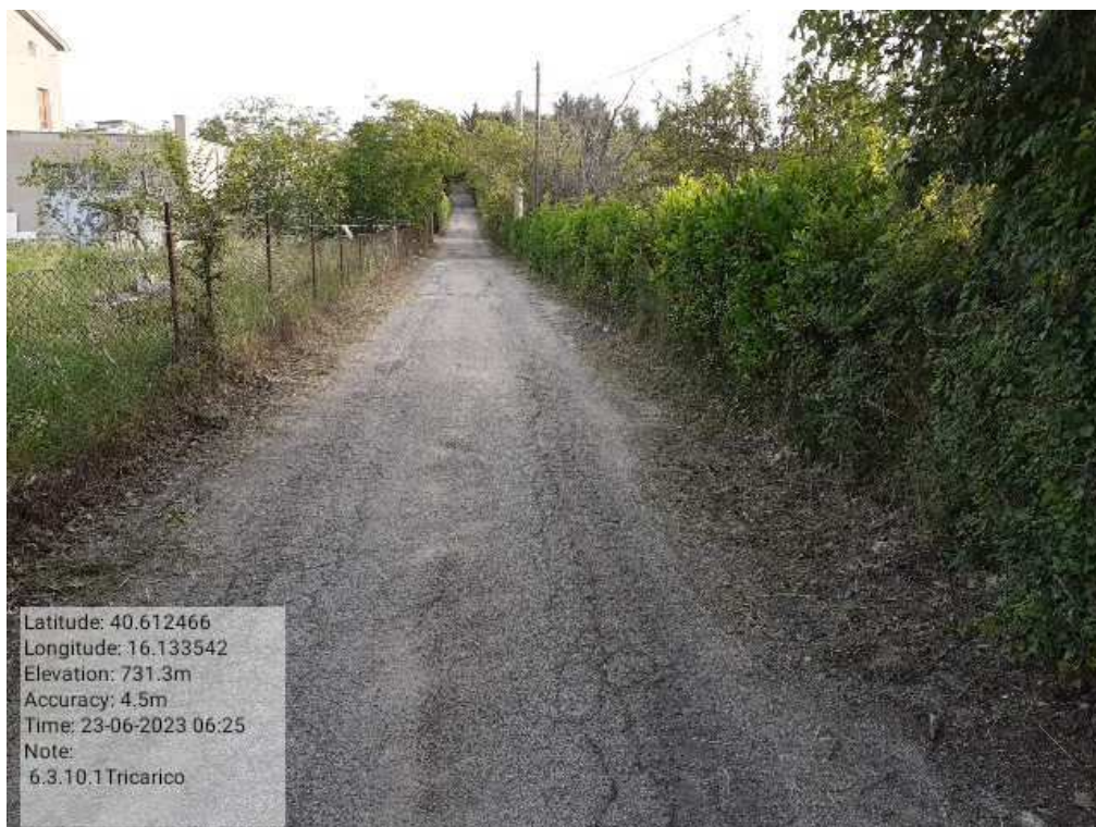
INTERVENTO 6.3.10.1- TRICARICO STRADA COMUNALE MALCANALE 7 FG. 64 DOPO