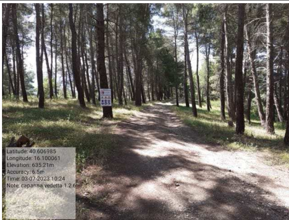
INTERVENTO 1.2.6 - TRICARICFg.62 Part.125-33- 141-272-271 Foresta Mantenera - Capanna Vedetta PRIMA