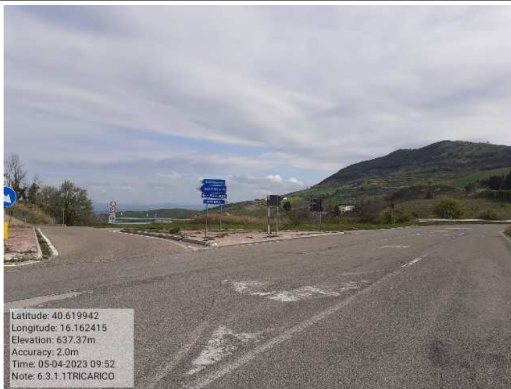
INTER 6.3.1 - TRICARICO COLLEGAMENTO BASENTANA IANO DELLE GINESTRE FG PRIMA