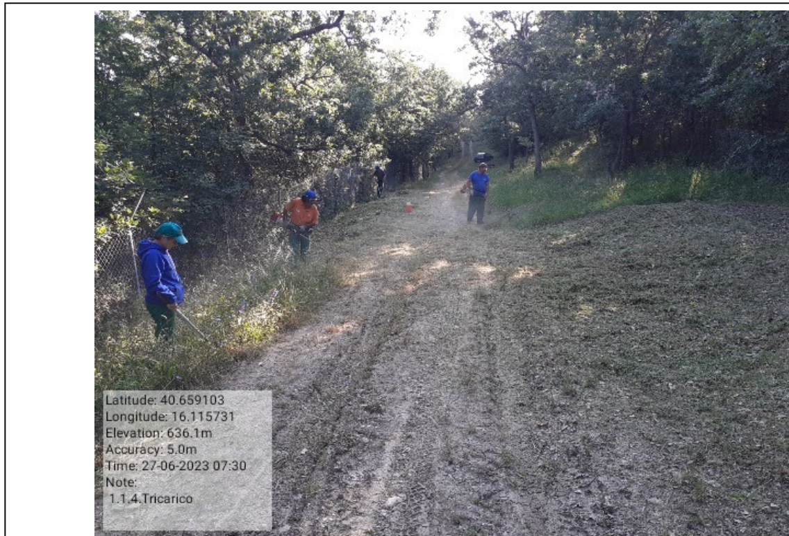
INTERVENTO 1.1.4. - TRICARICO Fg.11 part.1 Loc. Cugno della Pica DURANTE