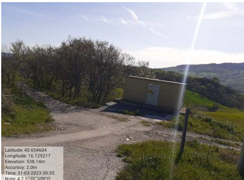
INTERVENTO 4.1.9- TRICARICO Fg. 11 Tratturo Comunale Cugno dei Greci - Strada Comunale S. Marc PRIMA