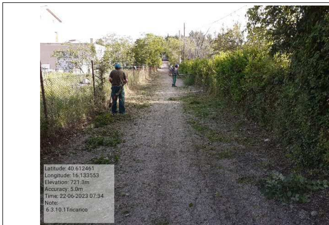
INTERVENTO 6.3.10.1- TRICARICO STRADA COMUNALE MALCANALE 7 FG. 64 DURANTE