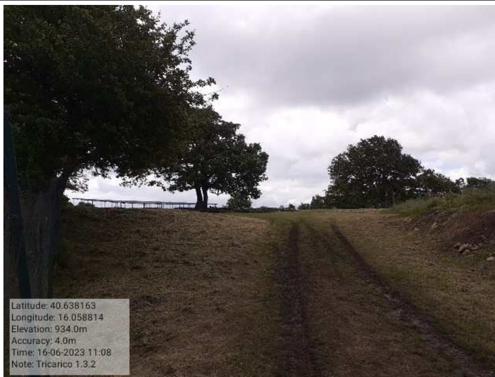
INTERVENTO 1.3.2 - TRICARICO Tricarico Fg.50 part.171 CIVITA DOPO