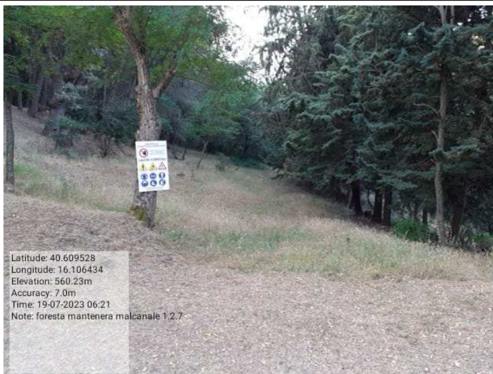
INTERVENTO 1.2.7 - TRICARICO Fg.62 Part.28-124- 24-122 Foresta Mantenera Malcanale DURANTE