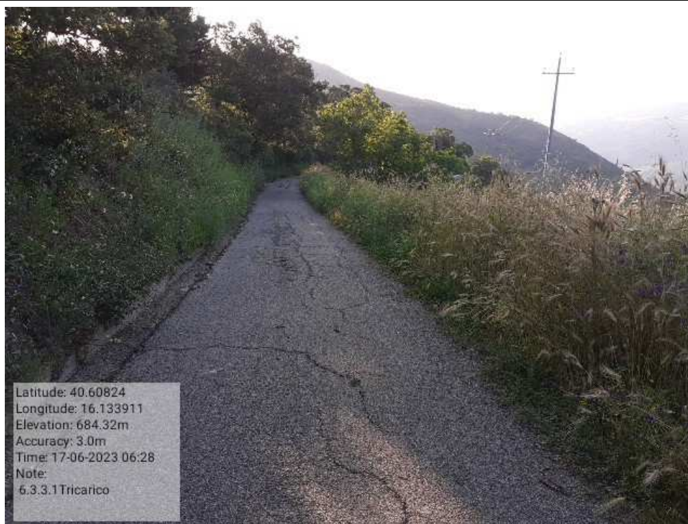
INTERVENTO 6.3.3.1- TRICARICO STRADA COMUNALE MALCANALE 2 PRIMA