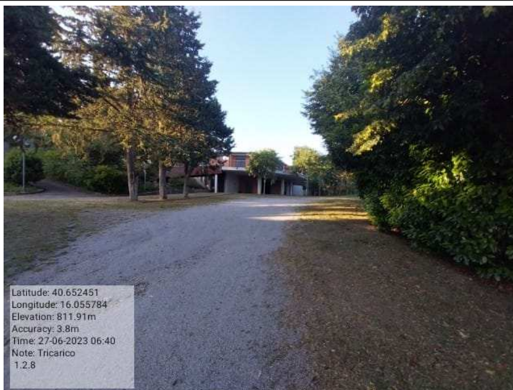
INTERVENTO 1.2.8 - TRICARICO Fg.50 Part.168 Loc.Fonti perimetro Santuario di Font DOPO