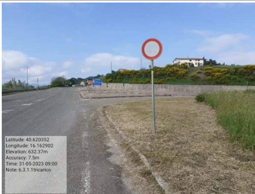
INTER 6.3.1 - TRICARICO COLLEGAMENTO BASENTANA IANO DELLE GINESTRE FG DOPO