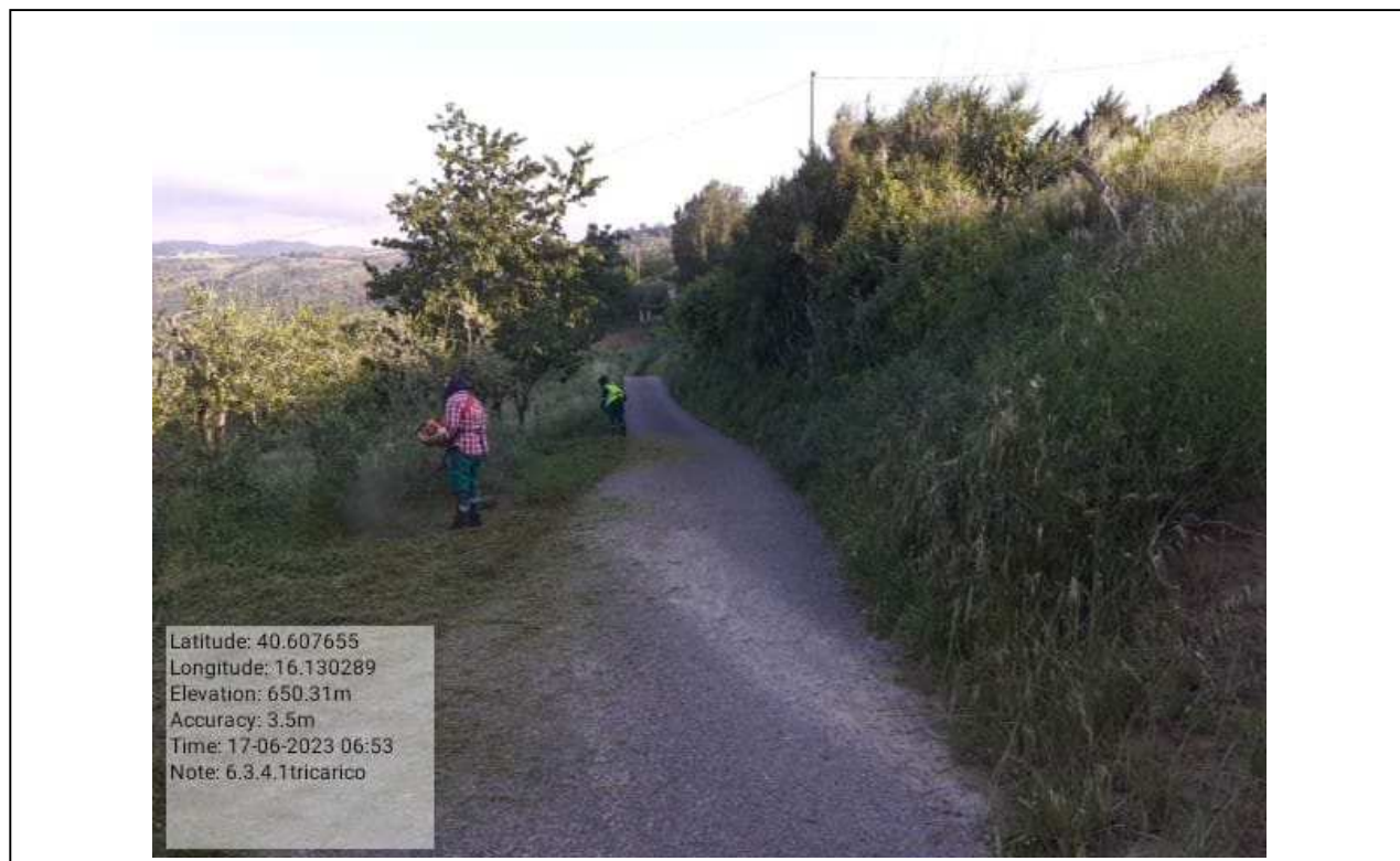
INTERVENTO 6.3.2.1 - TRICARICO STRADA COMUNALE MALCANALE 3 DURANTE