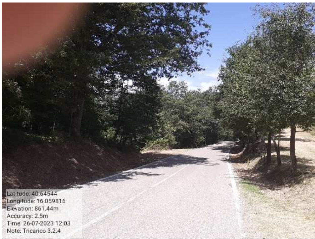
INTERVENTO 1.2.4- TRICARICO Part. Tricarico Fg.50 171 Loc.Trecancelli DOPO