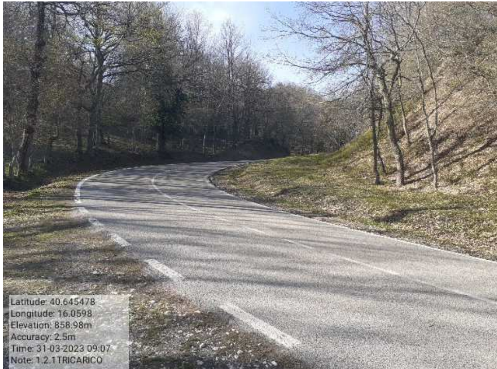
INTERVENTO1.2.1 - TRICARICO Fg.42 Part.184 Loc.Trecancelli- PRIMA