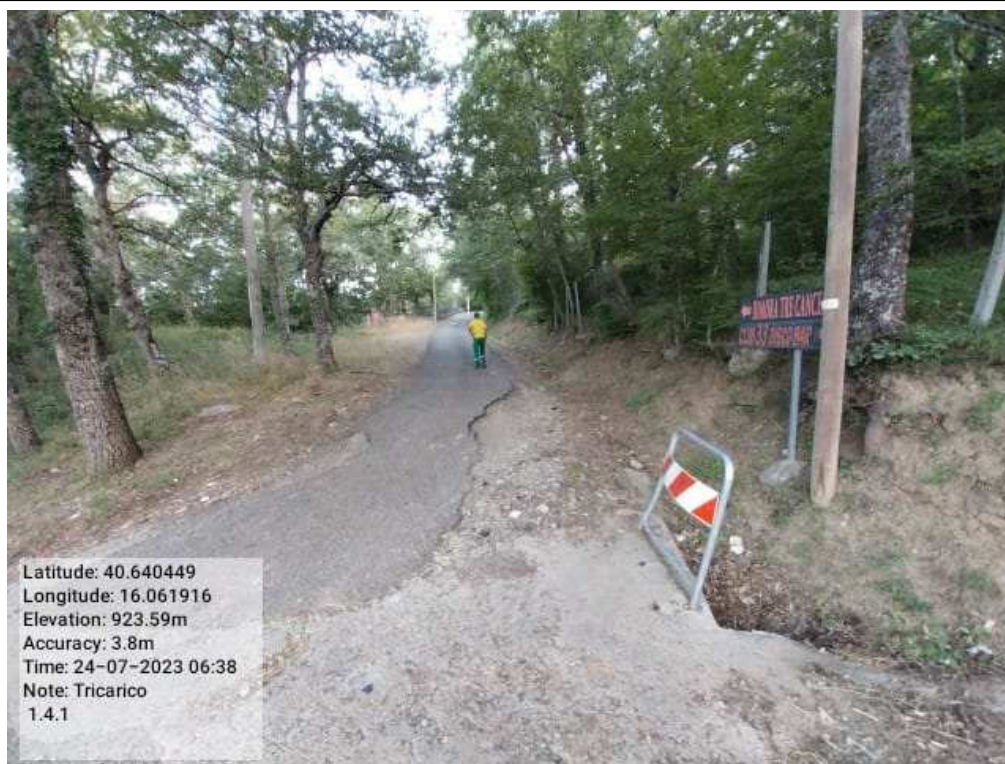
INTERVENTO 1.4.1 - TRICARICO Fg.42 part.242 Loc. Trecanc DURANTE