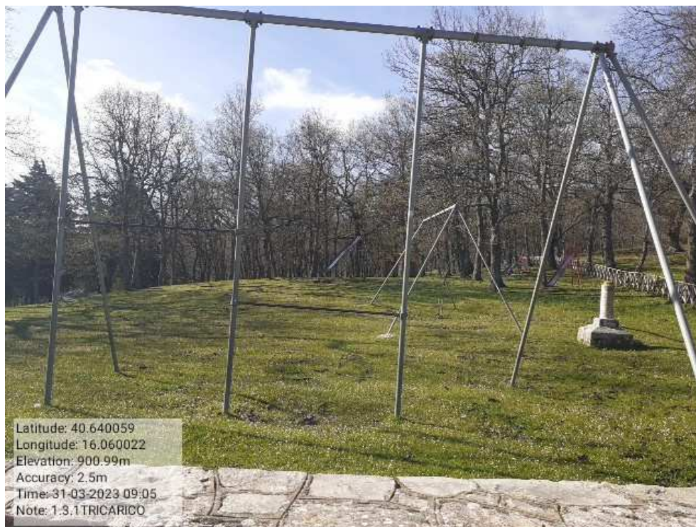
INTERVENTO 1.3.1 - TRICARICO Fg.50 part.171 Loc.Trecancelli area attrezzata PRIMA