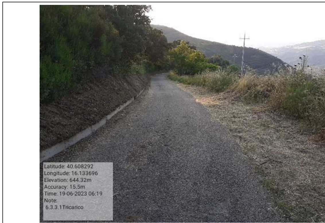
INTERVENTO 6.3.3.1- TRICARICO STRADA COMUNALE MALCANALE 2 DOPO