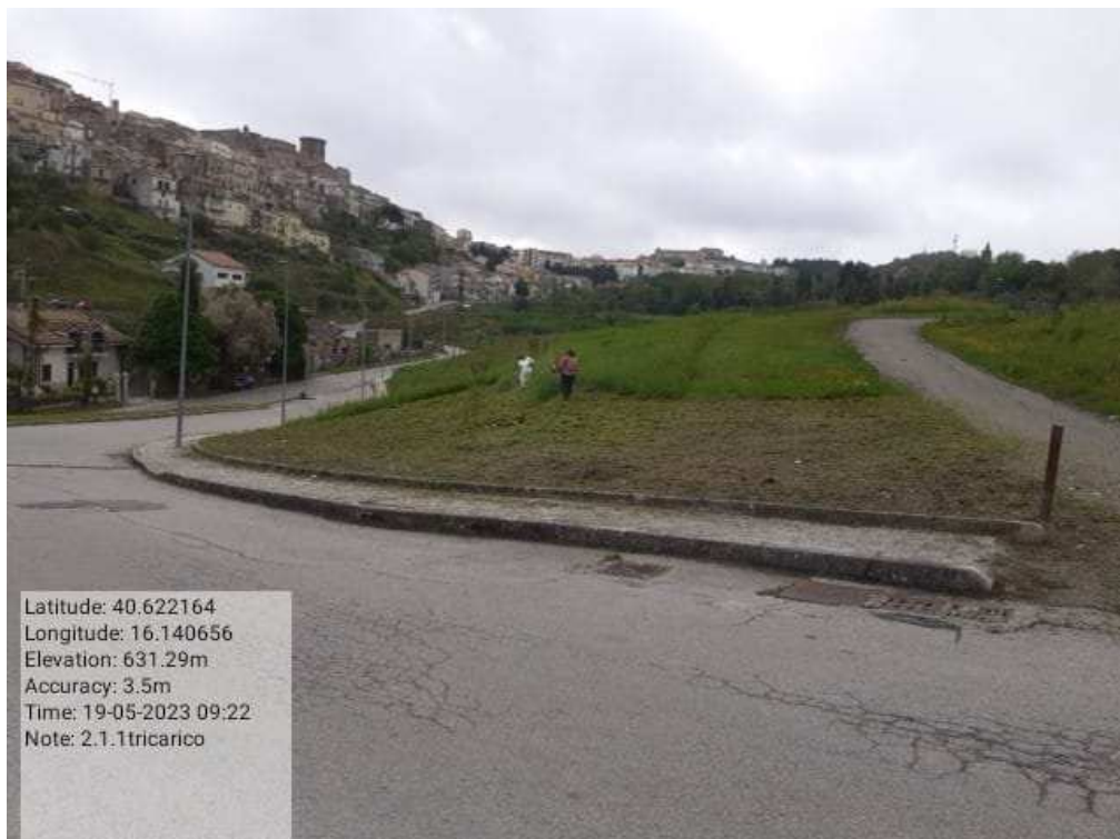
INTERVENTO 2.1.1 - TRICARICO VERDE URBANO DURANTE