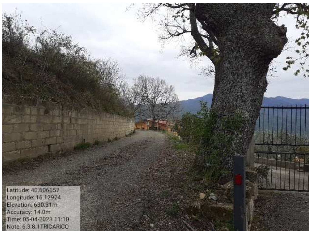
INTERVENTO 6.3.8.1.- TRICARICO STRADA COMUNALE MALCANALE 6 FG. 64 PRIMA