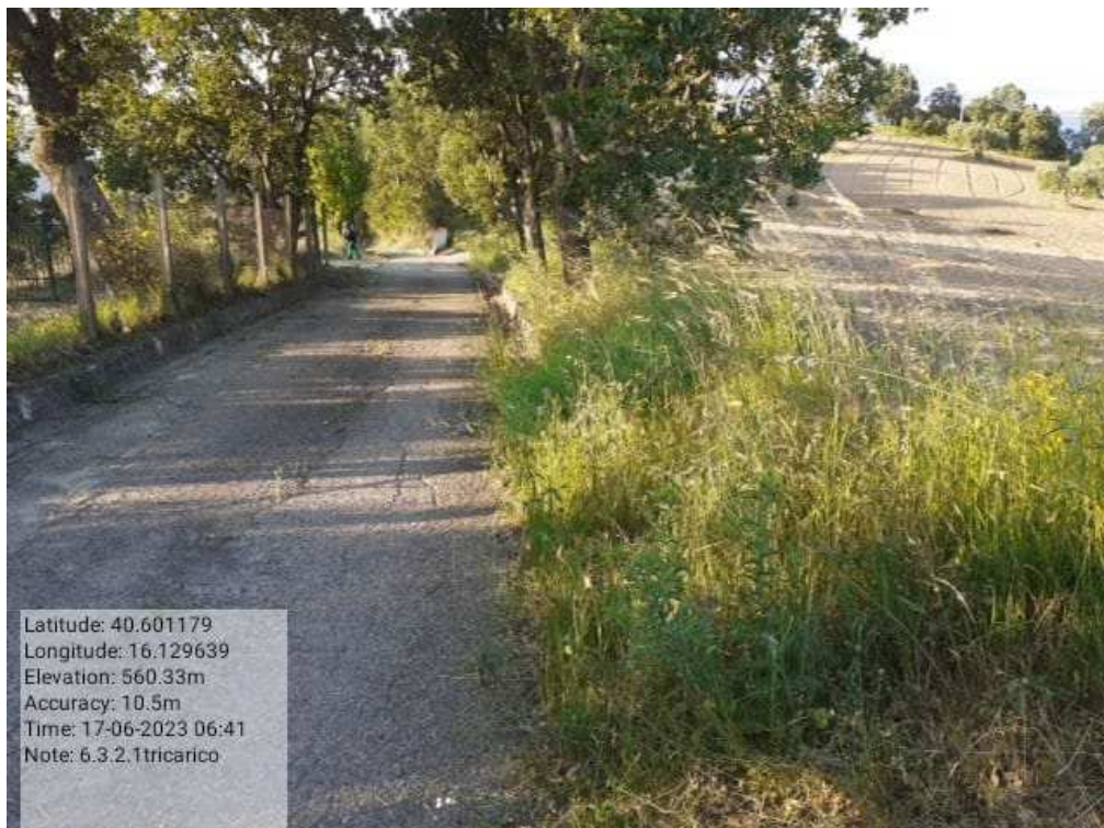
INTERVENTO 6.3.2..1.- TRICARICO STRADA COMUNALE MALCANALE 1 PRIMA