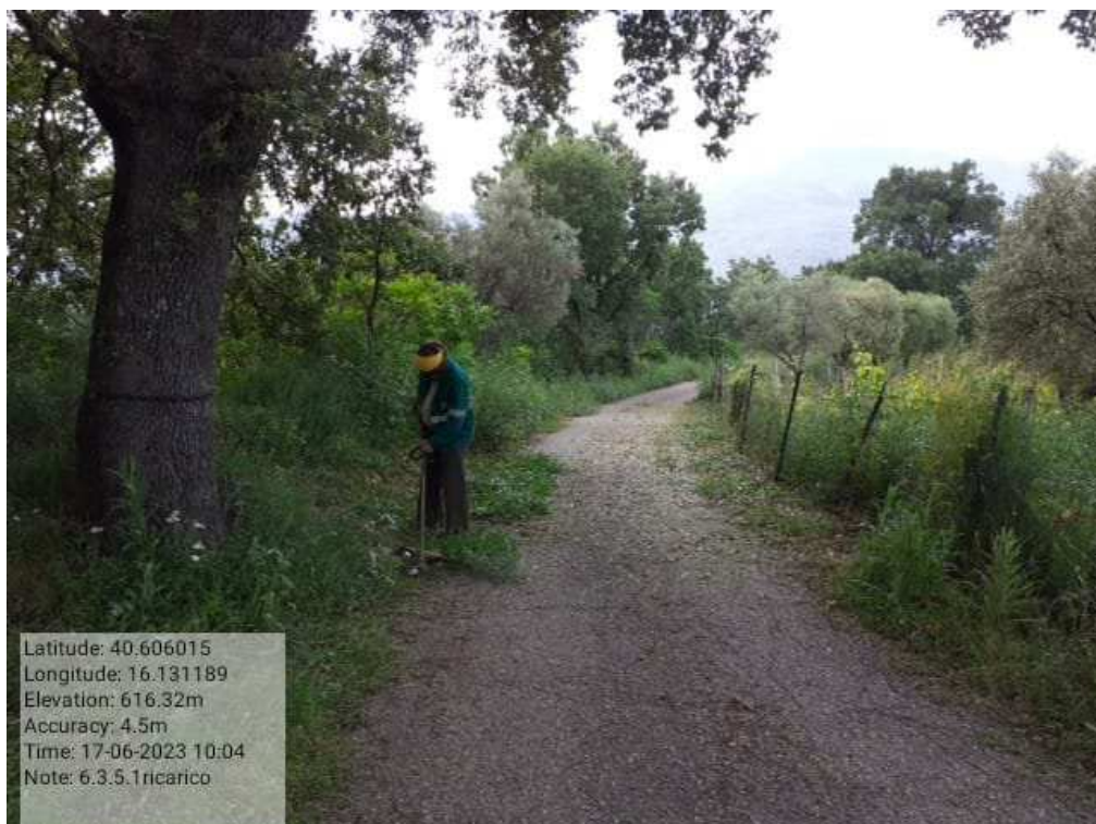
INTERVENTO 6.3.5.1.- TRICARICO STRADA COMUNALE MALCANALE 4 DURANTE