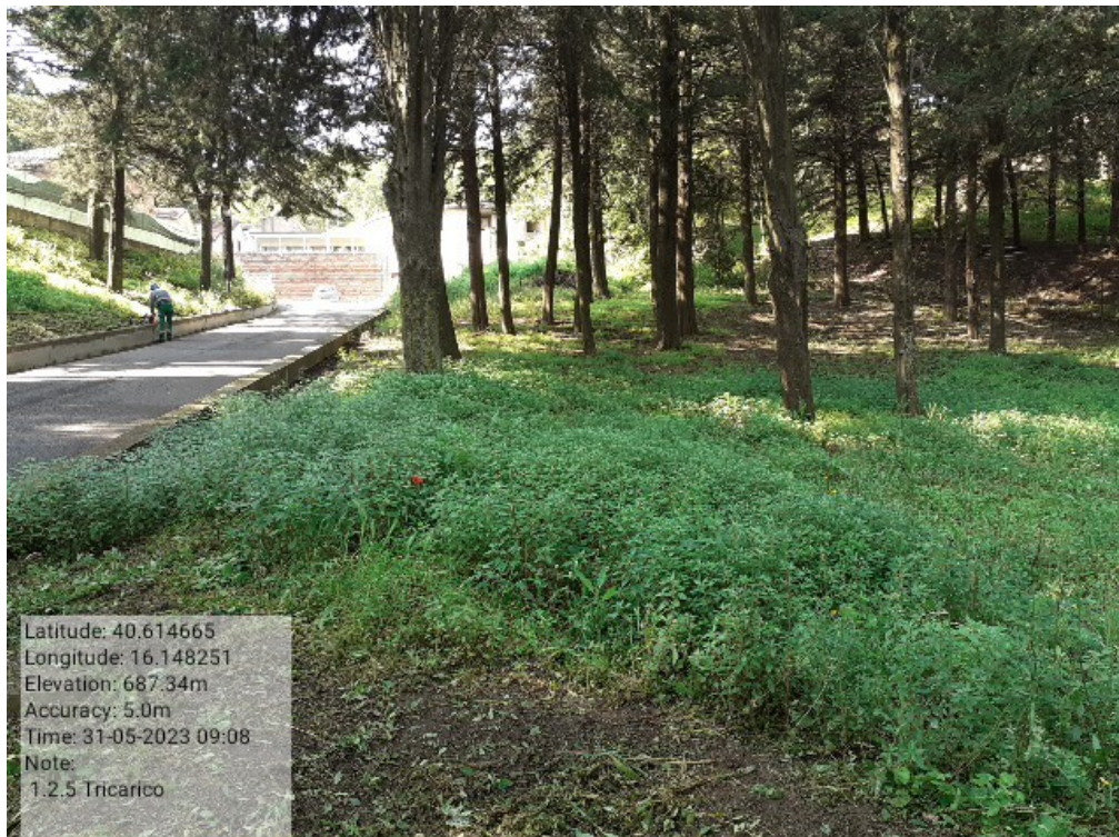
INTERVENTO 1.2.5 - TRICARICO