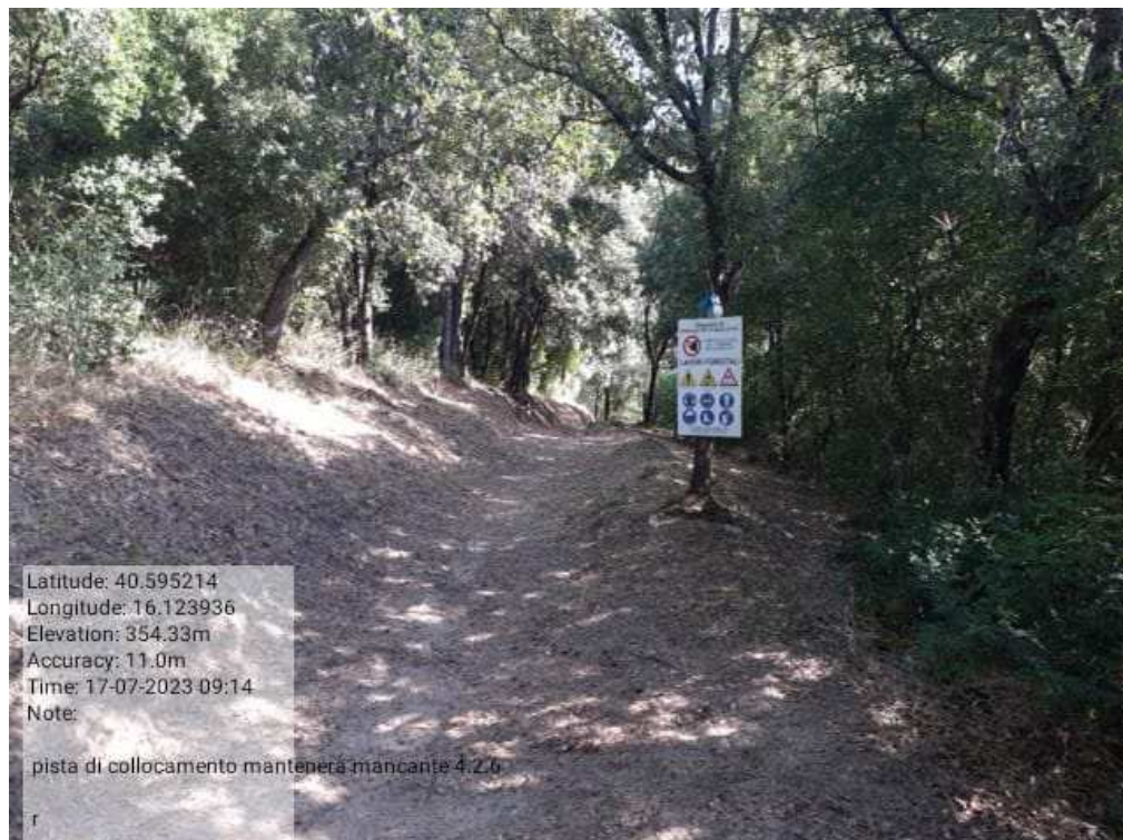
INTERVENTO 4.1.6 - TRICARICO Fg.77 Part. Strade - Pista di Collegamento For mantenera - Zona Malcanal DOPO