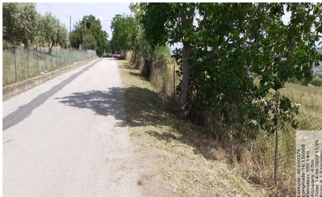
INTERVENTO 6.3.13 - TRICARICO Fg. 46-45-33-34-11-12-4 Strada Comunale Albanello-Cucno della Pic DOPO