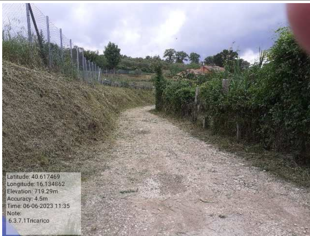
INTERVENTO 6.3.7.1 - TRICARICO STRADA COMUNALE SAN MARTINO DOPO