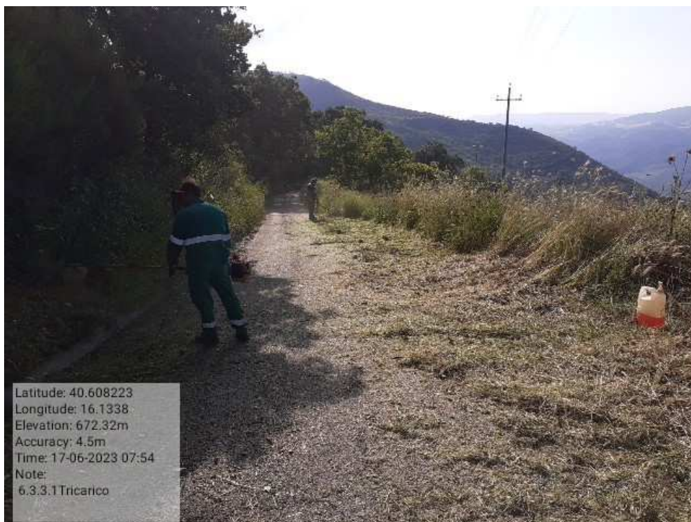
INTERVENTO 6.3.3.1- TRICARICO STRADA COMUNALE MALCANALE 2 DURANTE