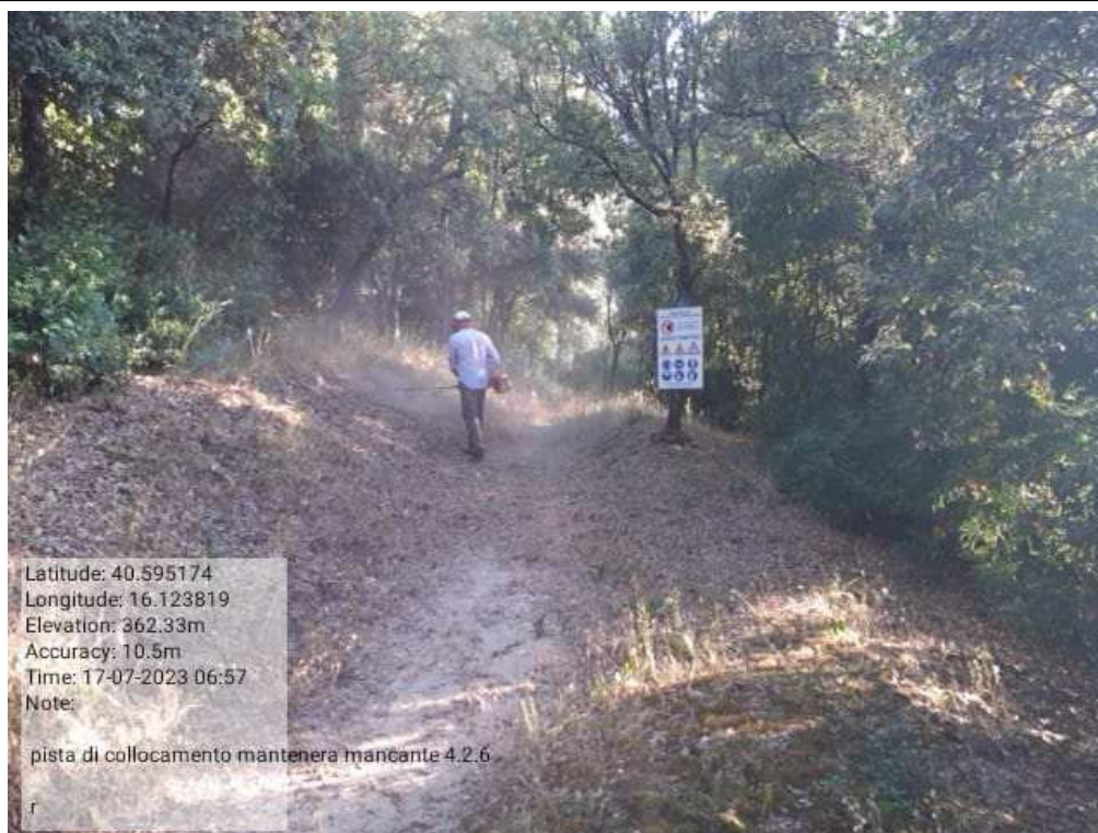
INTERVENTO 4.1.6 - TRICARICO Fg.77 Part. Strade - Pista di Collegamento For mantenera - Zona Malcanal DURANTE