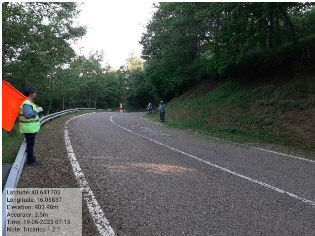
INTERVENTO1.2.1 - TRICARICO Fg.42 Part.184 Loc.Trecancelli- DURAN