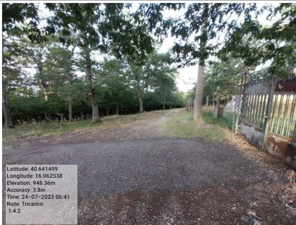
INTERVENTO 1.4.2 TRICARICO Fg.42 part.242 Loc.Trecancelli (strada interna trecancelli diramazione DOPO)