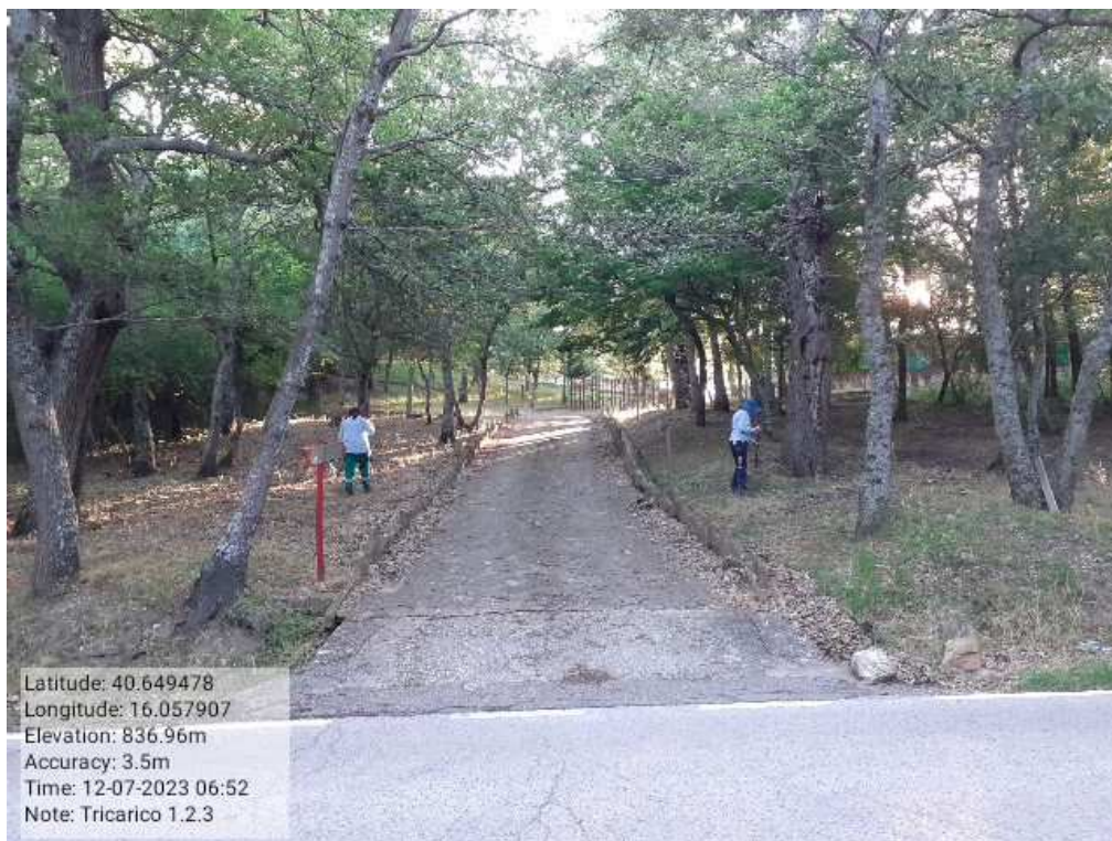
INTERVENTO1.2.3 - TRICARICO Fg.42 Part.184 - Loc.Trecancelli - Fonti fascia perimetrale al Camping Don Girolam DURA