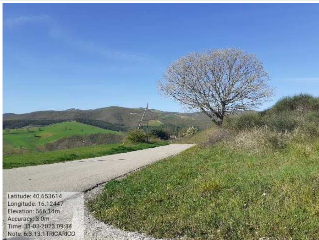
INTERVENTO 6.3.13 - TRICARICO Fg. 46-45-33-34-11-12-4 Strada Comunale Albanello-Cucno della Pica PRIMA