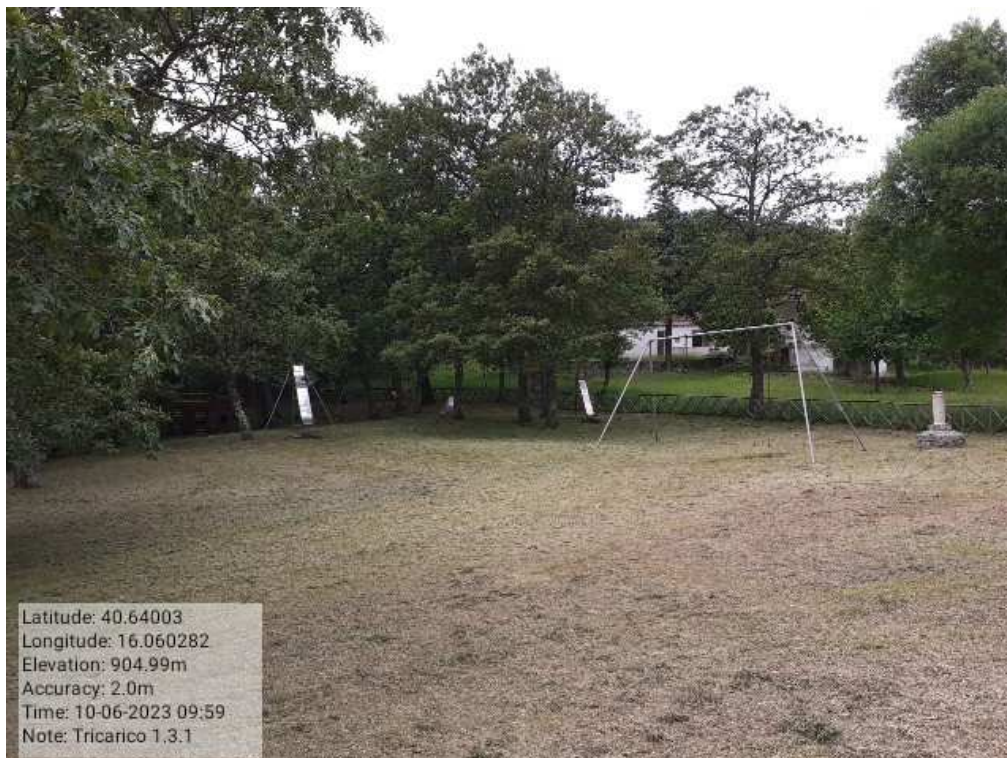
INTERVENTO 1.3.1 - TRICARICO Fg.50 part.171 Loc.Trecancelli area attrezzata DOPO