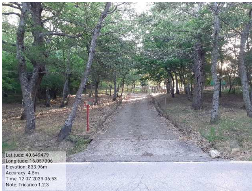
INTERVENTO1.2.3 - TRICARICO Fg.42 Part.184 - Loc.Trecancelli - Fonti fascia perimetrale al Camping Don Girolam DOPO