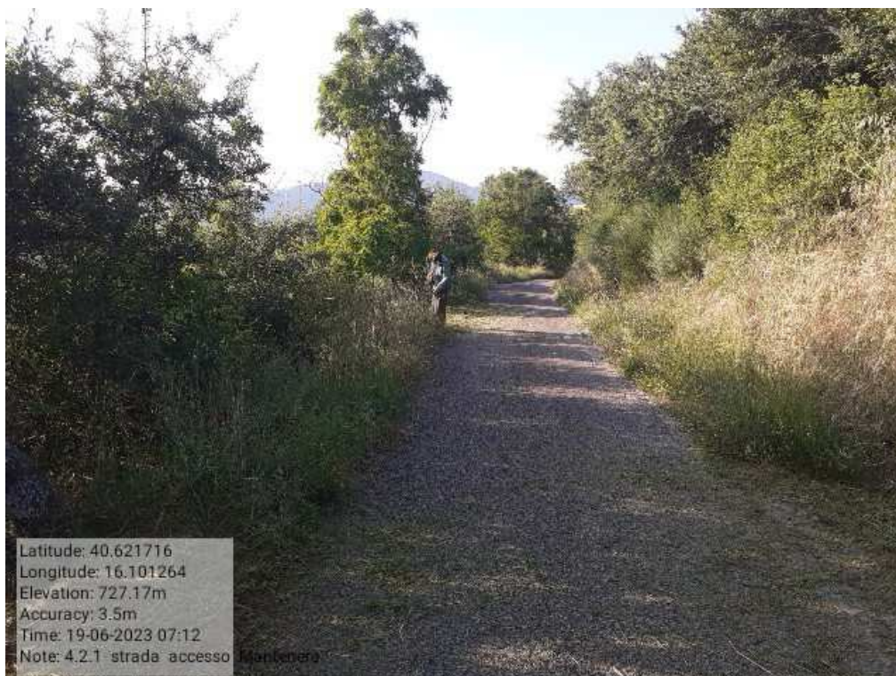
INTERVENTO 4.2.1 TRICARICO Fg 62 STRADA DI ACCESSO ALLA FORESTA MALCANALE PRIMA