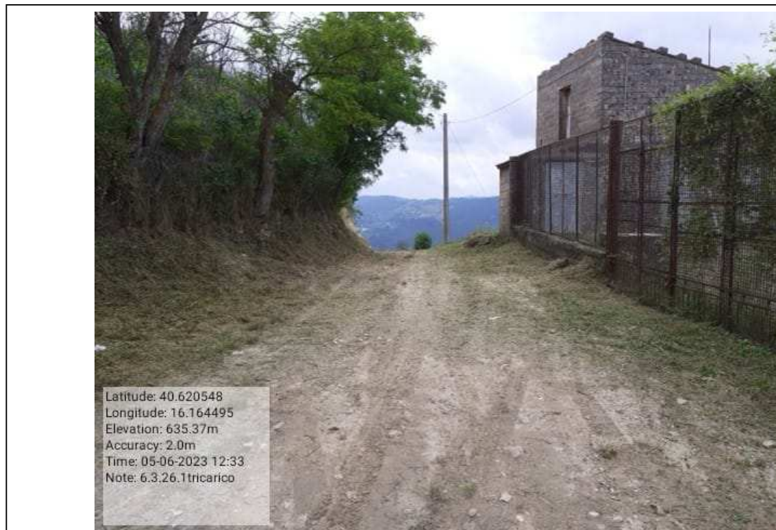
INTERVENTO 6.3.26.- TRICARICO EX COLLEGAMENTO BASENTANA FG.66-67DOPO