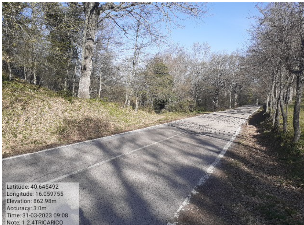
INTERVENTO 1.2.4- TRICARICO Part. Tricarico Fg.50 171 Loc.Trecancelli PRIMA