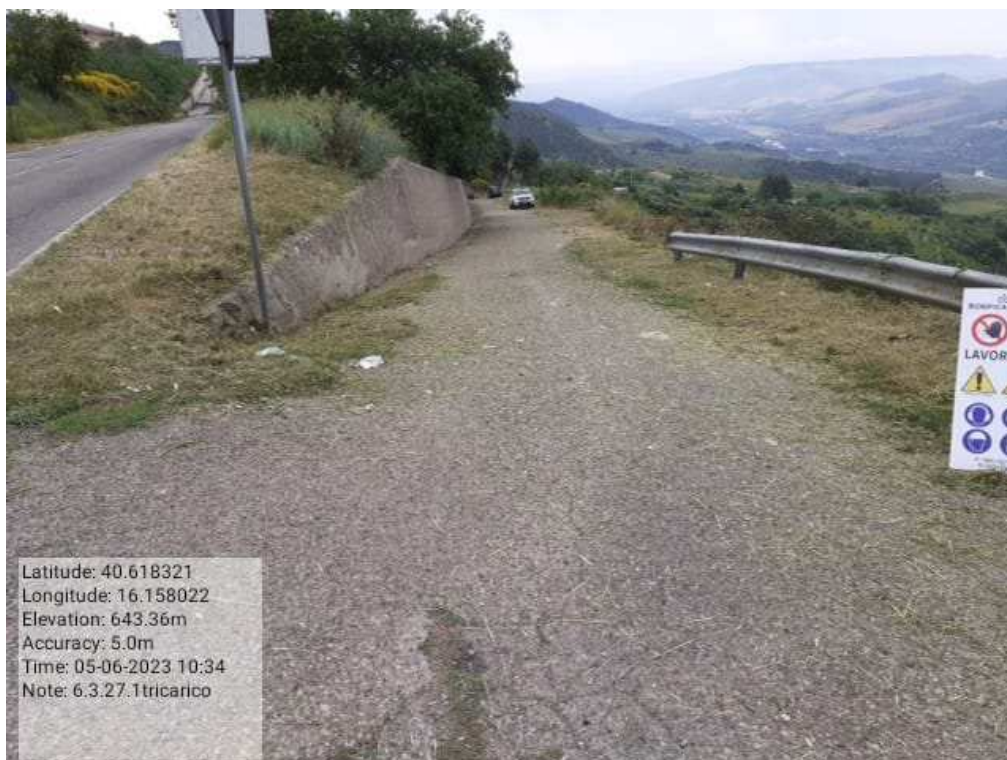
INTERVENTO 6.3.27 - TRICARICO STRADA CAPRINA FG.66 DOPO