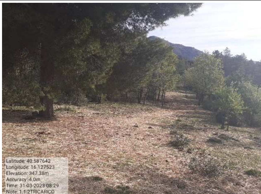
INTERVENTO 1.1.2 - TRICARICO Fg.77 part.32-33- 16-134 Loc Mantenera Malcanale Cugno del Vescovo Foto n. 2 PRIMA