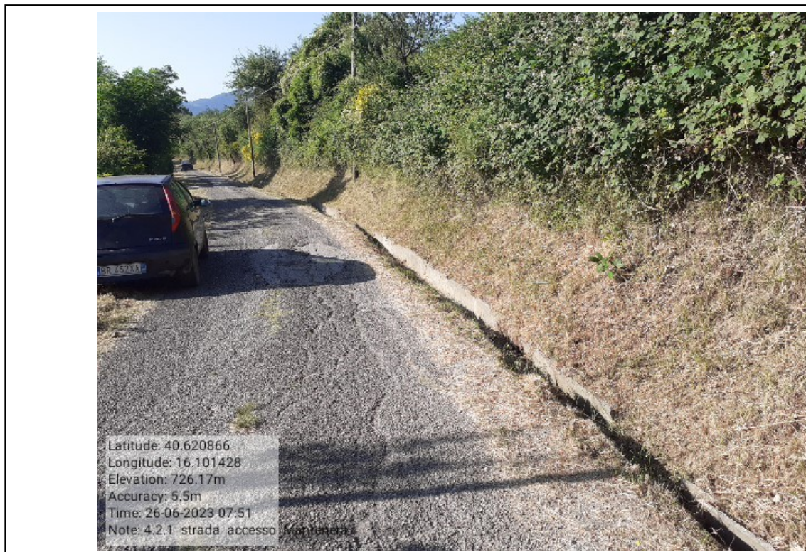
INTERVENTO 4.2.1 TRICARICO Fg 62 STRADA DI ACCESSO ALLA FORESTA MALCANALE DURANTE