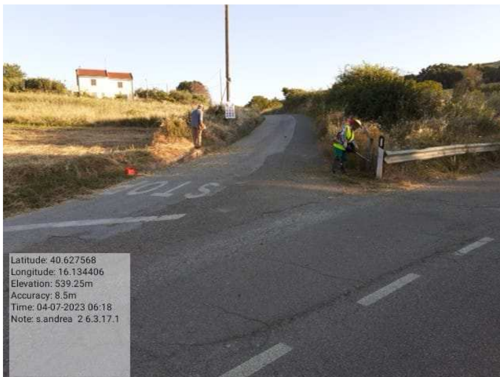
INTERVENTO 6.3.15 - TRICARICO STRADA COMUNALE SANT ANDREA 2 DURANTE