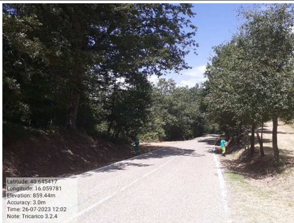
INTERVENTO 1.2.4- TRICARICO Part. Tricarico Fg.50 171 Loc.Trecancelli DURANTE