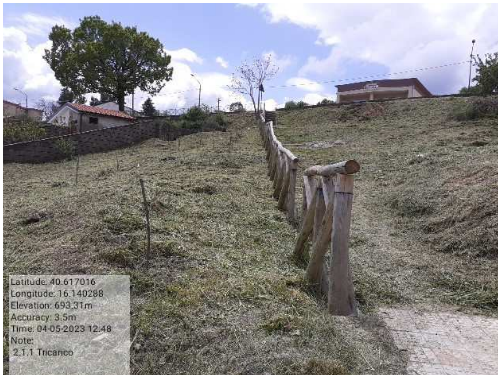
INTERVENTO 2.1.1 - TRICARICO VERDE URBANO DOPO