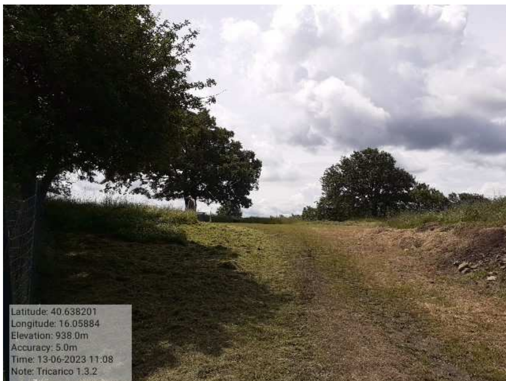
INTERVENTO 1.3.2 - TRICARICO Tricarico Fg.50 part.171 CIVITA DURANTE