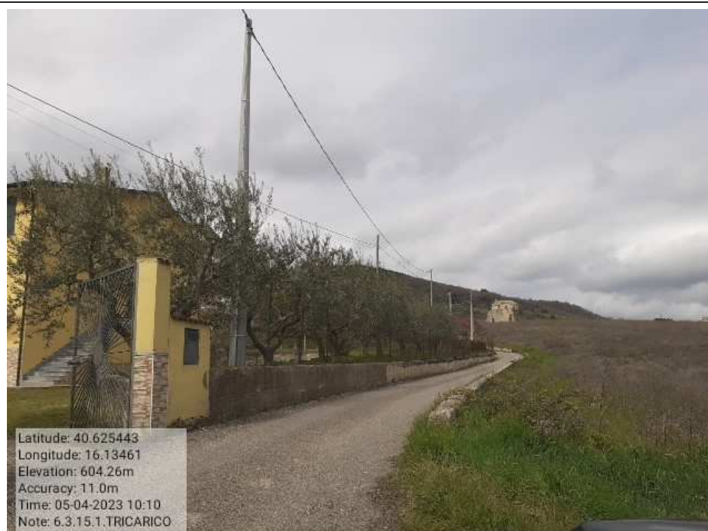
INTERVENTO 6.3.15 - TRICARICO STRADA COMUNALE SANT ANDREA 2 PRIMA