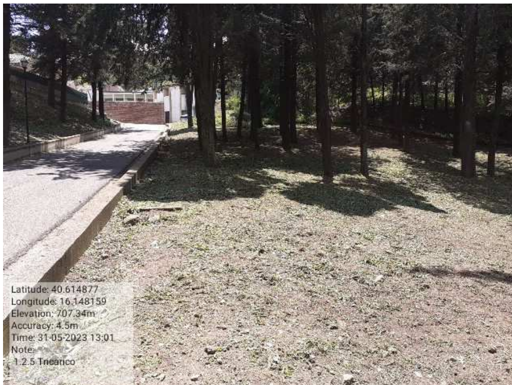
INTERVENTO 1.2.5 - TRICARICO