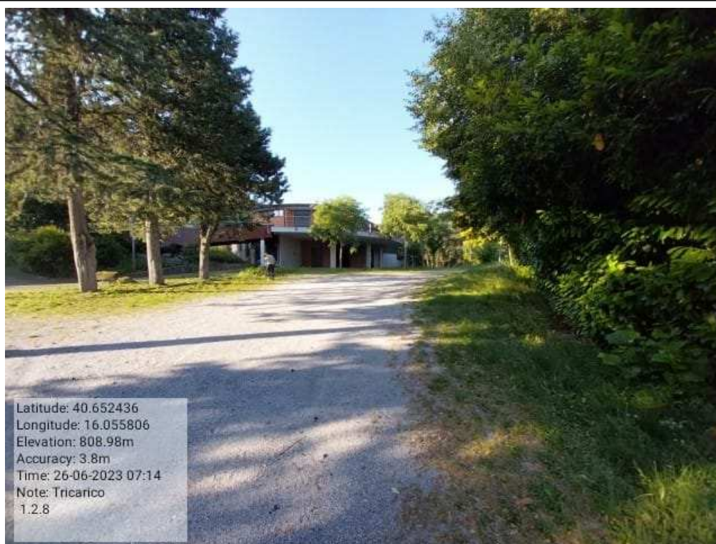
INTERVENTO 1.2.8 - TRICARICO Fg.50 Part.168 Loc.Fonti perimetro Santuario di Font PRIMA