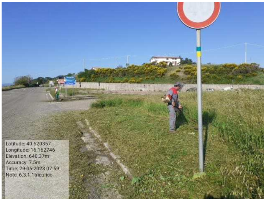
INTER 6.3.1 - TRICARICO COLLEGAMENTO BASENTANA IANO DELLE GINESTRE FG DURANTE