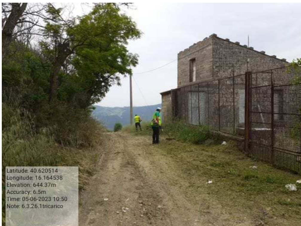
INTERVENTO 6.3.26.- TRICARICO EX COLLEGAMENTO BASENTANA FG.66-67DURANTE