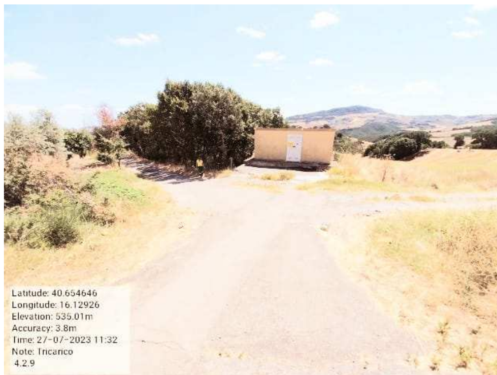
INTERVENTO 4.1.9- TRICARICO Fig. 11 Tratturo Comunale Cugno dei Greci - Strada Comunale S. Marc DOPO