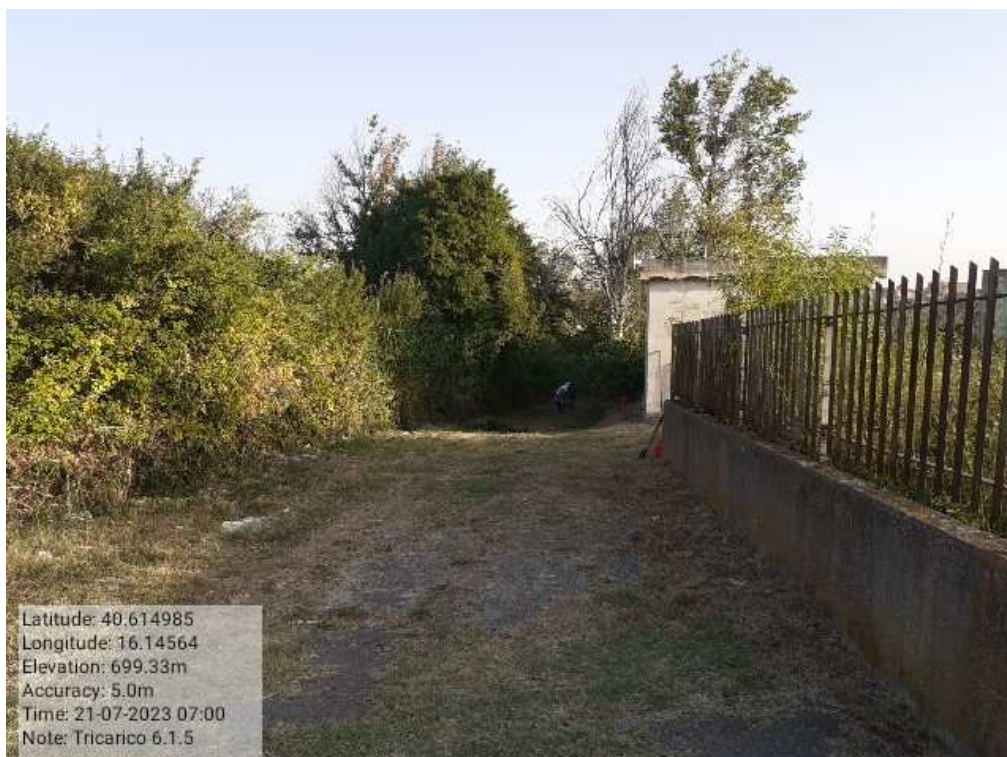
INTERVENTO 6.1.5 - TRICARICO Fg. 65 Part.Acque PRETURA FONTANA VECCHIA DURANTE Foto n. 3 4