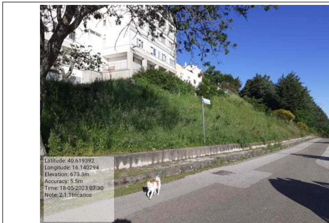
INTERVENTO 2.1.1 - TRICARICO VERDE URBANO VIA DON PANCRAZIO TOSCANO PRIMA