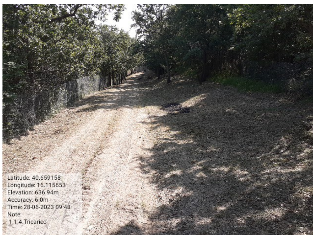
INTERVENTO 1.1.4. - TRICARICO Fg.11 part.1 Loc. Cugno della Pica DOPO