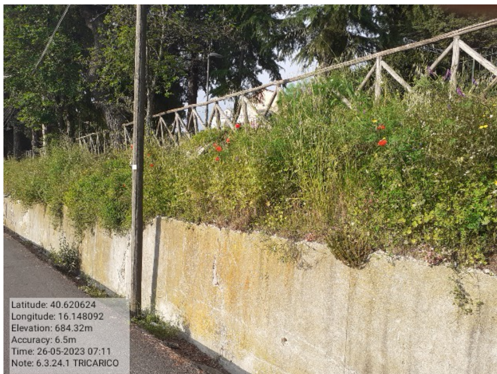
INTERVENTO 6.3.24.- TRICARICO STRADA COMUNALE CASTAGNONE FG.61-48-37 PRIMA