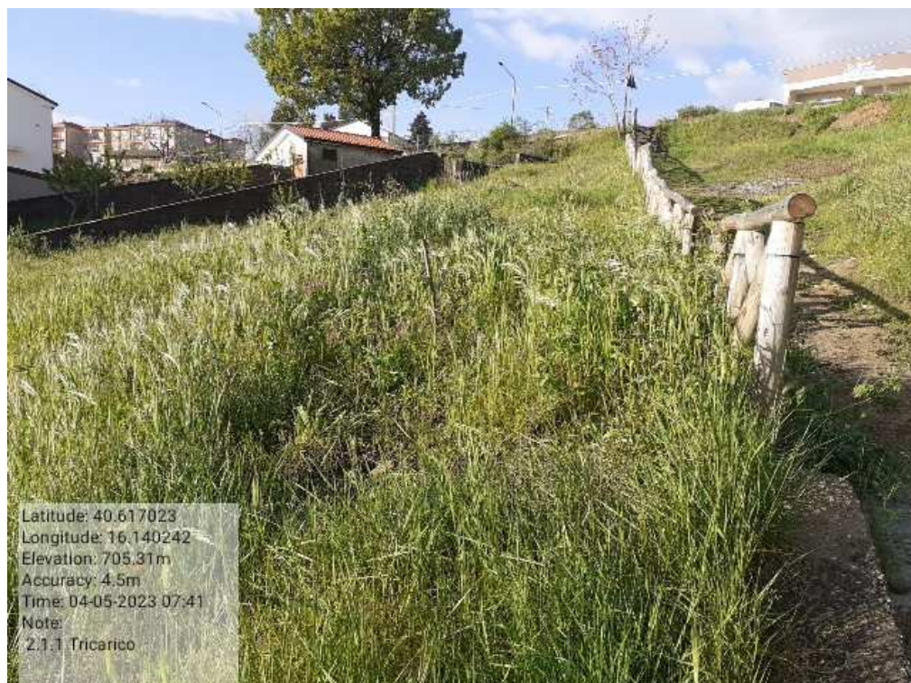
INTERVENTO 2.1.1 - TRICARICO VERDE URBANO PRIMA