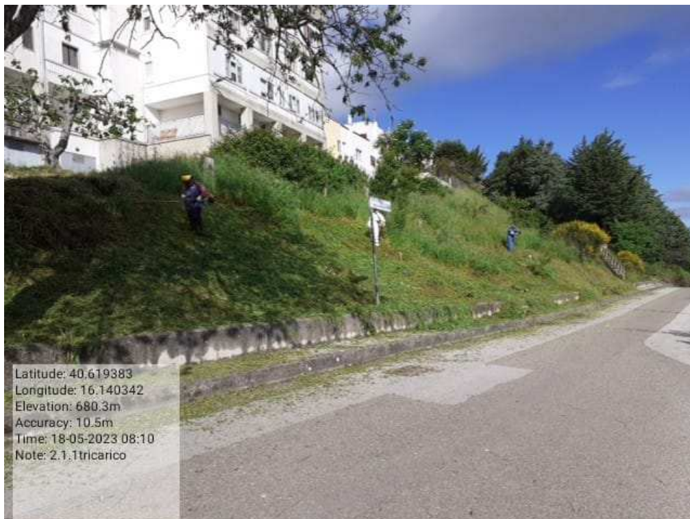
INTERVENTO 2.1.1 - TRICARICO VERDE URBANOVIA DON PANCRAZIO TOSCANO DURANTE