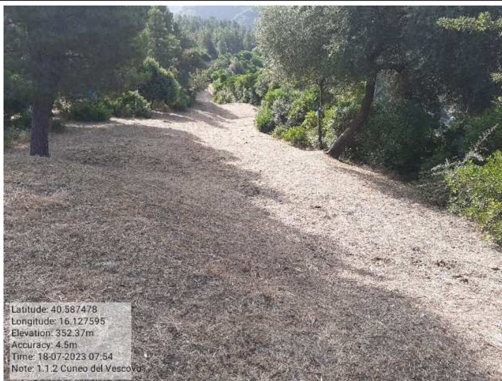
INTERVENTO 1.1.2 - TRICARICO Fig.77 part.32-33- 16-134 Loc Mantenera Malcanale Cugno del Vescovo Foto n. 2 DOPO