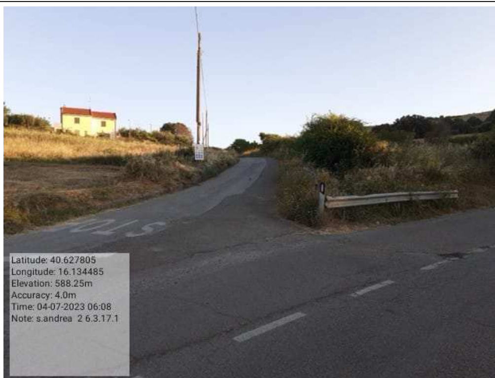
INTERVENTO 6.3.15 - TRICARICO STRADA COMUNALE SANT ANDREA 2 DOPO