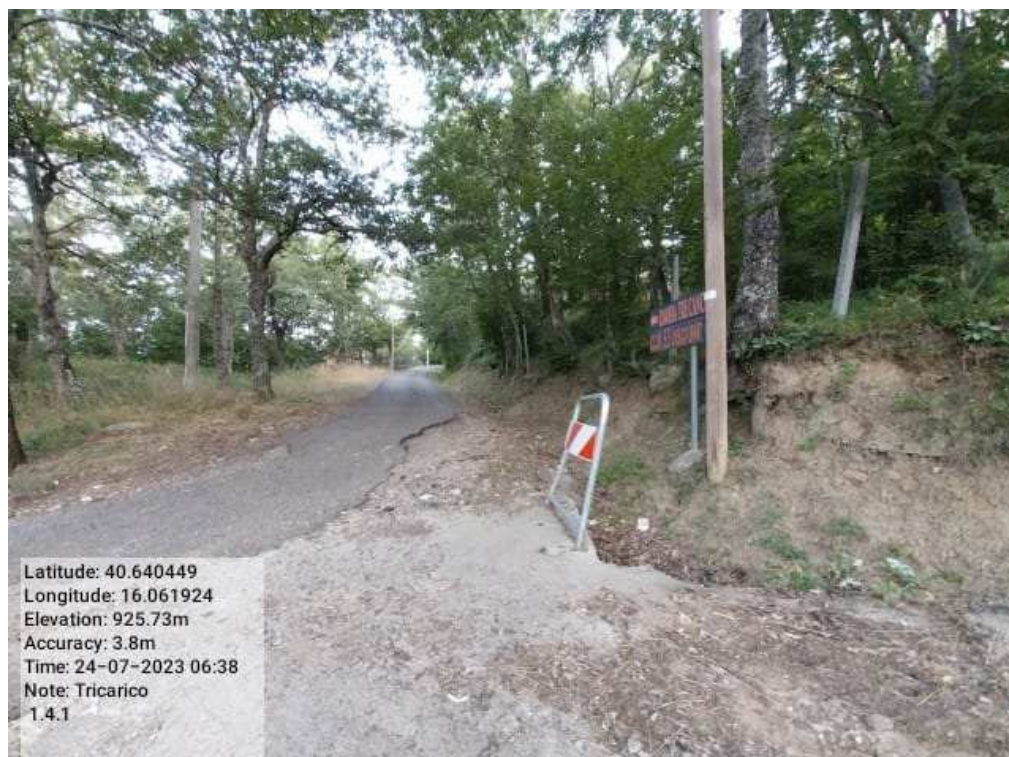
INTERVENTO 1.4.1 - TRICARICO Fg.42 part.242 Loc. Trecanc DOPO