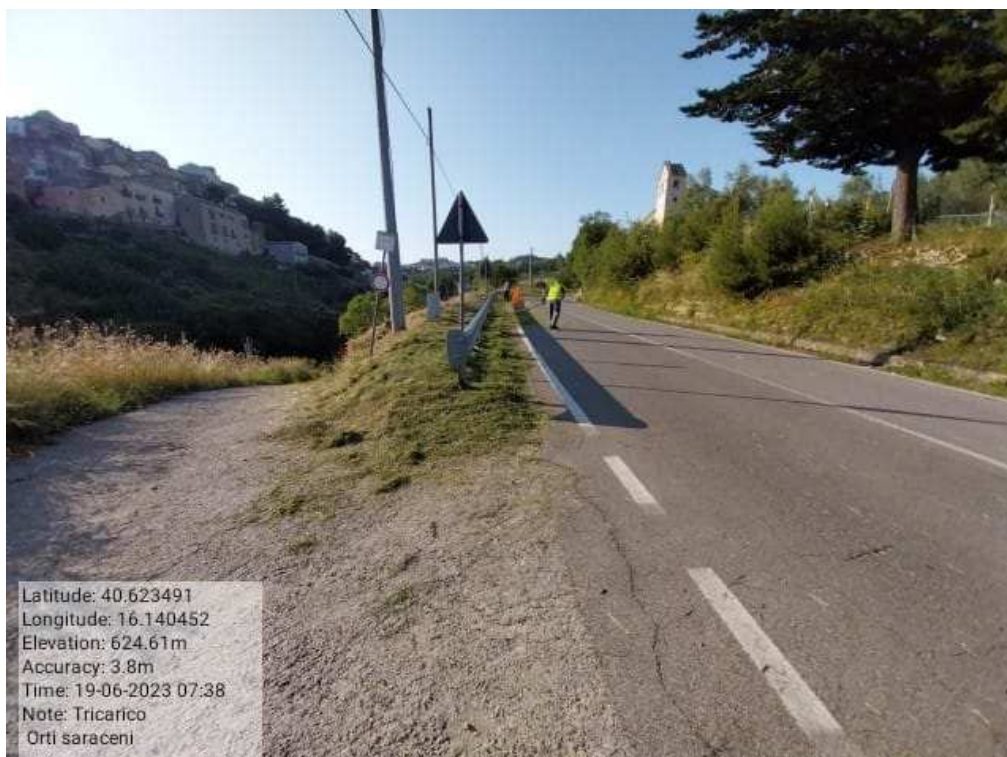
INTERVENTO 6.3.12.1- TRICARICO STRADA ROVINCIALE BOCCANERA FG6 DURANTE