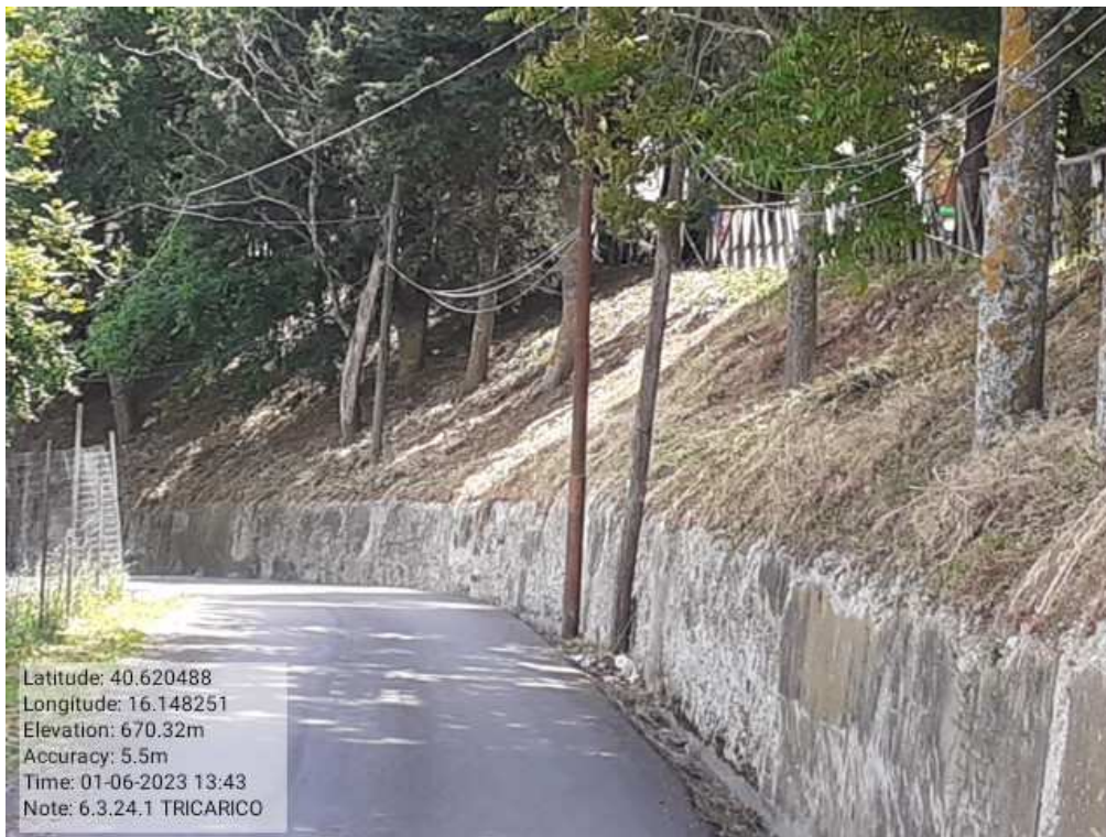
INTERVENTO 6.3.24.- TRICARICO STRADA COMUNALE CASTAGNONE FG.61-48-3DOPO