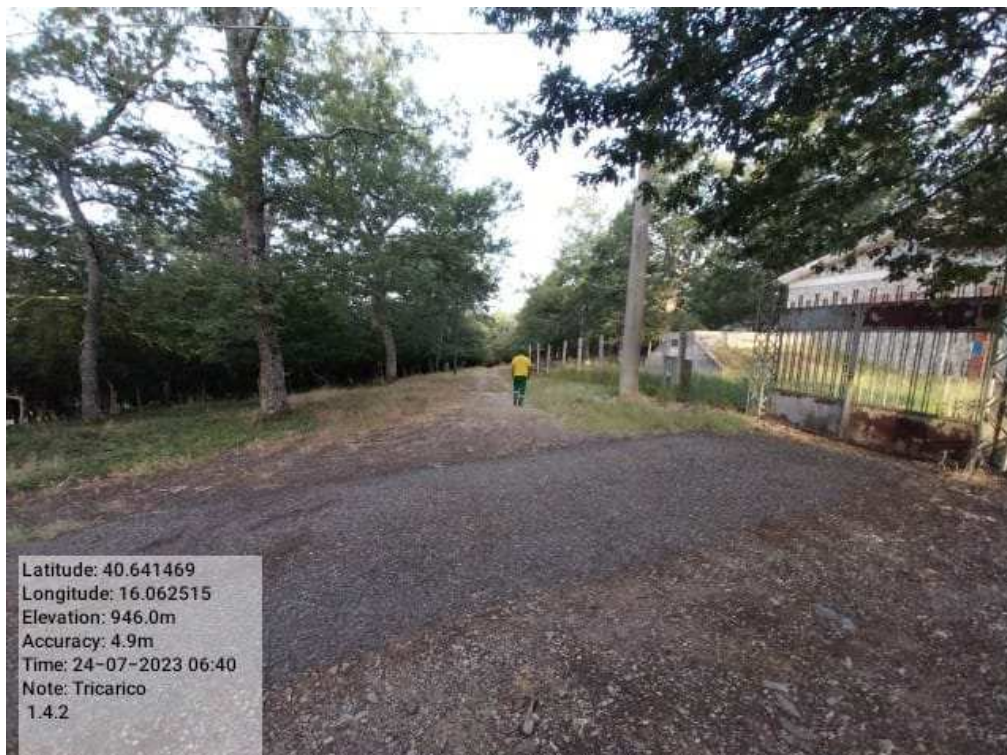
INTERVENTO 1.4.2 TRICARICO Fg.42 part.242 Loc.Trecancelli (strada interna trecancelli diramazione PRIMA)