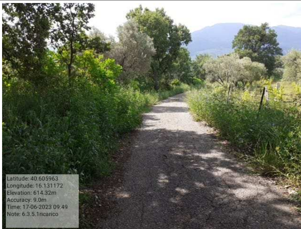
INTERVENTO 6.3.5.1.- TRICARICO STRADA COMUNALE MALCANALE 4 PRIMA