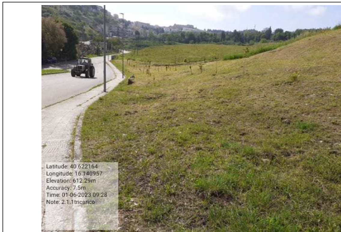
INTERVENTO 2.1.1 - TRICARICO VERDE URBANO DOPO