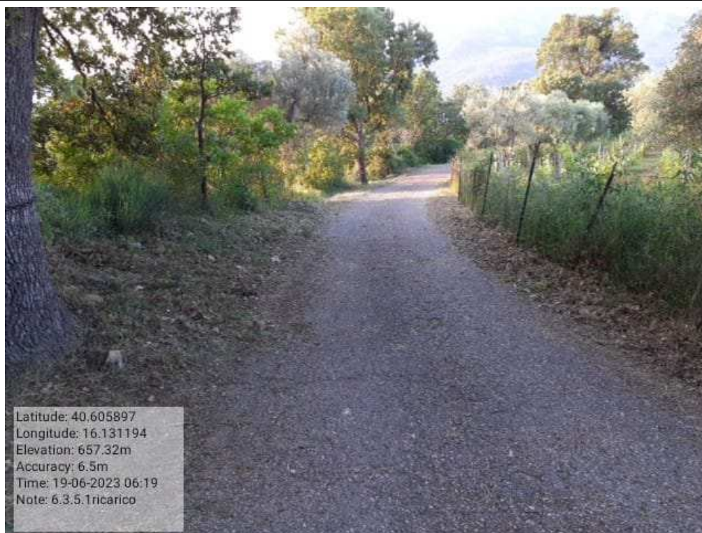
INTERVENTO 6.3.5.1.- TRICARICO STRADA COMUNALE MALCANALE 4 DOPO