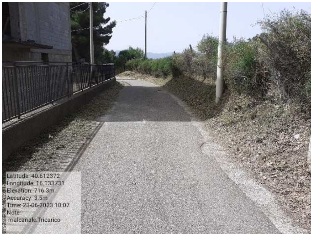
INTERVENTO 6.3.8.1.- TRICARICO STRADA COMUNALE MALCANALE 6 FG. 64 DOPO