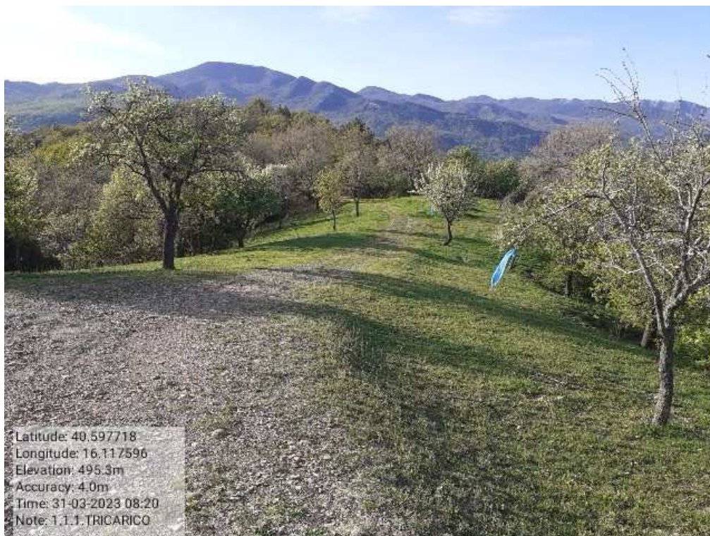
INTERVENTO 1.1.1 - TRICARICO Fg.77 part.22-24- 20-79-133-80 Loc. Mantenera Malcanale Mingo Lavecchia PRIMA