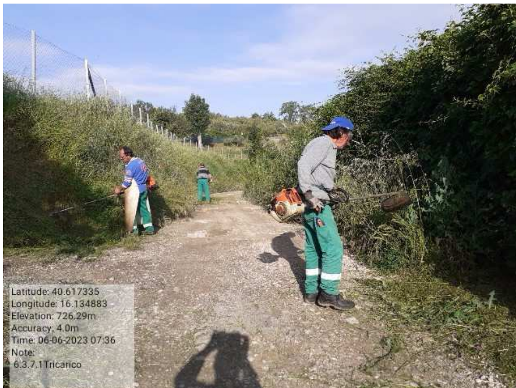
INTERVENTO 6.3.7.1 - TRICARICO STRADA COMUNALE SAN MARTINO DURANTE