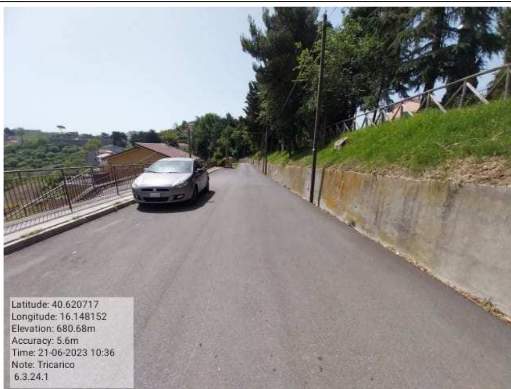
INTERVENTO 6.3.24.- TRICARICO STRADA COMUNALE CASTAGNONE FG.61-48-3DURANTE