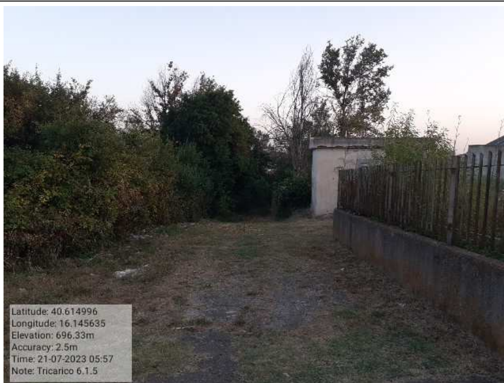
INTERVENTO 6.1.5 - TRICARICO Fg. 65 Part.Acque PRETURA FONTANA VECCHIA DOPO Foto n. 3 4