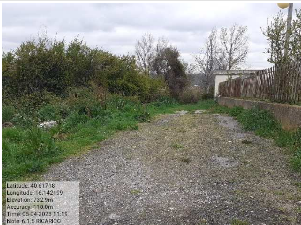
INTERVENTO 6.1.5 - TRICARICO Fg. 65 Part.Acque PRETURA FONTANA VECCHIA PRIMA Foto n. 3 4