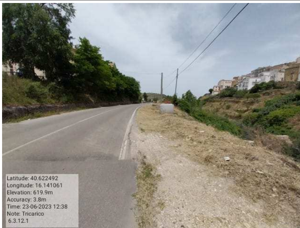
INTERVENTO 6.3.12.1- TRICARICO STRADA ROVINCIALE BOCCANERA FG6 DOPO