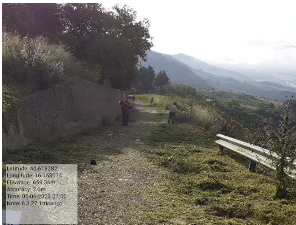
INTERVENTO 6.3.27 - TRICARICO STRADA CAPRINA FG.66 DURANTE