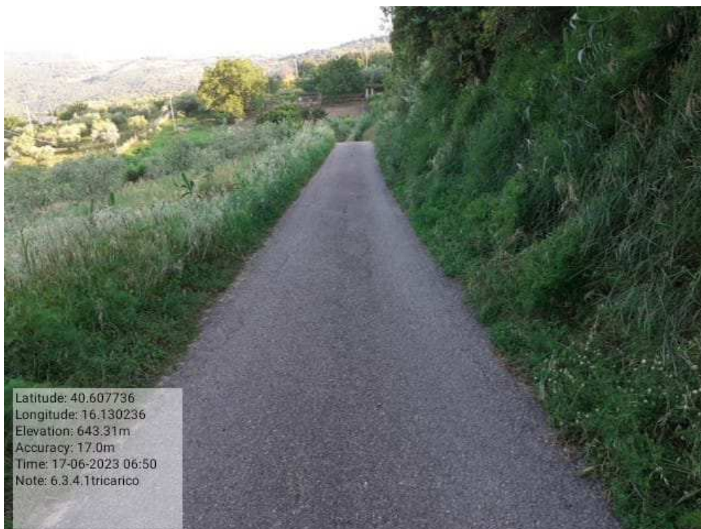
INTERVENTO 6.3.2.1 - TRICARICO STRADA COMUNALE MALCANALE 3 PRIMA