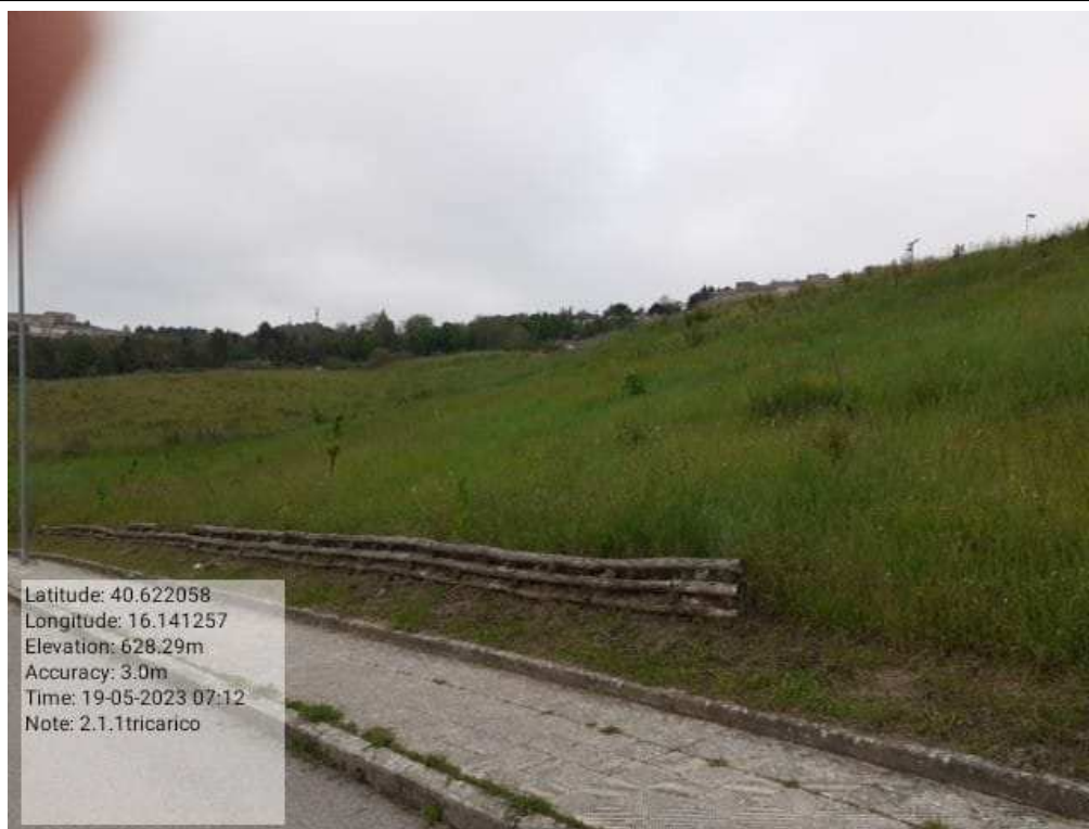
INTERVENTO 2.1.1 - TRICARICO VERDE URBANO PRIMA