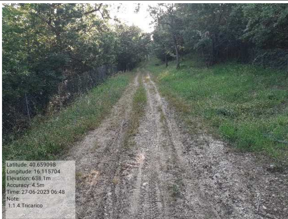
INTERVENTO 1.1.4. - TRICARICO Fg.11 part.1 Loc. Cugno della Pica PRIMA