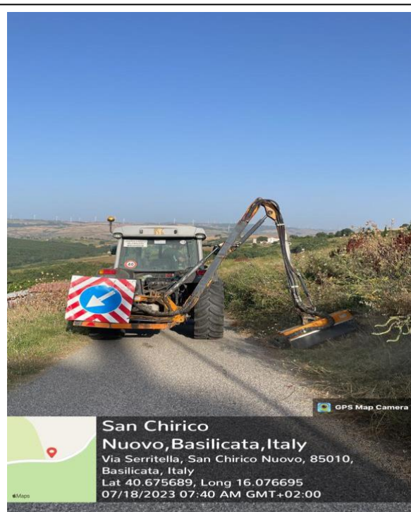
int. 4.1.4 Foto 4 c.da becce- Serritella