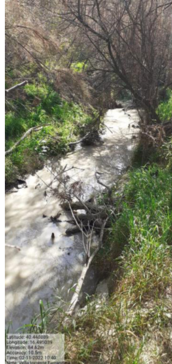
Int. Torrente Vella - Ostruzione Alveo