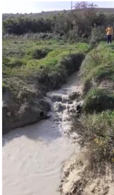
Int. Vella Tratto in cui il torrente ha rotto gli argini