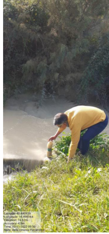
Int. Torrente Vella Prelievo di Campioni