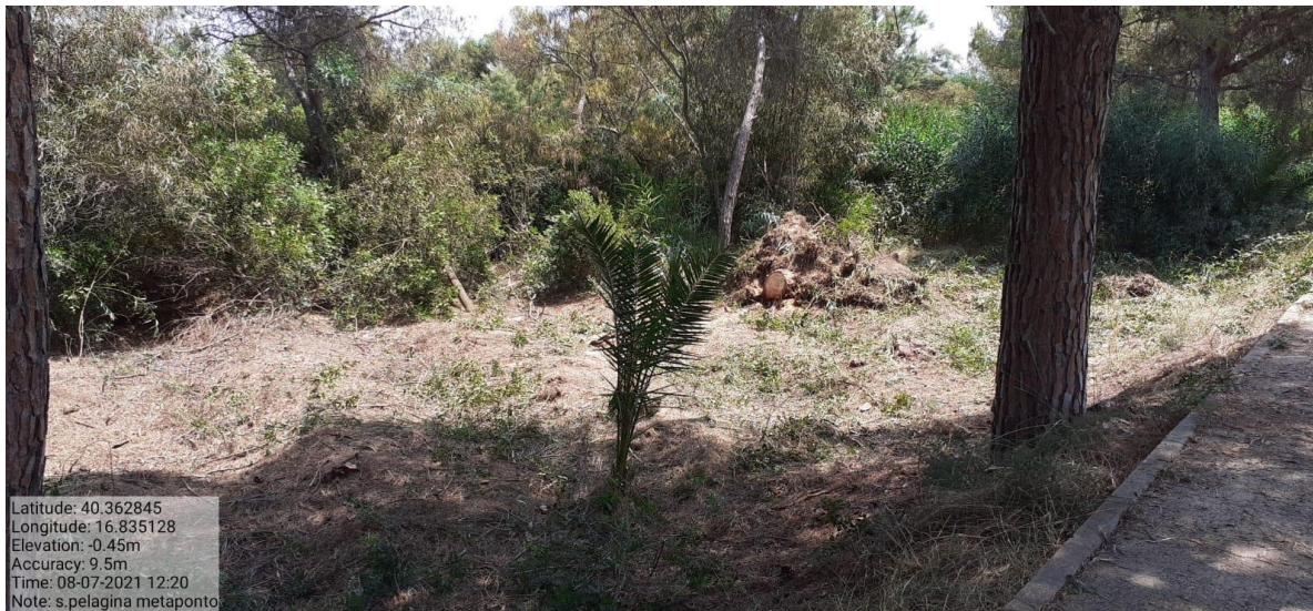
Intervento 1.1.1 Manutenzione Viale Tagliafuoco Loc S.Pelagina Fg 50 P.Ila 13 — POST OPERAM