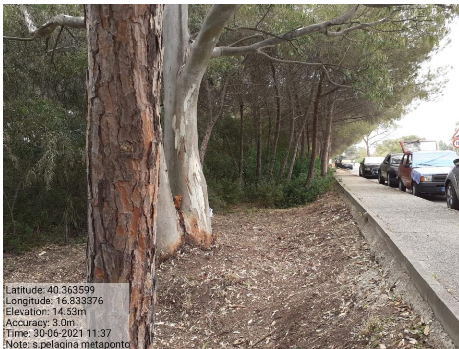
Intervento 1.1.1 Manutenzione Viale Tagliafuoco Loc S.Pelagina Fg 50 P.Ila 13 — POST OPERAM