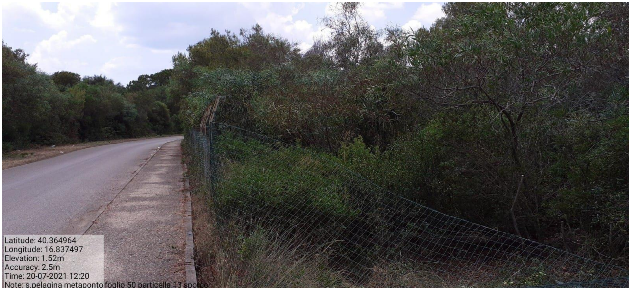
Intervento 1.1.2 Manutenzione Viale Tagliafuoco Loc S.Pelagina Fg 50 P.Ila 13 — ANTE OPERAM