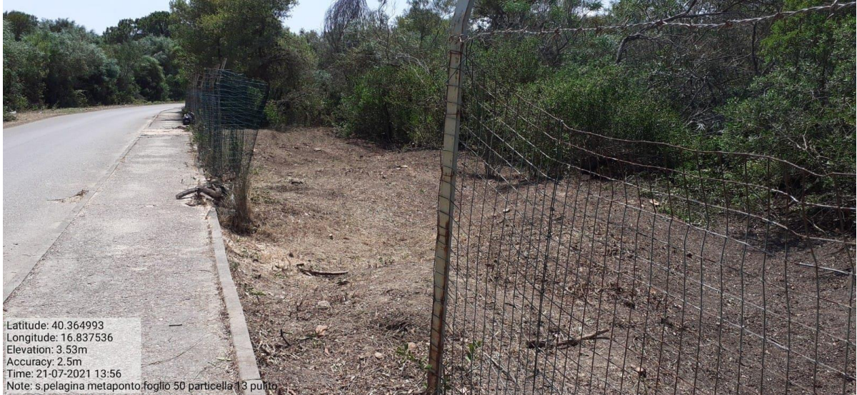
Intervento 1.1.2 Manutenzione Viale Tagliafuoco Loc S.Pelagina Fg 50 P.Ila 13 — POST OPERAM