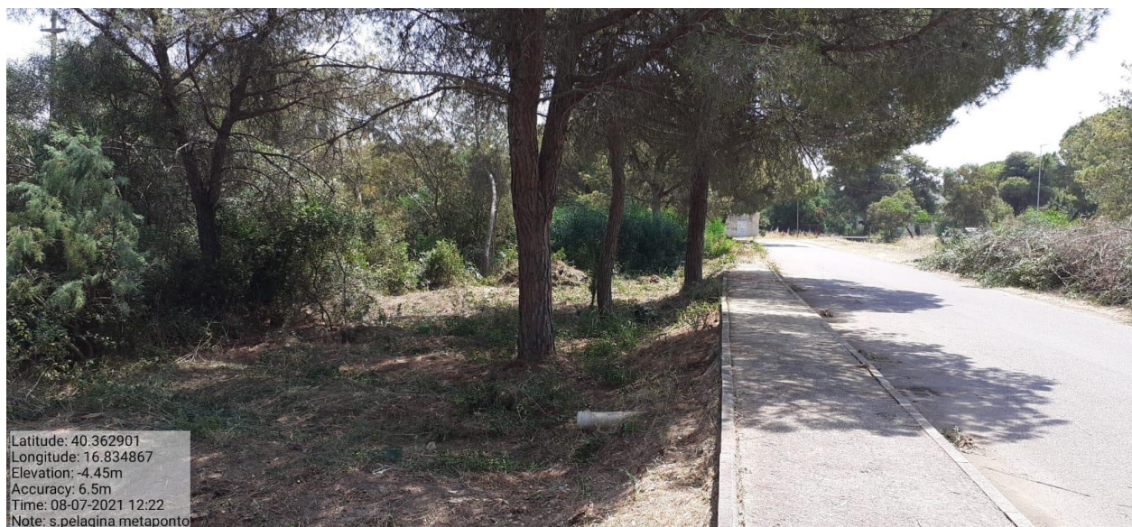
Intervento 1.1.1 Manutenzione Viale Tagliafuoco Loc S.Pelagina Fg 50 P.Ila 13 — POST OPERAM