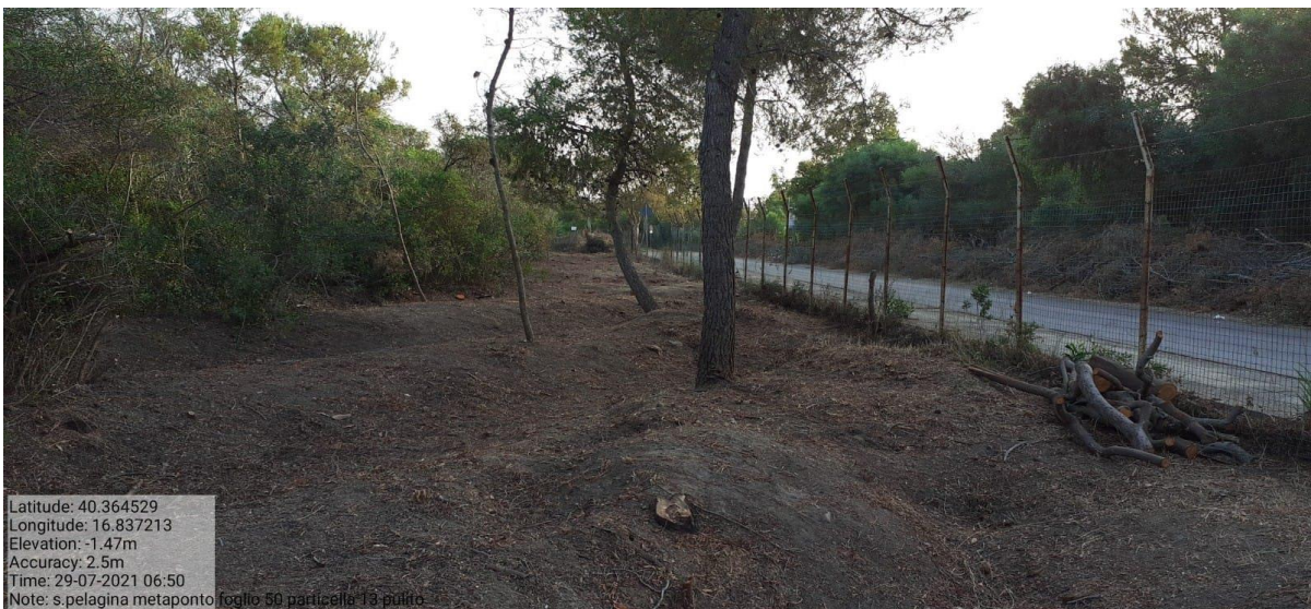
Intervento 1.1.1 Manutenzione Viale Tagliafuoco Loc S.Pelagina Fg 50 P.Ila 13 — POST OPERAM