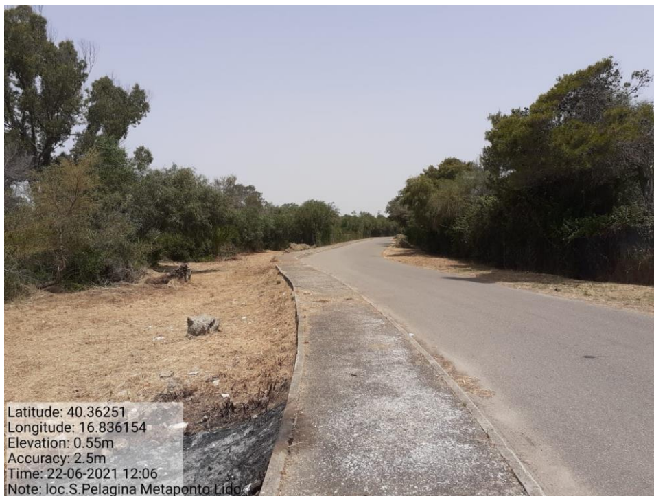
Intervento 1.1.2 Manutenzione Viale Tagliafuoco Loc S.Pelagina Fg 50 P.Ila 13 — POST OPERAM