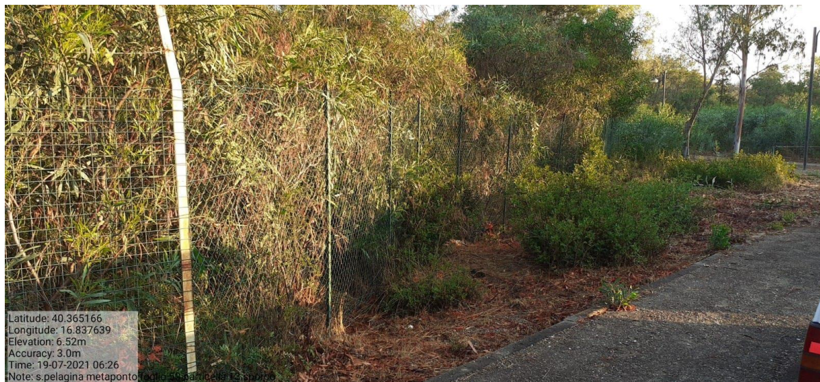
Intervento 1.1.1 Manutenzione Viale Tagliafuoco Loc S.Pelagina Fg 50 P.Ila 13 — ANTE OPERAM