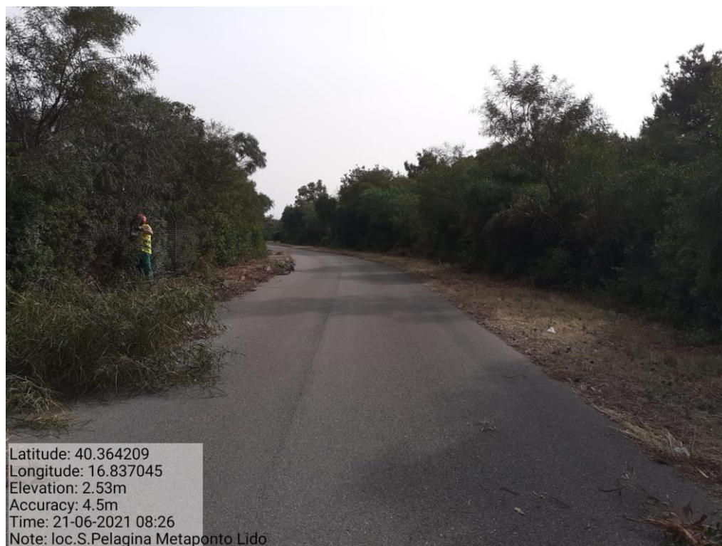
Intervento 1.1.2 Manutenzione Viale Tagliafuoco Loc S.Pelagina Fg 50 P.Ila 13 — ANTE OPERAM