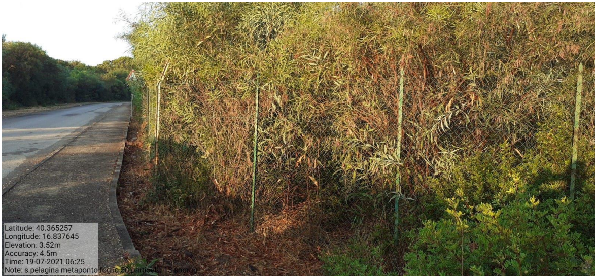
Intervento 1.1.2 Manutenzione Viale Tagliafuoco Loc S.Pelagina Fg 50 P.Ila 13 — ANTE OPERAM