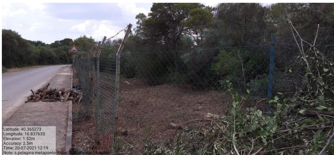
Intervento 1.1.1 Manutenzione Viale Tagliafuoco Loc S.Pelagina Fg 50 P.Ila 13 — POST OPERAM