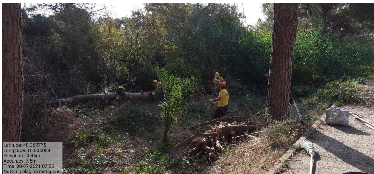
Intervento 1.1.1 Manutenzione Viale Tagliafuoco Loc S.Pelagina Fg 50 P.Ila 13 — ANTE OPERAM