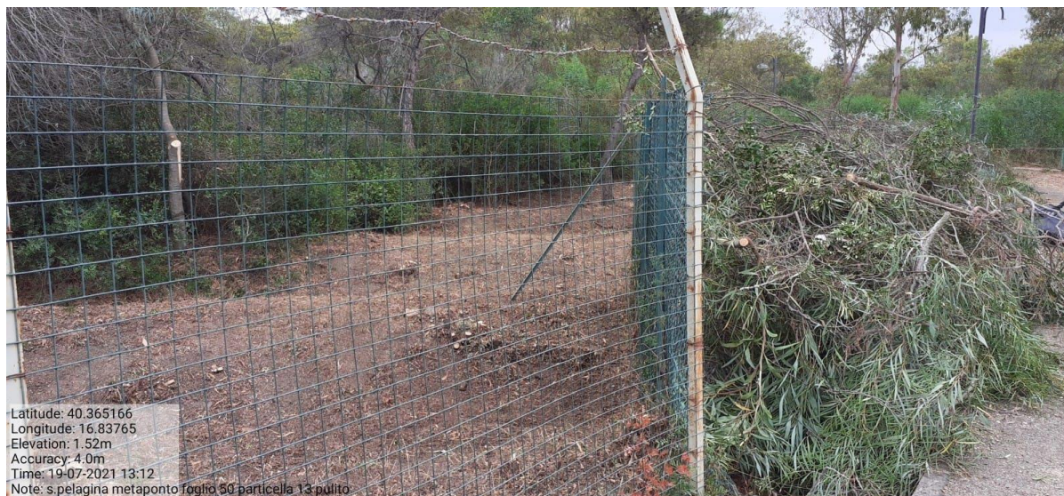
Intervento 1.1.2 Manutenzione Viale Tagliafuoco Loc S.Pelagina Fg 50 P.Ila 13 — POST OPERAM