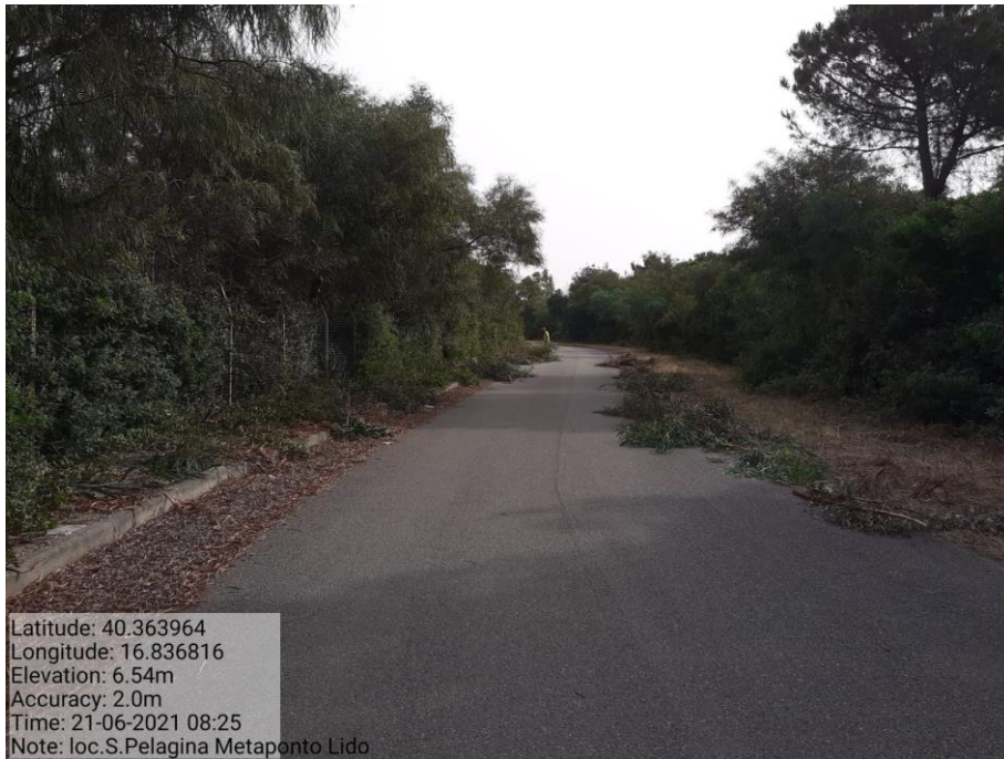
Intervento 1.1.2 Manutenzione Viale Tagliafuoco Loc S.Pelagina Fg 50 P.Ila 23 — ANTE OPERAM