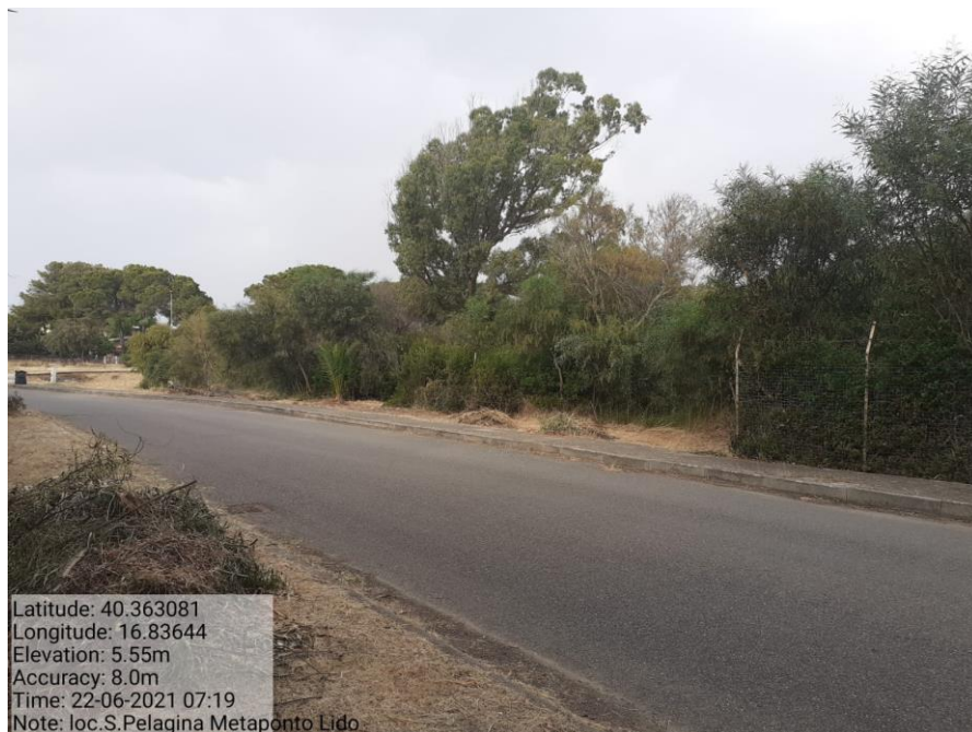
Intervento 1.1.2 Manutenzione Viale Tagliafuoco Loc S.Pelagina Fg 50 P.Ila 13 — POST OPERAM