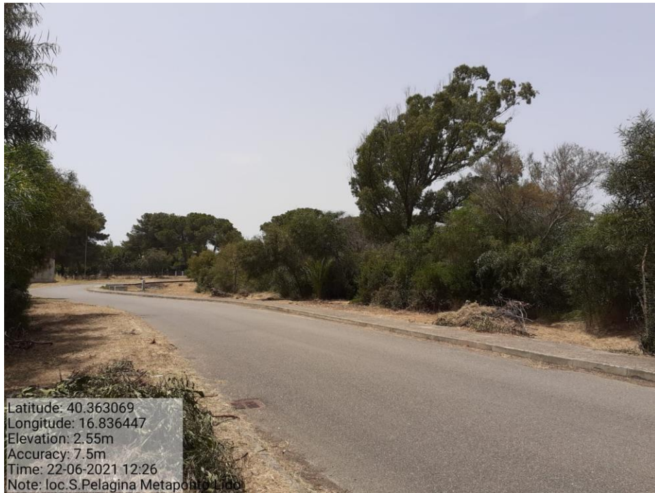
Intervento 1.1.2 Manutenzione Viale Tagliafuoco Loc S.Pelagina Fg 50 P.Ila 23 — POST OPERAM