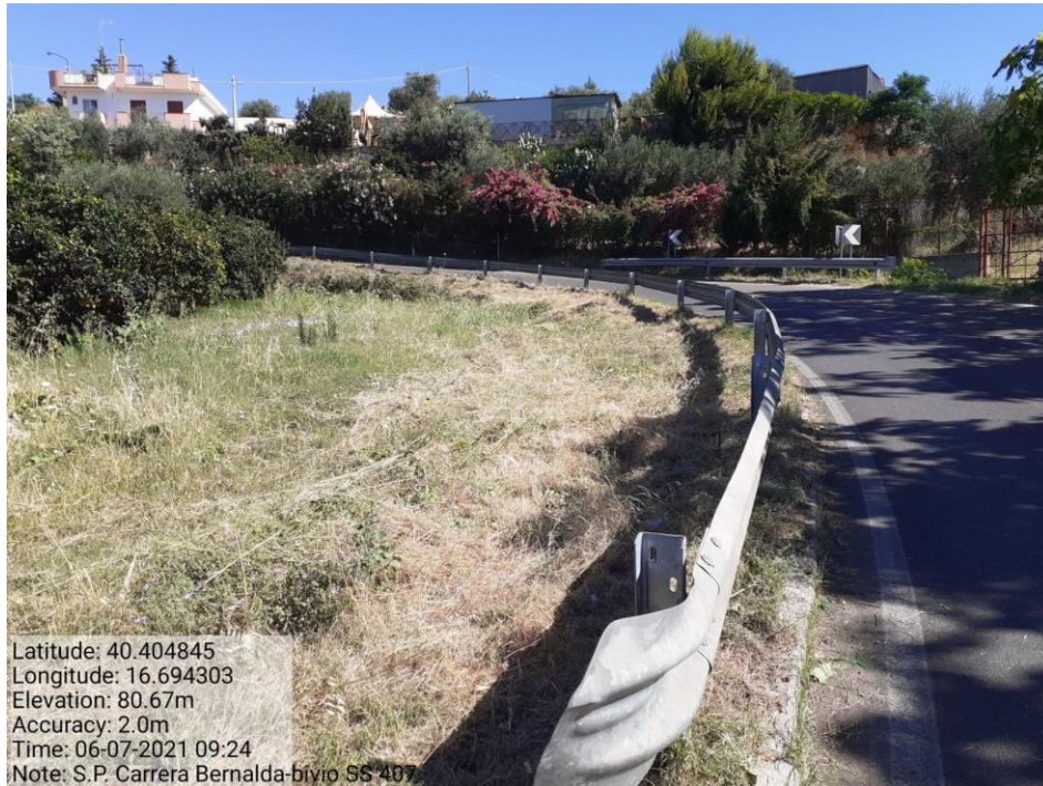
Intervento 5.1.1 Manutenzione Viabilità Provinciale (Decespugliamento) S.P Carrera — POST OPERAM