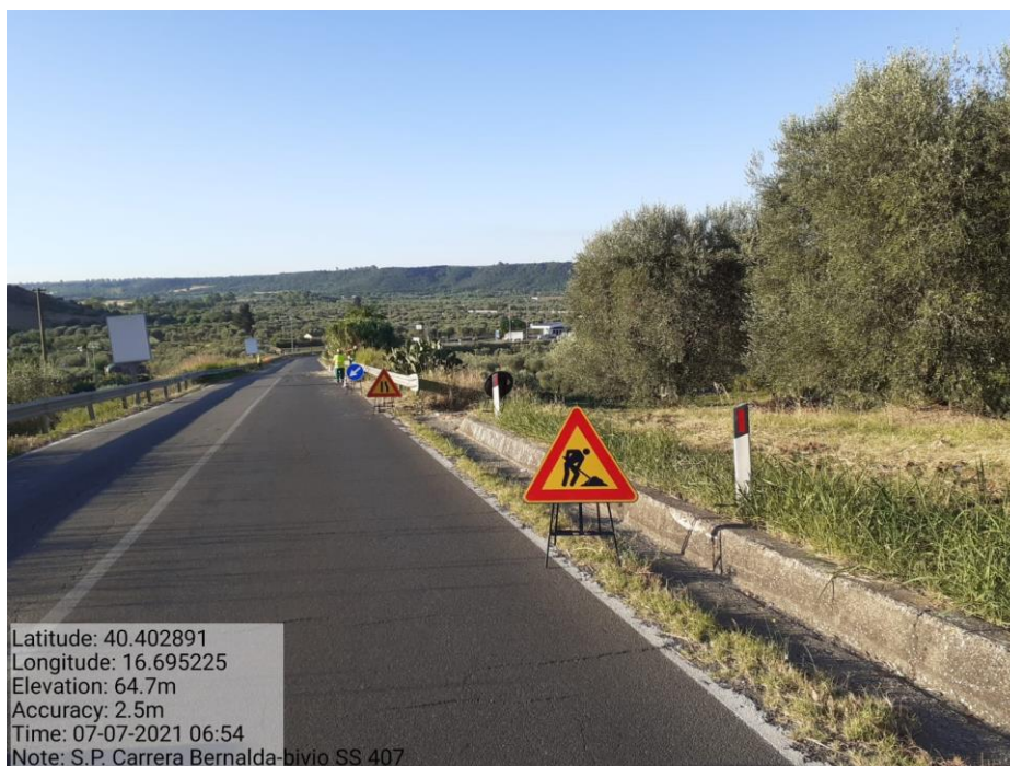
Intervento 5.1.1 Manutenzione Viabilità Provinciale (Decespugliamento) S.P Carrera — ANTE OPERAM