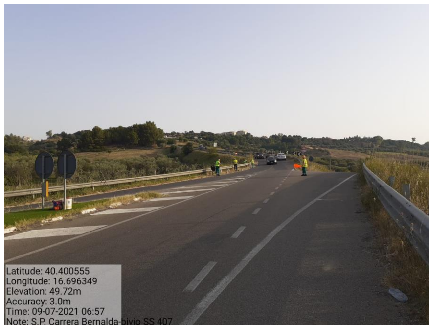
Intervento 5.1.1 Manutenzione Viabilità Provinciale (Decespugliamento) S.P Carrera — POST OPERAM