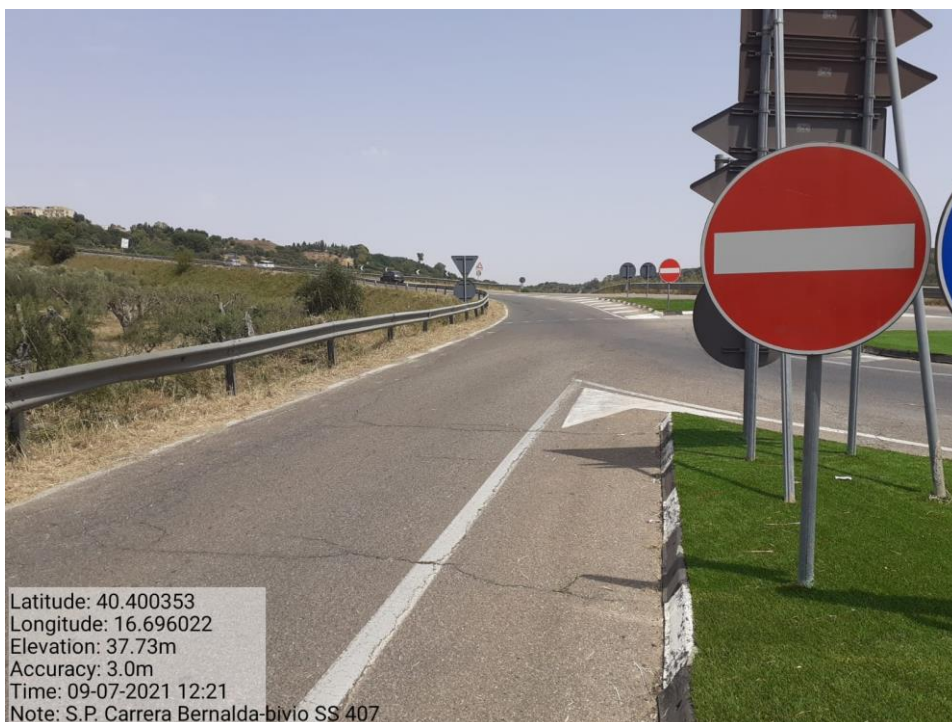
Intervento 5.1.1 Manutenzione Viabilità Provinciale (Decespugliamento) S.P Carrera — POST OPERAM