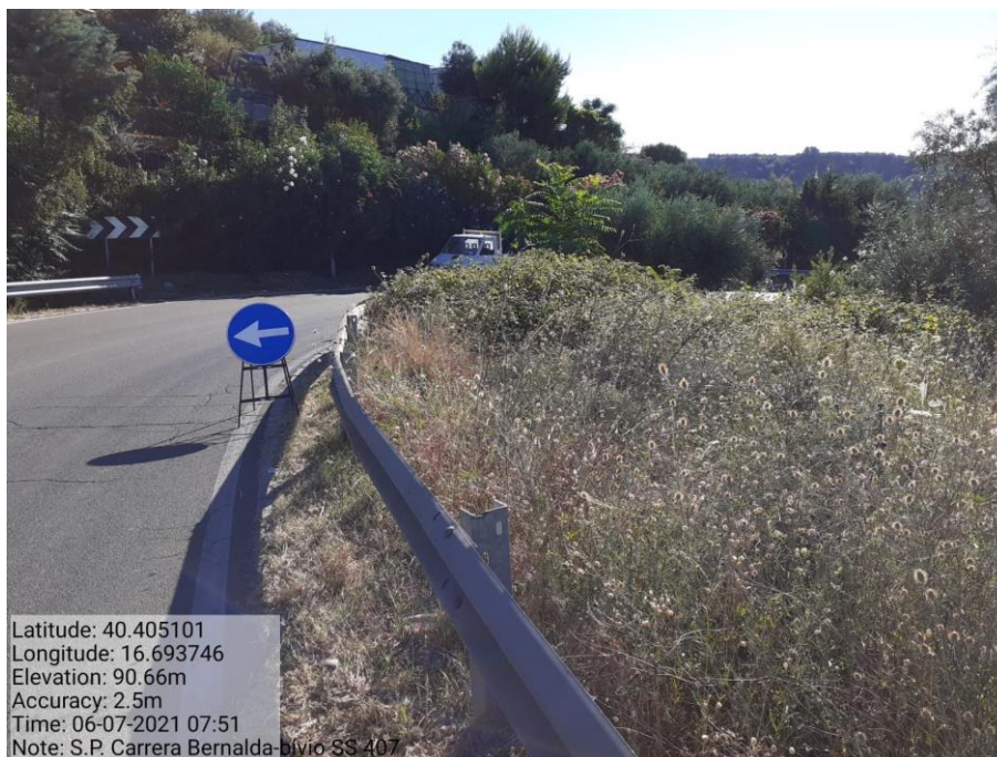
Intervento 5.1.1 Manutenzione Viabilità Provinciale (Decespugliamento) S.P Carrera — ANTE OPERAM