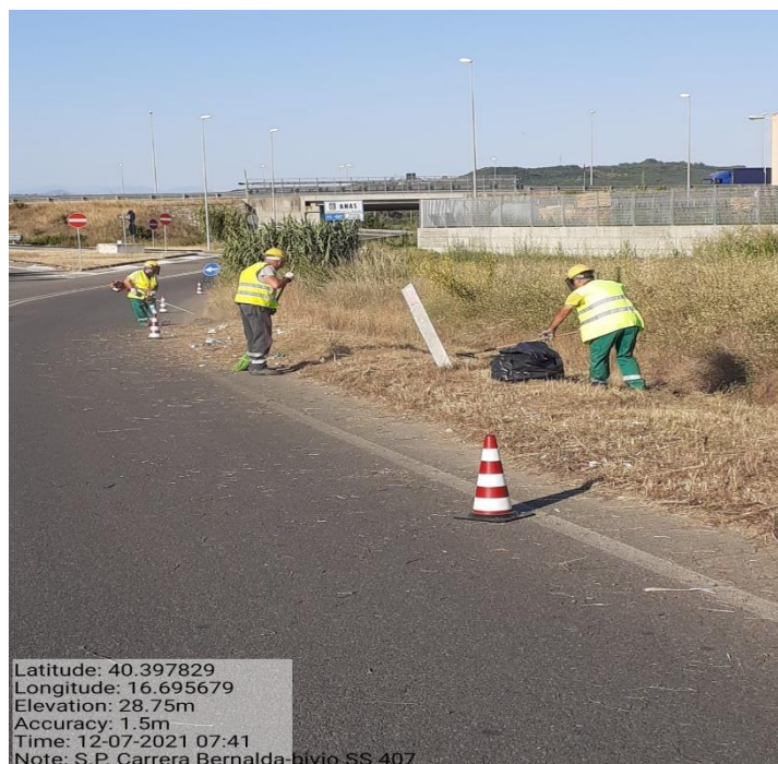
Intervento 5.1.1 Manutenzione Viabilità Provinciale (Decespugliamento) S.P Carrera — POST OPERAM