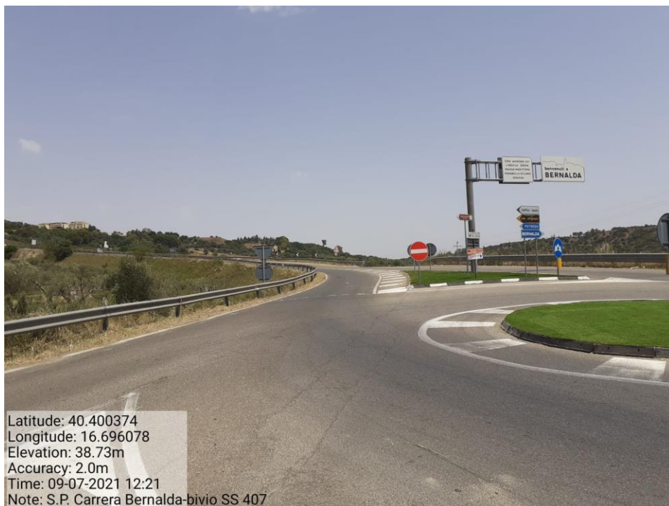
Intervento 5.1.1 Manutenzione Viabilità Provinciale (Decespugliamento) S.P Carrera — POST OPERAM