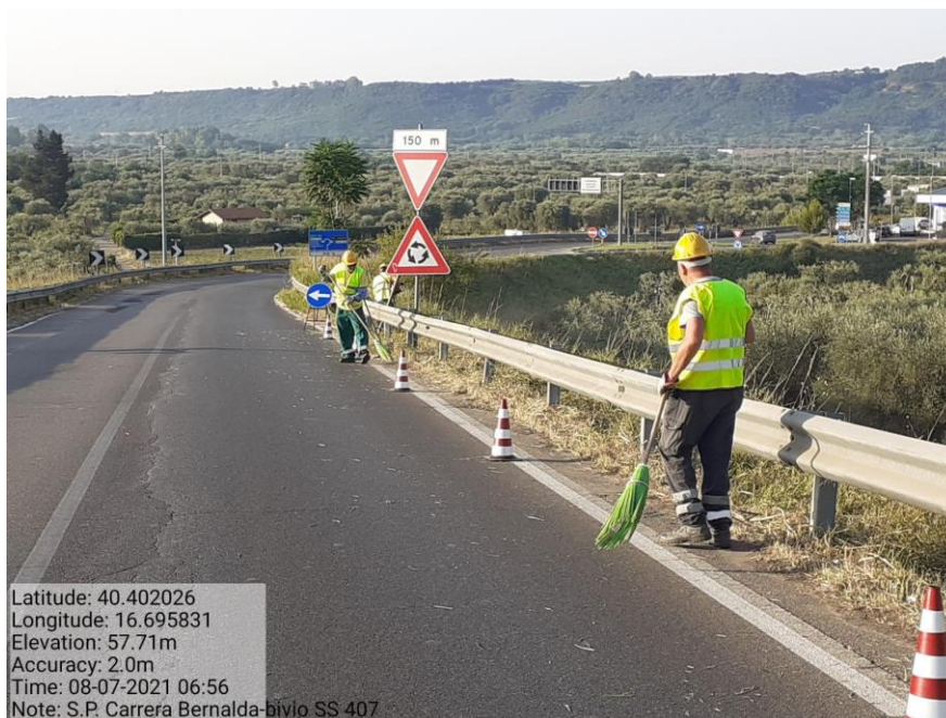
Intervento 5.1.1 Manutenzione Viabilità Provinciale (Decespugliamento) S.P Carrera — POST OPERAM