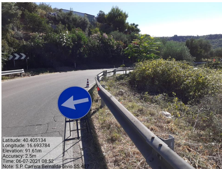
Intervento 5.1.1 Manutenzione Viabilità Provinciale (Decespugliamento) S.P Carrera — POST OPERAM