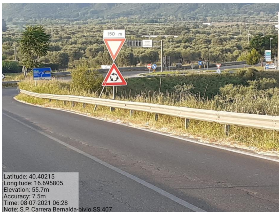
Intervento 5.1.1 Manutenzione Viabilità Provinciale (Decespugliamento) S.P Carrera — ANTE OPERAM