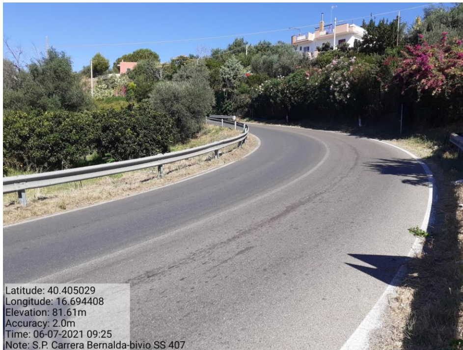
Intervento 5.1.1 Manutenzione Viabilità Provinciale (Decespugliamento) S.P Carrera — POST OPERAM