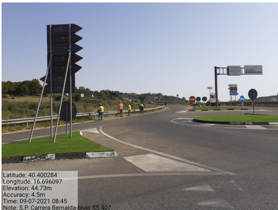
Intervento 5.1.1 Manutenzione Viabilità Provinciale (Decespugliamento) S.P Carrera — POST OPERAM