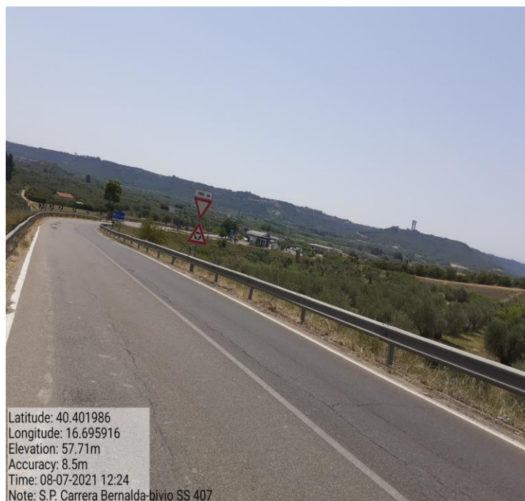
Intervento 5.1.1 Manutenzione Viabilità Provinciale (Decespugliamento) S.P Carrera — POST OPERAM