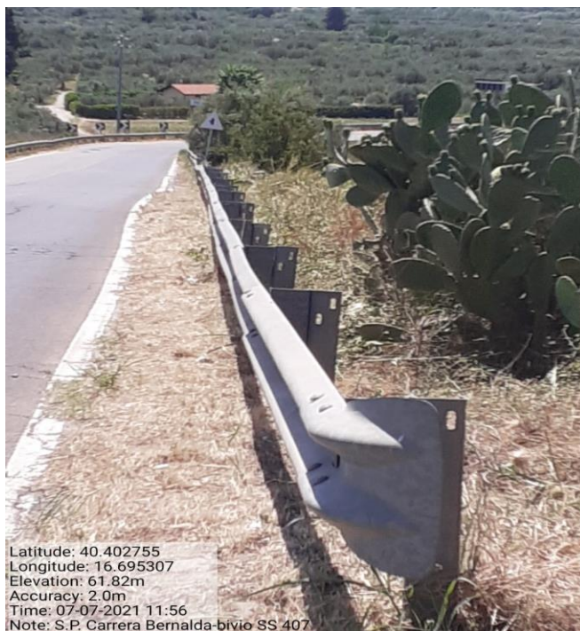
Intervento 5.1.1 Manutenzione Viabilità Provinciale (Decespugliamento) S.P Carrera — POST OPERAM