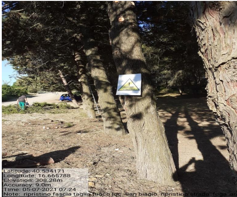
Intervento 1.1.2 Prevenzione incendio Boschivo Difesa S. Biagio 2° Tratto Fg 38 Particella 1 — POST OPERAM