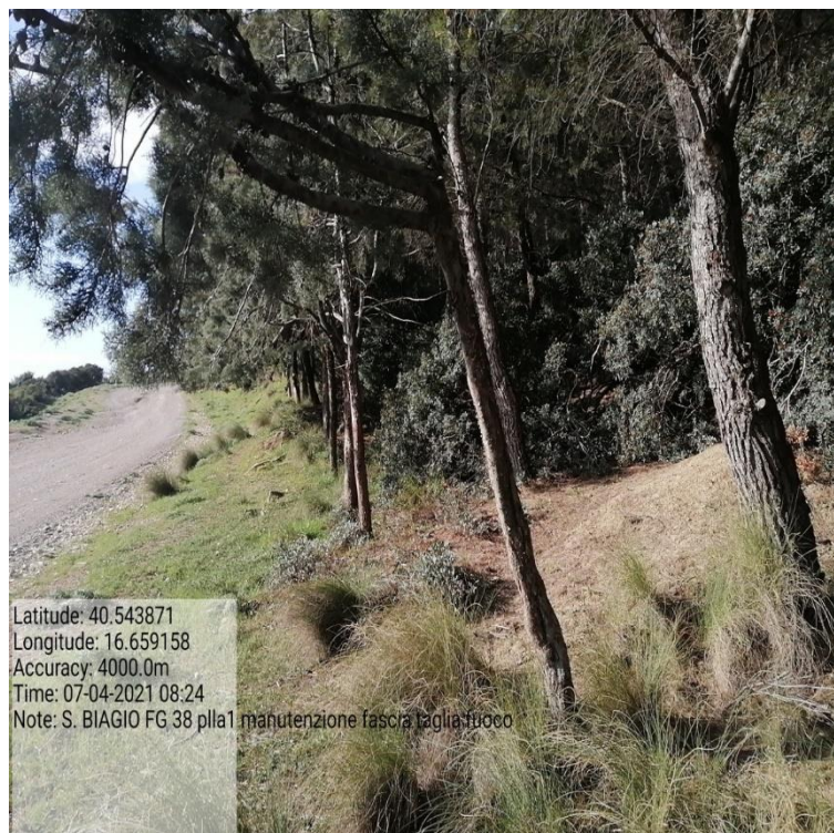
Intervento 1.1.1 Prevenzione incendio Boschivo Difesa S. Biagio 1° Tratto Fg 38 Particella 1 — ANTE OPERAM