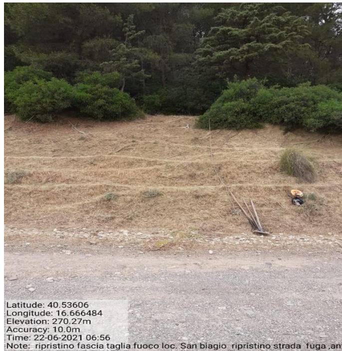
Intervento 1.1.1 Prevenzione incendio Boschivo Difesa S. Biagio 1° Tratto Fg 38 Particella 1 — POST OPERAM