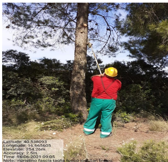
Intervento 1.1.1 Prevenzione incendio Boschivo Difesa S. Biagio 1° Tratto Fg 38 Particella 1 — ANTE OPERAM