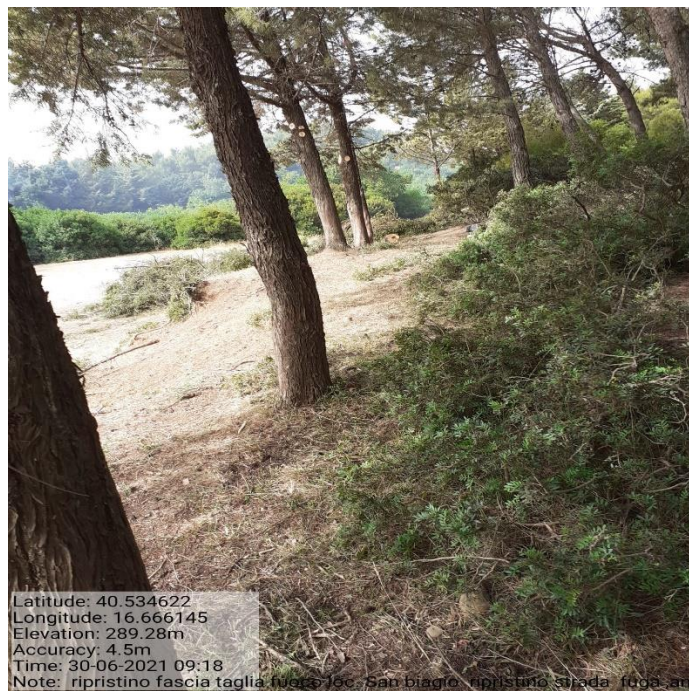
Intervento 1.1.2 Prevenzione incendio Boschivo Difesa S. Biagio 2° Tratto Fg 38 Particella 1 — POST OPERAM