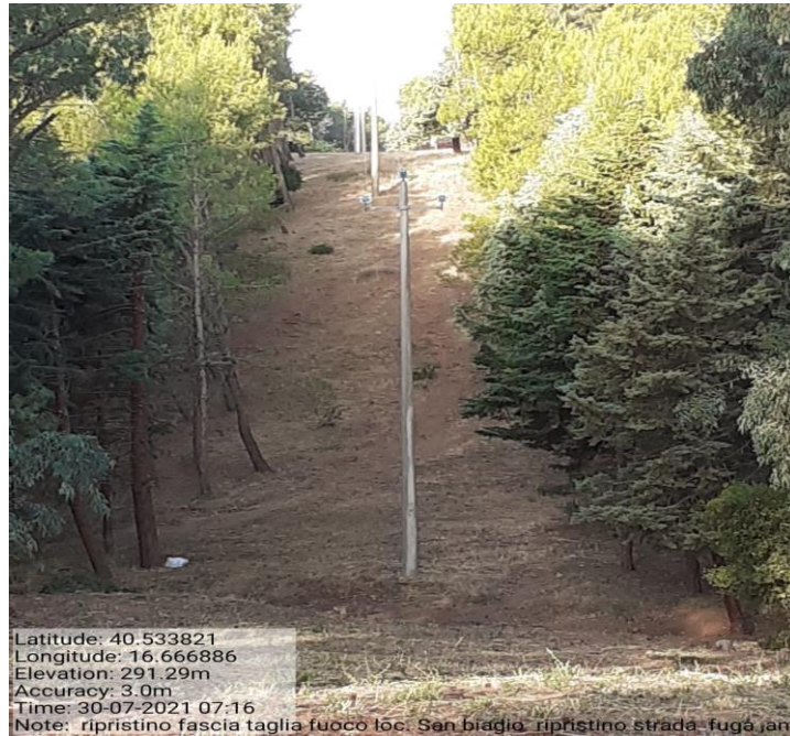
Intervento 1.1.4 Prevenzione incendio Boschivo Difesa S. Biagio 4° Tratto Fg 38 Particella 2 — POST OPERAM