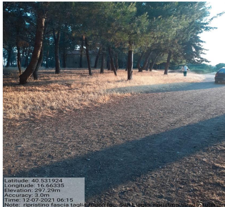
Intervento 1.1.5 Prevenzione incendio Boschivo Difesa S. Biagio 5° Tratto Fg 38 Particella 7 — POST OPERAM