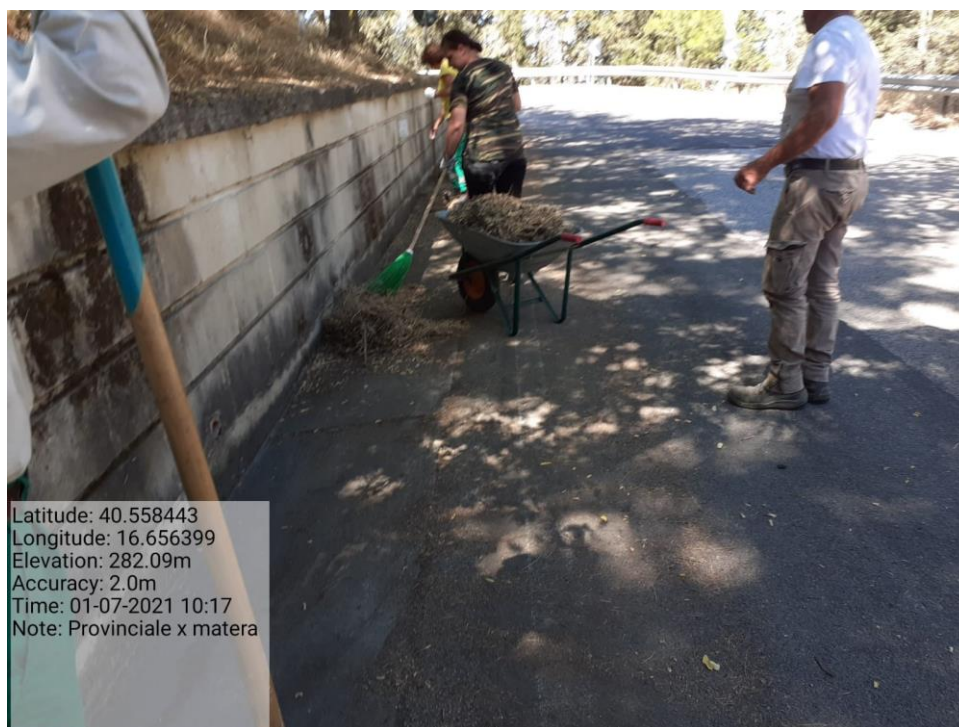
Intervento 5.2.2 Viabilità S.P. Montescaglioso -Matera (Pulizia cunette long.) — ANTE OPERAM