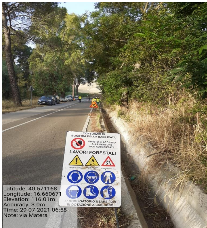
Intervento 5.2.2 Viabilità S.P. Montescaglioso -Matera (Pulizia cunette long.) — ANTE OPERAM