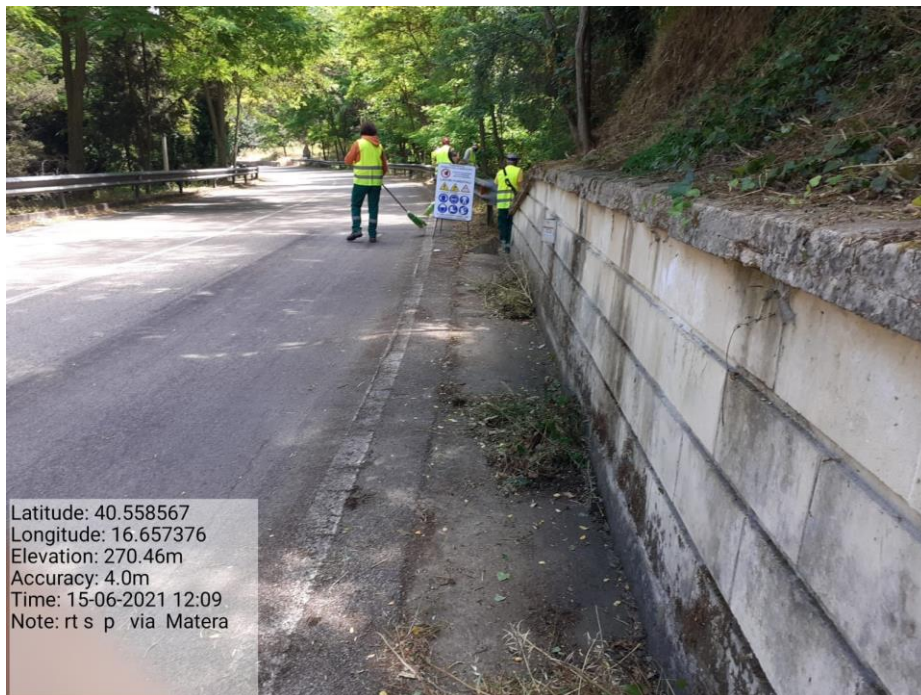
Intervento 5.2.2 Viabilità S.P. Montescaglioso -Matera (Pulizia cunette long.) — ANTE OPERAM