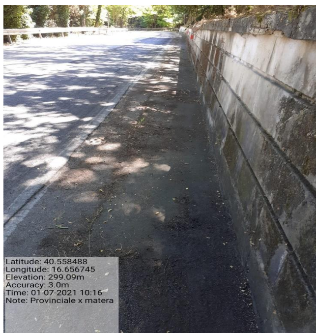
Intervento 5.2.2 Viabilità S.P. Montescaglioso -Matera (Pulizia cunette long.) — POST OPERAM