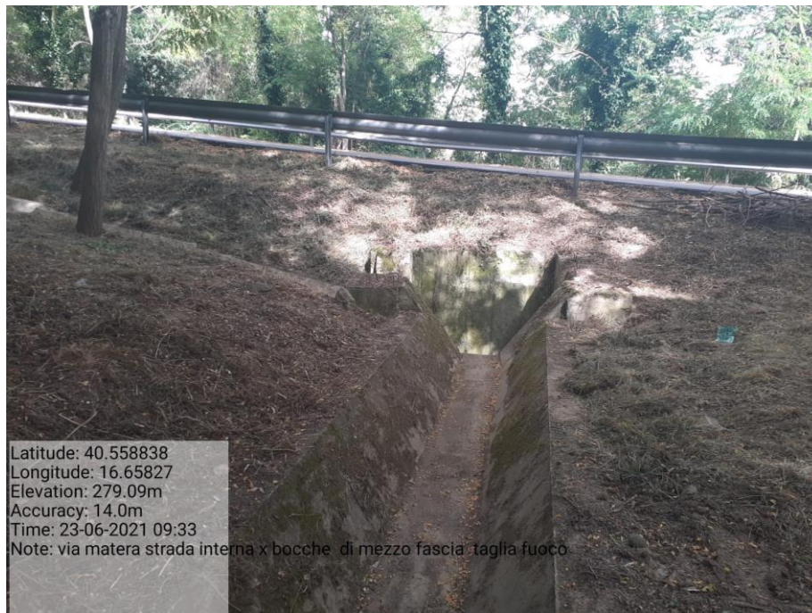
Intervento 5.2.2 Viabilità S.P. Montescaglioso -Matera (Pulizia cunette long.) — POST OPERAM