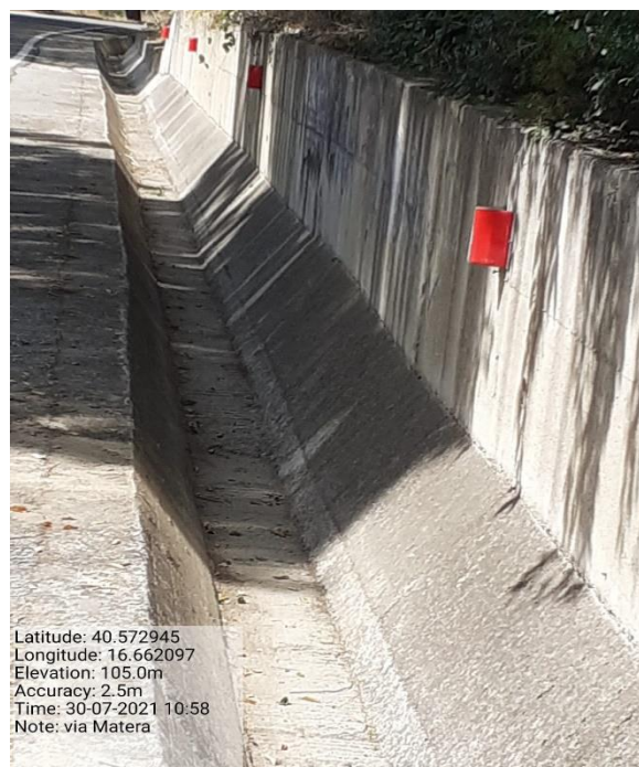
Intervento 5.2.2 Viabilità S.P. Montescaglioso -Matera (Pulizia cunette long.) — POST OPERAM