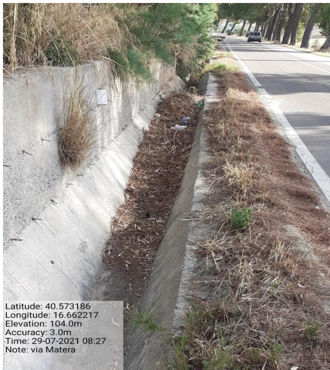
Intervento 5.2.2 Viabilità S.P. Montescaglioso -Matera (Pulizia cunette long.) — ANTE OPERAM