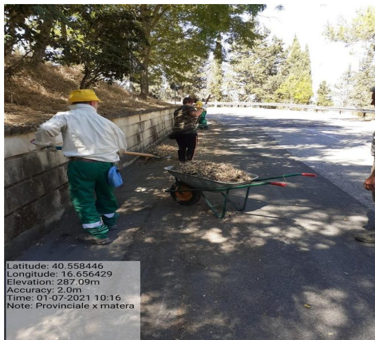
Intervento 5.2.2 Viabilità S.P. Montescaglioso -Matera (Pulizia cunette long.) — POST OPERAM