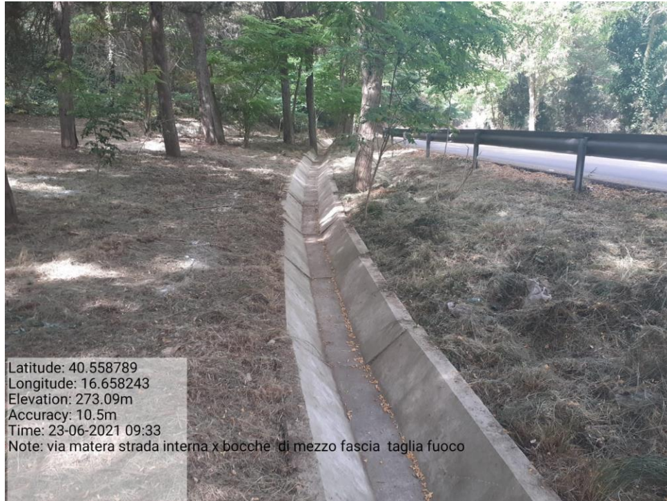
Intervento 5.2.2 Viabilità S.P. Montescaglioso -Matera (Pulizia cunette long.) — POST OPERAM