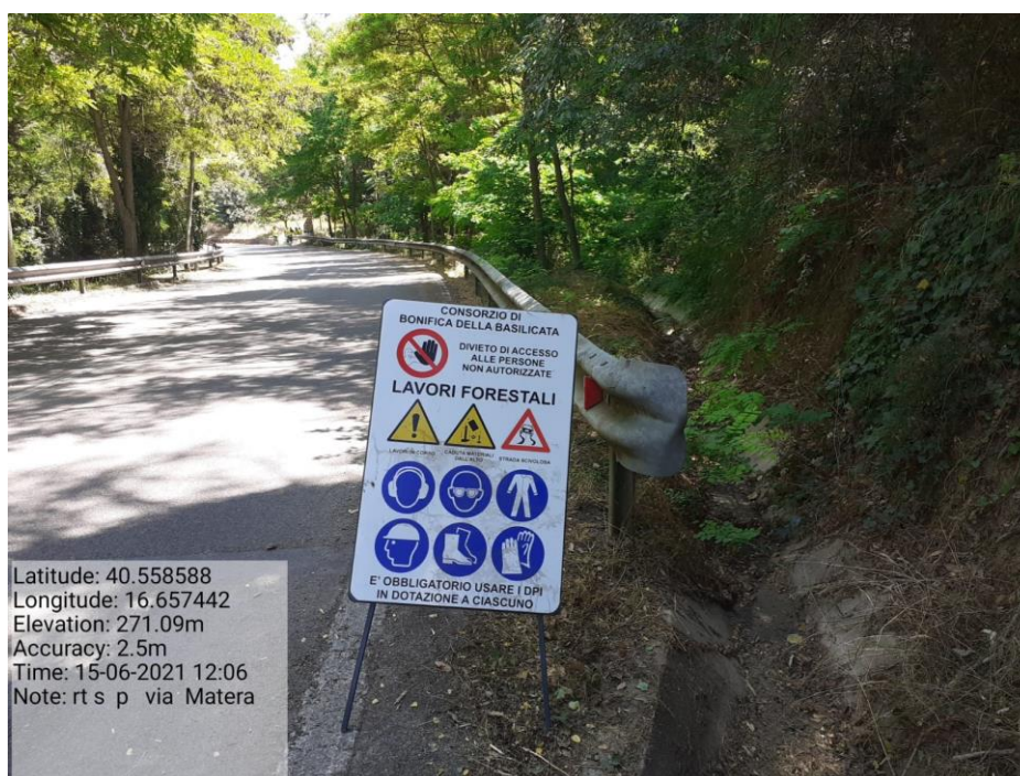
Intervento 5.2.2 Viabilità S.P. Montescaglioso -Matera (Pulizia cunette long.) — ANTE OPERAM