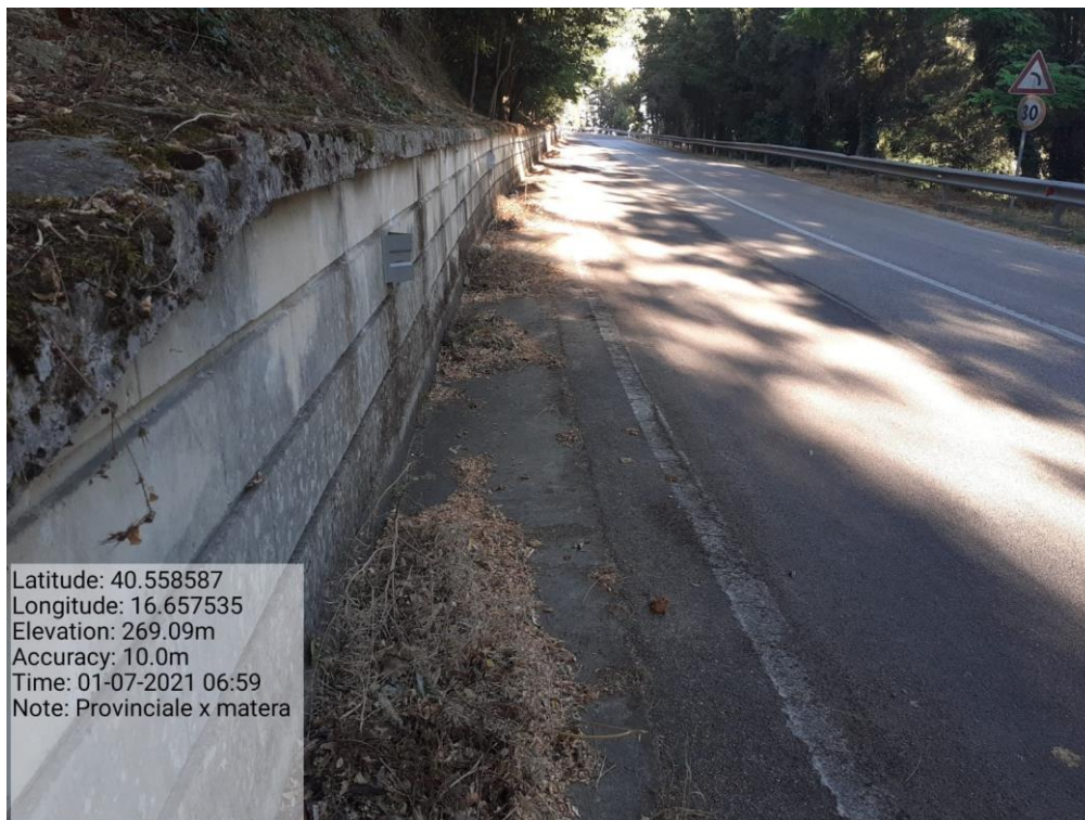
Intervento 5.2.2 Viabilità S.P. Montescaglioso -Matera (Pulizia cunette long.) — ANTE OPERAM