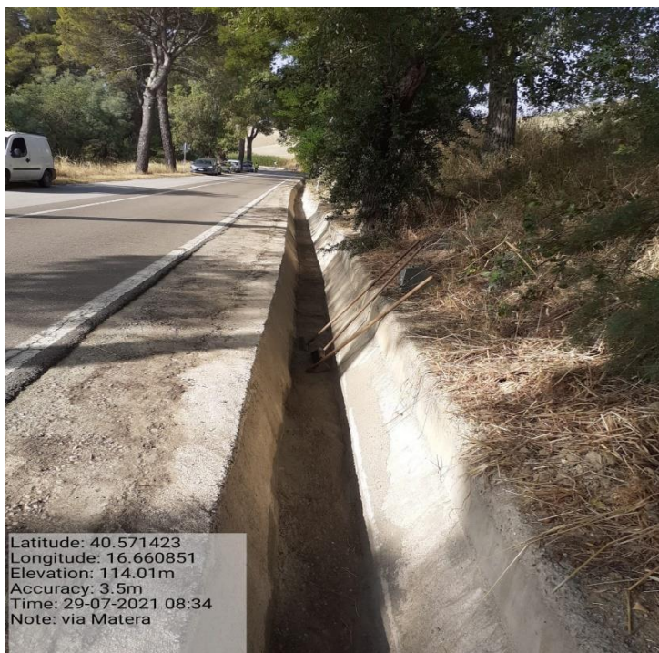
Intervento 5.2.2 Viabilità S.P. Montescaglioso -Matera (Pulizia cunette long.) — POST OPERAM