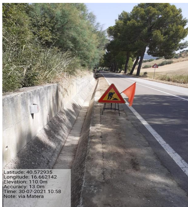
Intervento 5.2.2 Viabilità S.P. Montescaglioso -Matera (Pulizia cunette long.) — POST OPERAM