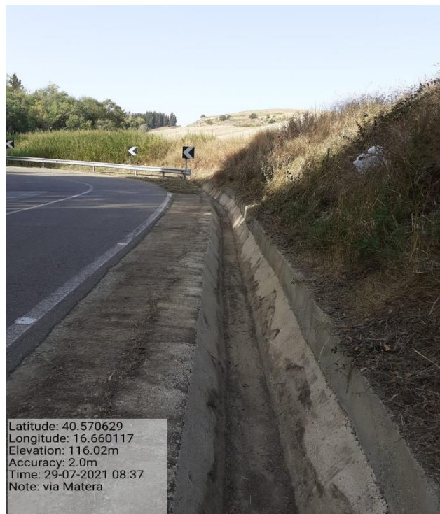
Intervento 5.2.2 Viabilità S.P. Montescaglioso -Matera (Pulizia cunette long.) — POST OPERAM