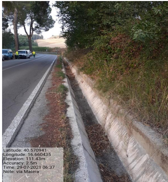
Intervento 5.2.2 Viabilità S.P. Montescaglioso -Matera (Pulizia cunette long.) — ANTE OPERAM