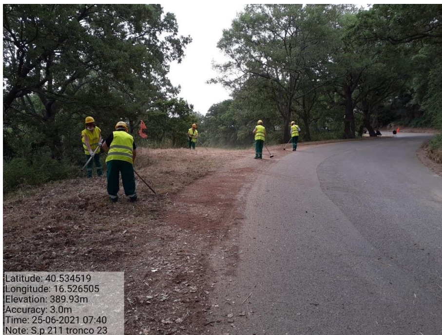
Intervento 5.1.9 Manutenzione Viabilità comunale (Decespugliamento ) Tronco 23 SP 211 ANTE OPERAM