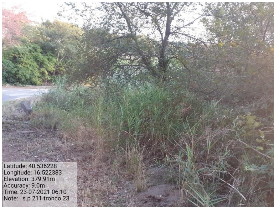
Intervento 5.1.9 Manutenzione Viabilità comunale (Decespugliamento ) Tronco 23 SP 211 ANTE OPERAM