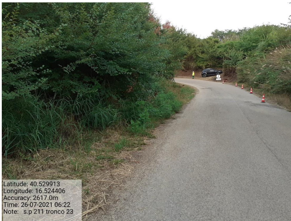
Intervento 5.1.9 Manutenzione Viabilità comunale (Decespugliamento ) Tronco 23 SP 211 ANTE OPERAM