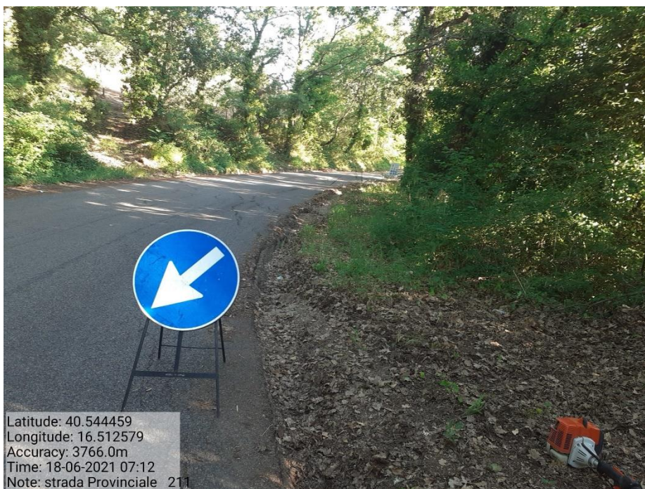
Intervento 5.1.9 Manutenzione Viabilità comunale (Decespugliamento ) Tronco 23 SP 211 ANTE OPERAM

Latitude: 40.544459 Longitude: 16.512579 Accuracy: 3766.0m Time: 18-06-2021 07:12 Note: strada Provinciale 211