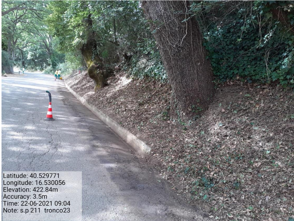
Intervento 5.1.9 Manutenzione Viabilità comunale (Decespugliamento ) Tronco 23 SP 211 POST OPERAM