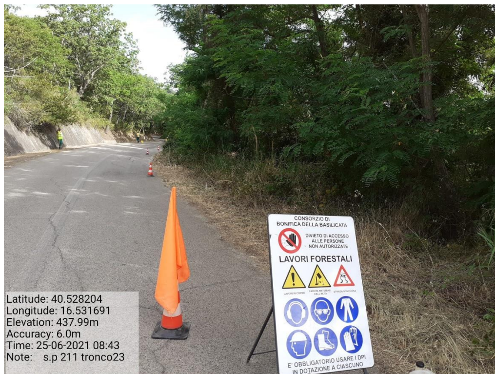
Intervento 5.1.9 Manutenzione Viabilità comunale (Decespugliamento ) Tronco 23 SP 211 ANTE OPERAM