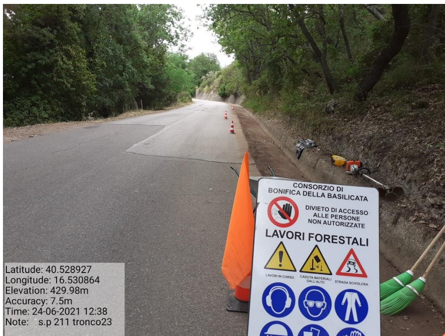
Intervento 5.1.9 Manutenzione Viabilità comunale (Decespugliamento ) Tronco 23 SP 211 POST OPERAM