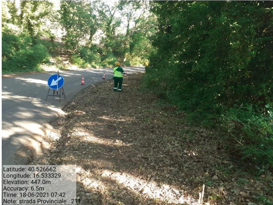
Intervento 5.1.9 Manutenzione Viabilità comunale (Decespugliamento ) Tronco 23 SP 211 POST OPERAM