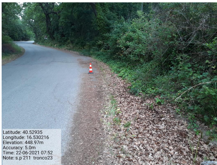
Intervento 5.1.9 Manutenzione Viabilità comunale (Decespugliamento ) Tronco 23 SP 211 ANTE OPERAM