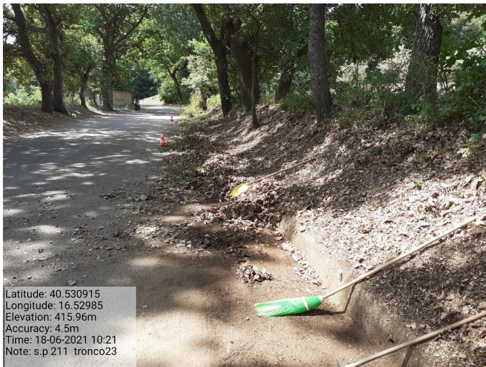
Intervento 5.1.9 Manutenzione Viabilità comunale (Decespugliamento ) Tronco 23 SP 211 ANTE OPERAM