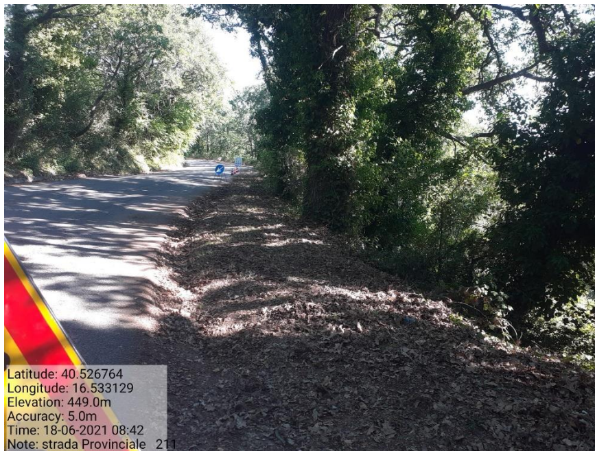
Intervento 5.1.9 Manutenzione Viabilità comunale (Decespugliamento ) Tronco 23 SP 211 POST OPERAM