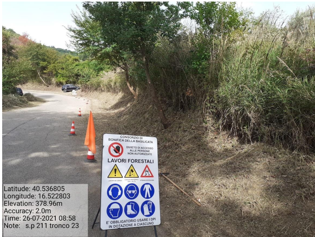
Intervento 5.1.9 Manutenzione Viabilità comunale (Decespugliamento ) Tronco 23 SP 211 POST OPERAM