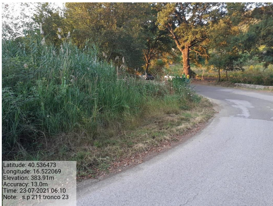
Intervento 5.1.9 Manutenzione Viabilità comunale (Decespugliamento ) Tronco 23 SP 211 ANTE OPERAM