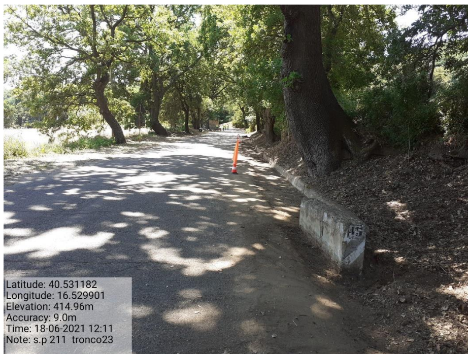
Intervento 5.1.9 Manutenzione Viabilità comunale (Decespugliamento ) Tronco 23 SP 211 POST OPERAM