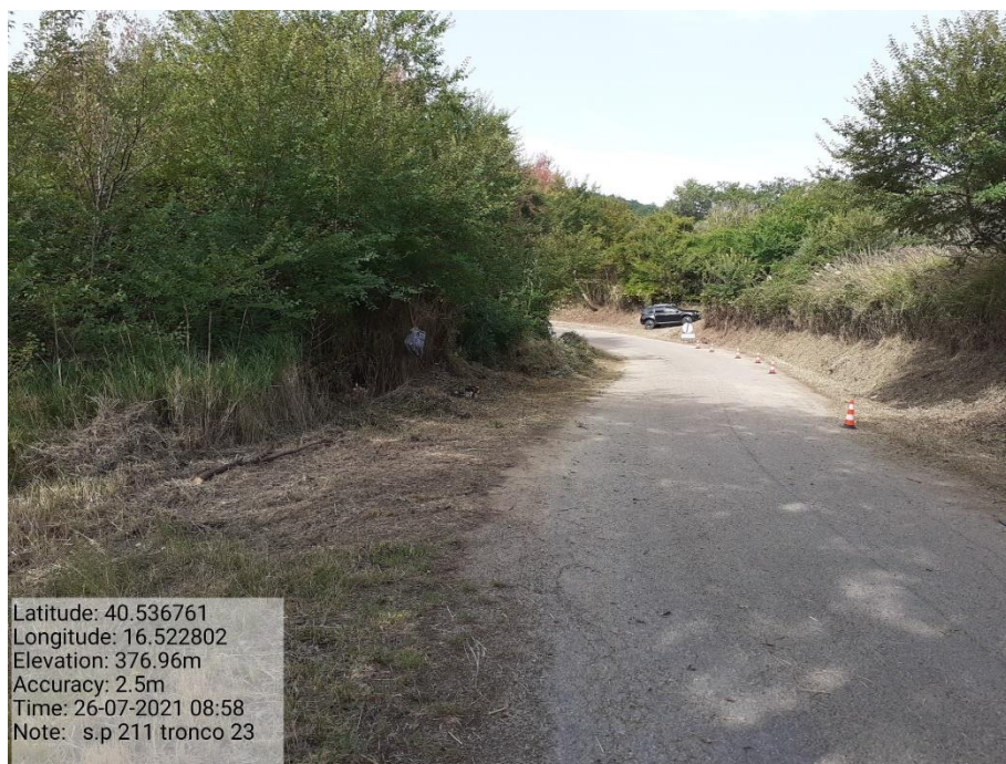
Intervento 5.1.9 Manutenzione Viabilità comunale (Decespugliamento ) Tronco 23 SP 211 POST OPERAM