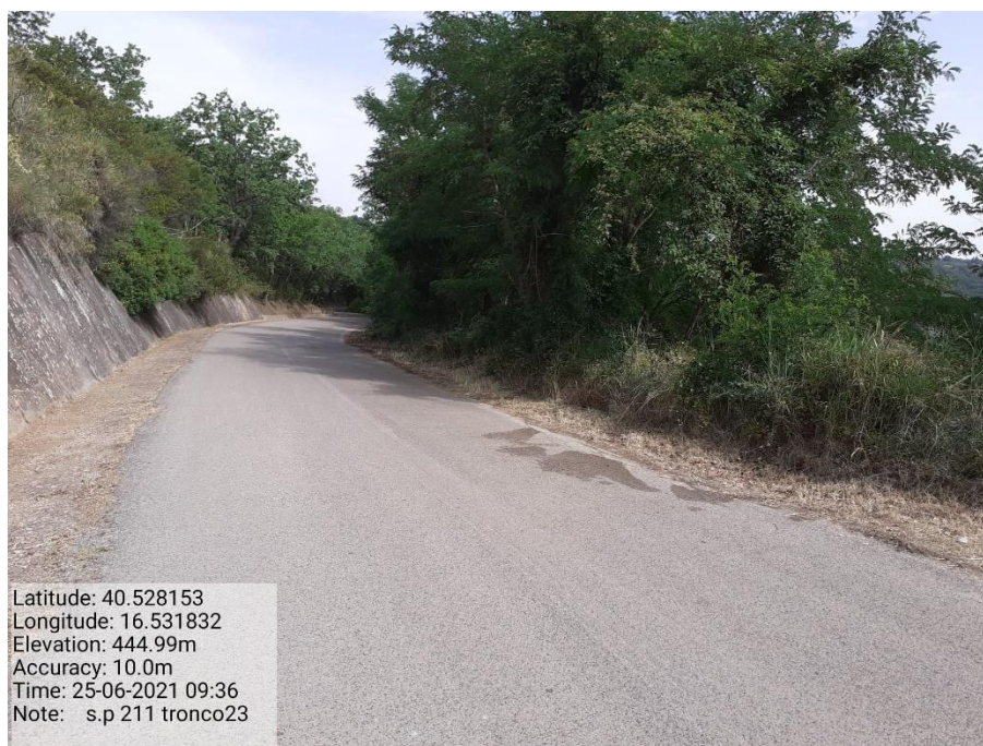
Intervento 5.1.9 Manutenzione Viabilità comunale (Decespugliamento ) Tronco 23 SP 211 POST OPERAM