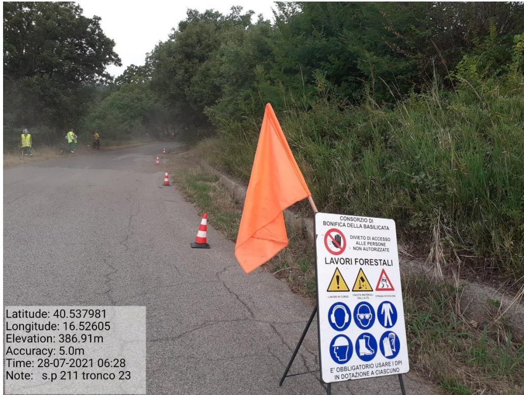
Intervento 5.1.9 Manutenzione Viabilità comunale (Decespugliamento ) Tronco 23 SP 211 ANTE OPERAM