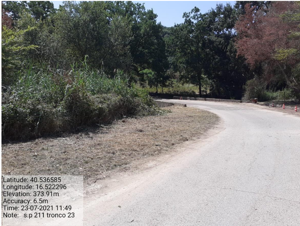
Intervento 5.1.9 Manutenzione Viabilità comunale (Decespugliamento ) Tronco 23 SP 211 POST OPERAM