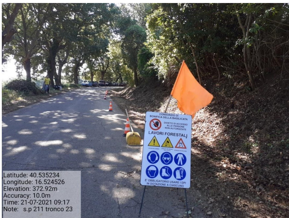
Intervento 5.1.9 Manutenzione Viabilità comunale (Decespugliamento ) Tronco 23 SP 211 ANTE OPERAM