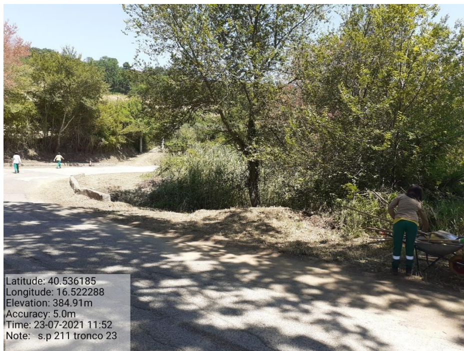
Intervento 5.1.9 Manutenzione Viabilità comunale (Decespugliamento ) Tronco 23 SP 211 POST OPERAM