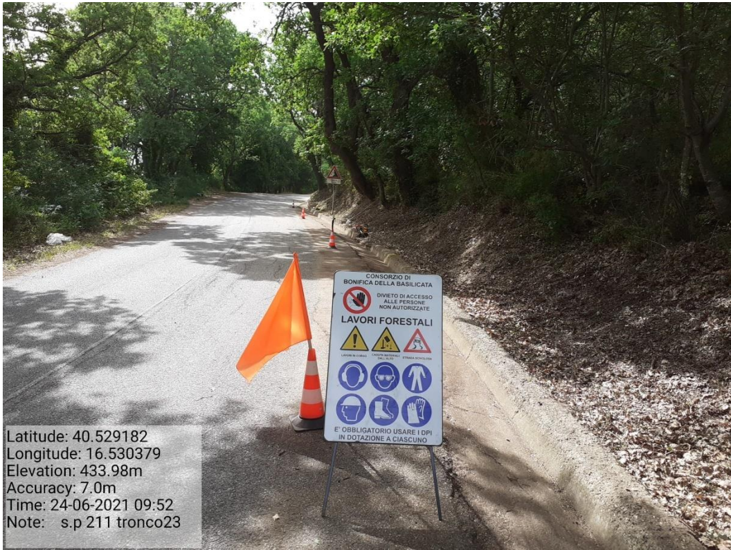
Intervento 5.1.9 Manutenzione Viabilità comunale (Decespugliamento ) Tronco 23 SP 211 POST OPERAM