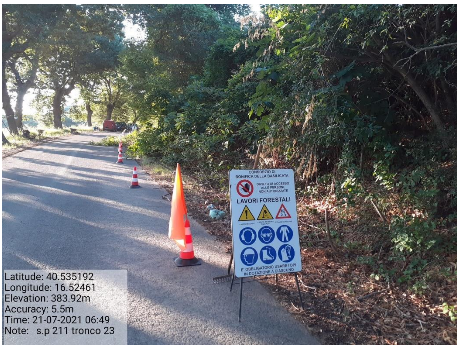
Intervento 5.1.9 Manutenzione Viabilità comunale (Decespugliamento ) Tronco 23 SP 211 ANTE OPERAM