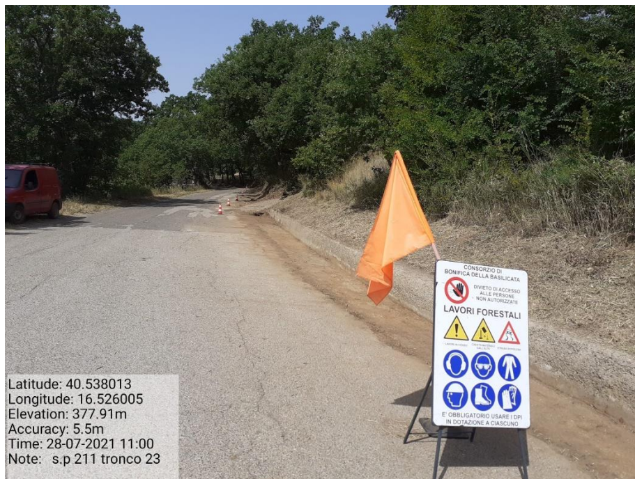
Intervento 5.1.9 Manutenzione Viabilità comunale (Decespugliamento ) Tronco 23 SP 211 POST OPERAM