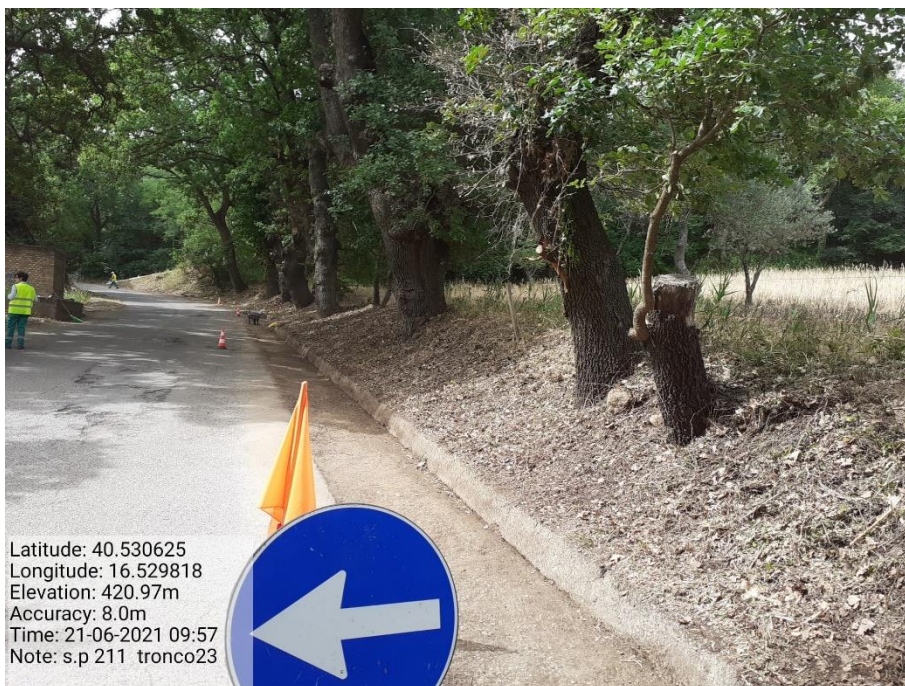
Intervento 5.1.9 Manutenzione Viabilità comunale (Decespugliamento ) Tronco 23 SP 211 POST OPERAM