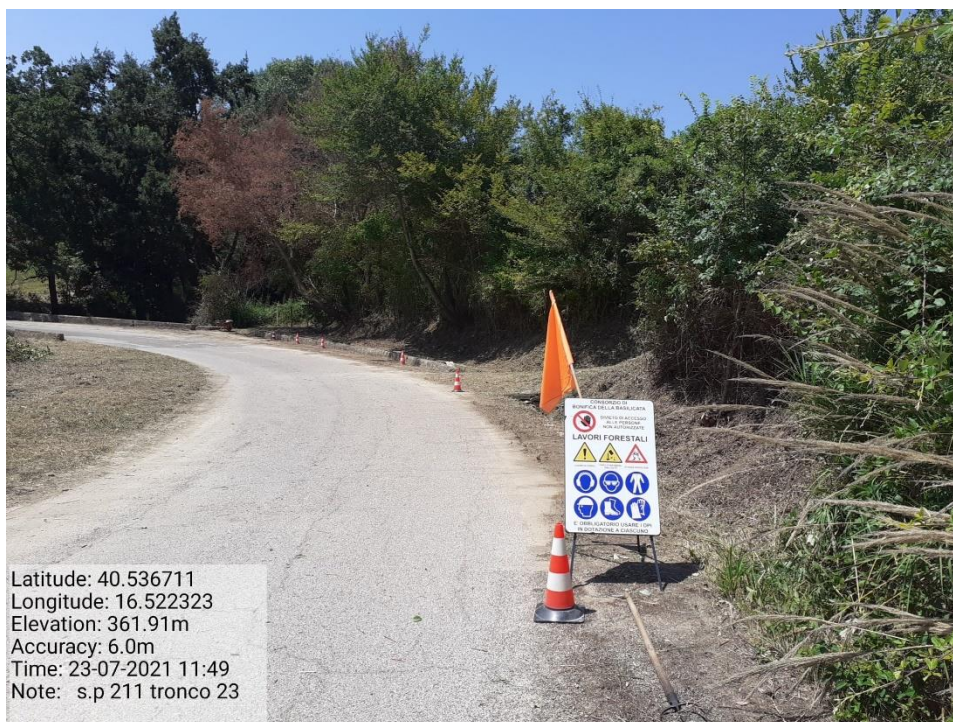
Intervento 5.1.9 Manutenzione Viabilità comunale (Decespugliamento ) Tronco 23 SP 211 POST OPERAM