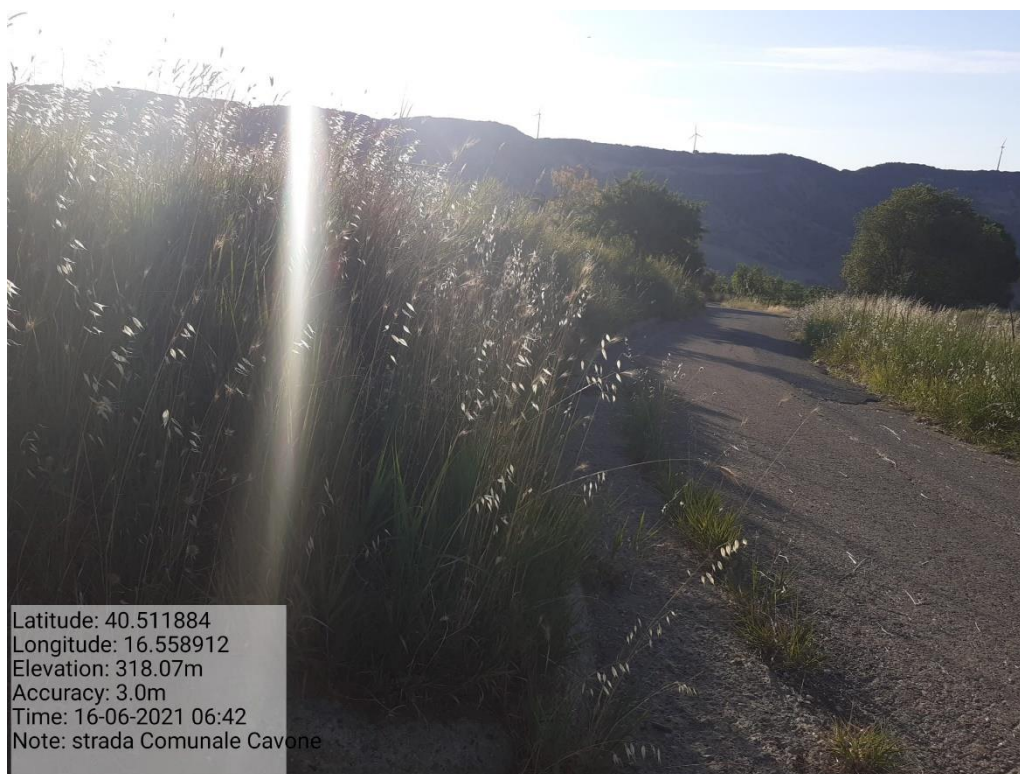
Intervento 5.1.5 Manutenzione Viabilità comunale (Decespugliamento ) località CAVONE ANTE OPERAM