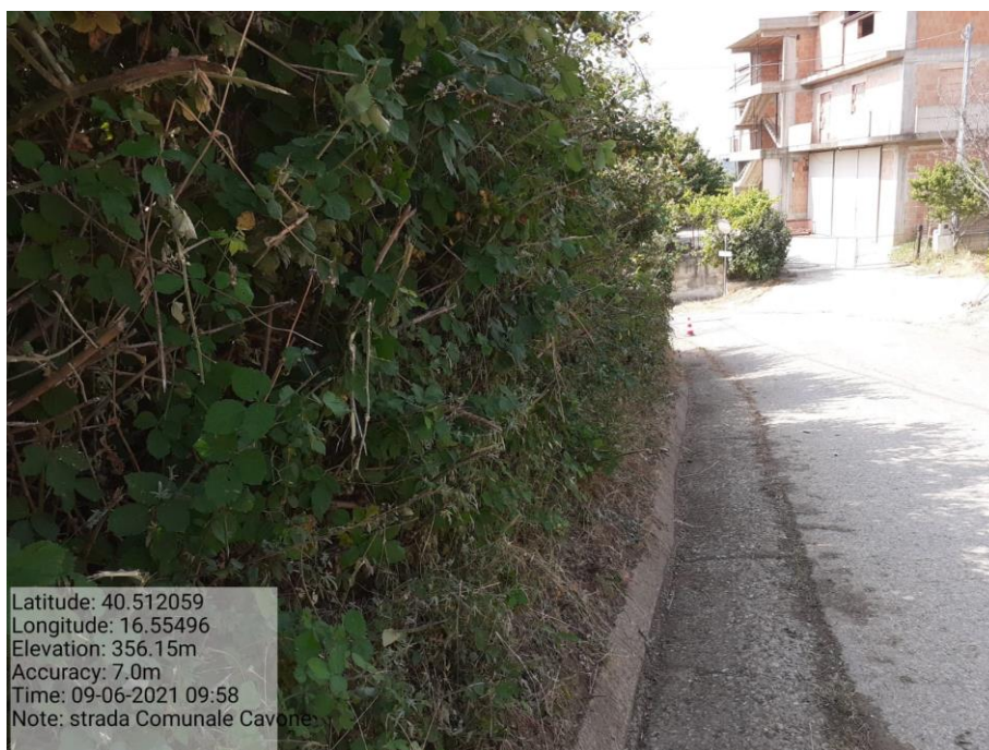
Intervento 5.1.5 Manutenzione Viabilità comunale (Decespugliamento ) località CAVONE POST OPERAM