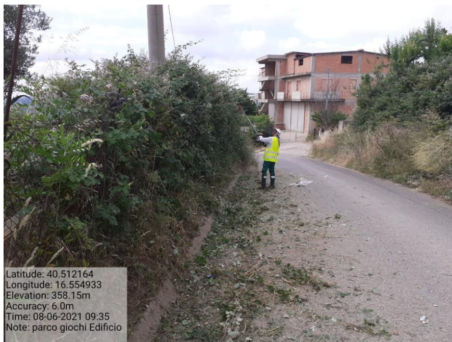
Intervento 5.1.5 Manutenzione Viabilità comunale (Decespugliamento ) località CAVONE ANTE OPERAM