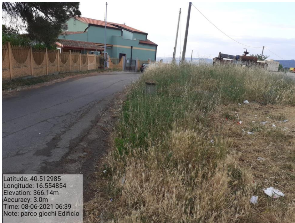
Intervento 5.1.5 Manutenzione Viabilità comunale (Decespugliamento ) località CAVONE ANTE OPERAM