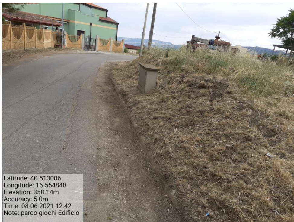
Intervento 5.1.5 Manutenzione Viabilità comunale (Decespugliamento ) località CAVONE POST OPERAM