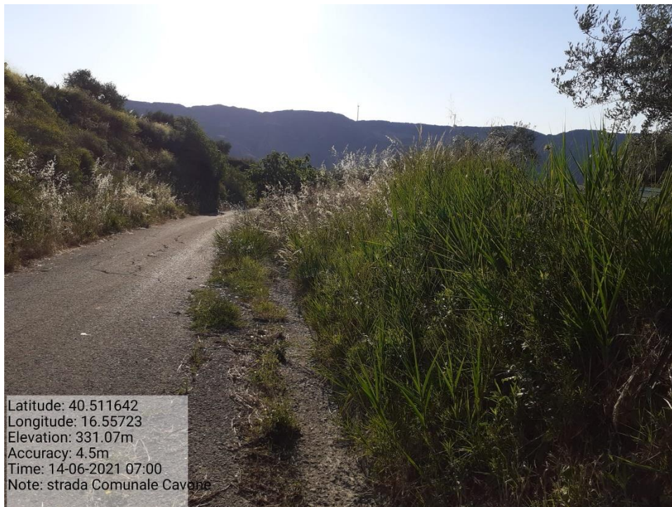
Intervento 5.1.5 Manutenzione Viabilità comunale (Decespugliamento ) località CAVONE ANTE OPERAM