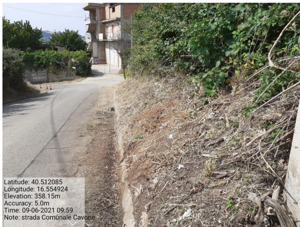
Intervento 5.1.5 Manutenzione Viabilità comunale (Decespugliamento ) località CAVONE POST OPERAM