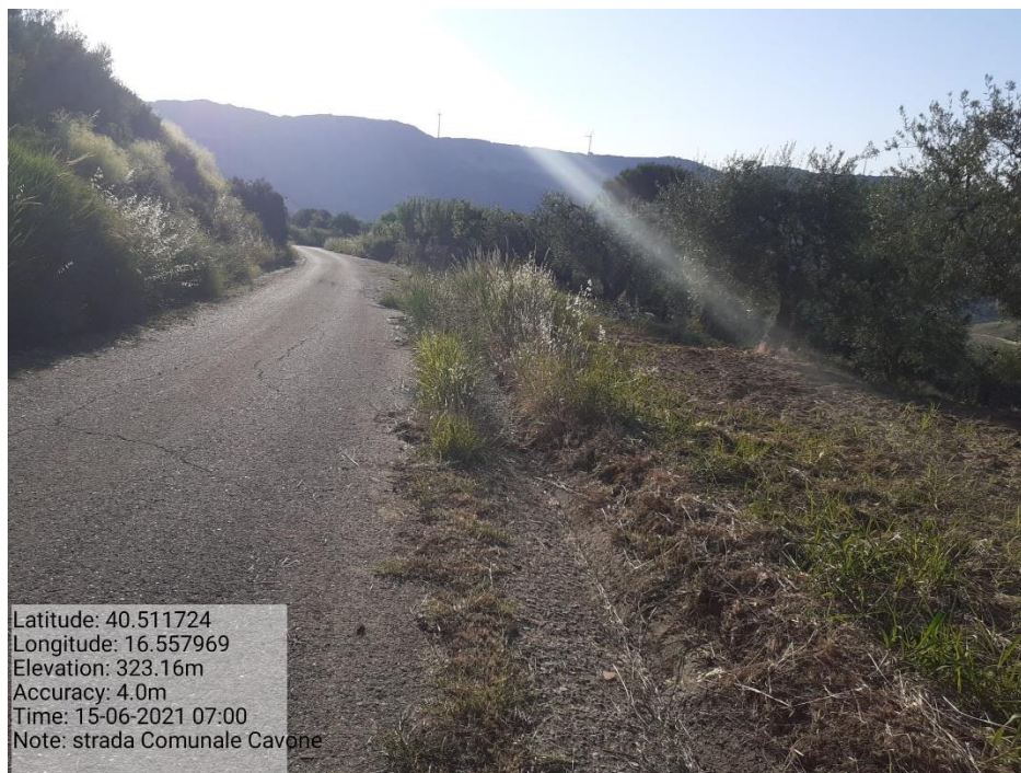
Intervento 5.1.5 Manutenzione Viabilità comunale (Decespugliamento ) località CAVONE ANTE OPERAM