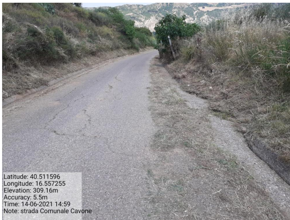
Intervento 5.1.5 Manutenzione Viabilità comunale (Decespugliamento ) località CAVONE POST OPERAM