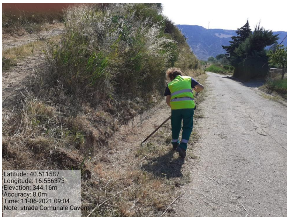
Intervento 5.1.5 Manutenzione Viabilità comunale (Decespugliamento ) località CAVONE POST OPERAM