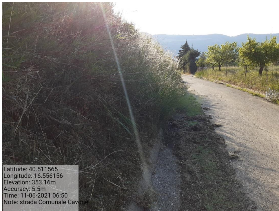
Intervento 5.1.5 Manutenzione Viabilità comunale (Decespugliamento ) località CAVONE ANTE OPERAM