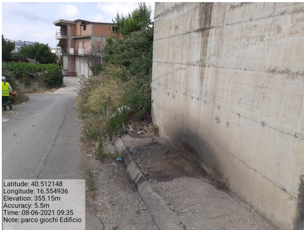
Intervento 5.1.5 Manutenzione Viabilità comunale (Decespugliamento ) località CAVONE ANTE OPERAM