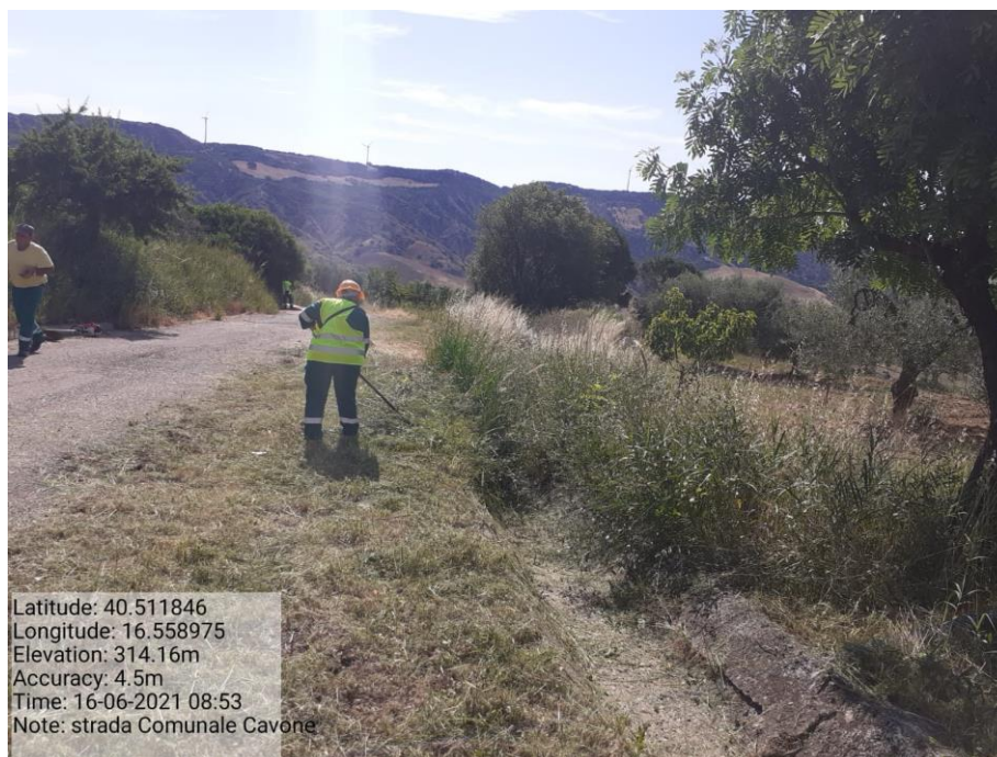
Intervento 5.1.5 Manutenzione Viabilità comunale (Decespugliamento ) località CAVONE POST OPERAM