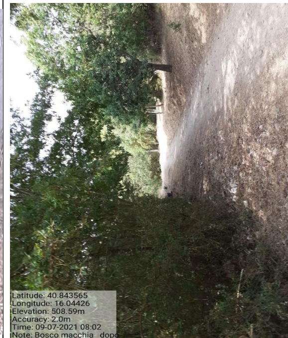
Manut.ne fascia ant.dio prima 1.1.1

Latitude: 40.843565 Longitude: 16.04426 Elevation: 508.59m Accuracy: 2.0m Time: 09-07-2021 08:02 Note: Bosco macchia dopo