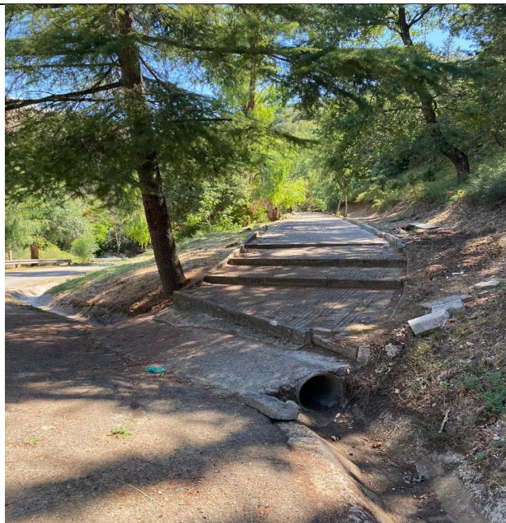
Manut.ne verde pubblico Capo D'Acqua dopo 2.1.2