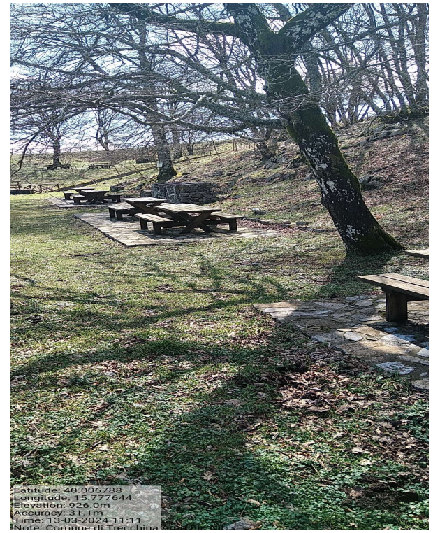
Azione d_2 Int. 1 sentiero forestale monte S. Maria_ Foto 1 Azione e_6 Int.2 area verde monte S. Maria/Majorino_ Foto 1