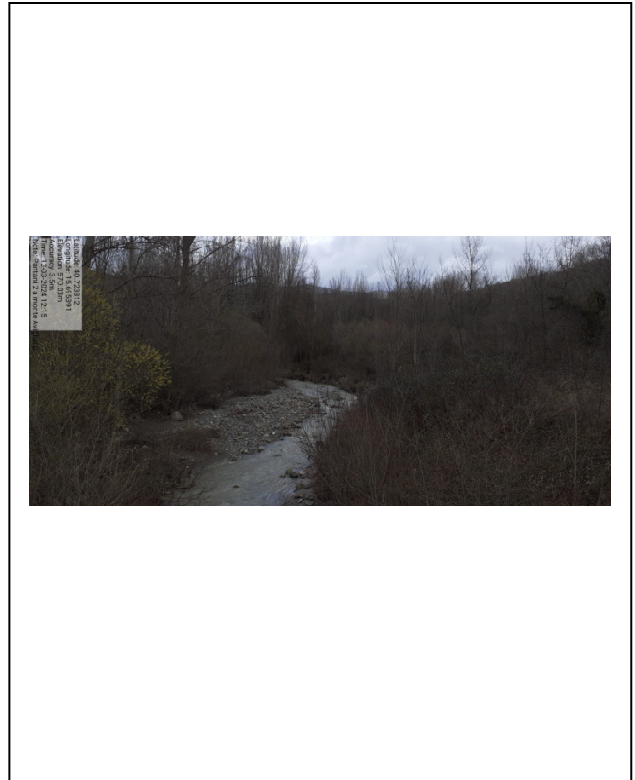
- Int. 2 – Fosso Pantani 2 - Avigliano