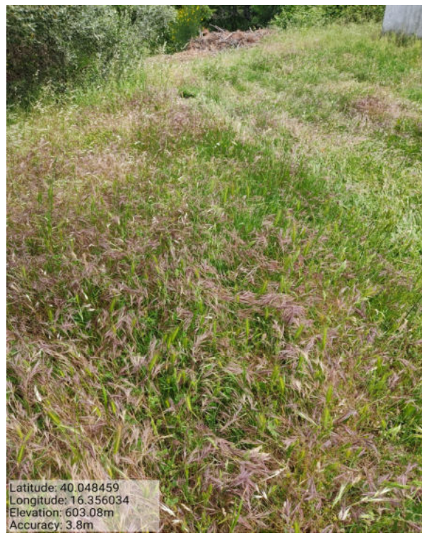
Foto 2 -AZIONE d) Int. n. 2. –Zona Cimiteriale Manutenzione viale tagliafuoco attivo.