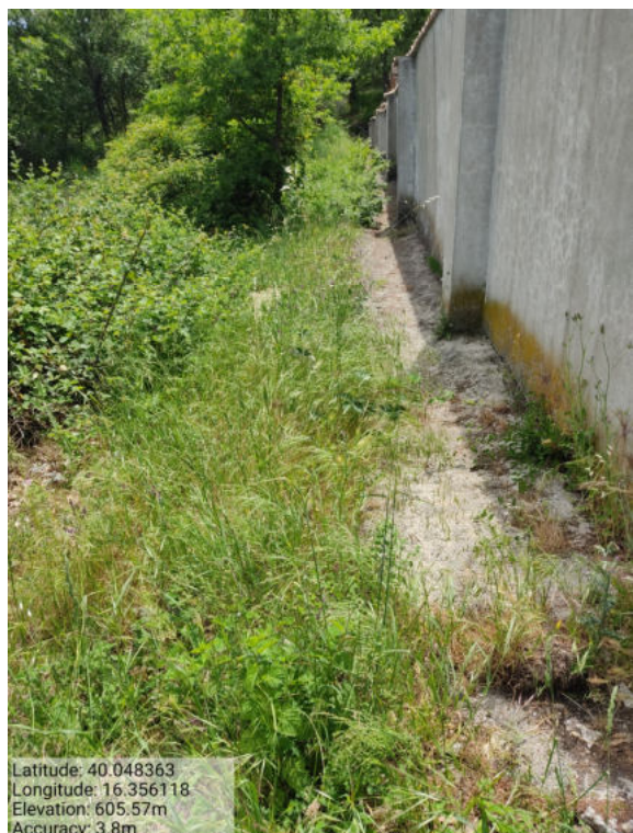
Foto 1 -AZIONE d) Int. n. 2. –Zona Cimiteriale - Manutenzione viale tagliafuoco attivo.