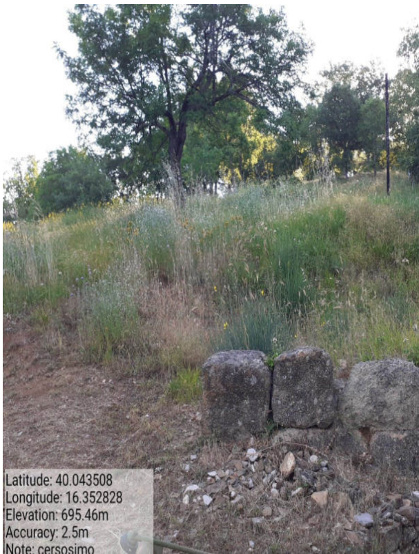
Foto 1 -AZIONE d) Int. n. 2. –Loc. Scavi - Manutenzione viale tagliafuoco attivo.