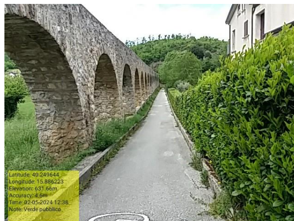
Int. e. 1.1 manutenzione verde urbano - Foto 9 . e. 1.1 manutenzione verde urbano Foto 10