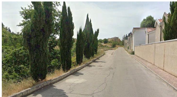
Int. 2.1.5 – Area cimitero Foto n° 1