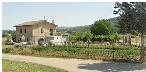
Int. 6.3.8.1+6.3.8.2 - Strada carraro dell’olmo Foto n°2