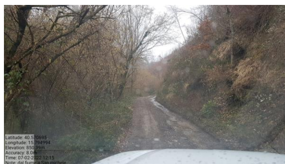
Int. 4.1.1- Strada forestale per l'abbazia di San Michele Foto n° 2