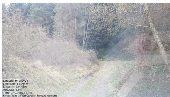
Int. . 6.3.14.1 +6.3.14.2 Strada per fontana comune Foto n° 1