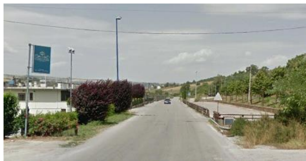
Int. 6.3.11.1+6.3.11.2 Strada fosso del lago Foto n°2