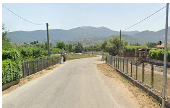
Int. 6.3.10.1+6.3.10.2 - Strada Sciffra -Petrucco Foto n°1