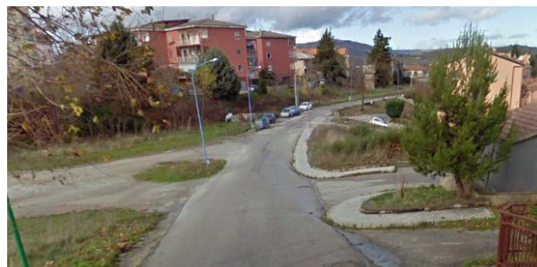
Int. 2.1.1 - centro abitato Foto n° 2