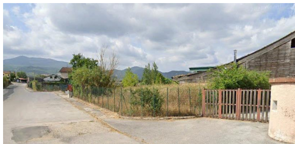
Int. 2.1.4 – Centro sportivo Foto n° 1