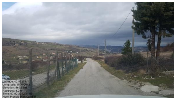
Int. 6.3.14.1 +6.3.14.2 Strada per fontana comune Foto n° 1