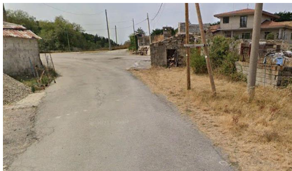
Int. 2.1.3 - Frazione C.da Rifreddo Foto n° 1