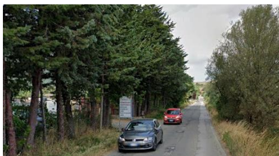
Int. 6.3.4.1+6.3.4.2 - Strada comunale Tintera-Lago Foto n°1