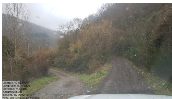
Int. 4.1.1- Strada forestale per l'abbazia di San Michele Foto n° 1