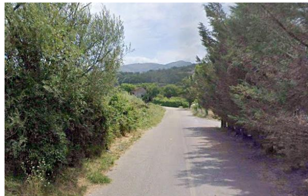
Int.2.1.7+2.2.7-Pista ciclopedonale Pignola-lago Foto n° 2