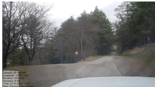
Int. 6.3.13.1+6.3.13.2 Strada PianCardillo- Rifreddo Foto n° 2