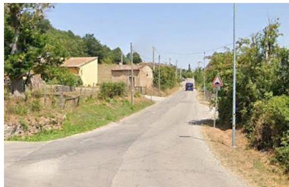
Int. 6.3.10.1+6.3.10.2- Strada Sciffra -Petrucco Foto n°2