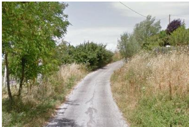
Int. 6.3.11.1+6.3.11.2 Strada fosso del lago Foto n°1