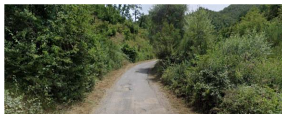
Int. 1.1.2 - 2° tratto fascia antincendio Foto n° 2