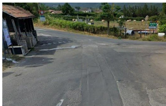
Int. 6.3.4.1+6.3.4.2 - Strada comunale Tintera-Lago Foto n°2