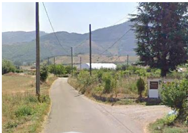
Int.6.3.7.1+6.3.7.2- Strada vicinale dell’Arciprete Foto n°1