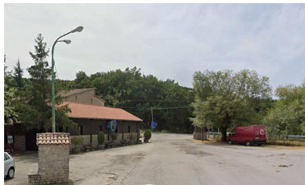
Int. 2.1.3 - Frazione C.da Rifreddo Foto n° 2