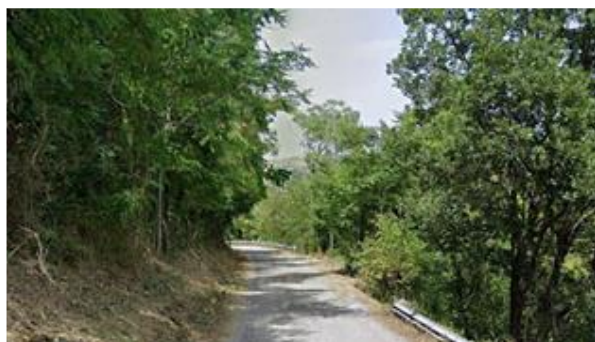
Int. 1.1.1 – 1° tratto fascia antincendio su SP Foto n° 1