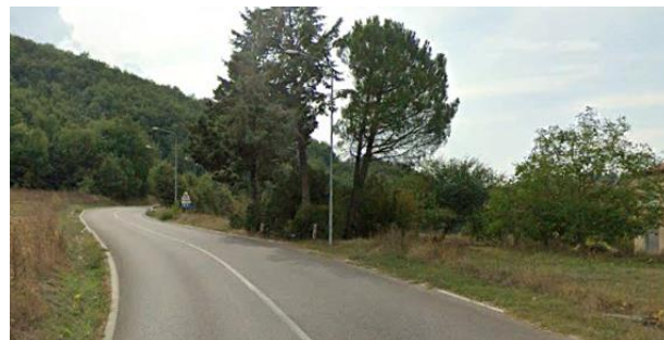
Int. 6.3.1.1+6.3.1.2- S.P.5 tratto nel territorio di Pignola Foto n°2