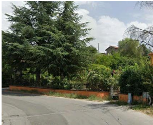
Int. 6.3.3.1+ 6.3.3.2- Strada comunale Pignola-Tintera Foto n°1