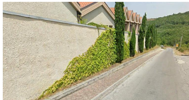
Int. 2.1.5 – Area cimitero Foto n° 2