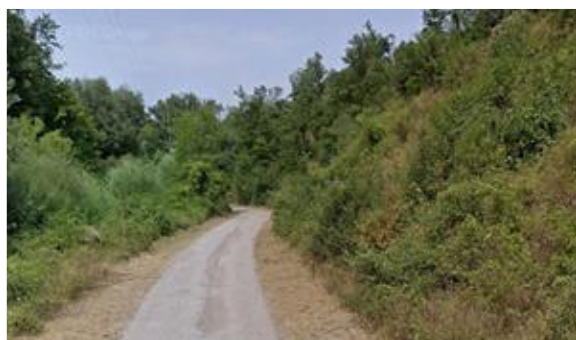
Int. 1.1.2 – 2° tratto fascia antincendio Foto n° 1