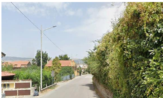
Int. 2.1.2 – frazione Pantano Foto n° 1