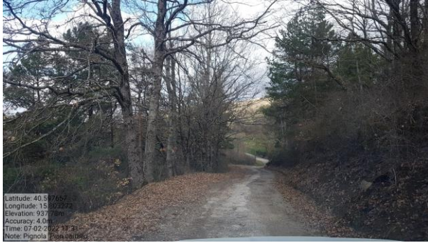
Int.6.3.15.1+6.3.15.2-Strada Via del Vallone Foto n°1