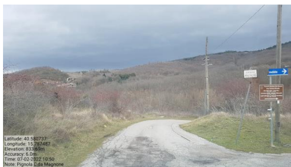
Int. 6.3.2.1+ 6.3.2.2 - Strada C. da Mangone Foto n°1