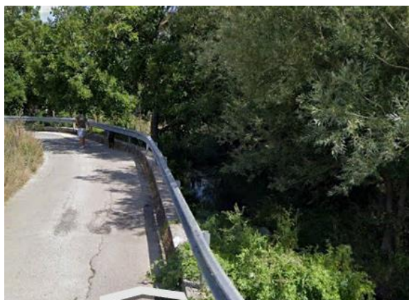
Int. 6.1.2 – Canale tintiera- Pantano alla confluenza con il Basento Foto n° 1