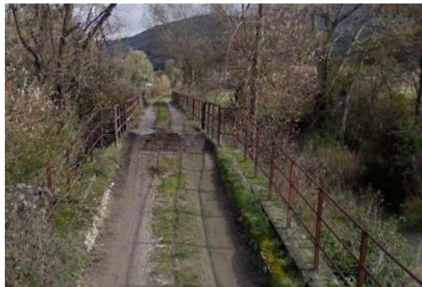
Int. 6.1.1– Fiume Basento Foto n° 2