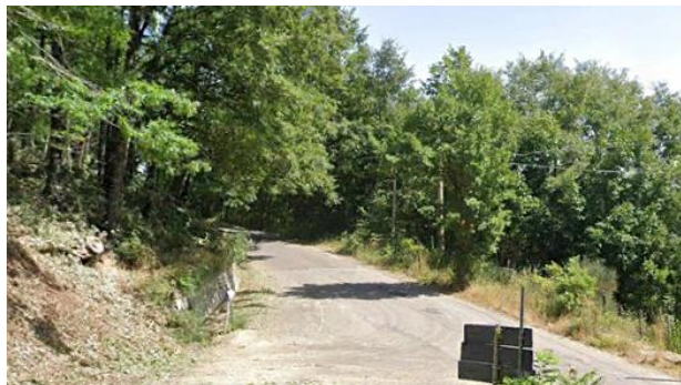
Int. 6.3.9.1+6.3.9.2- Strada frazione Sciffra Foto n°1