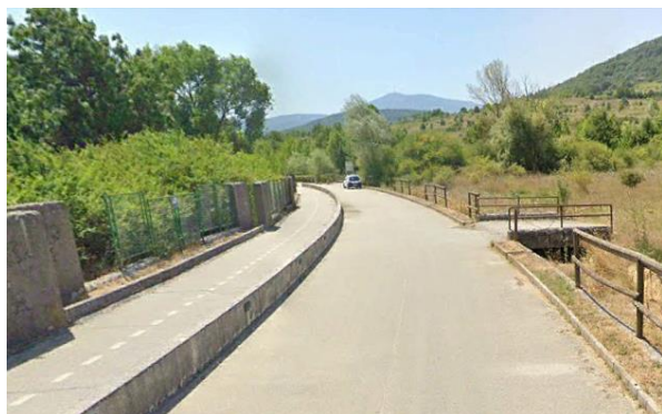
Int.2.1.7+2.2.7-Pista ciclopedonale Pignola-lago Foto n° 1