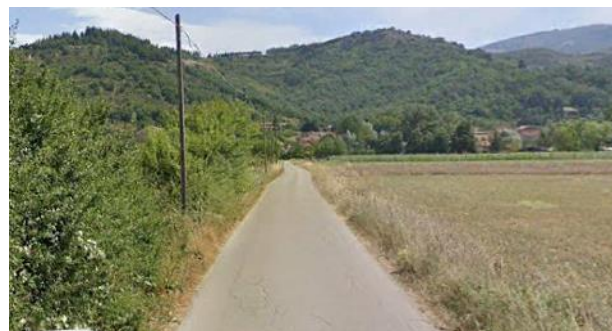
Int. 6.3.7.1+6.3.7.2- Strada vicinale dell’Arciprete Foto n°2