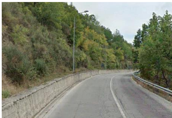
Int. 6.3.1.1+6.3.1.2- S.P.5 tratto nel territorio di Pignola Foto n°1