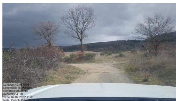
Int. 6.3.2.1+ 6.3.2.2 - Strada C. da Mangone Foto n°2