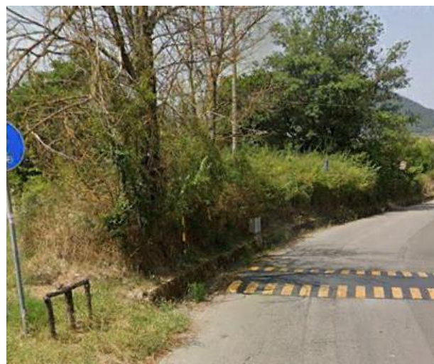
Int. 6.3.3.1+ 6.3.3.2 - Strada comunale Pignola-Tintera Foto n°2