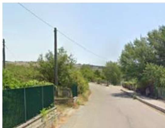
Int. 2.1.6+2.2.6 – Pista perimetrale all'area turistica del lago Pantano Foto n° 2