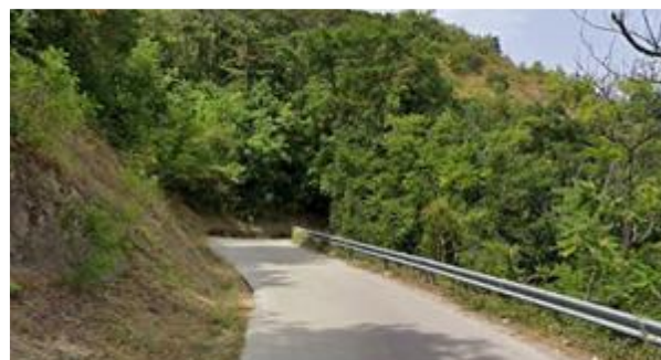
Int. 1.1.1 - 1° tratto fascia antincendio su SP Foto n° 2