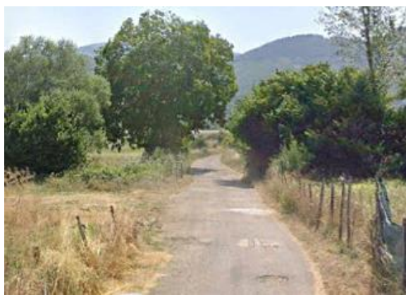
Int. 6.3.8.1+6.3.8.2 - Strada carraro dell’olmo Foto n°1