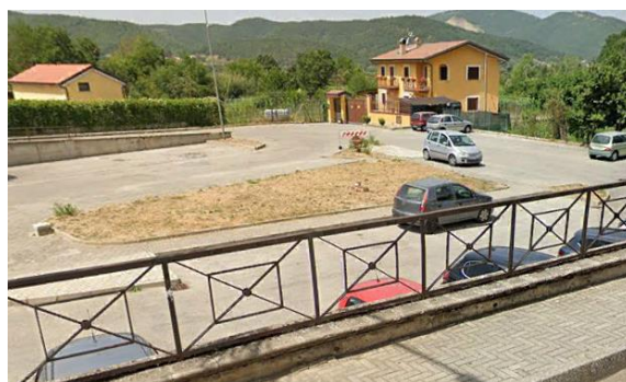
Int. 2.1.2 – frazione Pantano Foto n° 2