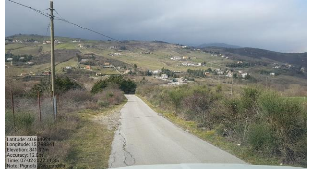
Int. 6.3.15.1+6.3.15.2- Strada Via del Vallone Foto n°2