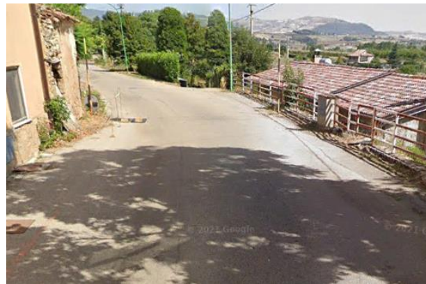
Int. 6.3.9.1+6.3.9.2-Strada frazione Sciffra Foto n°2