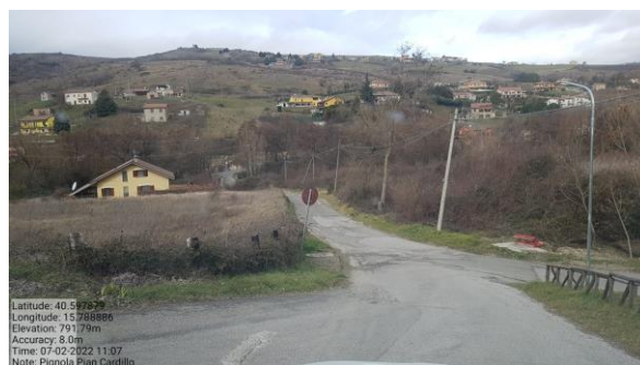
Int 6.3.12.1+6.3.12.2 Strada Pian Cardillo- c. da Magnone Foto n°2