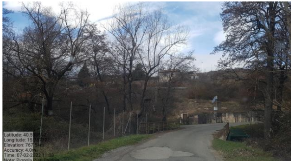
Int. 6.1.1– Fiume Basento Foto n° 1