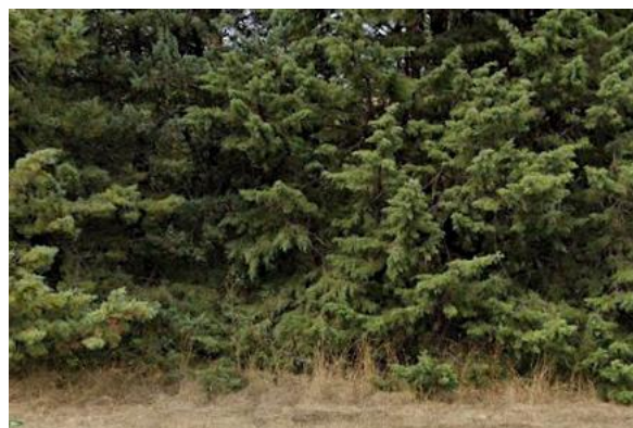
Int. 6.1.2 – Canale tintiera - Pantano alla confluenza con il Basento Foto n° 2