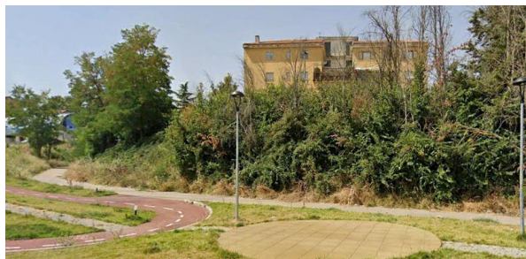
Int. 2.1.1 – centro abitato Foto n° 1