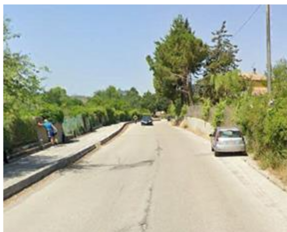
Int. 2.1.6 +2.2.6 – Pista perimetrale all'area turistica del lago Pantano Foto n° 1