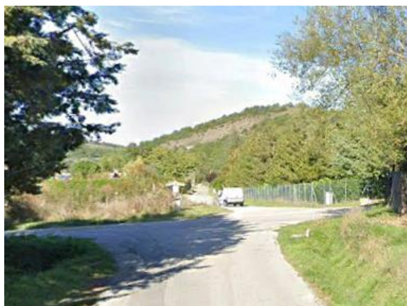
Int. 6.3.6.1+6.3.6.2 Strada Pantano- mulino dei piedi Foto n°1