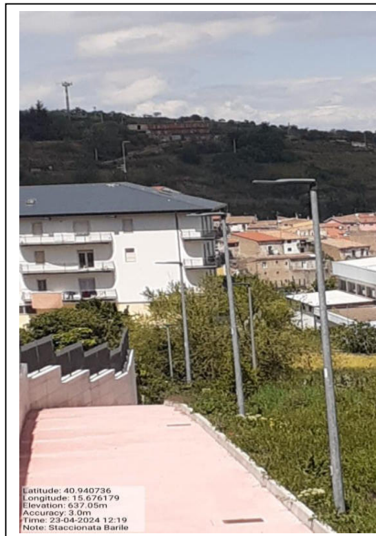
Int. 2.1.4 - Foto 3