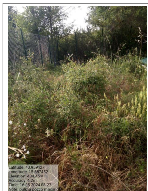
Int. e – 2.1.3 - Foto 4