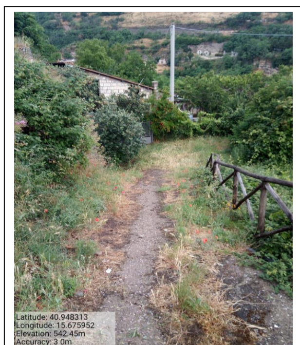
Int. 2.1.1- Foto 6