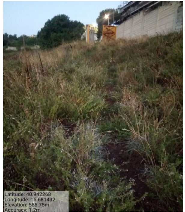
Int. 2.1.2 - Foto 6