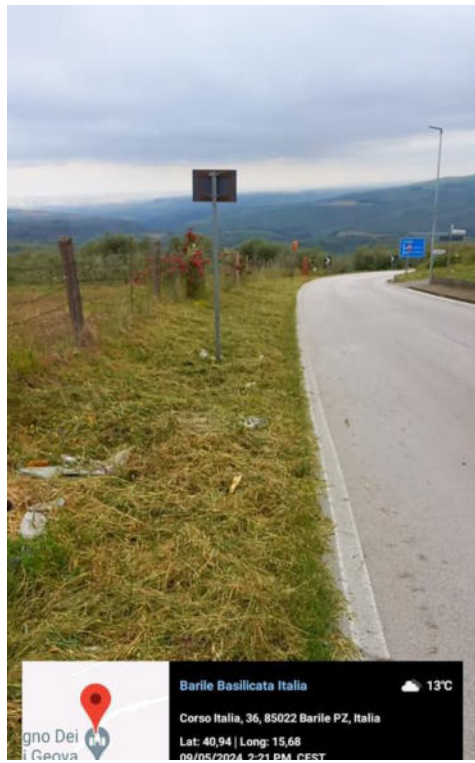
Int. 6.3.1/1 - Foto 5