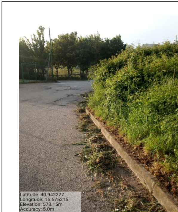
Int. 2.1.1 - Foto 5