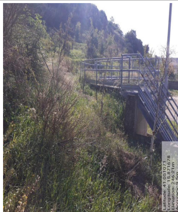
Int. 6.1.7- Foto 3