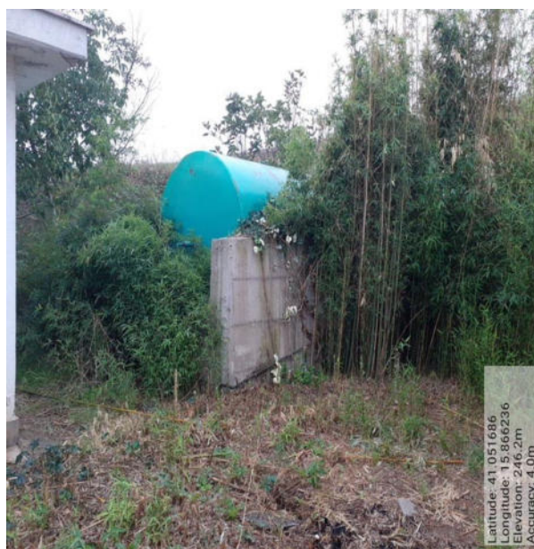
Int. 6.1.7 - Foto1