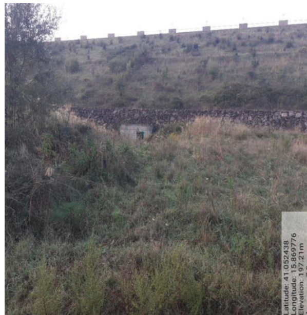
Int. 6.1.7 - Foto 2