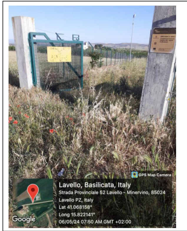
Int. 6.4.2 - Foto 6