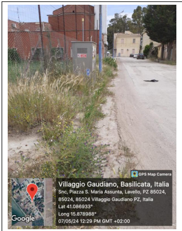
Int. 6.3.3.1- Foto 7