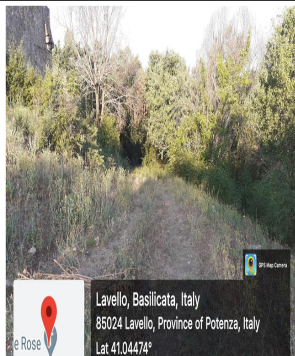
Int. 4.2.1 - Foto 4