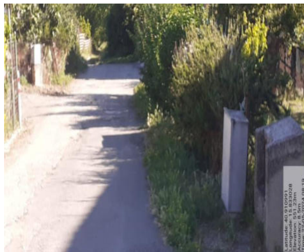
Int. 6.3.1.1/2 - Foto 2