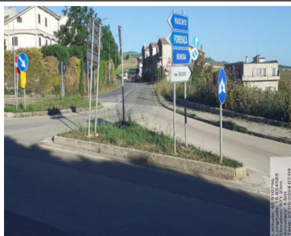
Int. 2.1.1 - Foto 3