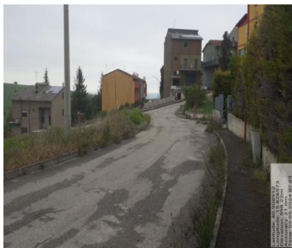
Int. 2.1.1 - Foto1