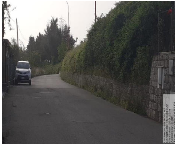
Int. 6.3.1.1 /2- Foto 5