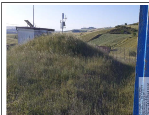
Int. 2.1.1 - Foto 4