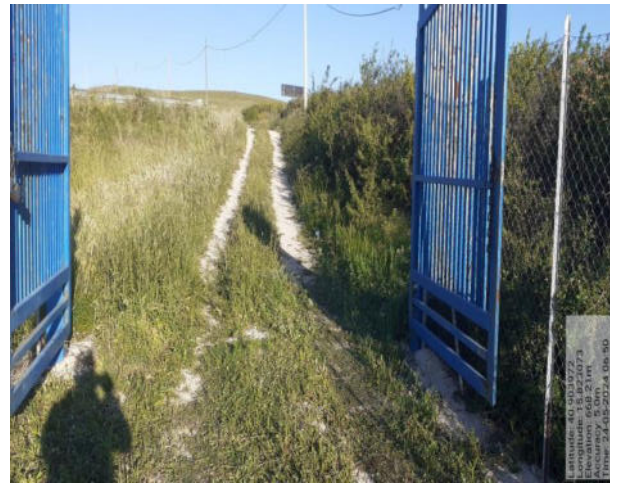
Int. 2.1.2 - Foto 6