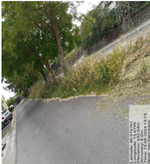
Int. 2.1.1 - Foto1