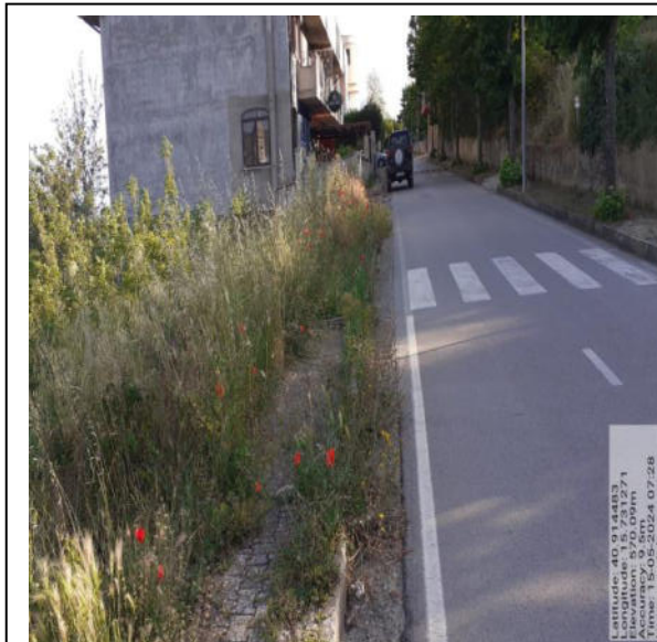
Int. 2.1.1 - Foto 3