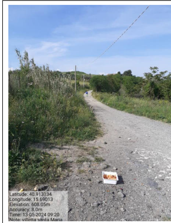
Int. 6.3.i.1/2 - Foto 6