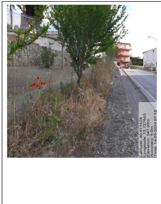
Int. 2.1.1 - Foto 7