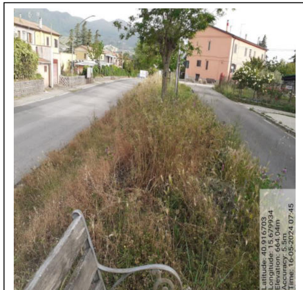
Int. 2.1.1 - Foto 4