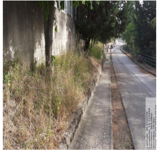
Int. 2.1.1 - Foto 2