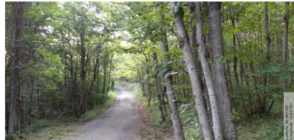
Azione a)4 -Int. 4 - Strada interna al CASTAGNETO