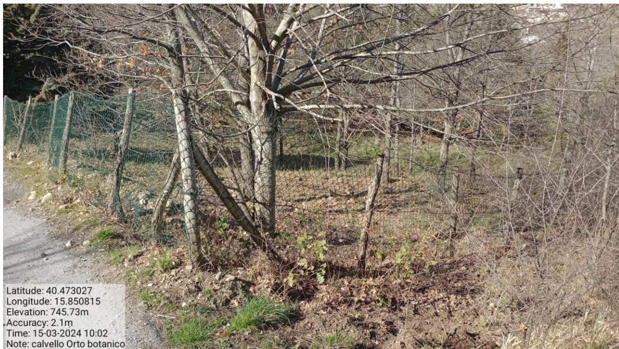
Azione a)2 - Int. 3 - "Orto botanico"