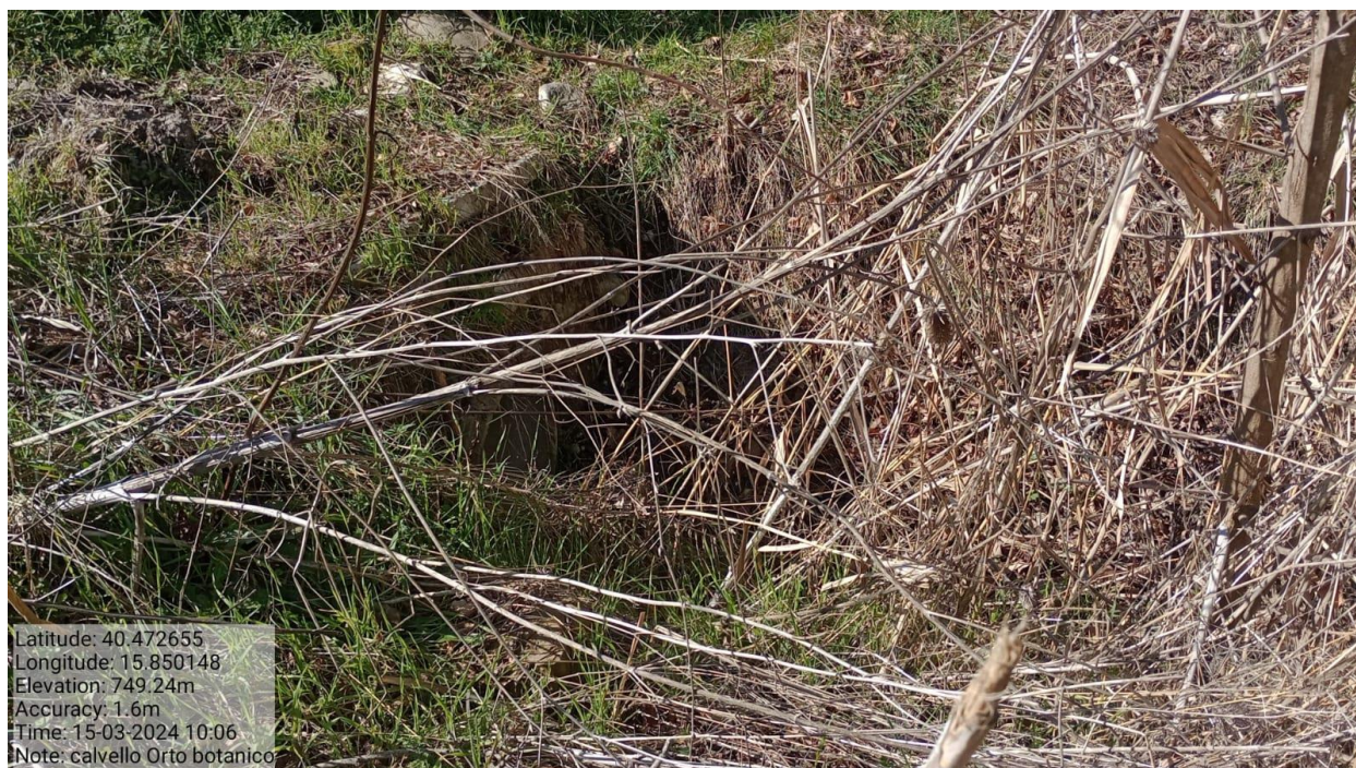
Azione a)2 - Int. 3 - "Orto botanico"