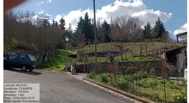
Azione a)4 - Int. 1 - Riapertura strada di fianco "Orto botanico"