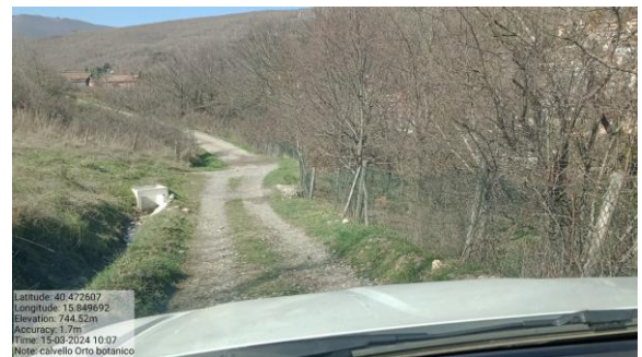
Azione a)4 - Int. 2 - Strda di monte "Orto botanico"