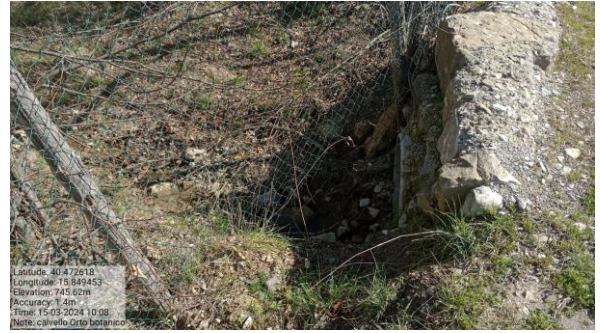
Azione a)4 - Int. 2 - Strda di monte "Orto botanico"