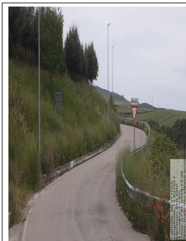
Int. a 4.1.5 - Foto 4