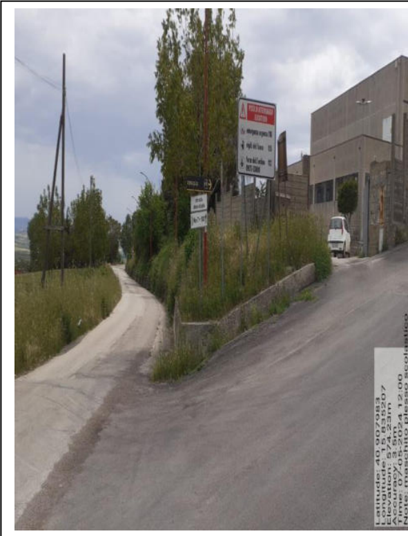
Int. e 2.1 – Foto 7