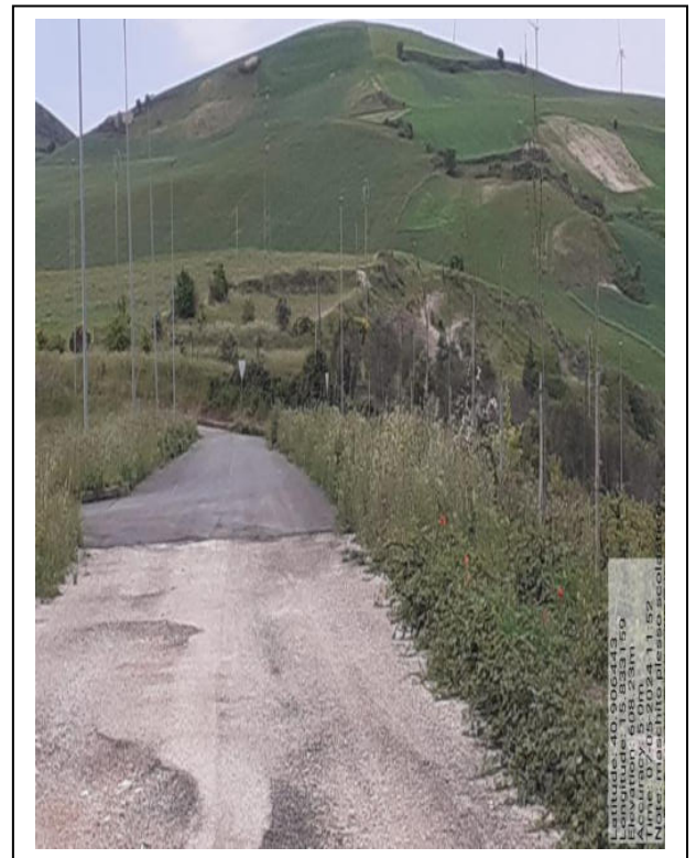
Int. a 4.1.5 - Foto 8