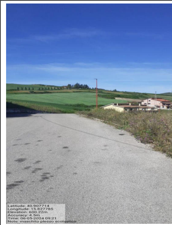
Int. a 4.1.5 - Foto 3