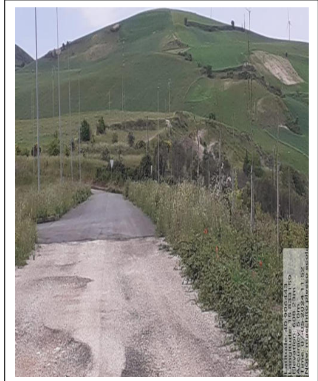
Int. a 4.1.5 Foto 6