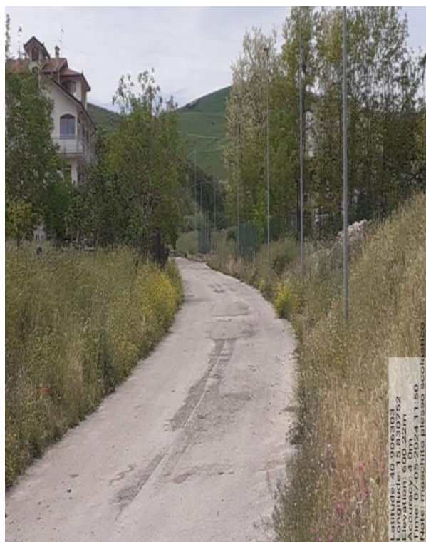
Int. a 4.1.5 - Foto 1