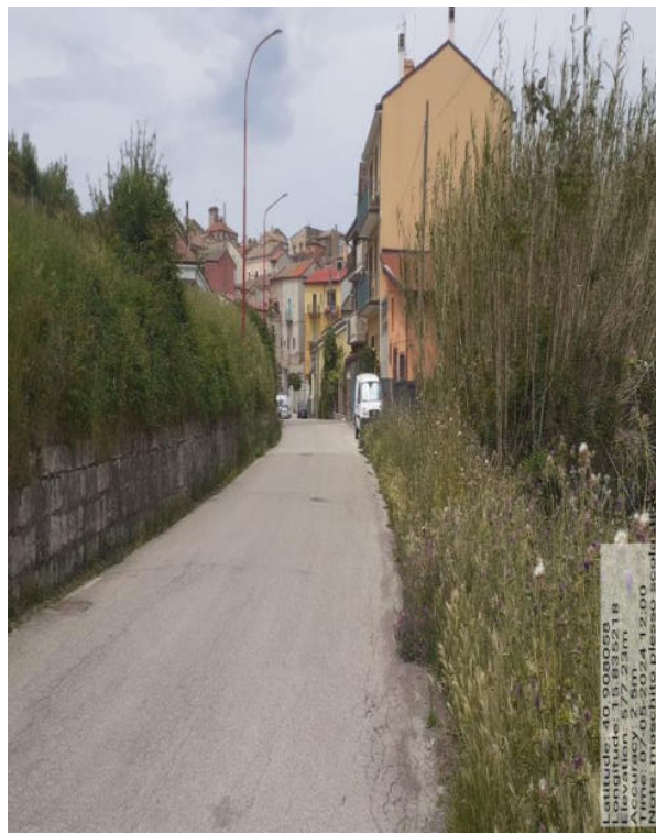
Int. a 4.1.5 - Foto 5